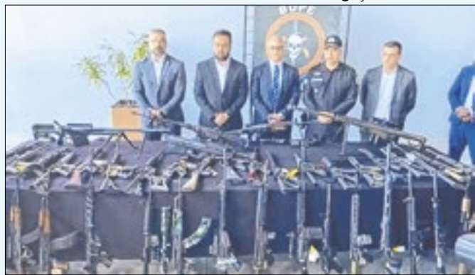
Maioria de apreensões ocorreu em disputas territoriais