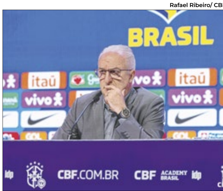
Técnico da Seleção, Dorival Júnior não vem agradando

A entidade não pensa em demitir Dorival imediatamente, mas quer jogos melhores até o fim do ano para mantê-lo em 2025. O Brasil enfrentará Chile e Peru (outubro) e Venezuela e