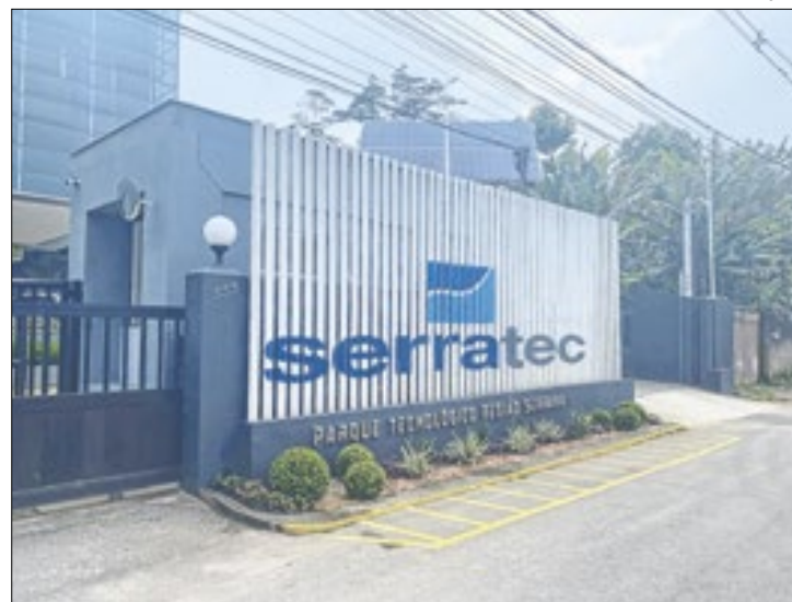
Seleção prioriza moradores de cidades da Região Serrana

práticos e reais trazidos pelas empresas parceiras do Serratec. Esta fase acontecerá de forma híbrida (online e presencial), tem duração de seis meses e início em fevereiro de 2025. Os estudantes selecionados para essa fase ainda receberão bolsa mensal no valor de R$1.260,00 (um mil e duzentos e sessenta reais), para custear seus estudos durante a jornada, além do empréstimo de equipamentos (ambos pelo período de 6 meses).