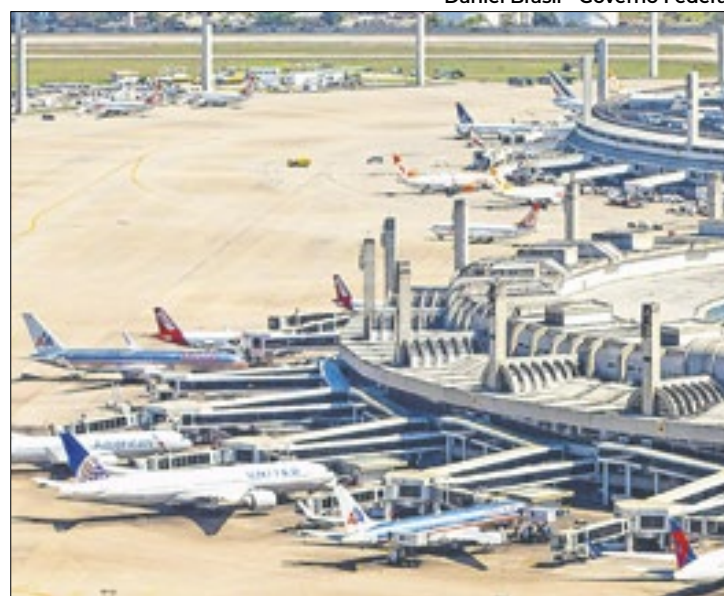
Festival deve elevar, em quatro vezes, movimento aéreo