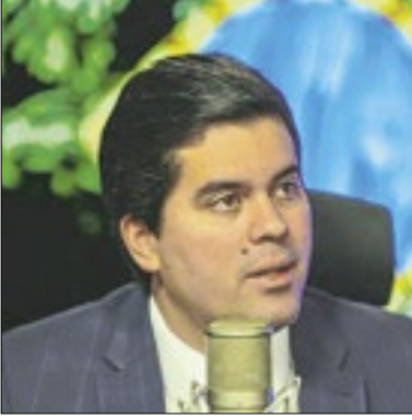
Ministro comentou sobre as bets