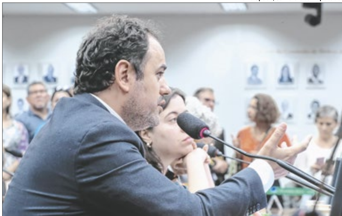
Processo contra Glauber no Conselho de Ética foi aprovado por 10 votos a 2

Na ocasião, o MBL participava de manifestação contra a regulamentação da profissão de motoristas, o Projeto de Lei (PL 12/24). Na ocasião, houve uma discussão entre Costenaro e Glauber Braga. O influencer teria ofendido o deputado. Que revidou com os empurrões e chutes. Em resposta à aprovação do parecer, Costenaro publicou em suas redes sociais que “a justiça está sendo feita”.