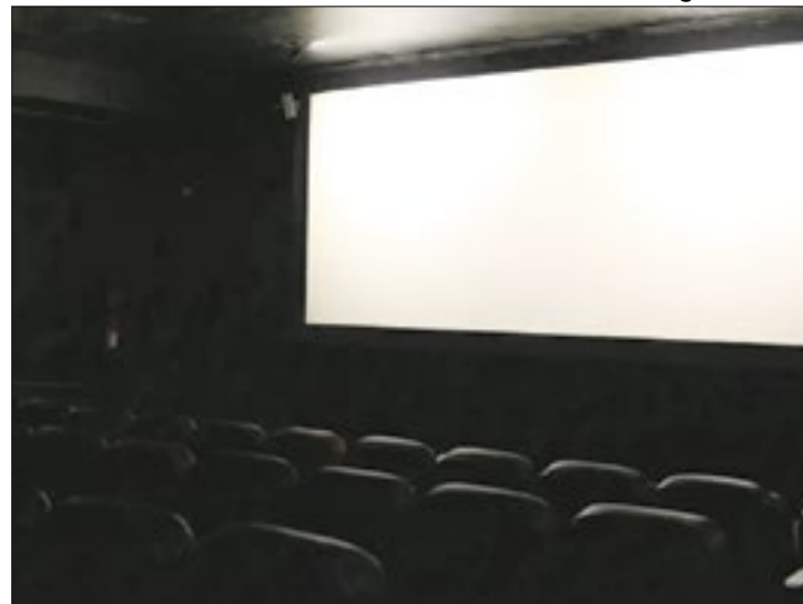
Produções de diferentes temáticas foram selecionadas

A lista dos filmes selecionados para a mostra Circula Serra Cine contempla 24 produções entre videoclipes, longas, mídias e curtas-metragens. Dentre as