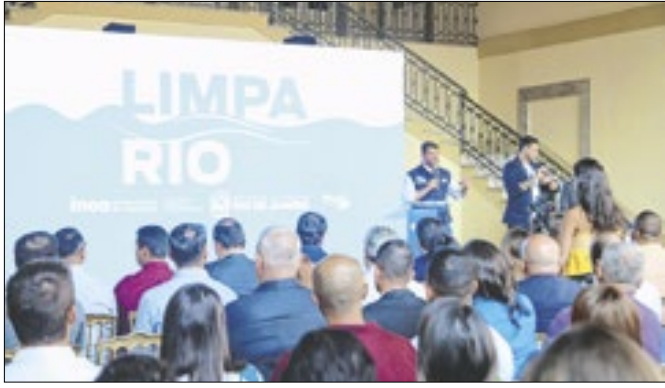
Estado lança Programa Limpa Rio Margens