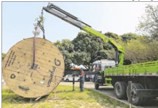
Obra da distribuidora visa atenuar apagões na região