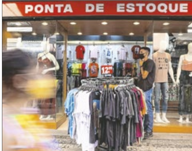
Na passagem de junho para julho, o crescimento foi de 0,6%