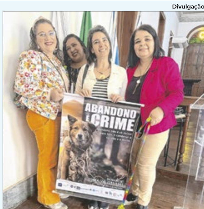
Participantes do encontro da campanha Abandono é crime

que vem tomando medidas para minimizar o problema, colocando em prática um plano de ação estratégico, que inclui o aumento do número de caminhões-pipa e bombas, "além de intensificar a utilização das captações e executar medidas técnicas para garantir o fornecimento de água e minimizar os impactos causados à população pela falta de chuva".