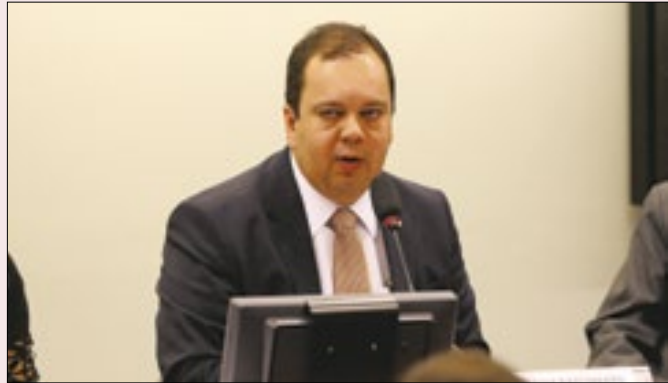
Elmar tenta agora se aproximar do governo