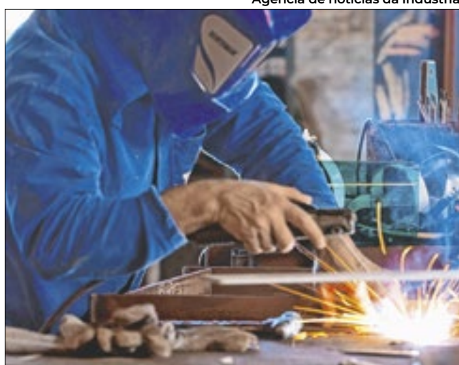
Confiança industrial se mantém em rota de ascensão