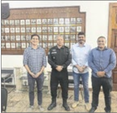
Projetos para Areal

Em Areal o prefeito, se reuniu com o comandante geral da Polícia Militar, para discutir melhorias para segurança pública. Também, foi colocado em pauta, os novos projetos educacionais, com destaque para as iniciativas em nosso