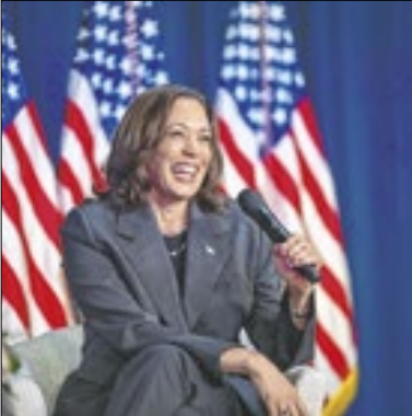
Kamala foi alvo de Fake News

na terça (10) com o republicano, que foi criticado por seu mau desempenho no evento. A fake news se espalhou rapidamente na rede social X. Uma das pessoas que ajudaram a difundir a mentira foi a ativista de extrema direita Laura Loomer.