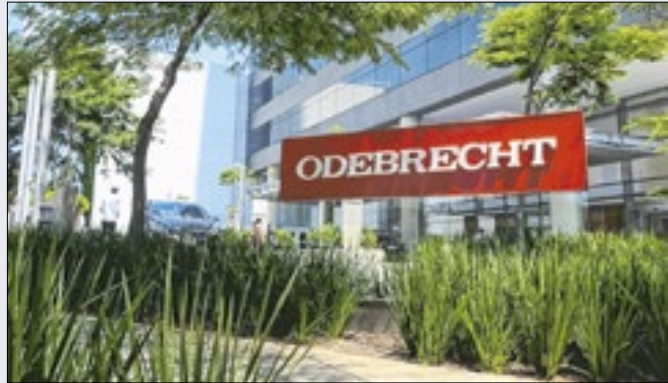
Alvo da Lava Jato, empresa pede recuperação judicial