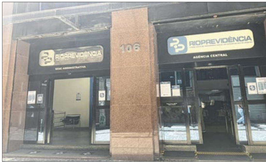
Recenseamento pode ser feito em uma das agências

um entendimento mais profundo e abrangente das maiores cidades do país. O estudo também pretende ser uma ferramenta simples e objetiva capaz de pautar a atuação de lideranças públicas para a melhoria da competitividade e da gestão pública local.