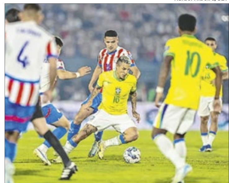
Paraguai x Brasil pela Eliminatória Sul-Americana 2022