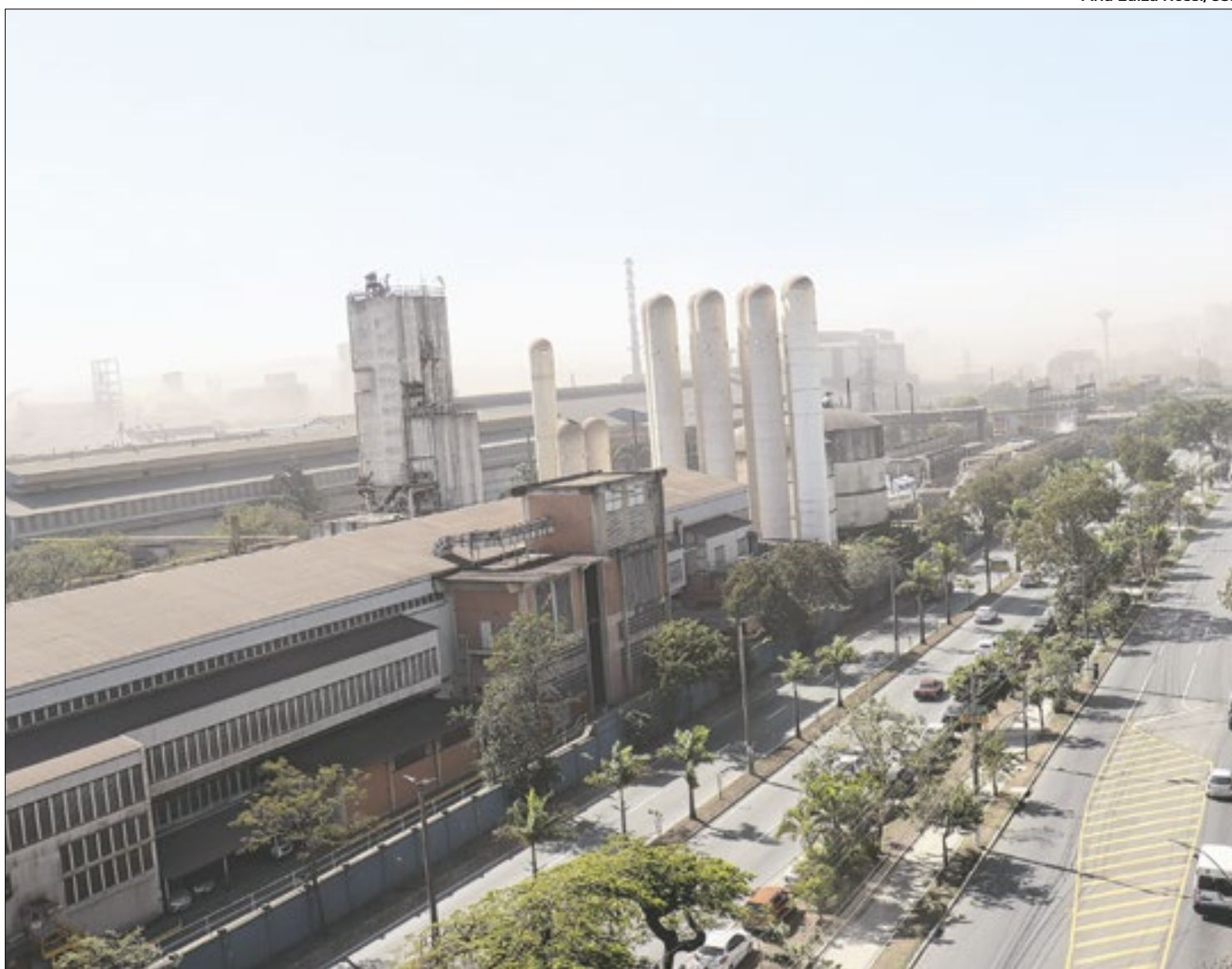
CSN consegue prorrogação de acordo para cumprir medidas ambientais em Volta Redonda-RJ, onde tem uma usina

A discussão sobre o TAC foi intensificada desde o ano passado, quando a população foi às ruas protestar contra a poluição emitida pela empresa.