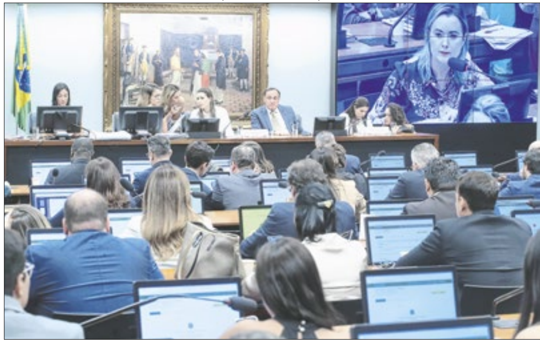
CCJ agora só analisará projetos depois de 8 de outubro

Em suas redes sociais, ela compartilhou um vídeo destacando que o tema será tratado como prioridade com o retorno dos trabalhos da Câmara e que tem a expectativa de que o projeto seja votado no plenário da Casa ainda neste ano. “Nós temos esse compromisso com as famílias [dos presos envolvidos nos atos]. Esse tema tem a nossa prioridade”, completou.