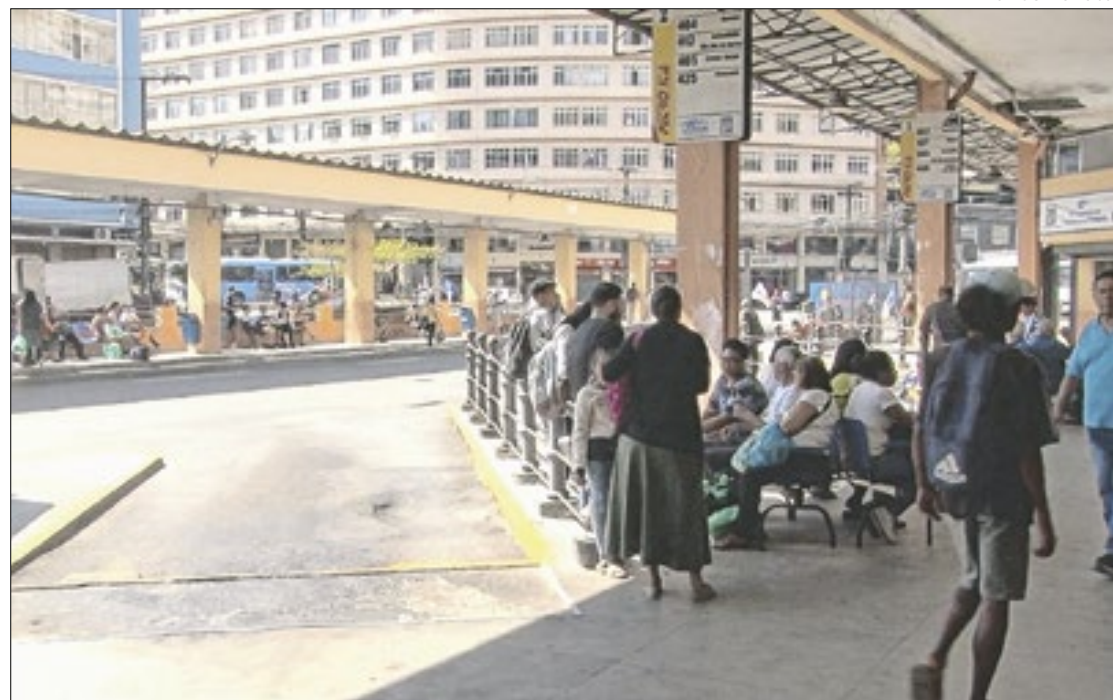
Com menos ônibus na zona sul se tornou comum ver as baias do Terminal vazias

A Prefeitura de Petrópolis publicou, no sábado (07), um decreto que obriga a empresa