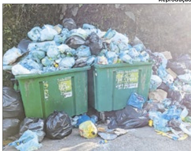
Registro da Rua Fagundes Varela, no bairro Duchas