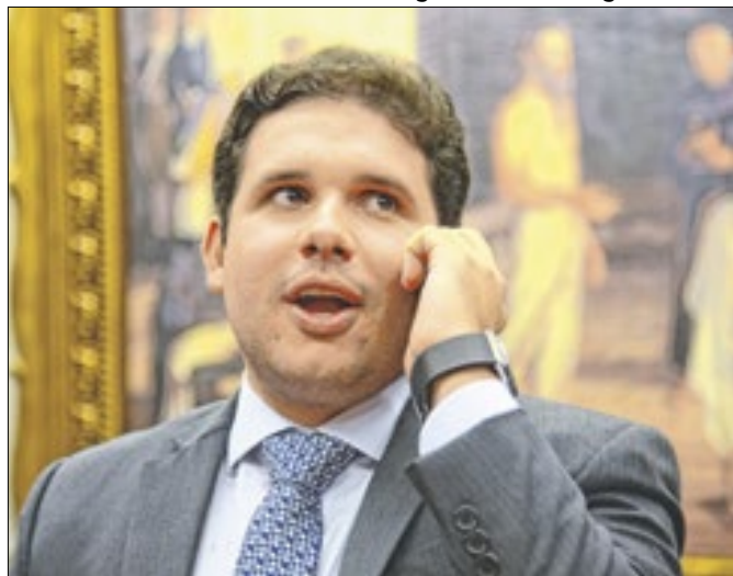
Compromissos de Motta podem virar armadilha