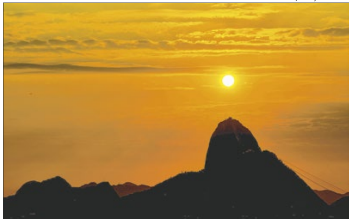
Entidades meteorológicas preveem condições climáticas severas nos próximos dias

Segundo o sistema de monitoramento atmosférico do município do Rio, o ar com