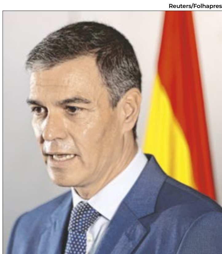
Pedro Sánchez não vai reconhecer González como presidente

o líder opositorista como presidente legítimo da Venezuela começou a ser debatida terça (10) à tarde, quando centenas de manifestantes protestavam contra Maduro em frente ao Congresso espanhol.