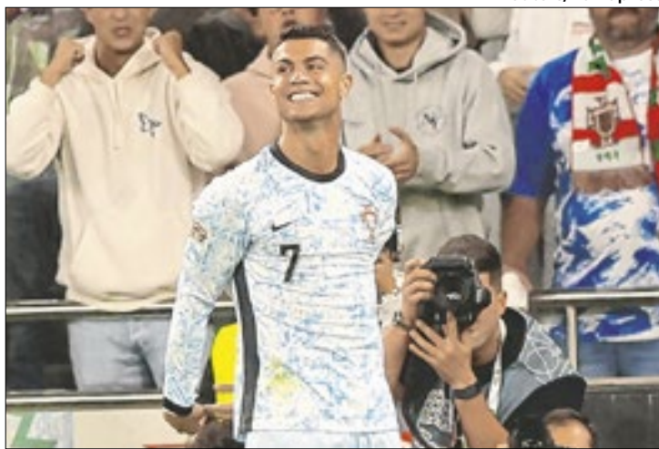
Cristiano não crê que Vini Jr. será o melhor do mundo em 2024

Vencedor de cinco Bolas de Ouro, Cristiano Ronaldo elegeu os favoritos a ganharem o prêmio pelos próximos anos. "Acho que o Mbappé pode ser o ganhador da Bola de Ouro pelos próximos anos. Provavelmente ele (Mbappé), Haaland, Bellingham e Lamine (Yamal)".