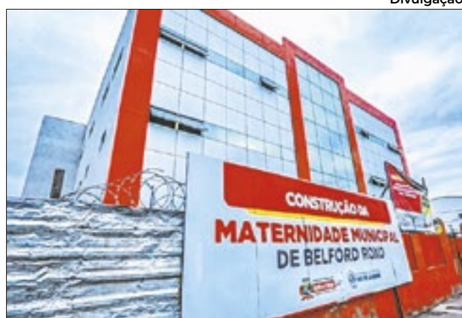
Belford Roxo avança com obras da Maternidade Municipal