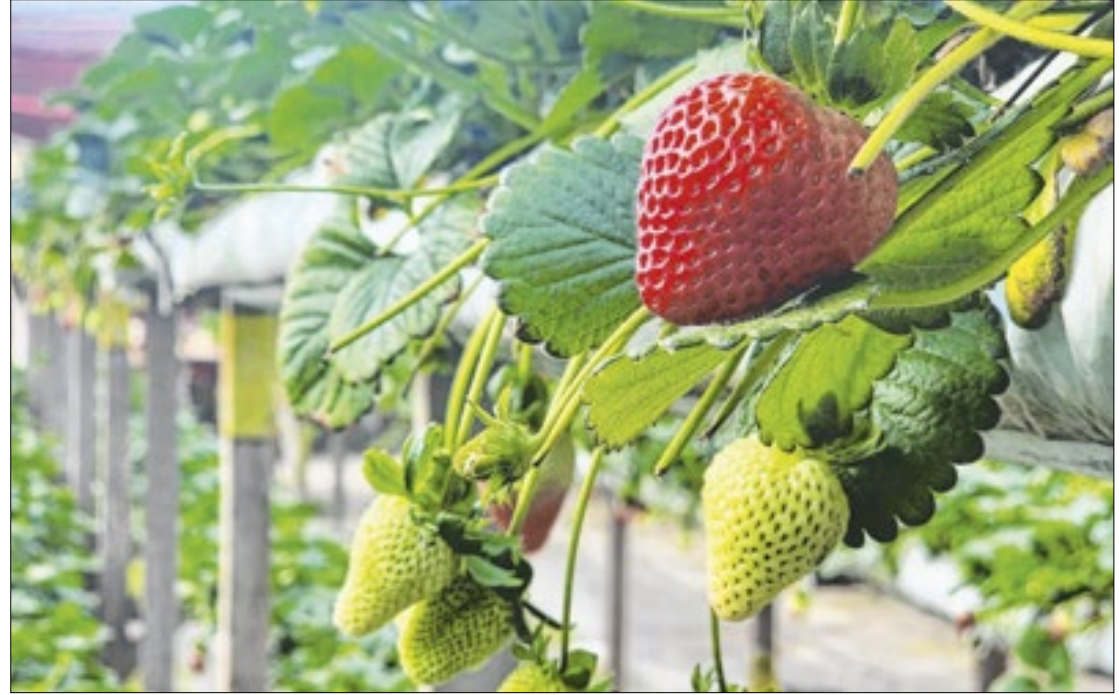
Consagrado festival acontece no mês de outubro e promete movimentar Região Serrana

Em um espaço anexo ao festival, acontece a tradicional Festa da Flor de Nova Friburgo, considerado o segundo maior produtor de flores de corte do Brasil. Estarão à venda flores como Astromelia, Crisântemo,