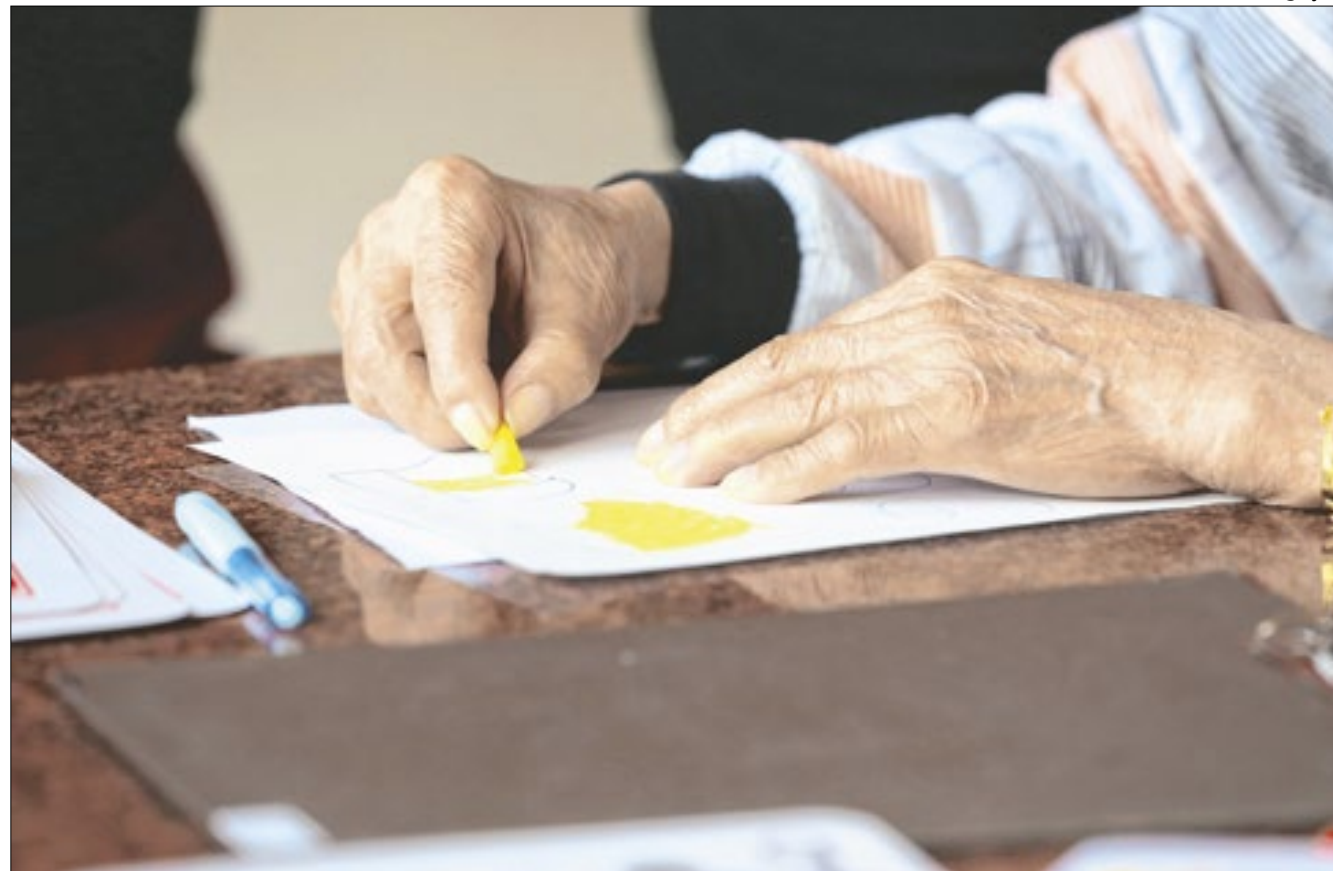
Pesquisadores da Universidade do Mississippi observaram mais de 11 mil voluntários por 26 anos

Ao final do estudo, os autores constataram que aderir a ações posi-