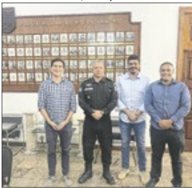
Projetos para Areal

Em Areal o prefeito, se reuniu com o comandante geral da Polícia Militar, para discutir melhorias para segurança pública. Também, foi colocado em pauta, os novos projetos educacionais, com destaque para as iniciativas em nosso