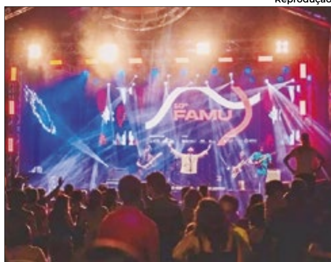
Circuito Anapolino oferece R$ 130 mil em prêmios

Número de ocorrências cresceu até agosto de 2024