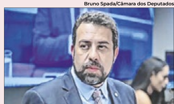
Candidato do Psol: risco de ficar fora da decisão

Além disso, o ministro do Desenvolvimento e Assistência Social, Família e Combate à Fome, Wellington Dias, anunciou que o pagamento do Bolsa Família será antecipado para o dia 17 de setembro, beneficiando os afetados pela seca no Amazonas. “A Caixa Econômica Federal já vai estar disponibilizando R$ 494 milhões a serem pagos a 656 mil famílias em todo o estado do Amazonas”, iniciou “É um dinheiro que circula na economia em um momento de grande necessidade”, afirmou o ministro.