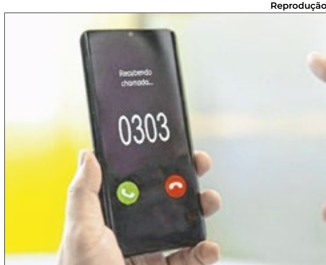
Regras entram em vigor no dia 5 de janeiro

Número supera total notificado ao longo de todo o ano passado