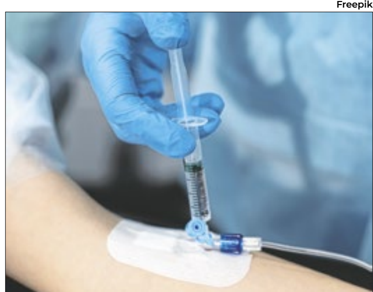
Dado da Associação Brasileira de Medicina de Emergência

Em nota, a entidade lembrou que, nesse tipo de circunstância, médicos de emergência são, geralmente, os primeiros a prestar atendimento ao paciente. Para a associação, o aumento de internações por tentativas de suicídio e autolesões reforça a importância de capacitar esses profissionais para atender aos casos com rapidez e eficiência, além de promover acolhimento adequado em situações de grande fragilidade emocional.