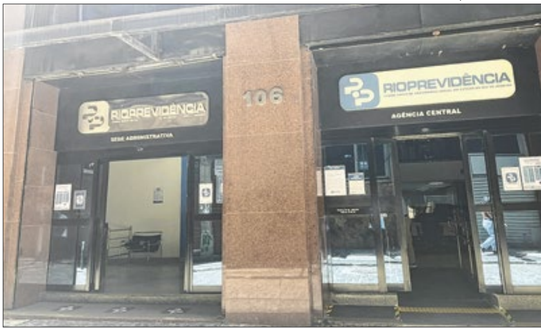
Recenseamento pode ser feito em uma das agências

um entendimento mais profundo e abrangente das maiores cidades do país. O estudo também pretende ser uma ferramenta simples e objetiva capaz de pautar a atuação de lideranças públicas para a melhoria da competitividade e da gestão pública local.