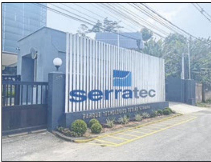
Seleção prioriza moradores de cidades da Região Serrana

práticos e reais trazidos pelas empresas parceiras do Serratec. Esta fase acontecerá de forma híbrida (online e presencial), tem duração de seis meses e início em fevereiro de 2025. Os estudantes selecionados para essa fase ainda receberão bolsa mensal no valor de R$1.260,00 (um mil e duzentos e sessenta reais), para custear seus estudos durante a jornada, além do empréstimo de equipamentos (ambos pelo período de 6 meses).