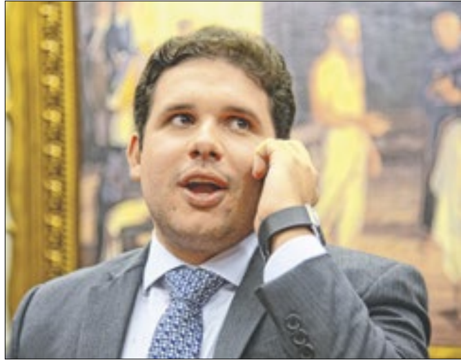
Compromissos de Motta podem virar armadilha