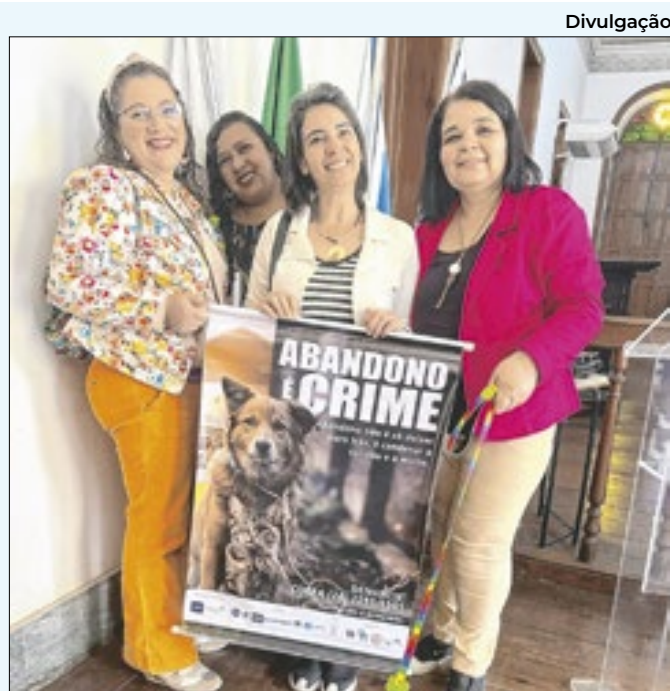
Participantes do encontro da campanha Abandono é crime

que vem tomando medidas para minimizar o problema, colocando em prática um plano de ação estratégico, que inclui o aumento do número de caminhões-pipa e bombas, "além de intensificar a utilização das captações e executar medidas técnicas para garantir o fornecimento de água e minimizar os impactos causados à população pela falta de chuva".