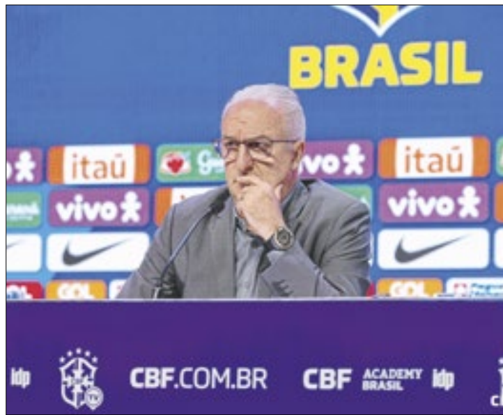
Técnico da Seleção, Dorival Júnior não vem agradando

A entidade não pensa em demitir Dorival imediatamente, mas quer jogos melhores até o fim do ano para mantê-lo em 2025. O Brasil enfrentará Chile e Peru (outubro) e Venezuela e