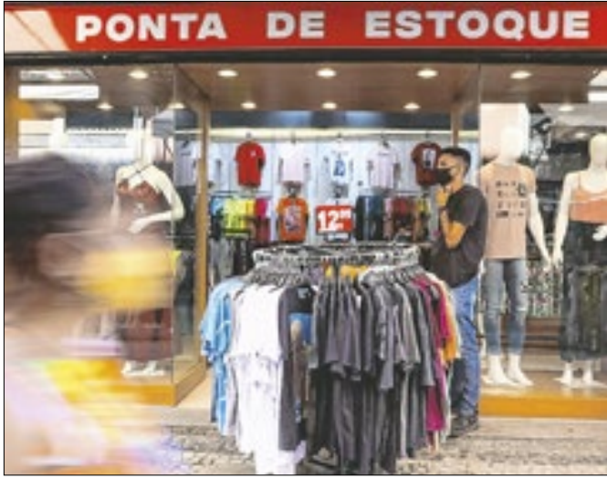
Na passagem de junho para julho, o crescimento foi de 0,6%