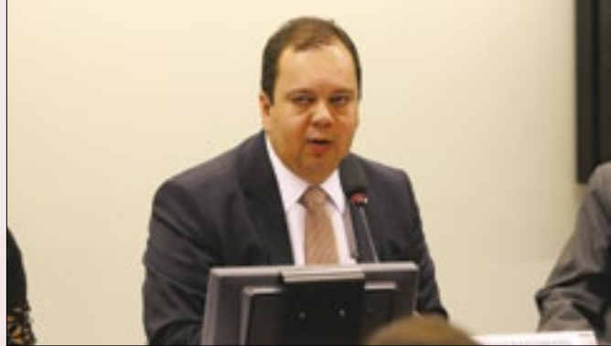
Elmar tenta agora se aproximar do governo