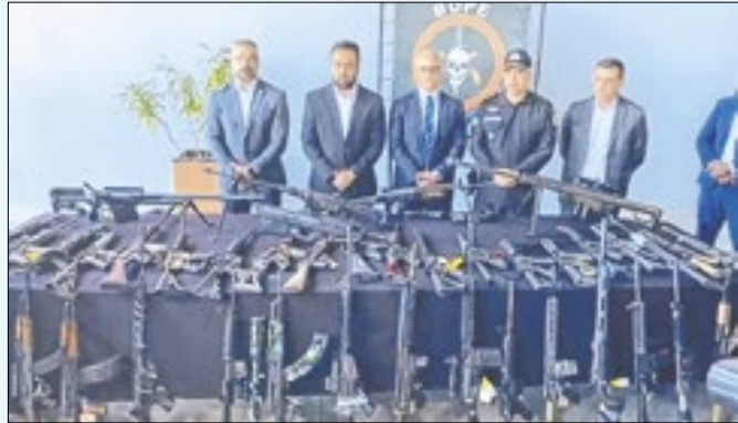
Maioria de apreensões ocorreu em disputas territoriais