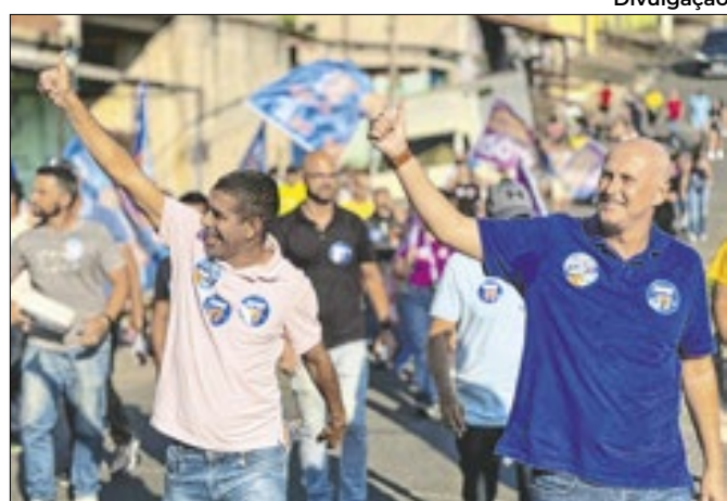
Tande: 'O carinho que recebemos nas ruas nos motiva'