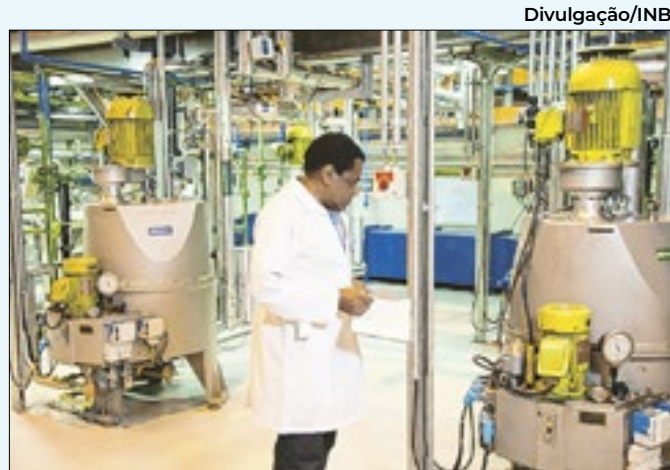
Profissionais da INB irão para campanha nos EUA

e 05 de setembro deste ano e ouviu 600 moradores de Resende, sul do Estado do Rio de Janeiro. A margem de erro da pesquisa é de 4,08 pontos percentuais para mais ou para menos.