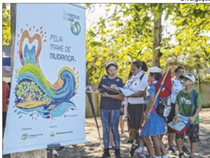
Atividade integra mobilização para retirada de resíduos

A poluição ambiental está crescendo em números alarmantes. De acordo com dados do Banco Mundial, a geração global de resíduos aumentará em 70% nos próximos 30 anos. Diante deste cenário desolador, pessoas em todo o mundo estão se unindo em prol de um futuro melhor para o planeta. Graças a essa união, surgiu o Dia Mundial de Limpeza de Rios e Praias (Clean Up Day), que terá mais uma edição neste mês de setembro. Em Itaguaí e Magé, dezenas de voluntários se unirão ao Projeto Do Manguê ao Mar — realizado pela ONG Guardiões do Mar, em convênio com a Transpetro — para uma grande ação de limpeza nas praias de Coroa Grande e Porto Velho (Piedade), respectivamente, no dia 21, às 9h. O objetivo é sensibilizar a população para esse movimento solidário e de reflexão por um ambiente mais limpo e saudável.