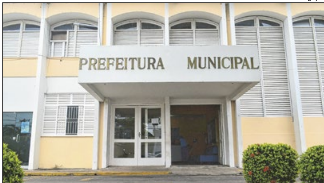
MPRJ executa TAC contra o município de Mendes e pede contratação de concursados

O TAC previa que, diante da necessidade do serviço identificada pelo excessivo volume de contratados e comissionados, deveria o prefeito remeter projeto de lei ao Legislativo municipal para readequar as carreiras, fazendo com que o superdimensionado número de contratados fosse substituído por servidores efetivos.