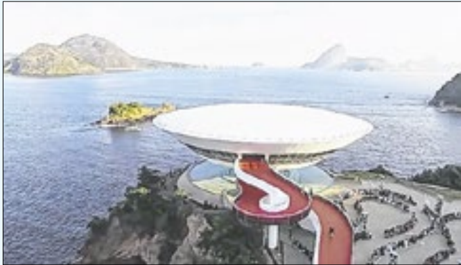
Município subiu 43 posições no estudo