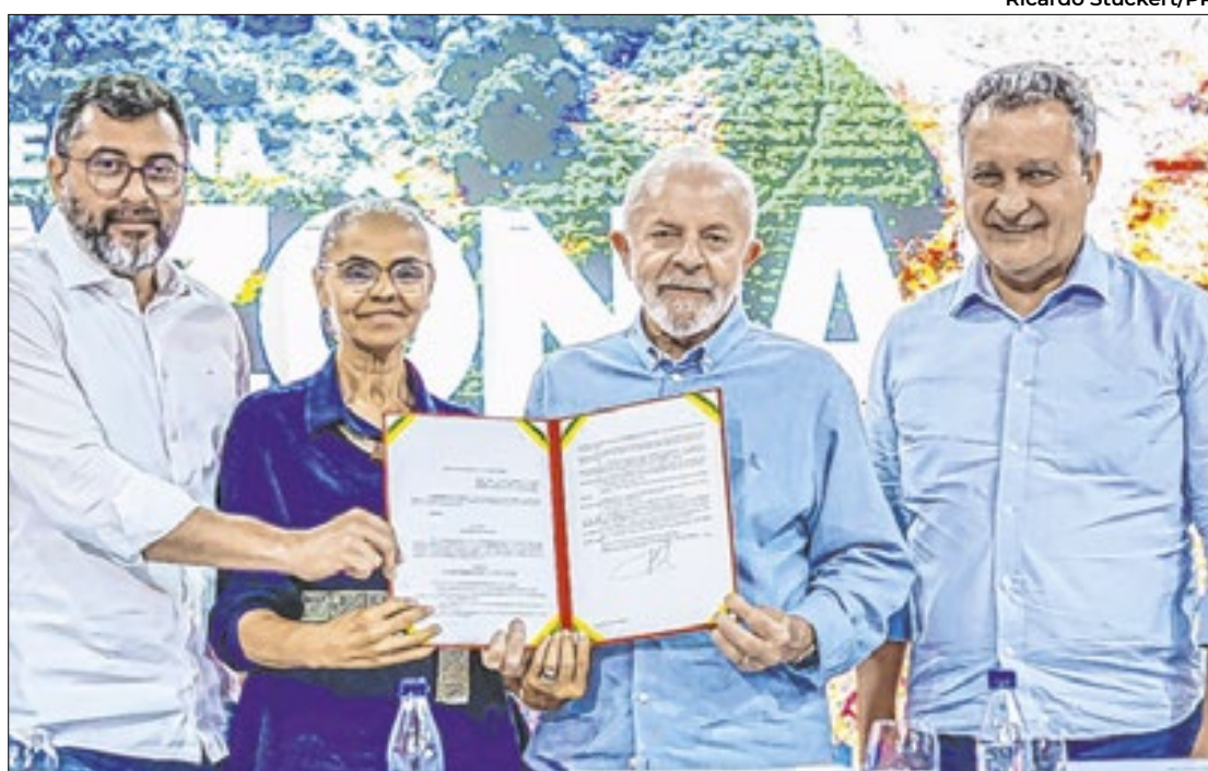
Autoridade climática é resposta à crise ambiental

A ideia de criar uma autoridade climática para lidar com as crises ambientais já havia surgido antes mesmo da posse de Lula, como ideia da sua equipe de transição. Na época, chegou-se a cogitar mesmo que Marina Silva fosse essa autoridade climática,