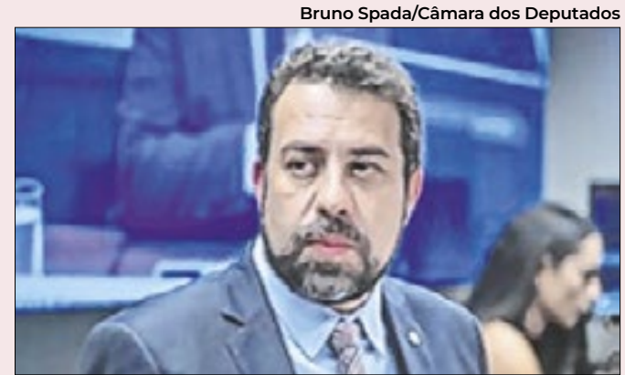
Candidato do Psol: risco de ficar fora da decisão

Além disso, o ministro do Desenvolvimento e Assistência Social, Família e Combate à Fome, Wellington Dias, anunciou que o pagamento do Bolsa Família será antecipado para o dia 17 de setembro, beneficiando os afetados pela seca no Amazonas. “A Caixa Econômica Federal já vai estar disponibilizando R$ 494 milhões a serem pagos a 656 mil famílias em todo o estado do Amazonas”, iniciou “É um dinheiro que circula na economia em um momento de grande necessidade”, afirmou o ministro.