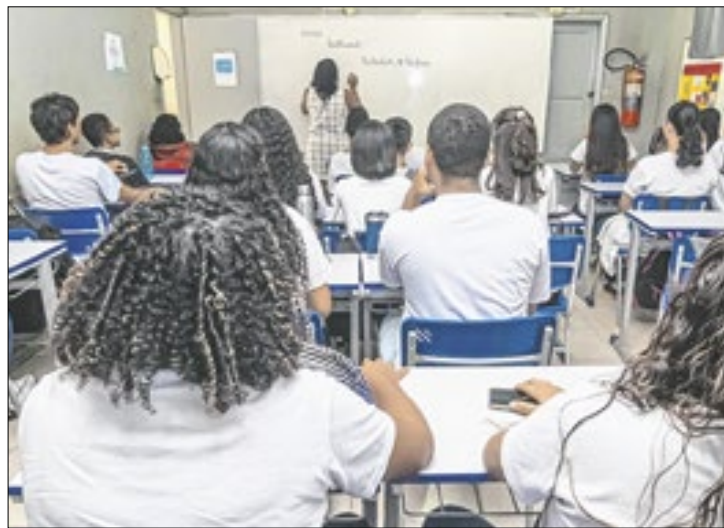
Mais de 300 aprovados foram chamados este ano