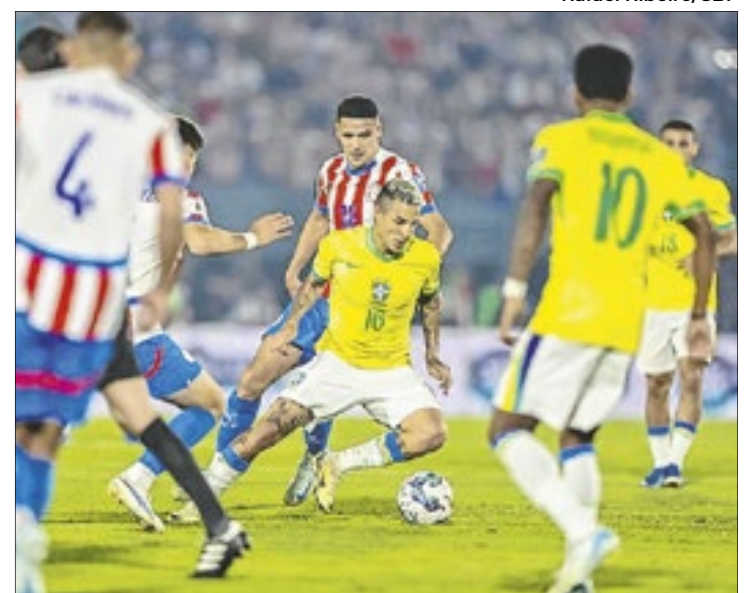
Paraguai x Brasil pela Eliminatória Sul-Americana 2026