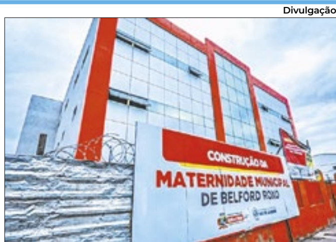
Belford Roxo avança com obras da Maternidade Municipal