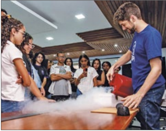
Parceria proporciona que estudantes visitem laboratórios