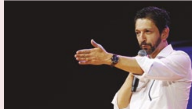
Esquerda no alvo do prefeito paulistano