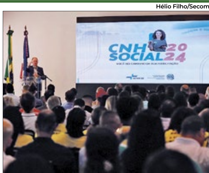
Governador Renato Casagrande durante a cerimônia