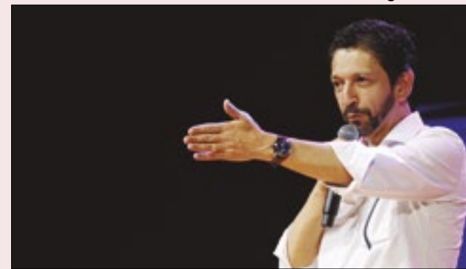
Esquerda no alvo do prefeito paulistano