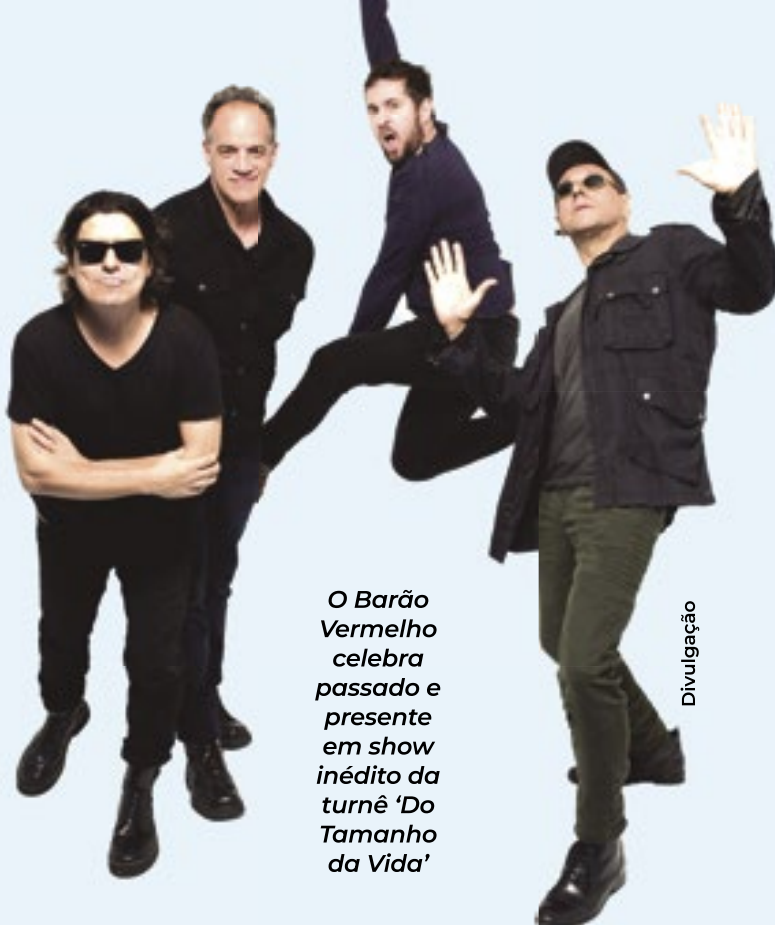
O Barão Vermelho celebra passado e presente em show inédito da turnê 'Do Tamanho da Vida'