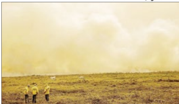
O fogo afetou aldeias e destruiu lavouras em Mato Grosso