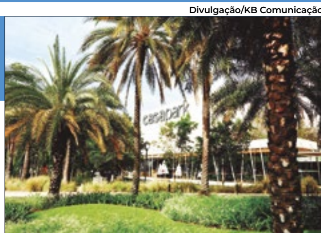
O evento premia os arquitetos, os designers de interiores e os lojistas mais integrados

Na questão de pessoal, além de concluir no mês passado um concurso público em que foram ofertadas 120 vagas imediatas e outras 360 para cadastro reserva, para 17 cargos distintos – e que atraiu quase 52 mil interessados –, ele realizou três rodadas de PDVs (programa de desligamento voluntário), que abarcou mais de 1.000 pessoas.