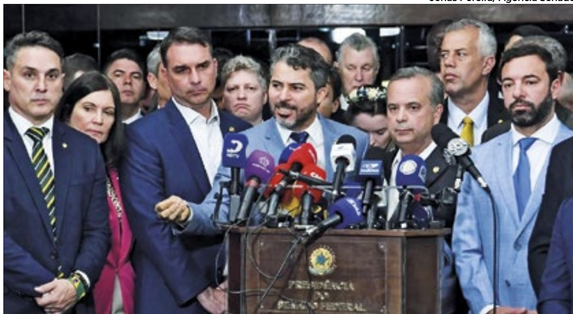
Jonas Pereira/ Agência Senado