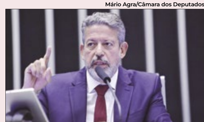
Mário Agra/Câmara dos Deputados

“Boulos sai fortalecido, mas numa posição que vai demandar dele muita sabedoria política para conseguir se equilibrar”, analisou Jordão.