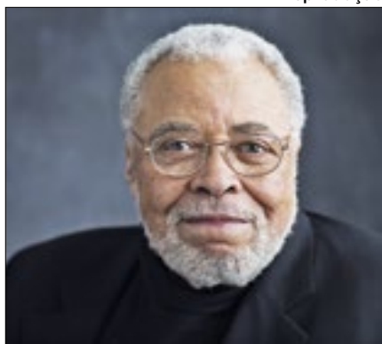
James Earl Jones morreu aos 93 anos

Conhecido por dar voz a personagens famosos como Mufasa, de "O Rei Leão", e Darth Vader, grande vilão da saga "Star Wars", o ator James Earl Jones faleceu aos 93 anos.