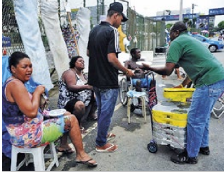
Número de ocupados cresce, mas há milhões sem renda

era, ainda, maior, com 23,9% dos lares não possuíam ganhos provenientes de um emprego.