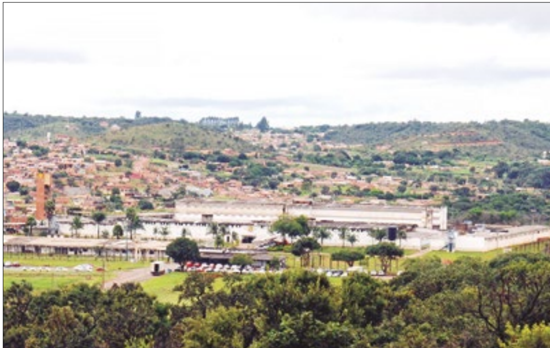
Papuda: maior taxa de analfabetismo carcerário do país