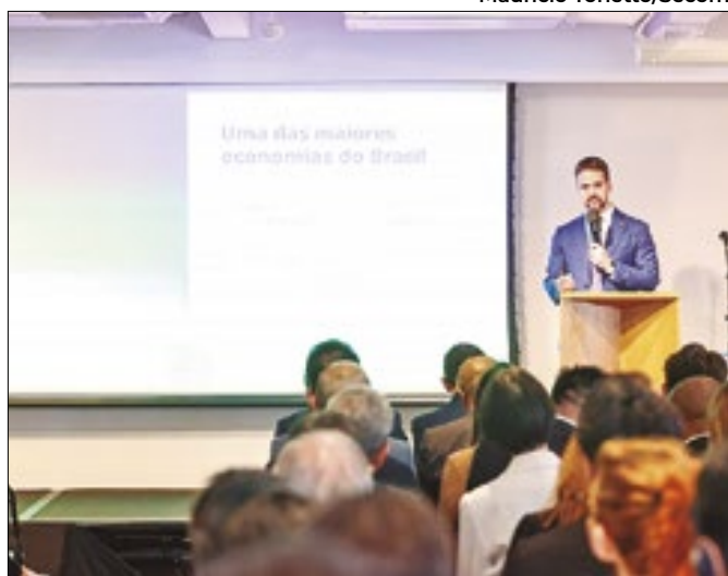
Leite apresentou a carteira de projetos do governo