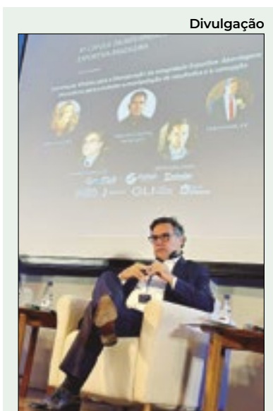
Na última quinta-feira, 5 de setembro, foi realizada a Terceira Cúpula de Integridade Esportiva, no Museu de Futebol, em São Paulo. Entre os participantes, o ex-procurador-geral de Justiça do Rio, Eduardo Gussem (foto), oficial de integridade da Confederação Brasileira de Futebol (CBF)