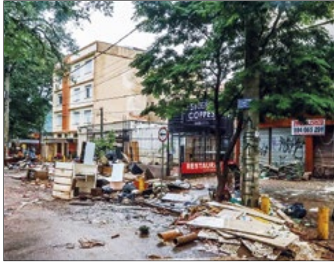
Socorro emergencial do BNDES foi vital para o RS