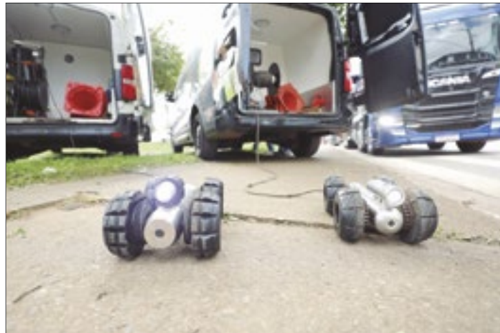
Robôs de vídeoinspeção usados no diagnóstico e manutenção das galerias de águas pluviais do DF

trazer. Por isso, a necessidade de resgatar a gênese da empresa”, disse o presidente.