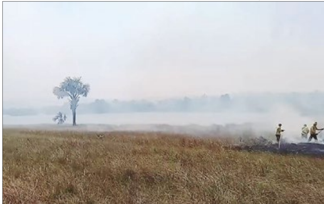
Queimadas na Lagoa da Serra, um dos pontos turísticos das Serras Gerais

Além disso, o secretário de Estado do Meio Ambiente e