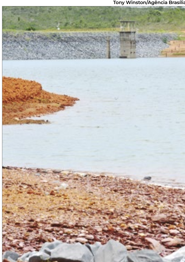
Tempo seco e falta de chuvas reduzem volume de água

A agência enfatiza a necessidade de uma postura consciente e responsável por parte das instituições, órgãos de governo, setores produtivos e da população no uso da água. Medidas de prevenção são importantes para evitar uma crise hídrica mais grave.