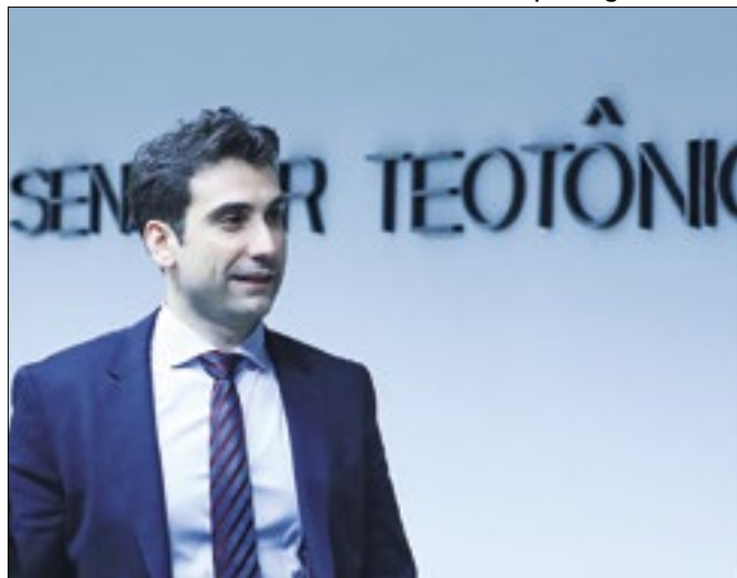
Galípolo corre gabinetes antes da sabatina