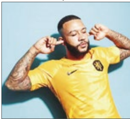
Depay é o camisa 10 da Holanda

O Corinthians formalizou, na segunda (9), a contratação do atacante holandês Memphis Depay. O jogador assinou com o clube por duas temporadas, após ser aprovado nos exames médicos. O vínculo contratual é válido até o final de 2026. O jogador deverá chegar ao Brasil na quarta (11). O salário mensal de Memphis gira em torno de R$ 3 milhões, podendo chegar até R$ 4 milhões com metas a serem batidas.