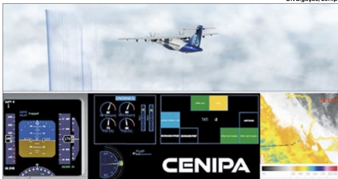
Força Aérea Brasileira divulgou animação do acidente com o avião da Voepass

Informações de Clayton Castalani (Folhapress)