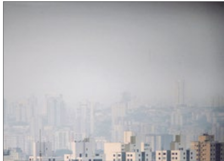
Maior preocupação é com idosos e crianças

Apesar de não faltarem leitões, o grande volume de queimadas no país tem pressionado o sistema de saúde e causa preocupação, principalmente com idosos e crianças com problemas respiratórios. O diagnóstico foi feito nesta segunda-feira (9) pela ministra da Saúde, Nísia Trindade.