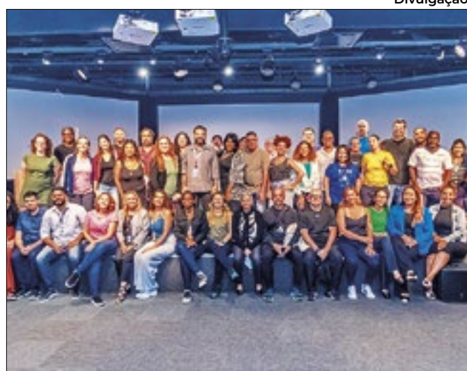
Evento mostra a conexão entre esporte e educação