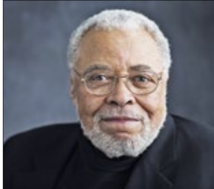
James Earl Jones morreu aos 93 anos

Conhecido por dar voz a personagens famosos como Mufasa, de "O Rei Leão", e Darth Vader, grande vilão da saga "Star Wars", o ator James Earl Jones faleceu aos 93 anos.