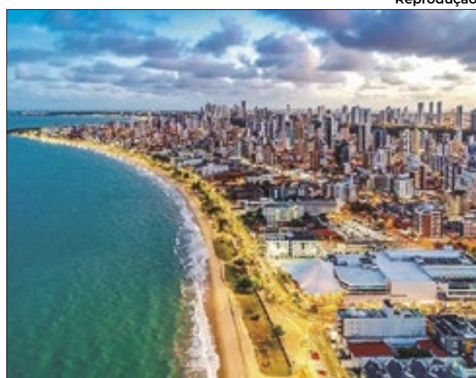
A iniciativa visa garantir a excelência no turismo