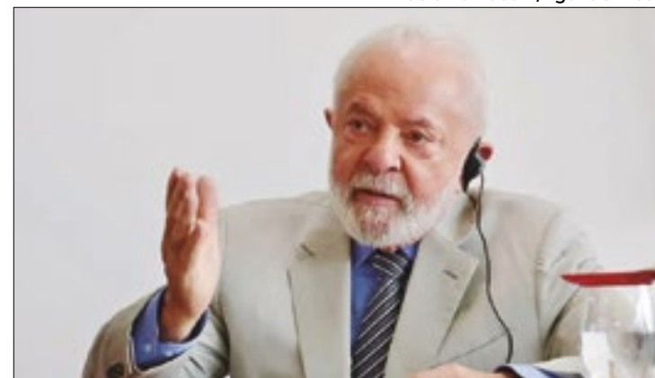
Presidente anunciará plano emergencial e recursos