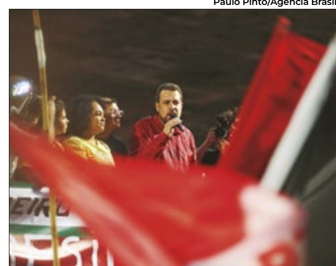
Deputado é um dos líderes em São Paulo