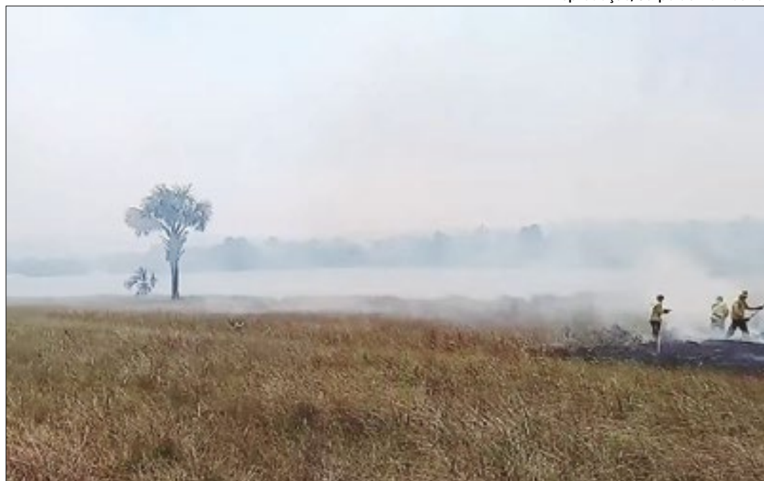
Queimadas na Lagoa da Serra, um dos pontos turísticos das Serras Gerais

Além disso, o secretário de Estado do Meio Ambiente e