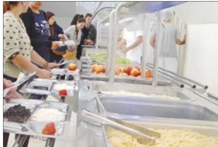
A medida se origina a partir do programa "RU para todos"

Em reunião do Conselho Universitário (Consuni) da Universidade do Estado de Santa Catarina (Udesc) realizada na última quinta-feira, 5 de setembro, foi aprovada por unanimidade a Política de Subsídios aos Restaurantes Universitários da instituição.