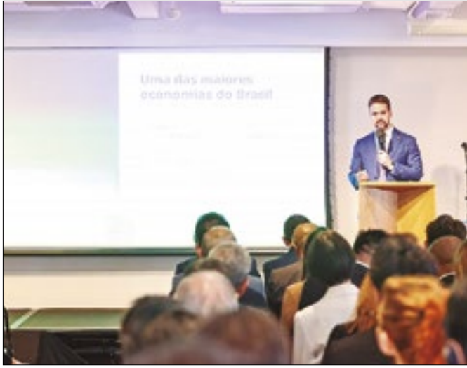
Leite apresentou a carteira de projetos do governo