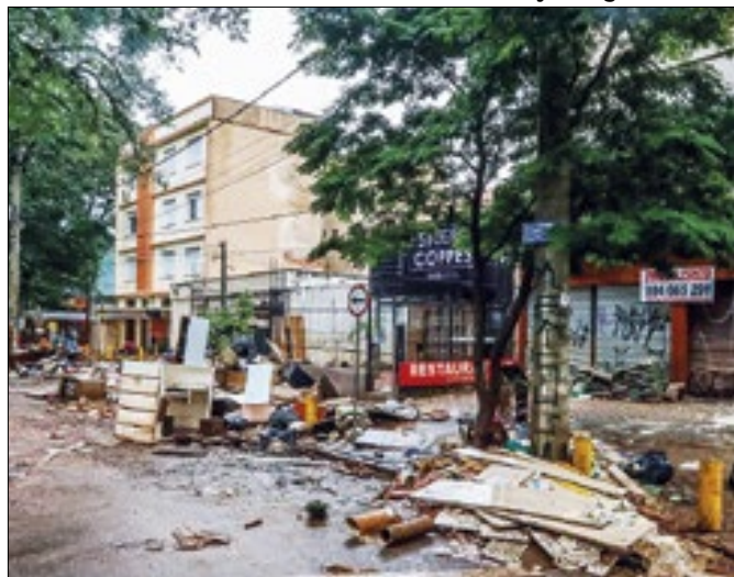
Socorro emergencial do BNDES foi vital para o RS