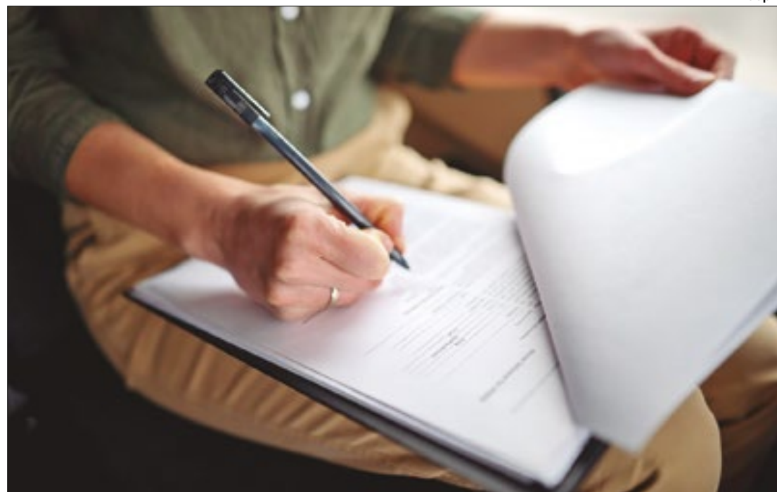
Proposta tramitou no Congresso Nacional por duas décadas

A norma vale apenas para concursos federais, excluindo as seleções para empresas públicas para magistrados, Ministério Público e de empresas públicas ou de sociedade de economia mista que não dependam de