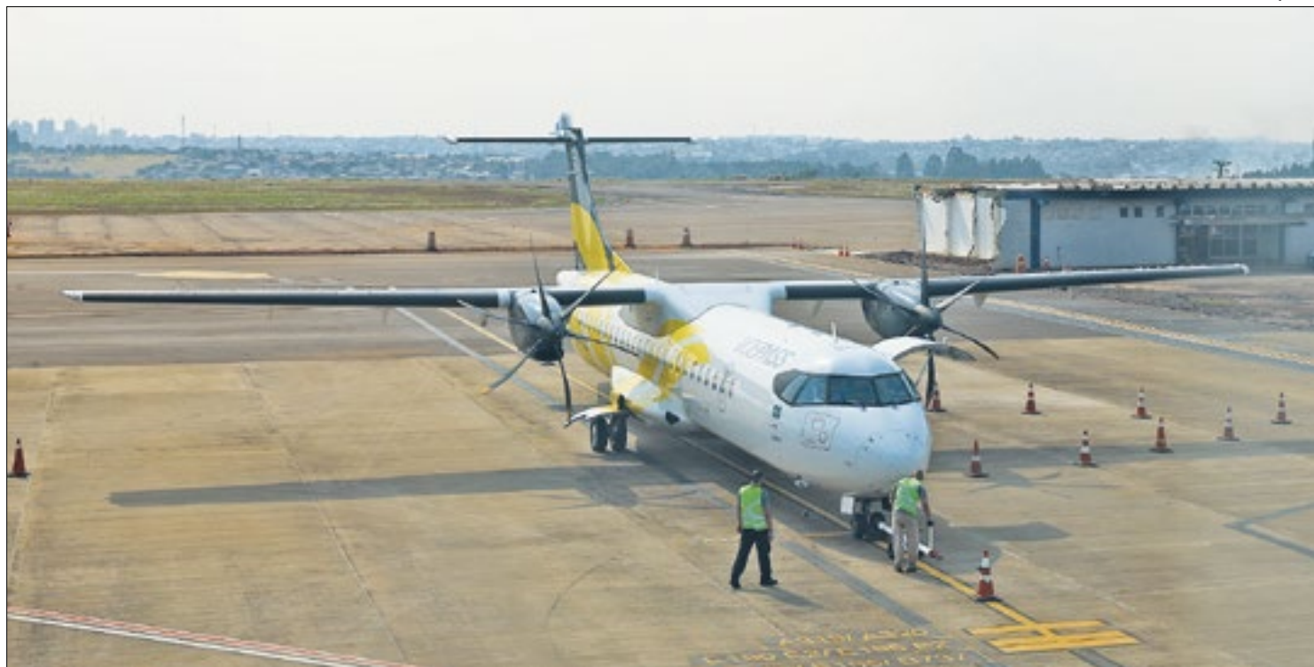
Avião da Voepass no aeroporto de Cascavel. Aeronave é o mesmo modelo do avião que caiu em Vinhedo (SP)

Usuários que adquiriram bilhetes no período dos trechos cancelados serão tratados conforme a resolução 400 da Anac (Agência Nacional de Aviação