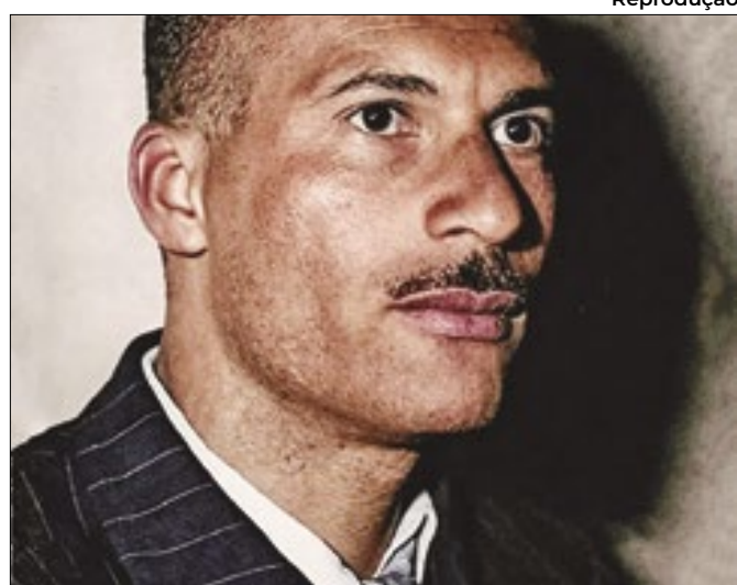
Caso Marighella ainda rende nos tribunais