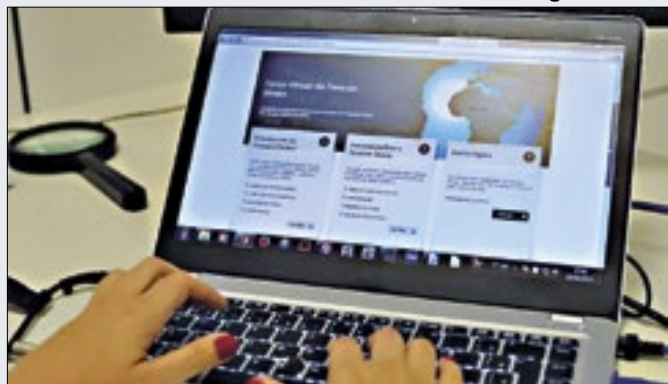
Aplicação do Tesouro fatura 2ª maior venda da história