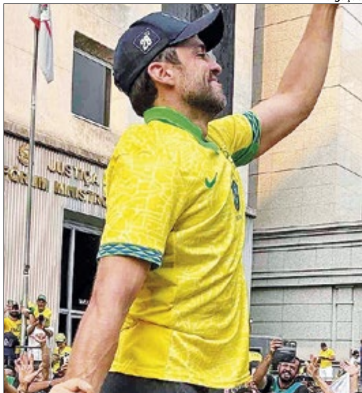
Presença de Marçal na Paulista irritou Bolsonaro

Questionado por um seguidor no Instagram sobre o motivo pelo qual o ex-coach ainda apoia o retorno de Bolsonaro