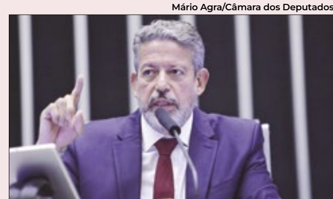
Arthur Lira tenta consenso para escolha de sucessor