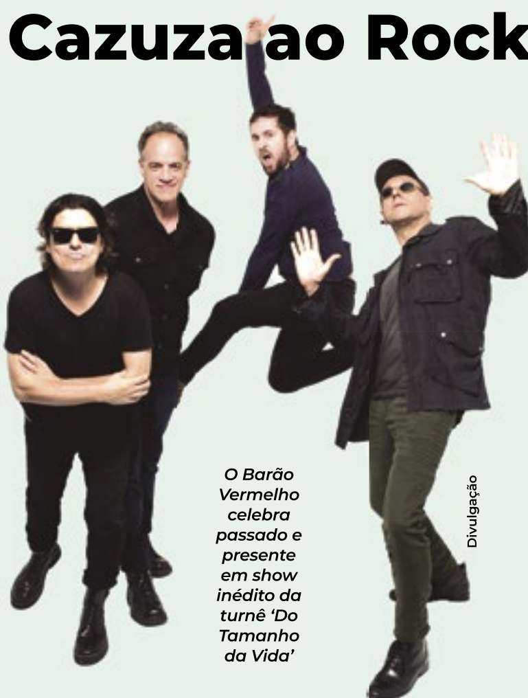
O Barão Vermelho celebra passado e presente em show inédito da turnê 'Do Tamanho da Vida'