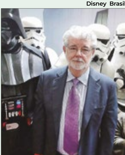
Criador da saga Star Wars, George Lucas pertence a uma geração que renovou o cinema e tem sua obra revista em retrospectiva no Rio