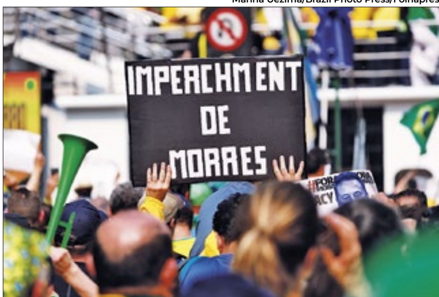
Na Paulista, Bolsonaro chama Alexandre de Moraes de “ditador”