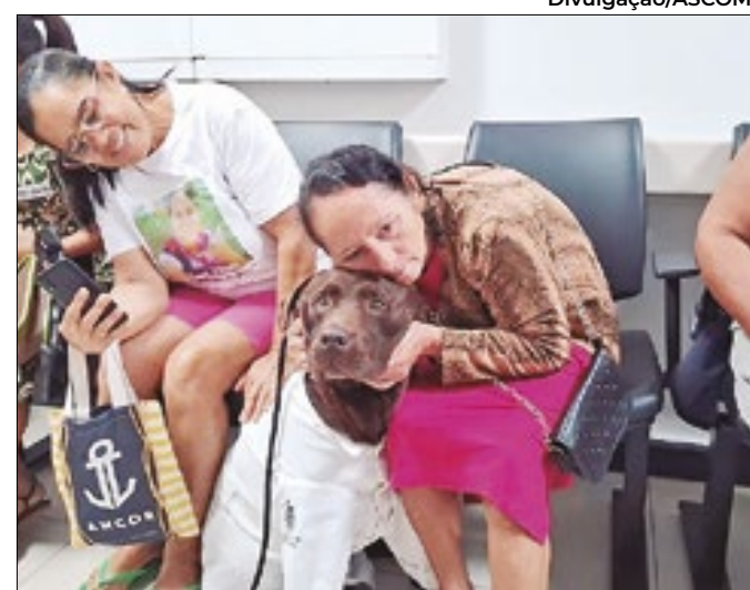
Terapia promove benefícios emocionais e físicos