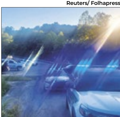
Nove veículos foram atingidos

Cinco pessoas foram baleadas na noite de sábado (7) em uma rodovia no estado do Kentucky, nos EUA, segundo autoridades locais. As causas do tiroteio ainda são desconhecidas. As cinco vítimas