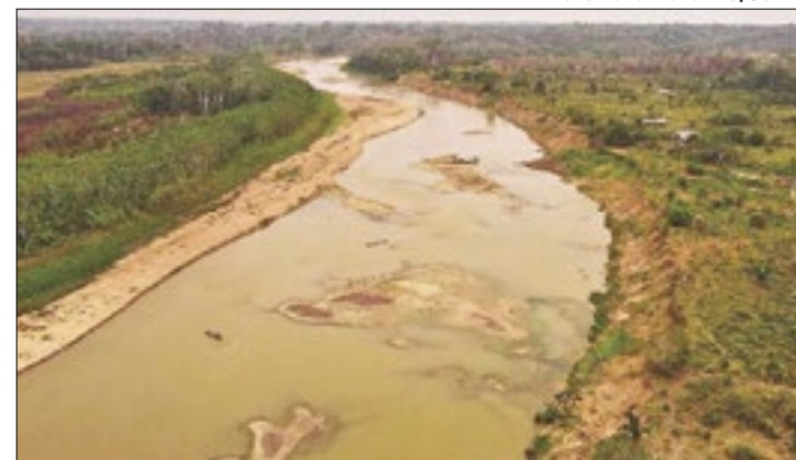
Estado enfrenta emergência devido a seca e queimadas