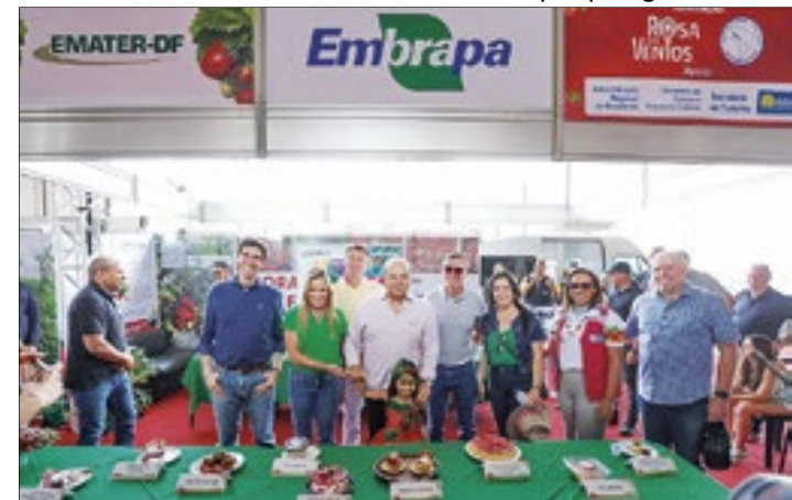
Festa do Morango recebeu o governador Ibaneis Rocha