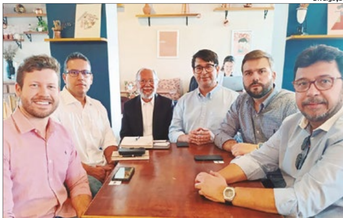
Sedetec e Codise participaram de reunião com Associação Nacional

As ZPEs são áreas de livre comércio com o exterior