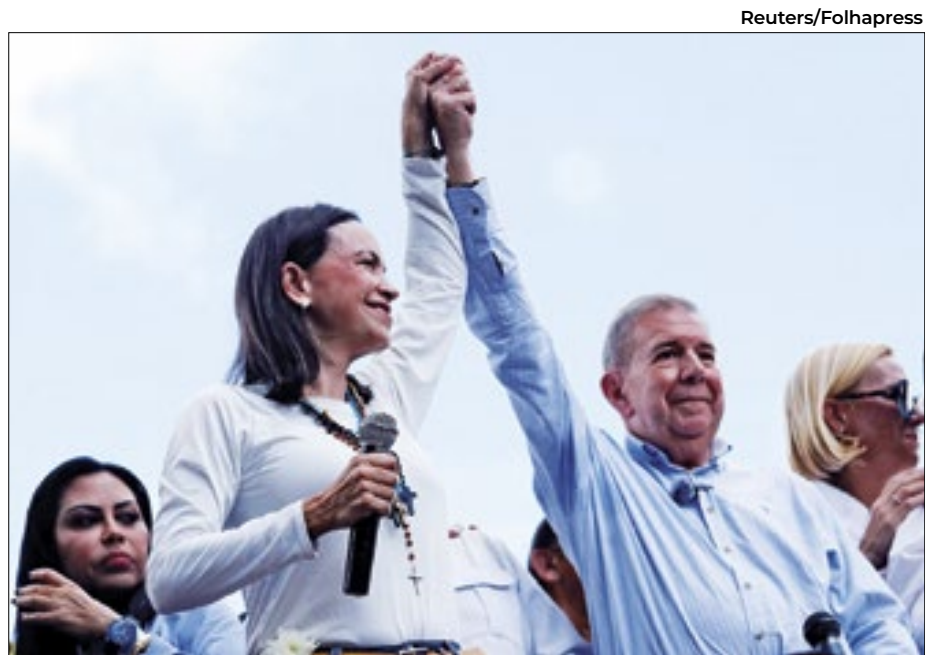
María Corina Machado e Edmundo González durante protestos

"Sua vida estava em perigo, e as crescentes ameaças, intimidações, ordens de prisão e até mesmo as tentativas de chantagem e coerção das quais foi alvo demonstram que o regime não tem escrúpulos nem limites em sua obsessão de silenciá-lo e tentar fazê-lo ceder", prosseguiu ela. "Diante dessa brutal realidade, é necessário para a nossa