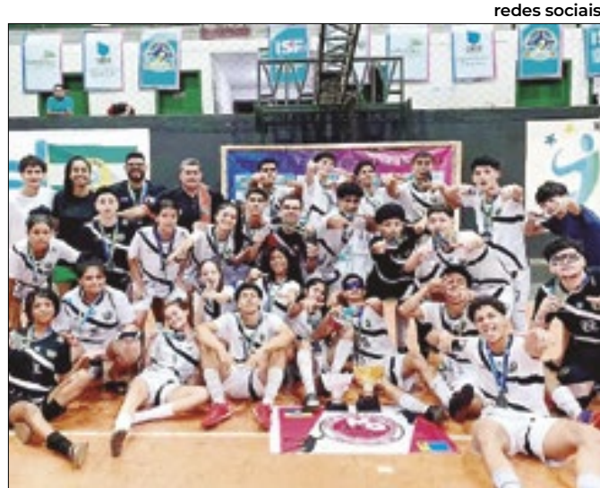
Times masculino e feminino competem em Brasília