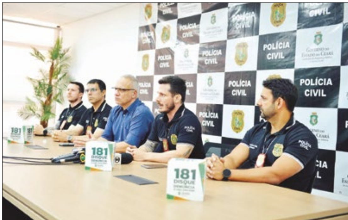
Até o momento, 34 mandados de prisão preventiva foram cumpridos

Em resposta às ações criminosas no Ceará, envolvendo grupos suspeitos de ameaçar eleitores, extorquir candidatos, interferir em eleições e intimidar eleitores, a Polícia Civil do Estado do Ceará (PCCE) deflagrou uma das maiores operações do ano que resultou na prisão de 34 pessoas que estavam sendo investigadas por integrar grupos criminosos atuantes no Estado. Um outro suspeito foi preso em flagrante por posse ilegal de arma de fogo. Dentre os alvos da operação "Complevit", que significa fim de linha, estão 34 suspeitos de 18 a 53 anos, apontados como integrantes de grupos criminosos, e que eram investigados por integrar organização criminosa armada e por envolvimento em ameaças e intimidações de eleitores, extorsão de candidatos e interferência em campanhas eleitorais. Todos os suspeitos já tinham antecedentes criminais por crimes como tráfico de drogas, porte ilegal de arma de fogo e integrar organização criminosa. Não vamos permitir que criminosos intimidem os eleitores e candidatos e atrapalhem as eleições municipais. Nossas forças de segurança estão atentas e