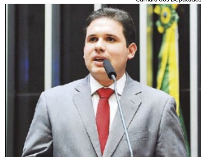
Deputado virou favorito para presidir a Câmara