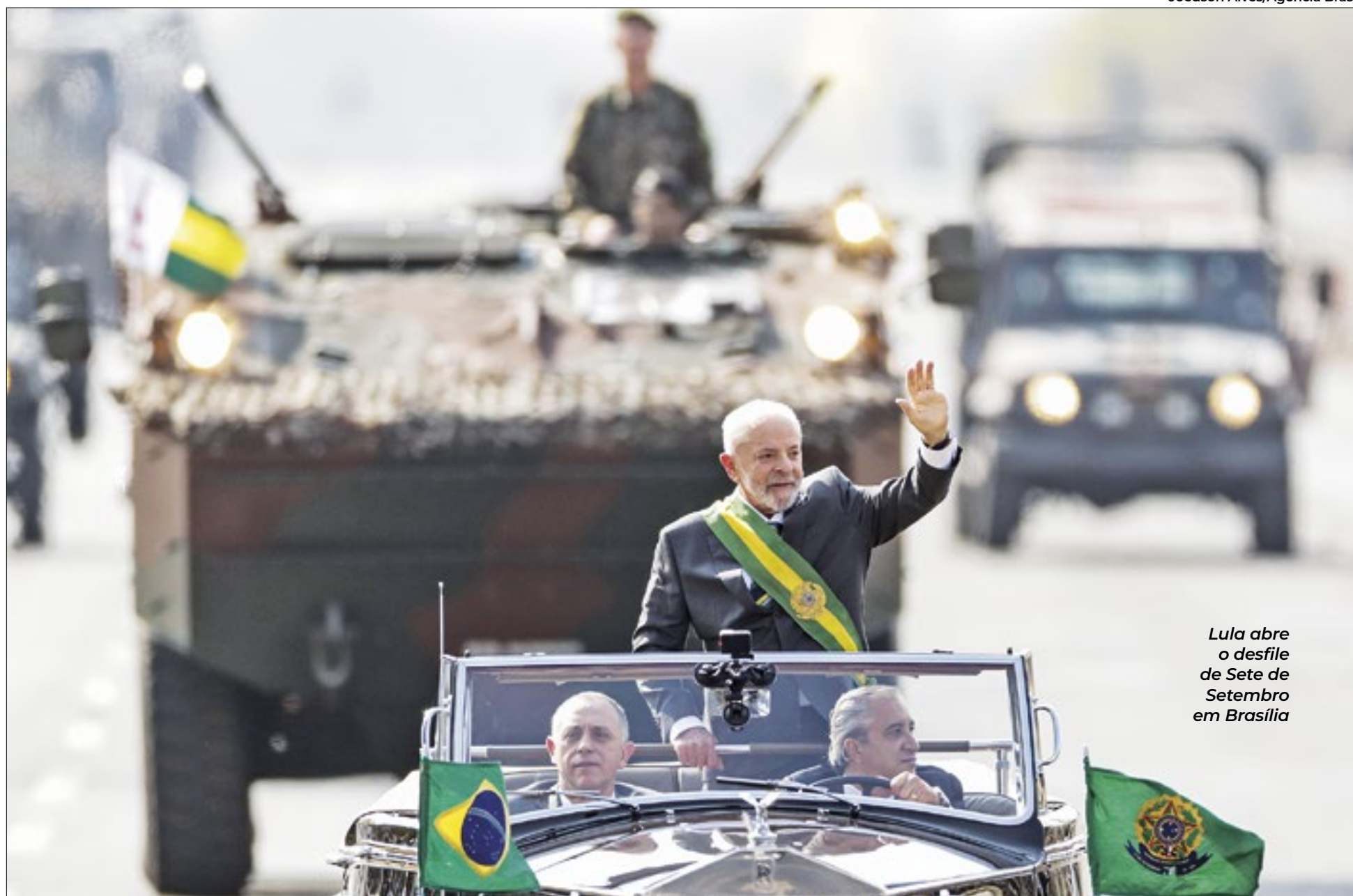
Lula abre o desfile de Sete de Setembro em Brasília