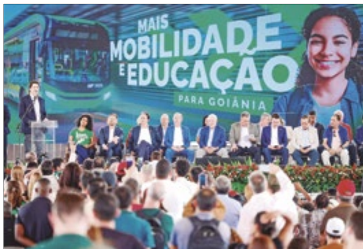
Daniel Vilela (Goiás) cobra do presidente Lula solução para o problema do transporte urbano no Entorno do DF

Vilela lembrou a Lula sobre a possibilidade de criação de um consórcio Inter federativo, que além de DF e Goiás teria a participação do Governo Federal para custear o complemento do valor da tarifa paga pelo usuário do transporte público. “Nosso governo (de Goiás) já se colocou à disposição”, enfatizou.