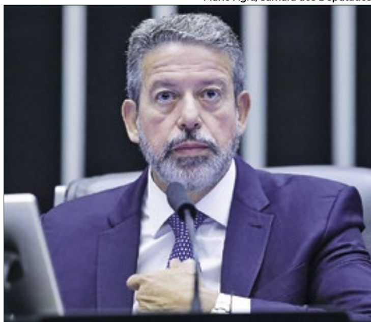
Posição de Lira definirá os votos do PL

Motta ganhou força após o vice-presidente da Câmara, Marcos Pereira (Republicanos-SP), desistir de sua candidatura para apoiar o colega de partido, após constatar que não teria o apoio para vencer.