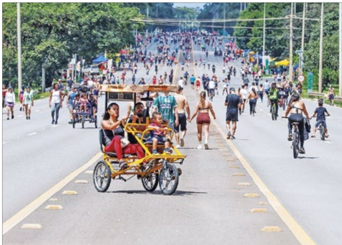
Público menor no Eixão neste domingo

Um dos pontos polêmicos da ação segue em vigor. Os ambulantes continuam proibidos de vender bebidas alcoólicas no local. Na volta do espaço de confraternização, esse foi um dos maiores pontos de reclamação do público. Além de ser um espaço no qual famílias passeiam e confraternizam, o Eixão do Lazer tornou-se um ponto de encontro cultural, com diversas rodas de choro, samba e outros gêneros. E era especialmente nesses pontos