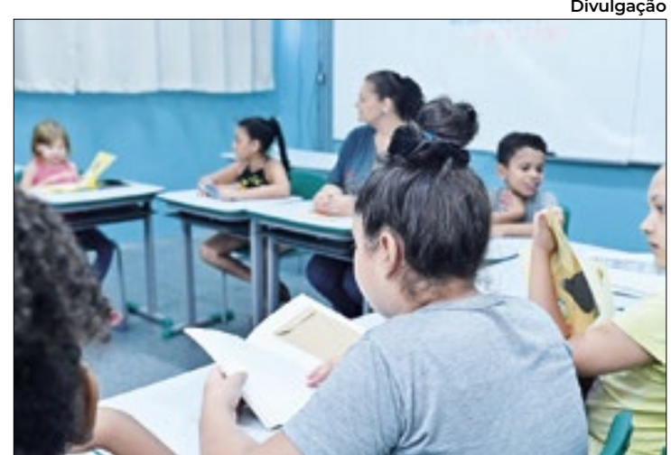
Alunos devem ler livros físicos, disponíveis dentro de cada sala

Para desenvolver a competência leitora, as crianças têm acesso a cerca de 500 títulos literários no sistema operacional, que podem ser acessados por meio de tablets e computadores das escolas ou até mesmo do celular dos pais e responsáveis. A equipe da coordenadoria aponta que parte dos livros da plataforma Elefante Letrado, e