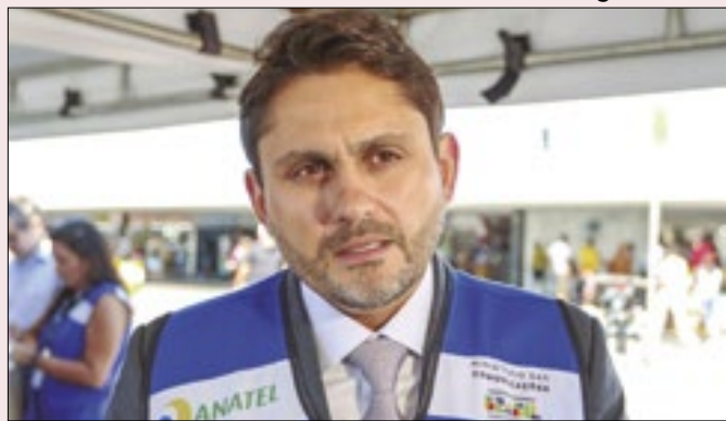
O governo sangra com Juscelino Filho