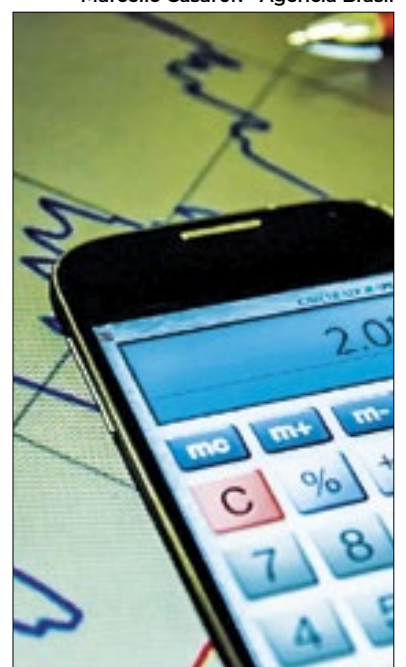
Planalto estuda medidas para 'conseguir' déficit zero