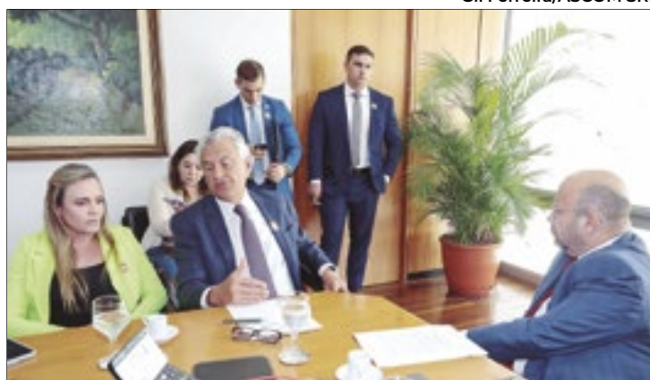
Em fevereiro de 2023, Celina Leão (DF) e Ronaldo Caiado (GO) estiveram reunidos no Palácio do Planalto