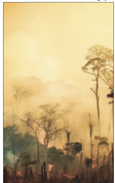
A região superou países com histórico de poluição