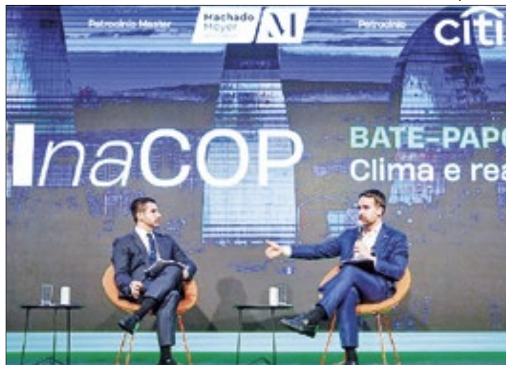
Governador apresentou a realidade após as enchentes

Em evento promovido pela Câmara de Comércio Americana (Amcham Brasil) na última sexta-feira (6/9), em São Paulo, o governador Eduardo Leite apresentou a investidores e empresários as iniciativas de adaptação e resiliência climática em andamento no Rio Grande do Sul, em especial após as enchentes de maio.