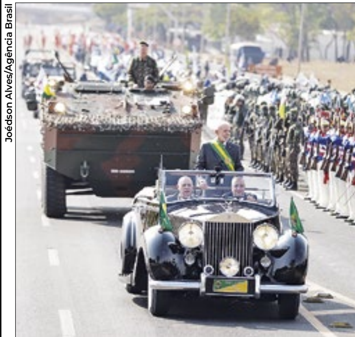
Lula (esquerda) na tradicional celebração em Brasília. Bolsonaro (direita) no protesto que aconteceu na Avenida Paulista