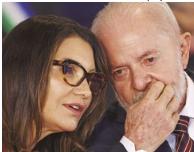
Janja está entre as pessoas que sabiam