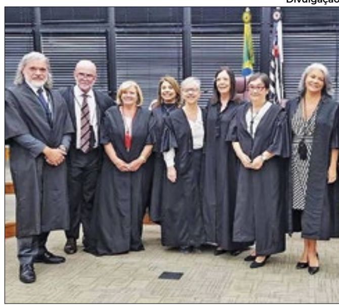
Posse de seis novos desembargadores no TRT-2