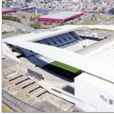
Gramado preocupa Corinthians

sexta (6), que criticou o gramado do jogo. A preparação para o próximo jogo do Corinthians já começou. Na próxima quarta-feira (11), o Timão recebe o Juventude, na Neo Química Arena, pelo jogo de volta das quartas de final da Copa do Brasil.