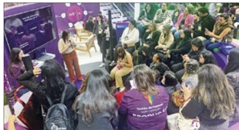
Dezenas de salas foram montadas para empresas mostrarem seus melhores produtos