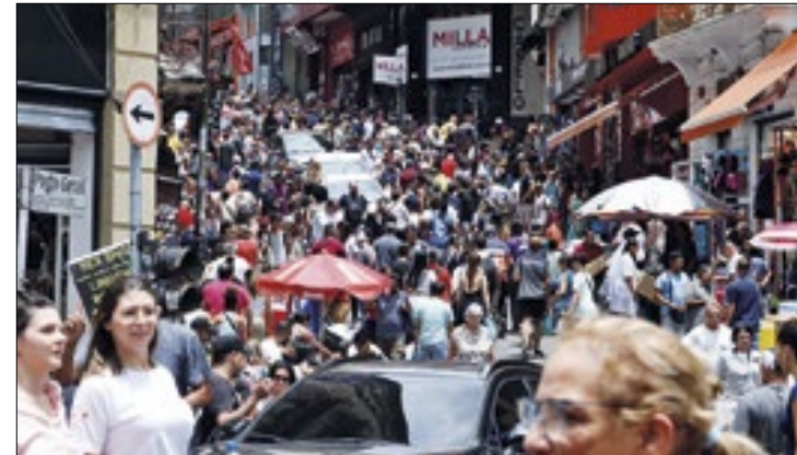
Alagoas tem o menor aumento, segundo IBGE