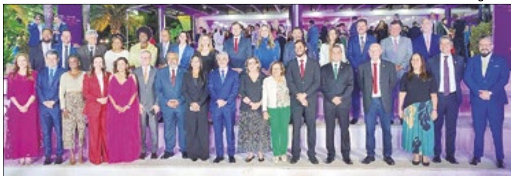
Evento premiou os melhores parlamentares do Congresso Nacional