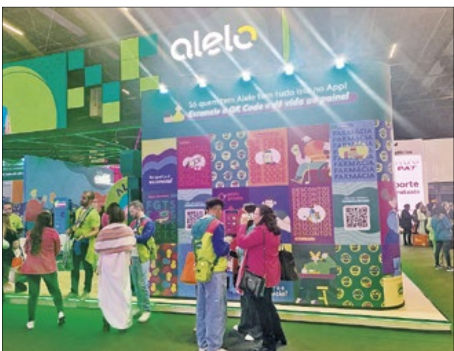
Alelo ofereceu um cartão de modelo híbrido para os profissionais no escritório ou home office