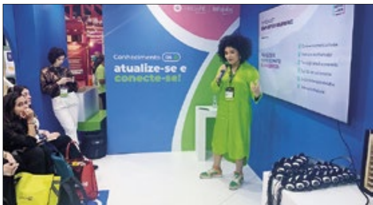
BandaPé mostrou processos ágeis para um RH que busca os melhores resultados em contratações