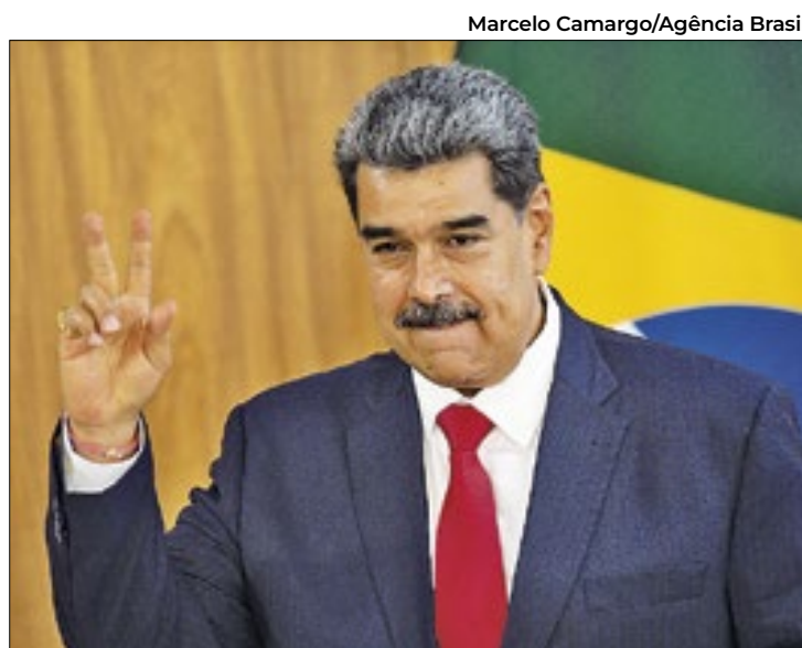
Ditador disse que ninguém interferiu nas eleições de 2022

Fala ocorre uma semana após Supremo da Venezuela