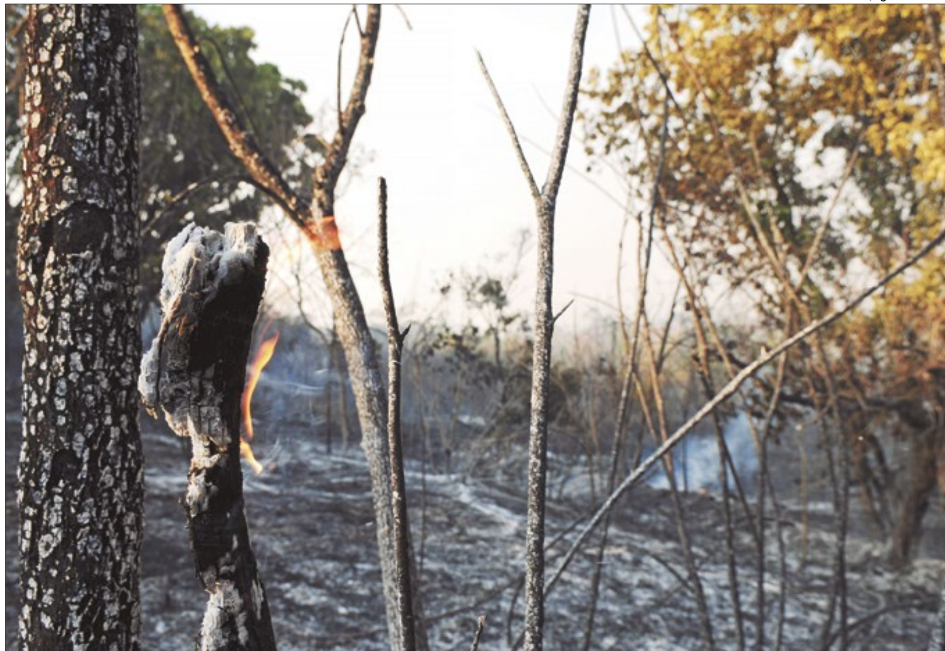
O Brasil queima. Efeitos climáticos afetam a saúde da população e até a economia

As notícias para o Distrito Federal não são boas. Normalmente, os meses de agosto e setembro são conhecidos entre os habitantes como os mais quentes do ano e com maior número