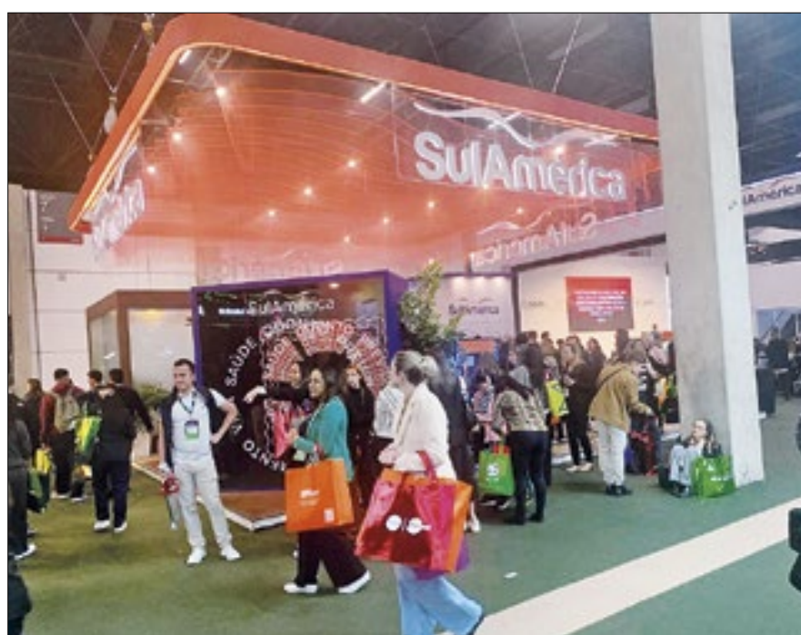
Com mais de 128 anos de experiência, em saúde, a SulAmérica mostrou os melhores planos para o futuro

Por José Carlos Tedesco Colaboração para o Correio da Manhã