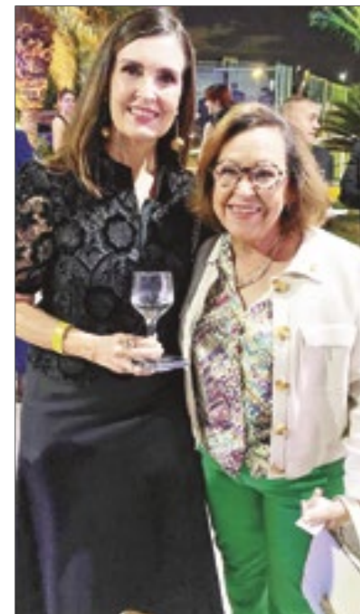
A apresentadora Fátima Bernardes com a deputada Lidice da Mata (PSB-BA)

Confira os ganhadores: Melhor Nordeste Senado: Humberto Costa; Melhor Sul Câmara: Fernanda Melchiona; Melhor Sul Senado: Paulo Paim; Melhor Centro-Oeste Câmara: Erika Kokay; Melhor Nordeste Câmara: Túlio Gadelha; Melhor Centro-Oeste Senado: Soraya Thronicke; Melhor Norte Câmara: Duda Ramos; Melhor Norte Senado: Randolfe Rodrigues; Melhor Sudeste Câmara: Erika Hilton; Melhor Sudeste Senado: Fabiano Contarato; Clima e Sustentabilidade: deputada Célia Xakriabá; Cidades Inteligentes: deputado Idilvar Alencar; Apoio à Indústria (essa patrocinada pela ABDI): senador Otton Alencar; Jornalistas Câmara: Benedita da Silva e Tabata Amaral; Jornalistas Senado: Empate triplo: Eliziane Gama, Fabiano Contarato e Randolfe Rodrigues; Melhor Deputado Internet: Erika Hilton; Melhor Senador Internet: Fabiano Contarato; Melhores Júri Especializado Câmara: Fernanda Melchiona; Melhores Júri Especializado Senado: Paulo Paim.