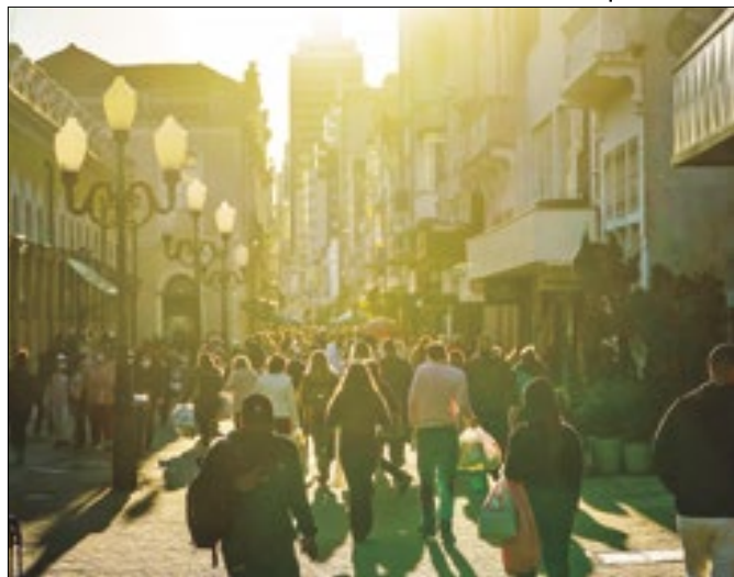
População já passa de 8 milhões de pessoas