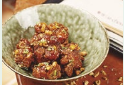
Quem resiste aos frangos fritos caramelizados à moda oriental? O Correio listou as melhores opções para saborear esta iguaria