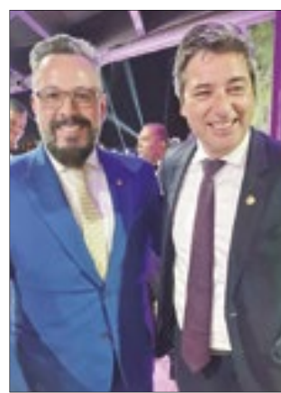
Os senadores Alan Rick (UNIÃO-AC) e Carlos Portinho (PL-RJ)