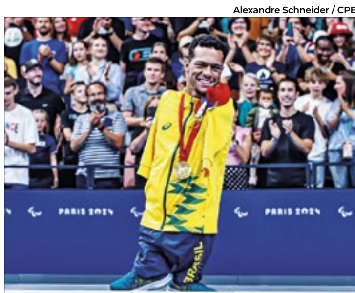
Primeiro dia do Brasil em Paris já nos trouxe um Ouro

Gabrielzinho marcou 1min53s67, seis segundos melhor que o tempo da classificató-