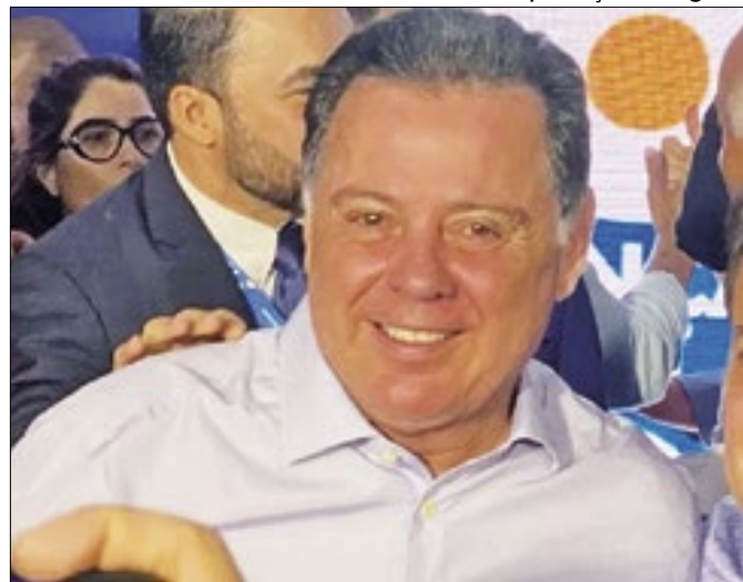
Marconi Perillo, presidente do PSDB