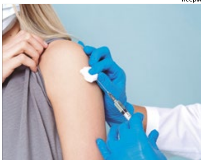
Números foram apresentados pela Saúde