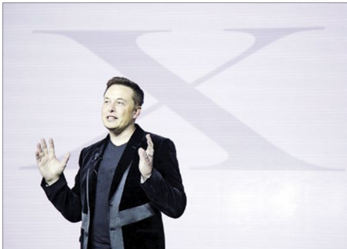
Musk acusa de censura decretos de Moraes em suspender contas de investigados

Pouco tempo depois da intimação, Moraes ainda de-