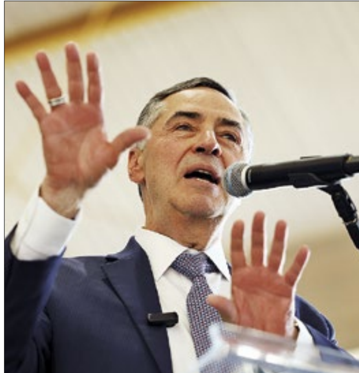
Barroso concedeu mais tempo de acordo entre poderes

Estava previsto uma reunião no Congresso Nacional nesta quinta-feira para definir as novas regras das emendas, convocada pelo presidente