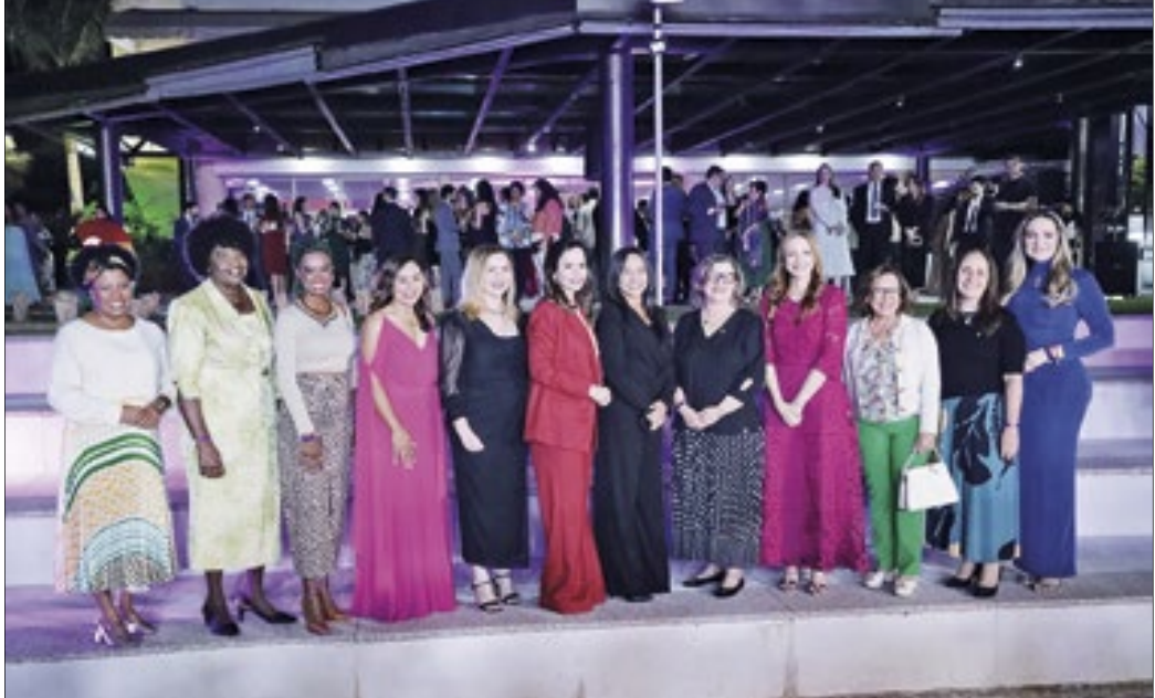
As deputadas federais e senadoras eleitas pelo júri do Congresso em Foco

Site especializado em cobertura política, o Congresso em Foco realizou, em Brasília, a 17ª edição de seu prêmio, que elege os melhores parlamentares do Brasil, em três categorias: pelo voto popular, pelo voto dos jornalistas e