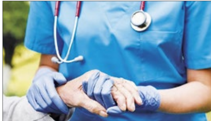
Decisão foi tomada pela Assembleia Legislativa de MT