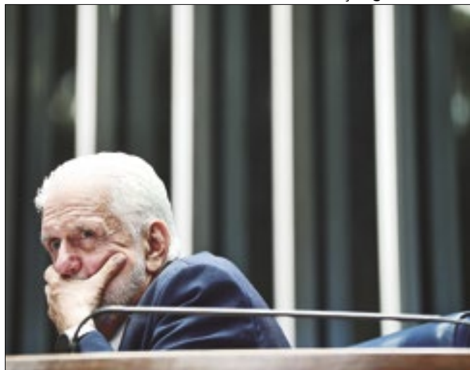
Se tudo correr bem, o relator será Wagner