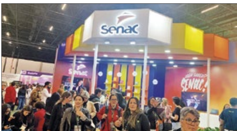
A visão estratégica do SENAC foi oferecer cursos para descobrir e segurar novos talentos