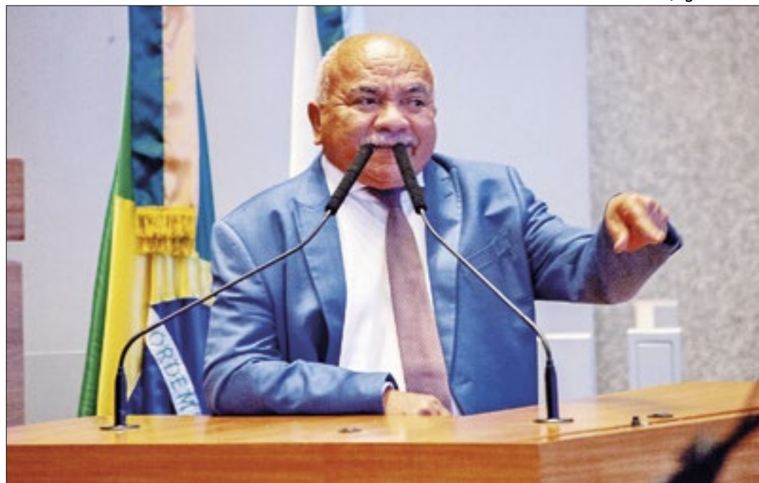
Projeto de Vigilante torna gratuito transporte de crianças