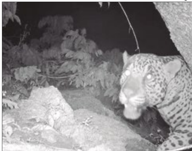
Espécies ameaçadas são flagradas na região