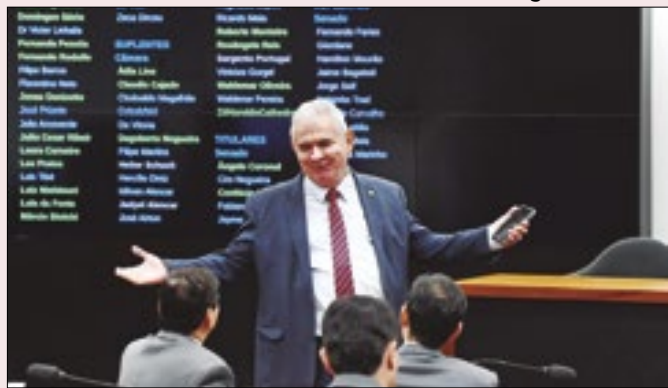
Se problemas continuarem, relator será Coronel