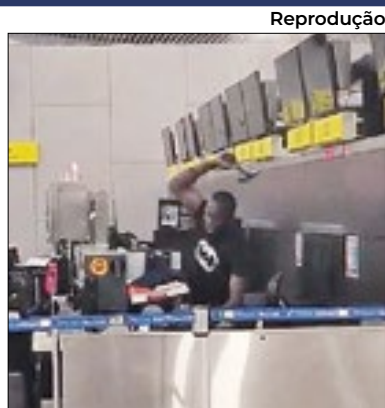
Danos foram de mais de R$122 mil

Um haitiano foi detido por destruir monitores e terminais de check in do aeroporto de Santiago. O homem, que mora no Chile e está legalizado no país, usou um martelo para danificar os equipamentos após ser impedido de embarcar em um voo na terça (27).