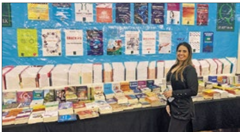
Livros como brindes para ajudar na formação profissional aumentou em 30% na procura deste ano