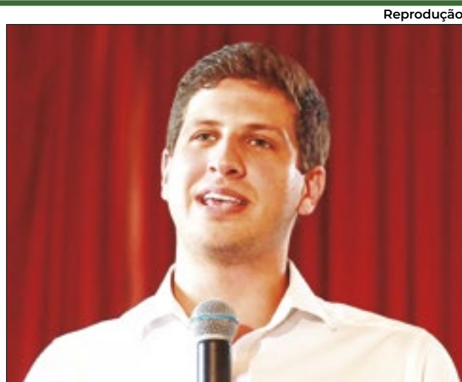
A pesquisa mostra as intenções de voto para prefeito