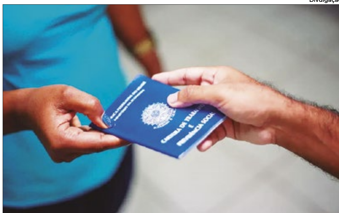
Todos os cinco setores analisados registraram saldo positivo

No setor de serviços, saldo atingiu 1.264 vagas ocupadas