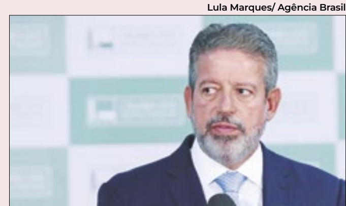
Presidente da Câmara quer evitar derrota