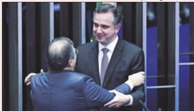
Até os do STF, como Dino, se submetem ao beija-mão