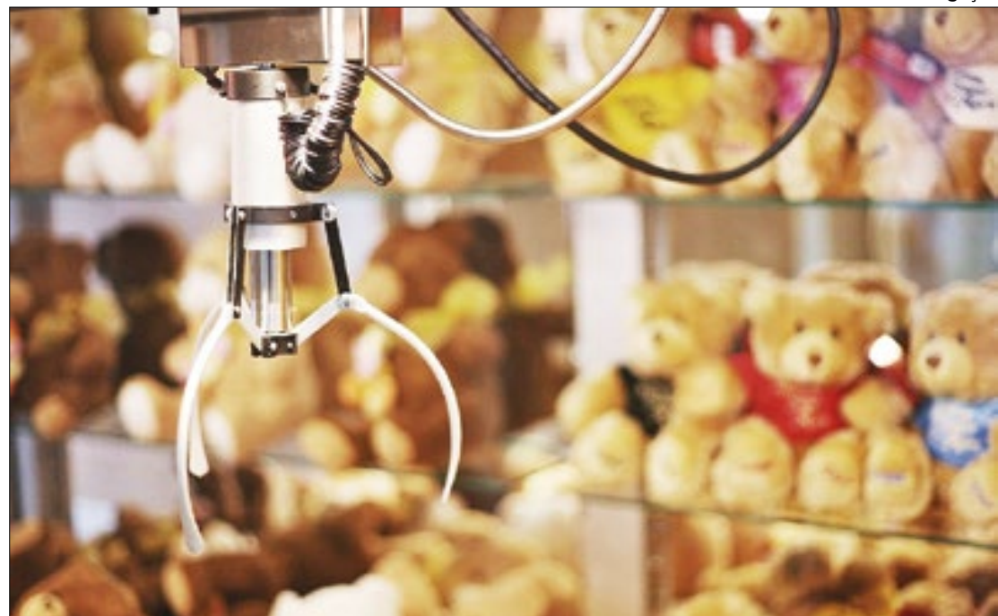
Polícia investiga ligação de fraude em máquinas de pelúcia com o jogo do bicho

"Algumas pessoas foram conduzidas na condição de testemunha, funcionários e técnicos que operavam as máquinas, para entendermos melhor como isso funciona. Também encontramos uma pistola dentro de um dos galpões, de uma gaveta, e estamos fazendo as devidas consultas para saber se é uma arma registrada, com