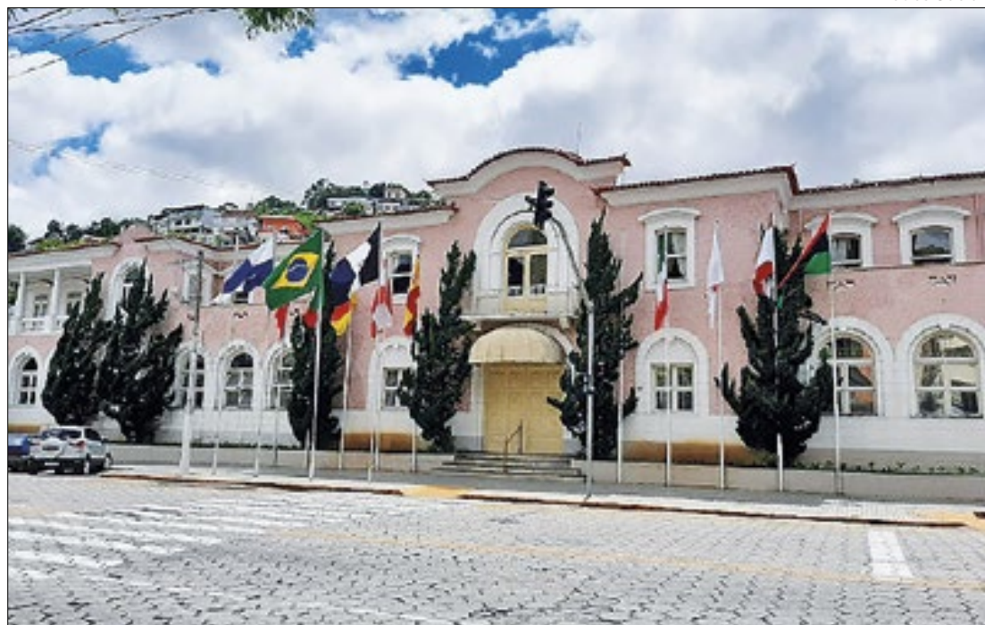
Somados, o patrimônio dos vices candidatos chega a quase R$ 3 milhões

Declarou R$ 224.500,00 em bens para as eleições de 2024. Destes: reais investidos