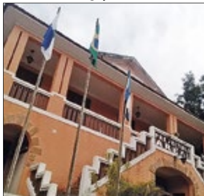
Ação projetará as metas

Moradores, empresários, comerciantes, representantes de entidades e demais interessados poderão comparecer na última etapa do Processo de Elaboração do Plano Diretor Participativo (PDP) de Areal. Segundo a Prefeitura