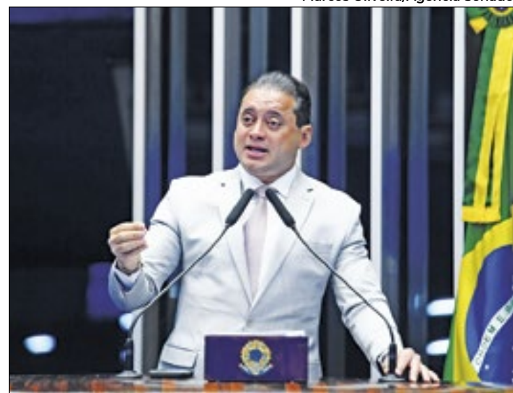
Weverton: projeto "corrige excessos" da Lei da Ficha Limpa