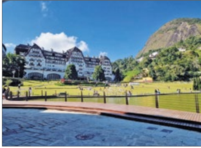
Palácio Quitandinha cartão-postal de Petrópolis