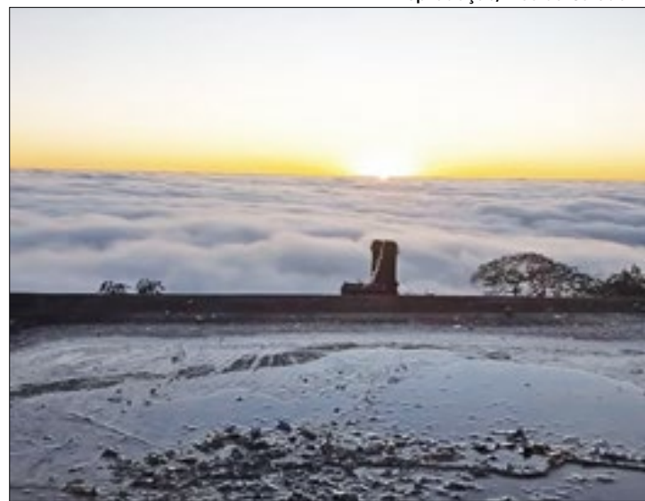
Registro foi feito pelo montanhista Paulo Braga

outras cidades serranas do estado do Rio de Janeiro também têm enfrentado baixas temperaturas. Petrópolis registrou -1,5°C, enquanto Teresópolis e Itatiaia marcaram