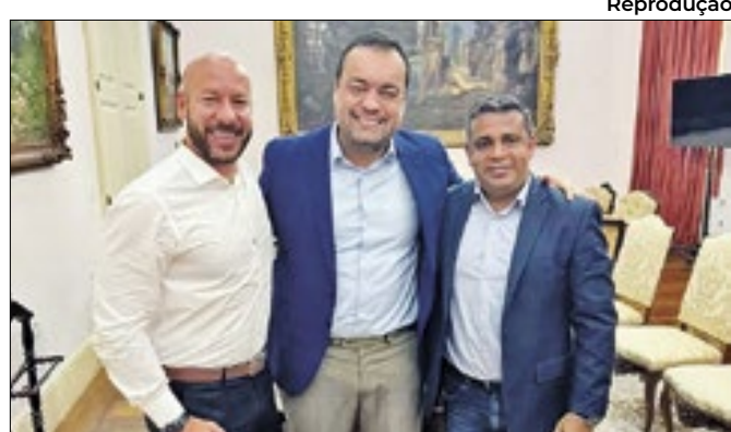
Evento terá a presença do governador Cláudio Castro