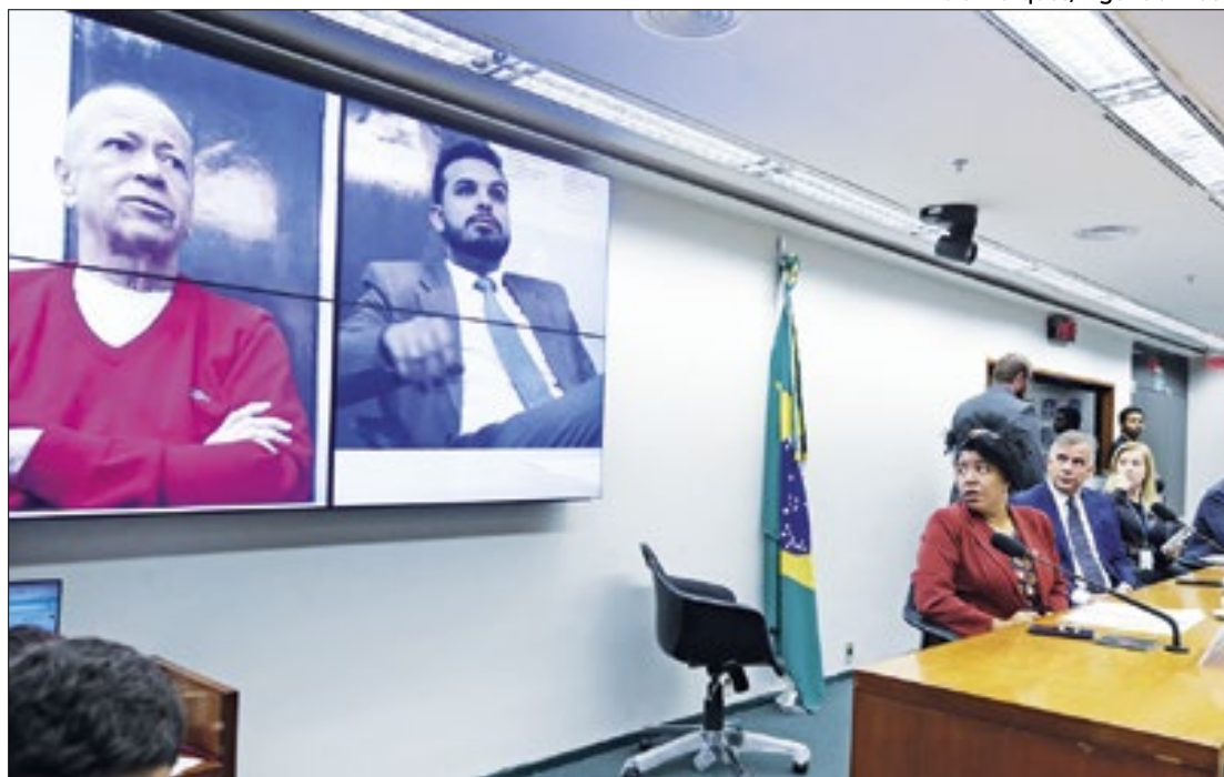
Brazão acompanhou a sessão do presidio por videoconferência

“O caso Marielle Franco é emblemático ao destacar a intersecção entre a violência de gênero e a violência política, onde a sua atuação como mulher na política foi alvo de ataques mortais”, destacou Jack Rocha.