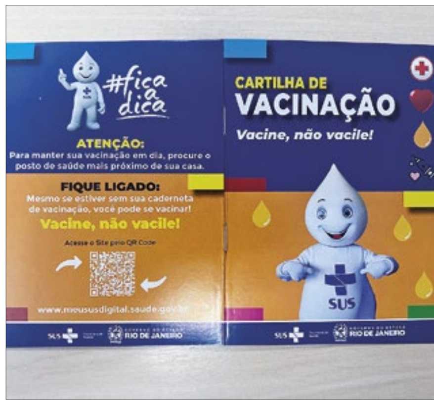
São milhares de cadernetas distribuídas para a população fluminense