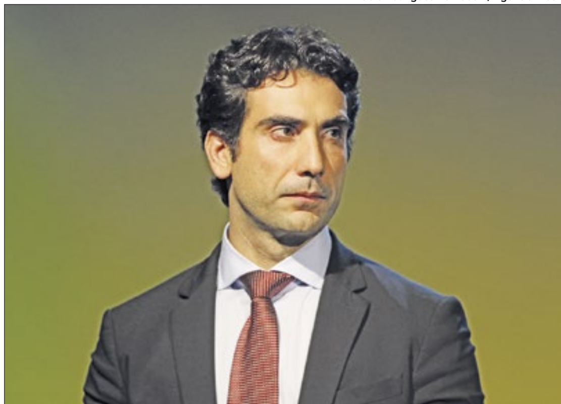
Se aprovado, o economista presidirá o Banco Central por quatro anos

Galípolo irá chefiar o BC por um período de quatro anos a partir de 2025, substituindo Roberto Campos Neto, cujo mandato se encerra no dia 31