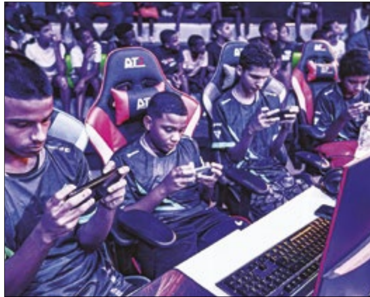
Competição acirrada terá show especial do MC Jeffinho

Nessa quinta-feira (29), quando é comemorado o Dia Internacional do Gamer, o AfroReggae vai realizar a 2ª Edição da Copa AFG de Free Fire. O evento irá acontecer na Arena AfroGames, localizada no Morro do Cantagalo-Pavão-Pavãozinho, em Ipanema, com uma tarde inesquecível de competição acirrada, muita diversão e um show especial do MC Jeffinho, dono do sucesso "Afronta é Guerra".