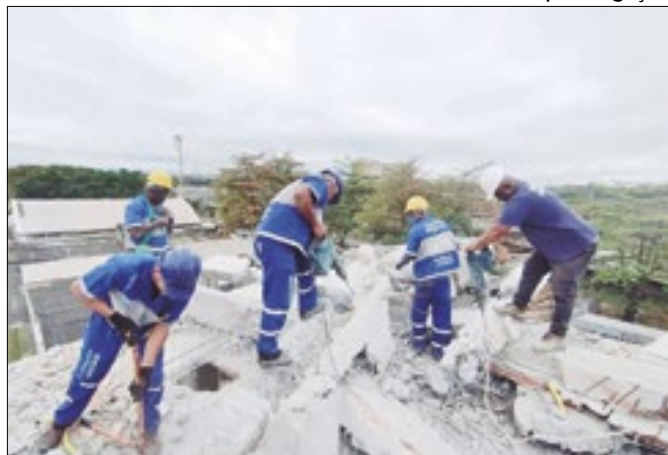
MPF questiona prefeitura sobre paralisação das aulas