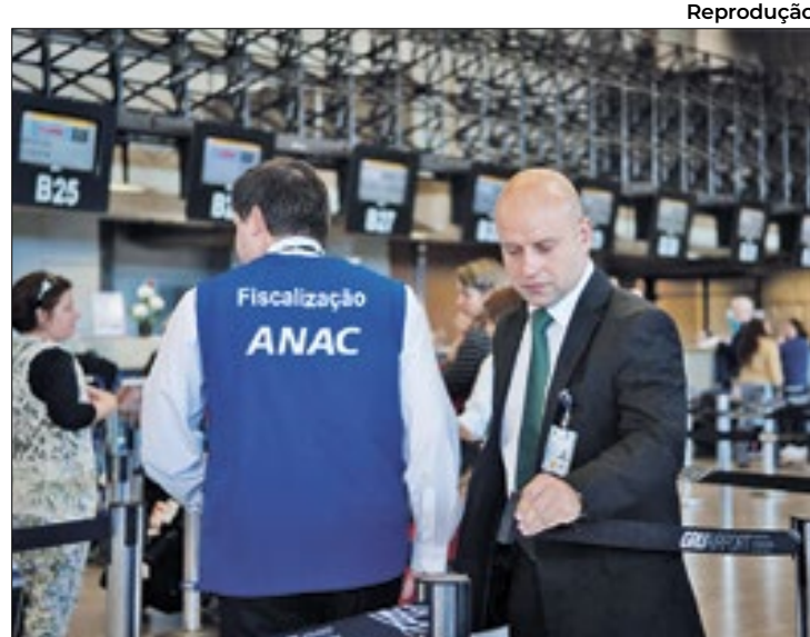
Agência assina acordo com Judiciário para reduzir ações