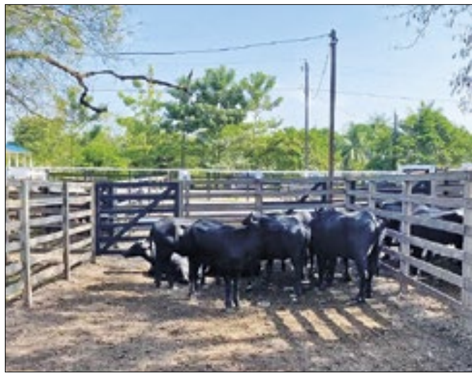
Bovinos, equinos e caprinos fazem parte da exposição