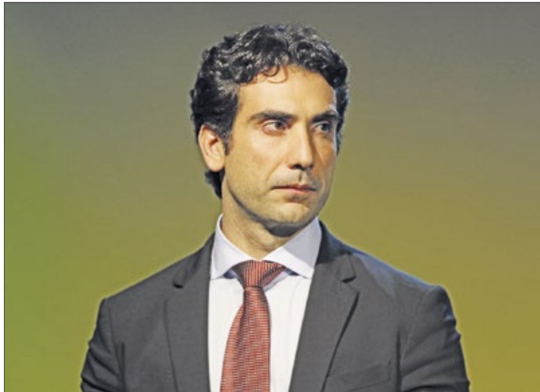
Se aprovado, o economista presidirá o Banco Central por quatro anos

Galípolo irá chefiar o BC por um período de quatro anos a partir de 2025, substituindo Roberto Campos Neto, cujo mandato se encerra no dia 31