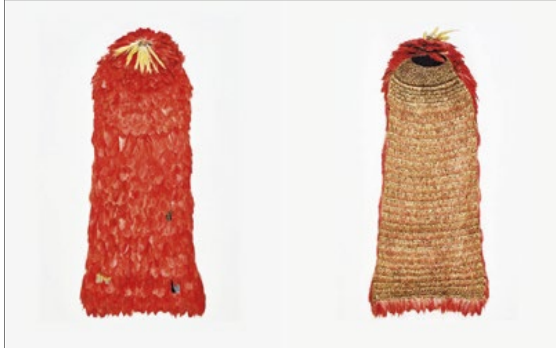
Museu Nacional recebeu uma das peças culturais mais importantes da história brasileira

A cerimônia de celebração do retorno do manto tupinambá ao Brasil foi adiada e ainda não tem uma nova data marcada pelo Museu Nacional do Rio de Janeiro. O adiamento acontece em meio a conflitos entre a administração do museu e lideranças tupinambás, que formam um grupo de trabalho responsável pela repatriação do manto, que aconteceu no início de julho.