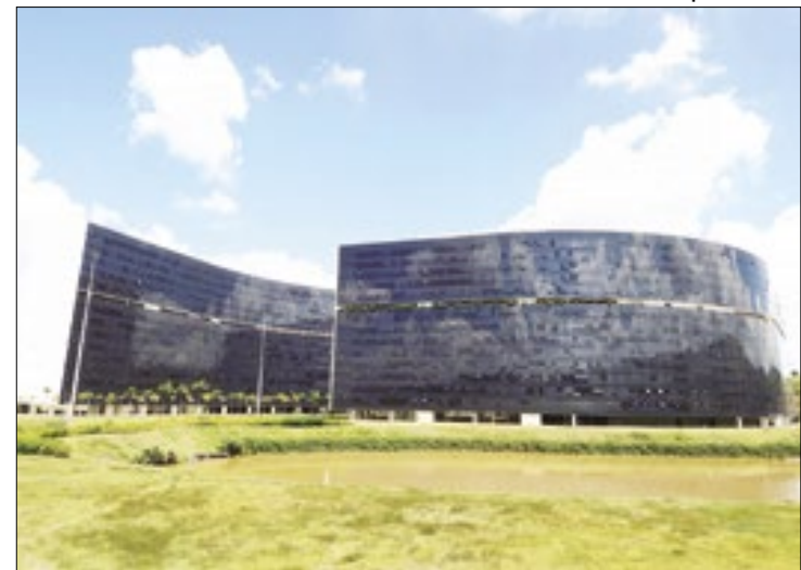
Minas Gerais ampliará valor das parcelas mensais à União

“O mais importante é que essa decisão retira a ameaça de Minas ter que pagar R$ 8 bilhões ainda em 2024, o que iria criar um colapso financeiro, com ris-