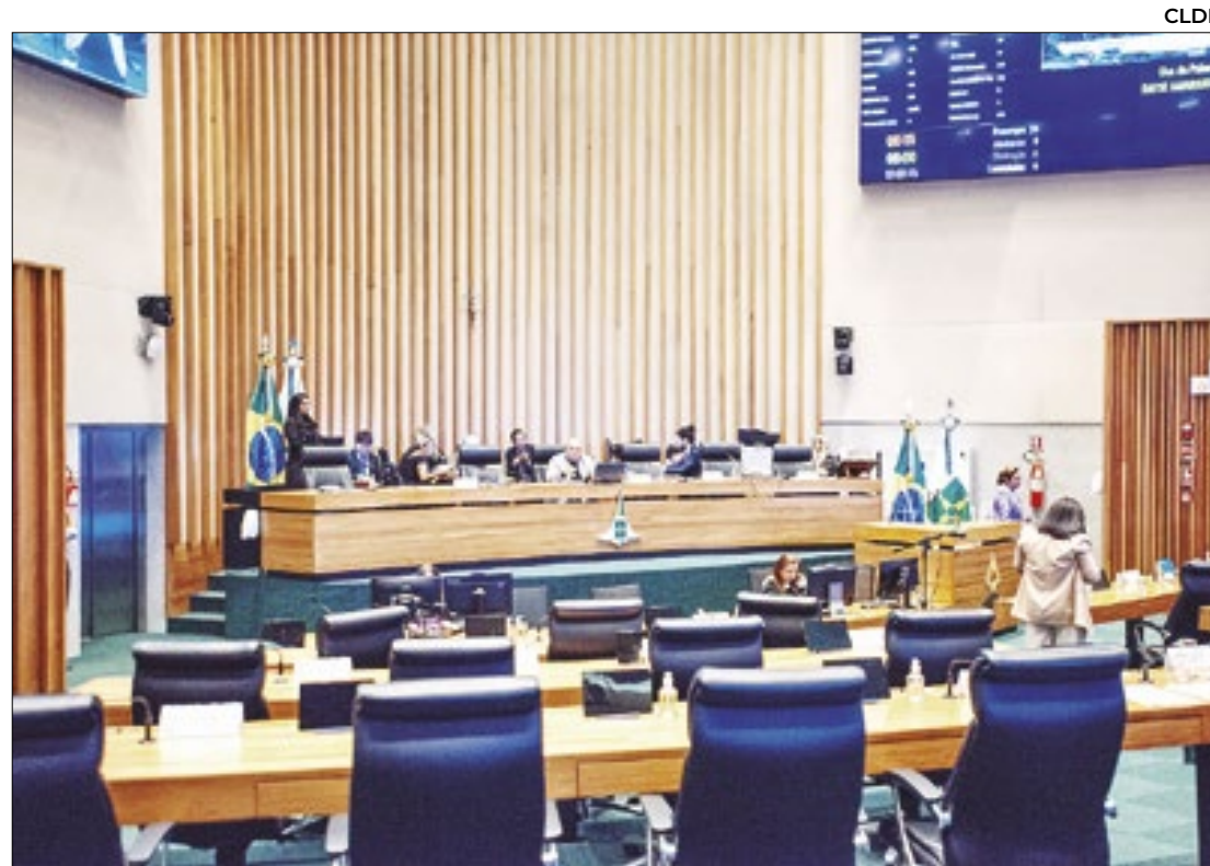
Veto foi derrubado durante sessão na Câmara Legislativa nesta terça-feira (27)

A Polícia Civil de Goiás deflagrou a Operação Chave Falsa na quarta-feira (28), com 18 buscas e 8 prisões. Servidores do Detran, despachantes e intermediários são investigados por fraudes em transferências veiculares e falsificação de documentos, gerando prejuízos ao erário.