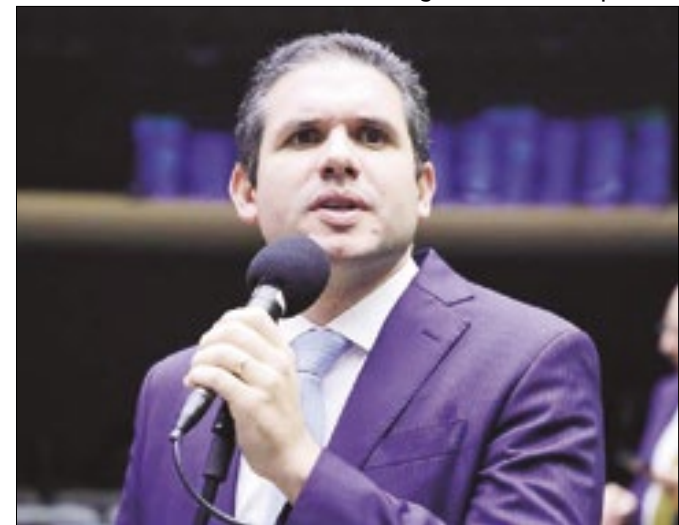
Hugo Motta, citado como eventual candidato