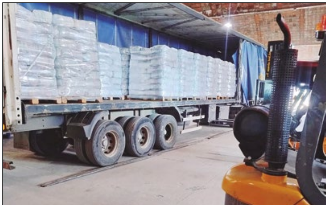
Materiais adquiridos por meio de doação do TCE para atender às vítimas do RS

“As pessoas continuam necessitando do auxílio e os materiais e alimentos que estão sendo enviados vão ajudar no atendimento destas famílias. Nosso agradecimento ao Tribunal de Contas do Estado e também a todas as pessoas que fizeram suas doações para ajudar as pessoas que mais precisa-