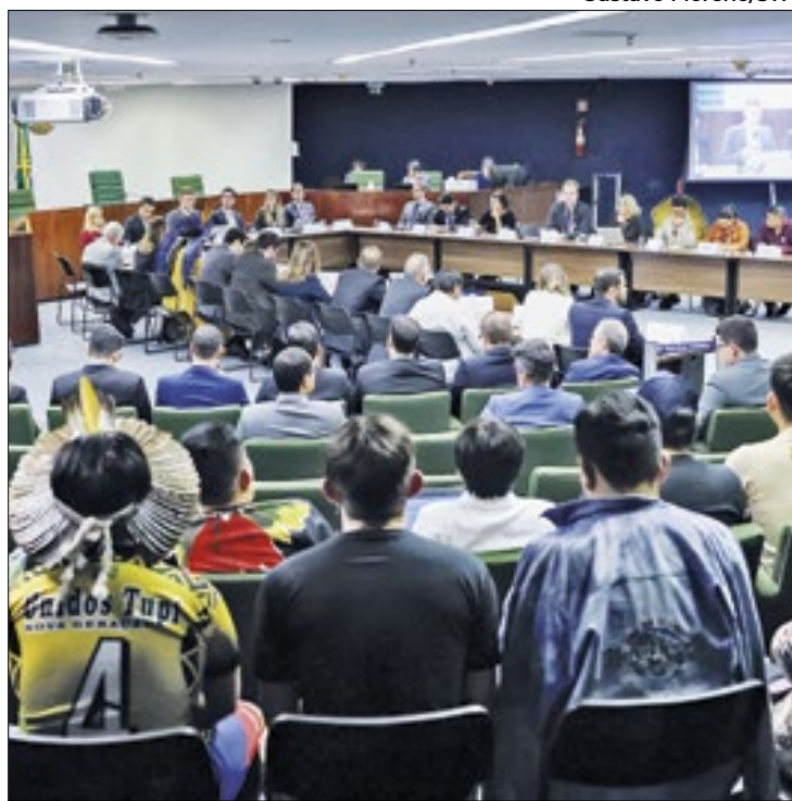
Indígenas reclamam que seus pedidos são ignorados

“Não há garantias de proteção suficiente, pressupostos sólidos de não retrocessos e, tampouco, garantia de um acordo que resgatar a autonomia da vontade dos povos indígenas. Nos colocamos à disposição para sentar à mesa em um ambiente em que os acordos possam ser cumpridos com respeito à livre determinação dos povos indígenas”, continua.