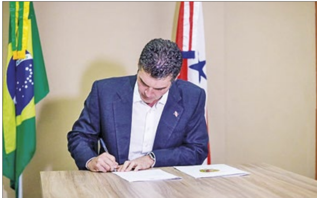
Decisão foi tomada após análise da escassez hídrica e os impactos do fenômeno La Niña

Em julho de 2024, foram registrados 3.300 focos, um aumento de 50% em relação ao mesmo mês do ano anterior.