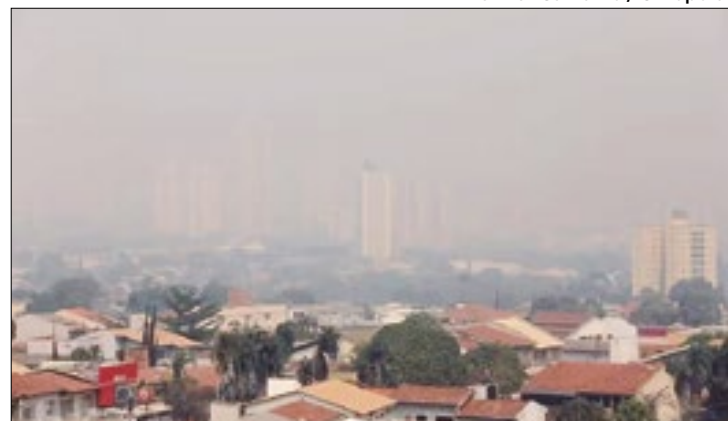
Fenômeno persiste em 30% da atmosfera do estado