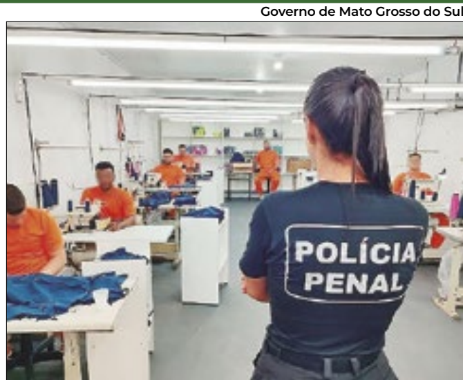
Parcerias buscam ressocialização e negócios

Apesar de ter maioria, posição de Ibaneis Rocha não foi seguida