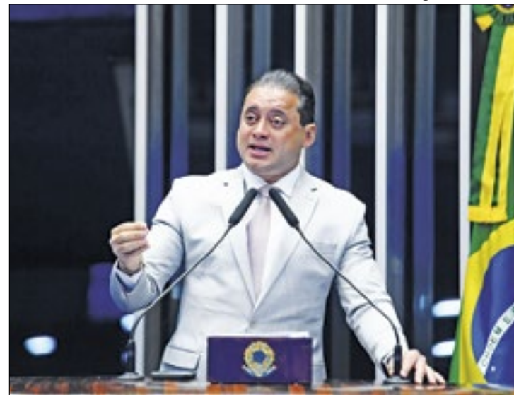
Weverton: projeto "corrige excessos" da Lei da Ficha Limpa