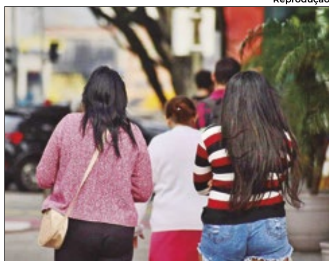
Municípios de Alhandra e Baía da Traição são afetados