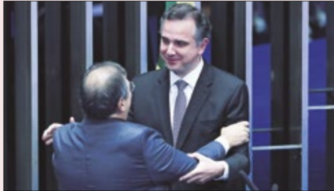
Até os do STF, como Dino, se submetem ao beija-mão