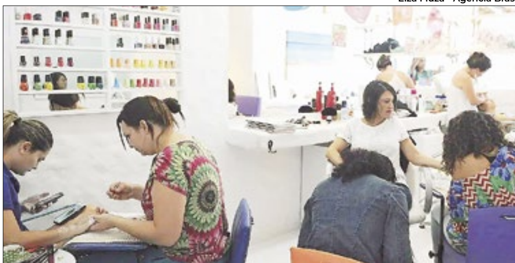
Elza Fiuza - Agência Brasil