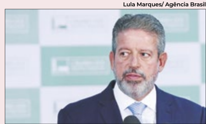
Presidente da Câmara quer evitar derrota