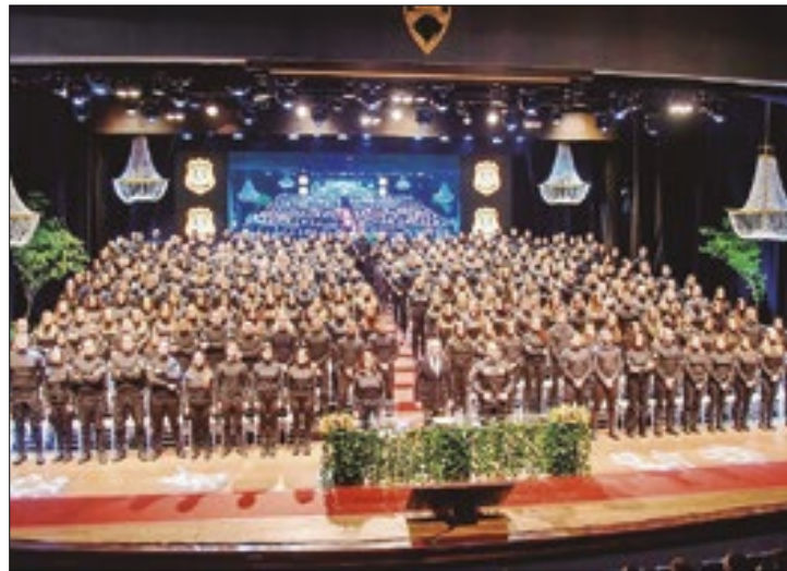
Novos servidores prestaram concurso em 2022

O governo do Estado, por meio da Polícia Penal, realizou, na manhã da última quarta-feira (28/8), no Salão de Atos da Universidade Federal do Rio Grande do Sul (UFRGS), a formatura de 312 novos servidores.