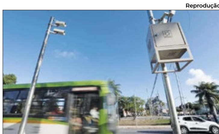
Via Mangue contará com lombadas eletrônicas

De acordo com o secretário de Estado do Desenvolvimento Econômico e da Ciência e Tecnologia, Valmor Barbosa, a iniciativa é parte do compromisso do Governo de Sergipe para o avanço da economia do estado. “Com a colaboração das entidades e órgãos que participaram desta reunião, estamos progredindo para facilitar a declaração de trânsito”, declarou.