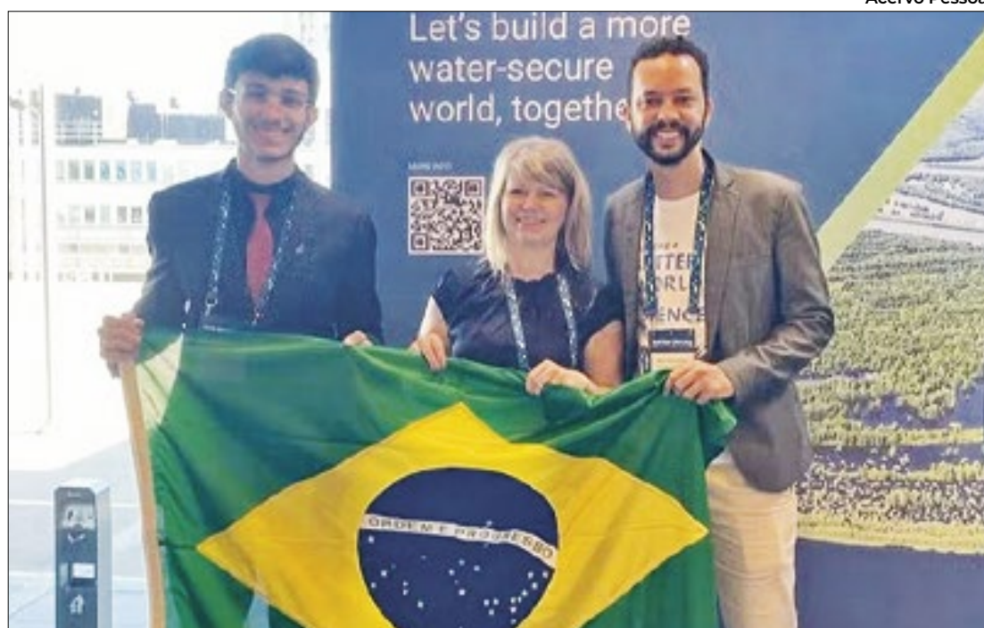
Piauiense representa o Brasil no Prêmio Nobel da Ciência Jovem na Suécia

A ideia do é jovem monitorar a qualidade da água na região