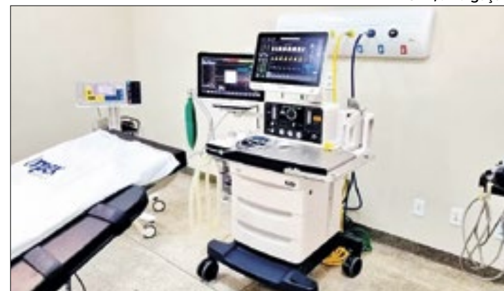
Unidade em Porto Grande oferecerá serviços 24 horas