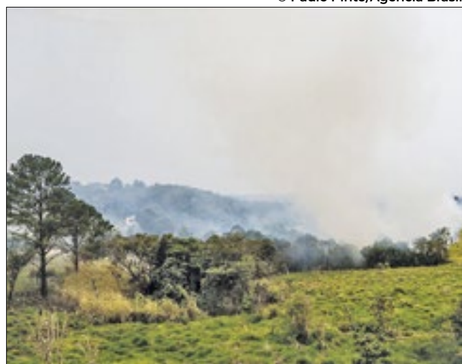
Produtores rurais afetados terão auxílio da Secretaria