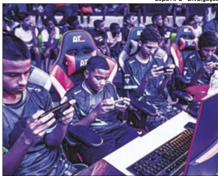
Copa AFG

A competição será na modalidade Battle Royale, com seis quedas que vão definir os vencedores. Os jogos serão disputados na plataforma mobile, desafiando os jogadores a mostrar toda a sua habilidade e estratégia no Free Fire. A Copa contará com dez equipes ferozes, incluindo a lendária AFG eSports de Free Fire, equipe residente do Afro-