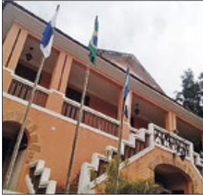
Ação projetará as metas

Moradores, empresários, comerciantes, representantes de entidades e demais interessados poderão comparecer na última etapa do Processo de Elaboração do Plano Diretor Participativo (PDP) de Areal.