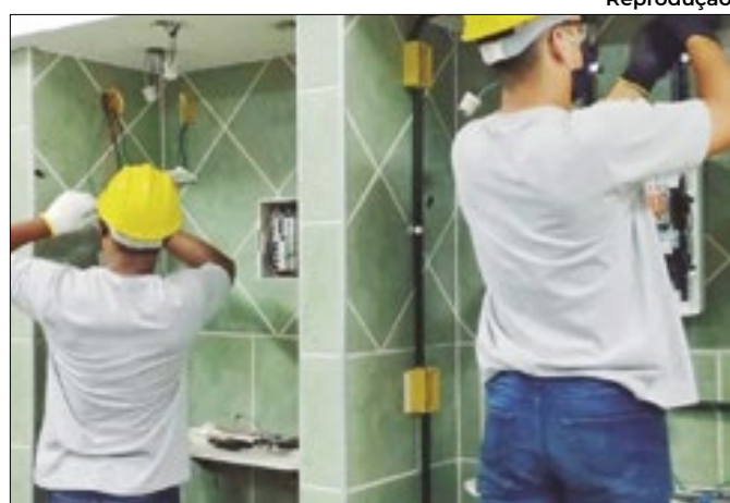
Projeto proporciona cursos voltados a área da Construção