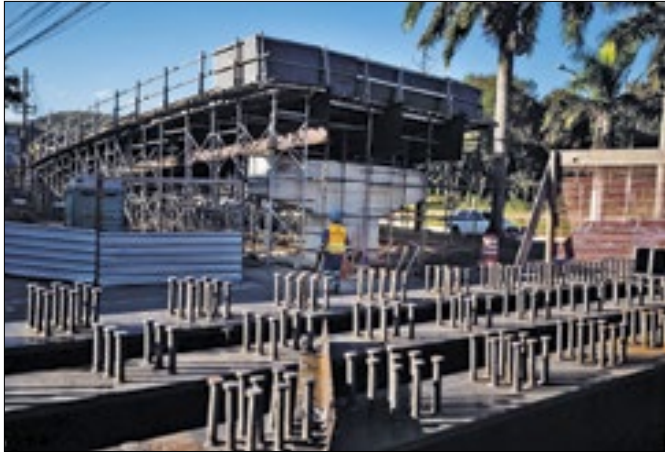
Novas vigas chegaram nessa terça (27)