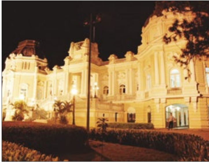
Palácio Guanabara, sede do governo estadual