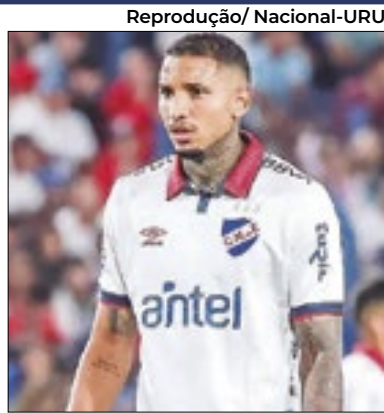
Izquierdo faleceu aos 27 anos

O jogador uruguaio Juan Izquierdo, de 27 anos, atleta do Nacional-URU, morreu na terça-feira (27) em São Paulo. Ele passou mal na noite de quinta (22) durante partida entre São Paulo e Nacional pela Copa Libertadores, no Morumbis. O camisa 3 do Nacional era casado e deixa dois filhos. Ele estava internado na UTI do Hospital Israelita Albert Einstein, para onde foi levado de ambulância direto do estádio. Ele chegou a sofrer parada cardíaca.