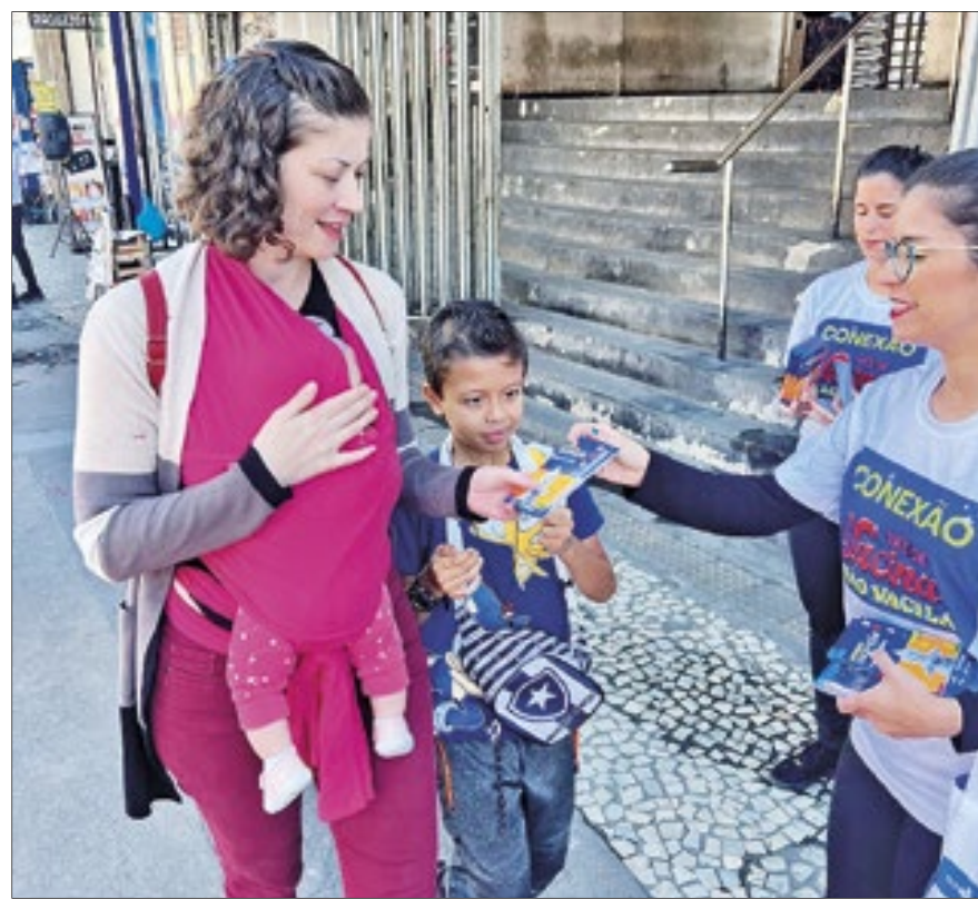
Aceitação da cartilha pela população está sendo alta