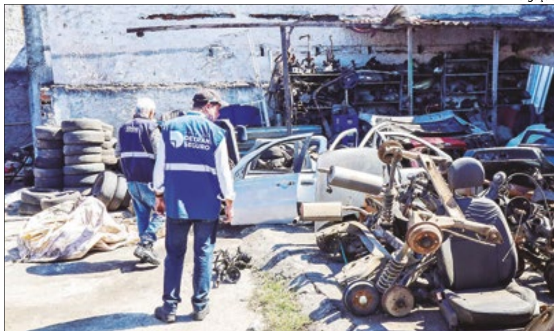
Ferros-velhos na Baixada Fluminense, foram interditados nesta terça-feira (27)

O outro estabelecimento interditado, conhecido como ferro-velho do Abraão, que funcionava na Rua Nilo Peçanha, em Duque de Caxias, também não conseguiu comprovar a origem das peças comercializadas. Além disso, também não estava credenciado no Detran.RJ.