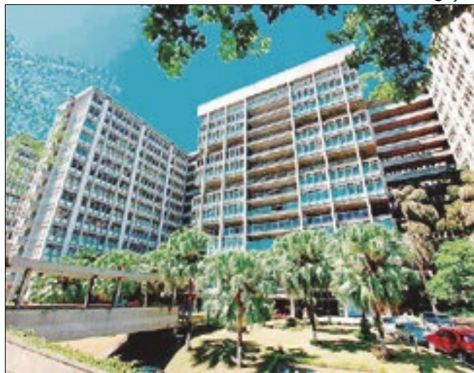
Aporte financeiro vai ajudar universidade estadual