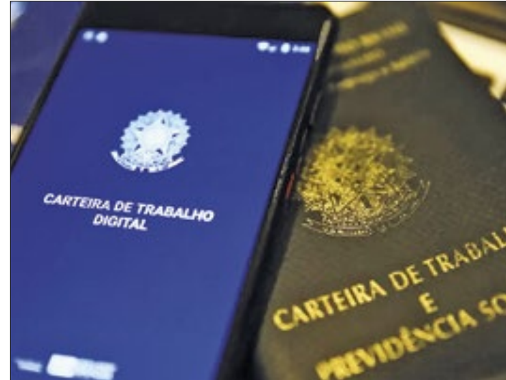
Mais de 10 mil oportunidades foram abertas no Estado