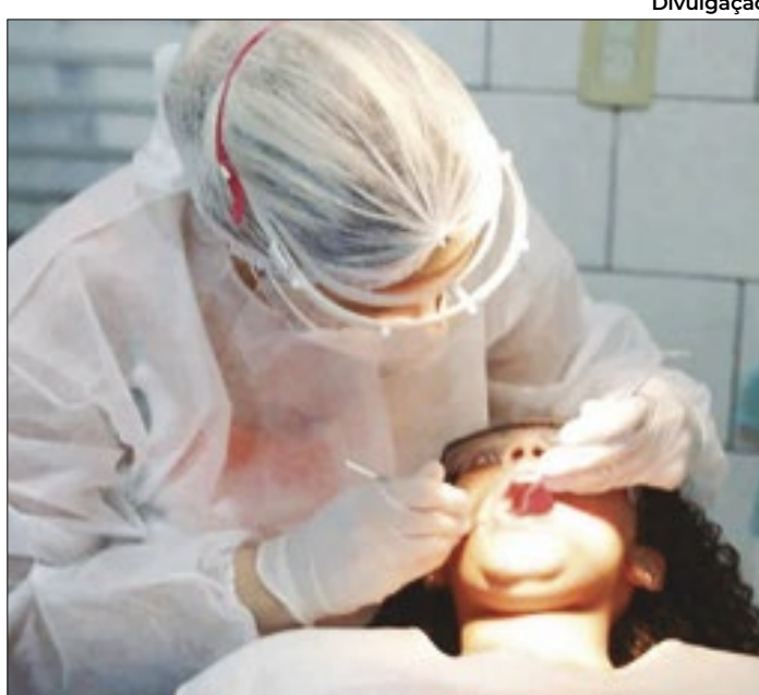
Caxias com serviços de odontologia em mais de 60 unidades

O primeiro atendimento, para quem busca ajuda odontológica, é feito através das redes de Atenção Básica e Atenção Primária da SMS-DC, que incluem as unidades de Estratégia de Saúde da Família (ESF), Unidades Básicas de Saúde (UBS) e Unidades Pré-Hospitalares (UPH), além dos polos de serviços itinerantes. Nessas unidades, o paciente tem acesso aos serviços básicos. Após avaliação odontológica e diagnóstico, o paciente poderá ser encaminhado para dar continuidade ao tratamento em uma das quatro