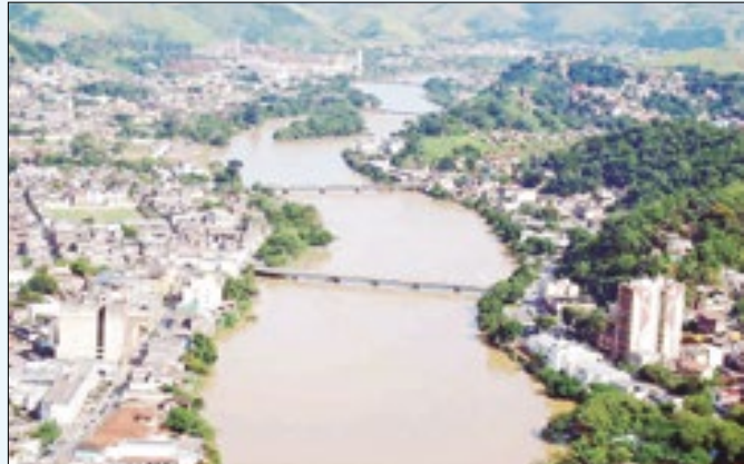
Plano Diretor de Barra Mansa tem nova etapa