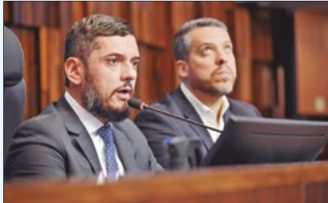
O presidente da Alerj, deputado Rodrigo Bacellar