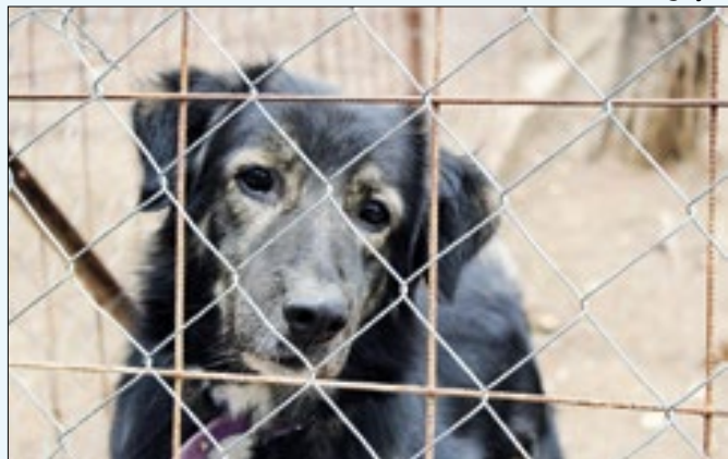
Itens podem ser entregues na Clínica Amigo Bicho