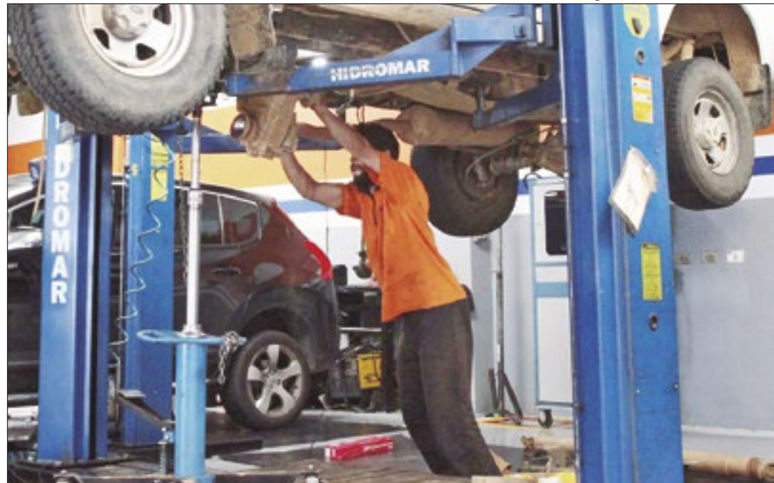
Setor é o verdadeiro motor que mantém atividade em expansão

Já a prestação de serviços não financeiros respondeu pela movimentação de R$ 518,024 bilhões em salários e outras re-