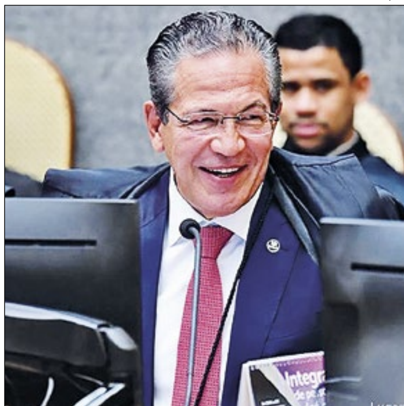
Ministro Mauro Campbell Marques toma posse na próxima terça

■ Jarbas Soares Júnior, procurador-geral de Justiça de Minas Gerais, falou em nome dos Ministérios Públicos estaduais e destacou o ingresso do ministro Campbell na instituição, em 1987. “Os valores constitucionais que deram uma nova conformação ao MP brasileiro foram incorporados pelo promotor de Justiça Campbell, em especial os que atribuem à instituição a missão de funcionar como fiel da balança da ordem jurídica, dos interesses sociais indisponíveis e do regime democrático”, declarou.