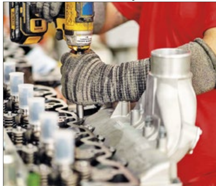
Indústria 'pisa no freio' e sinaliza estabilidade em agosto

Apesar da interrupção do ciclo de altas, o empresário do setor segue com perspectivas positivas relacionadas ao am-