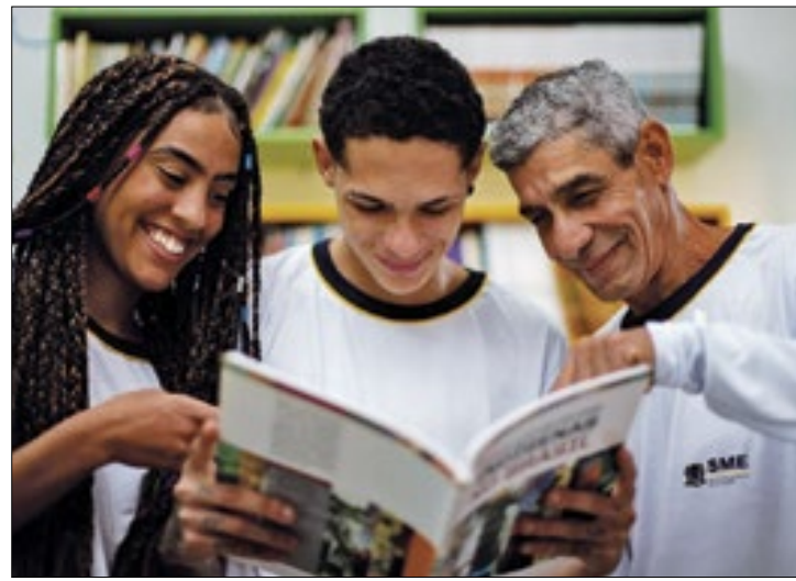
Inscrições da Educação Infantil serão pela internet