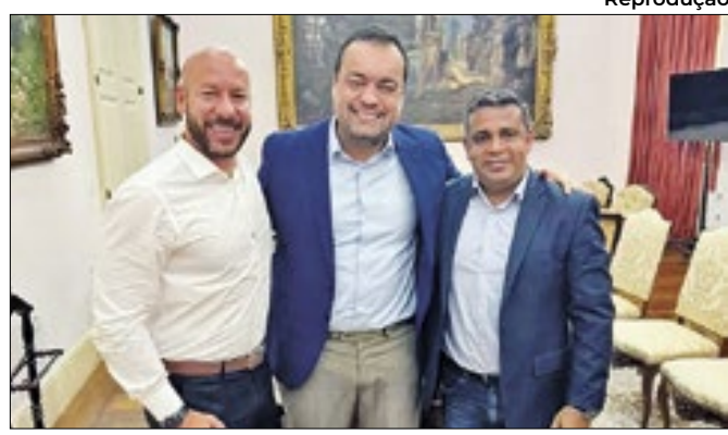
Evento terá a presença do governador Cláudio Castro