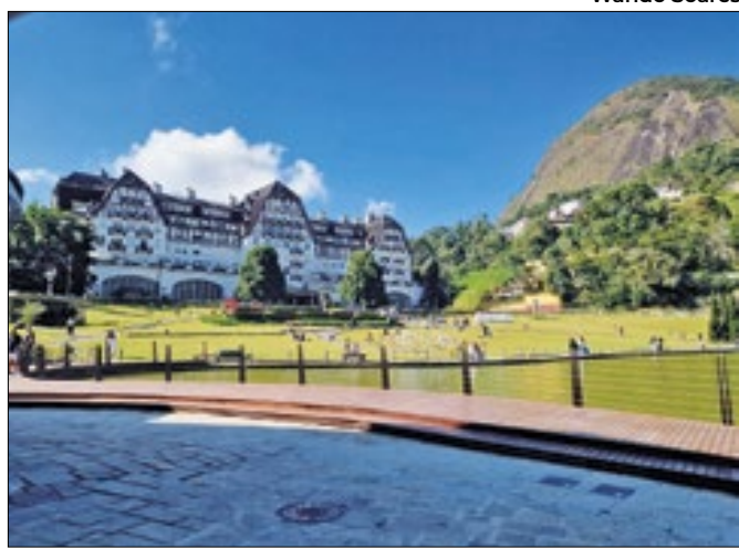
Palácio Quitandinha cartão-postal de Petrópolis