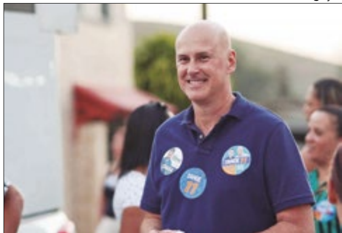
Tande Vieira elenca propostas de governo