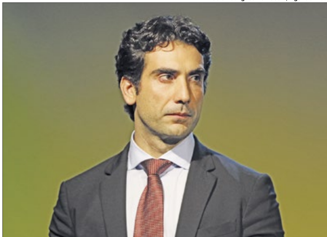
Se aprovado, o economista presidirá o Banco Central por quatro anos

Galípolo irá chefiar o BC por um período de quatro anos a partir de 2025, substituindo Roberto Campos Neto, cujo mandato se encerra no dia 31