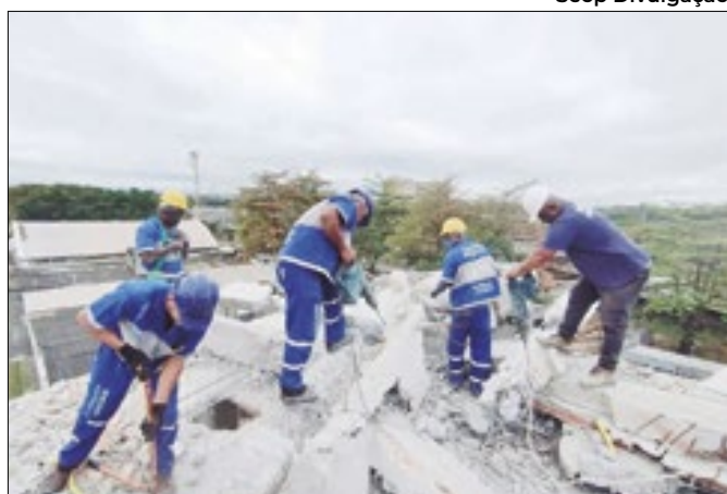
MPF questiona prefeitura sobre paralisação das aulas