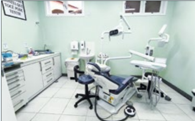
Espaço foi reformado e reaberto nesta semana