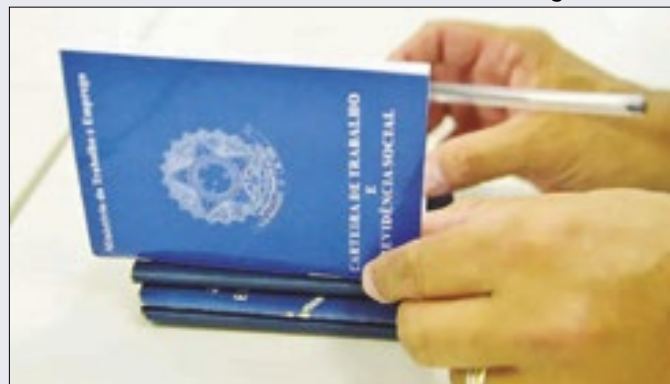
Caged: melhor resultado para o mês, desde 2022