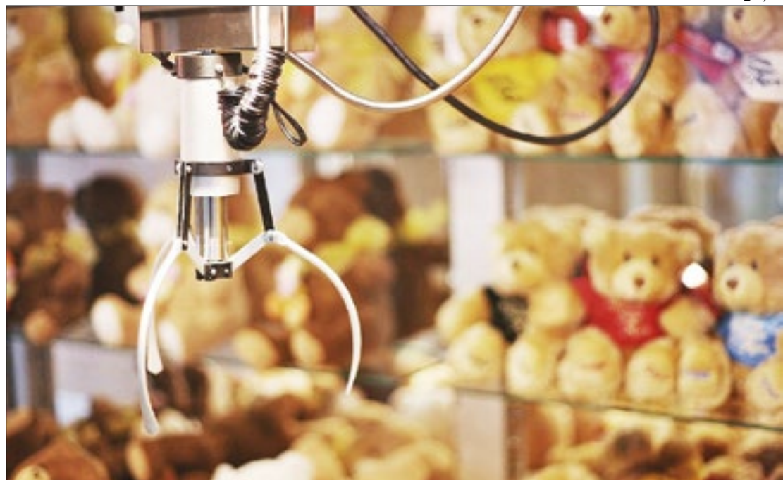
Polícia investiga ligação de fraude em máquinas de pelúcia com o jogo do bicho

"Algumas pessoas foram conduzidas na condição de testemunha, funcionários e técnicos que operavam as máquinas, para entendermos melhor como isso funciona. Também encontramos uma pistola dentro de um dos galpões, de uma gaveta, e estamos fazendo as devidas consultas para saber se é uma arma registrada, com