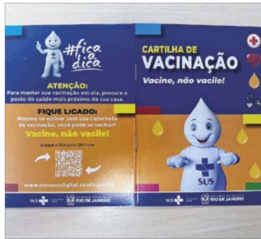
São milhares de cadernetas distribuídas para a população fluminense