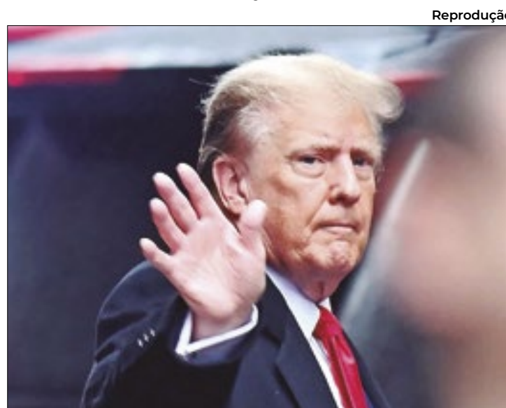
Trump é acusado de tentar reverter as eleições de 2020

Em seu esforço para adequar a antiga ação a esse novo entendimento da lei, os procuradores retiraram a acusação de que Trump tentou pressionar o Departamento de Justiça dos EUA ao agir para impedir a certificação da vitória de Bi-