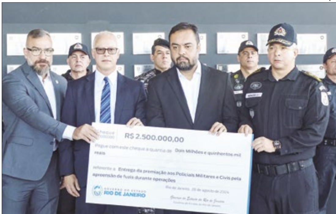
Governador Cláudio Castro premiou policiais militares e civis por apreensão de 500 fuzis

desaparece na fase adulta e, caso a pessoa necessite, deve ter garantida a continuidade da assistência. Não é a idade que faz com que o indivíduo não precise mais de suporte, mas sim o desenvolvimento de determinadas habilidades", justifica o presidente da Alerj, Rodrigo Bacellar.