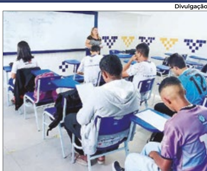
Testes da competição previstos para meados de setembro