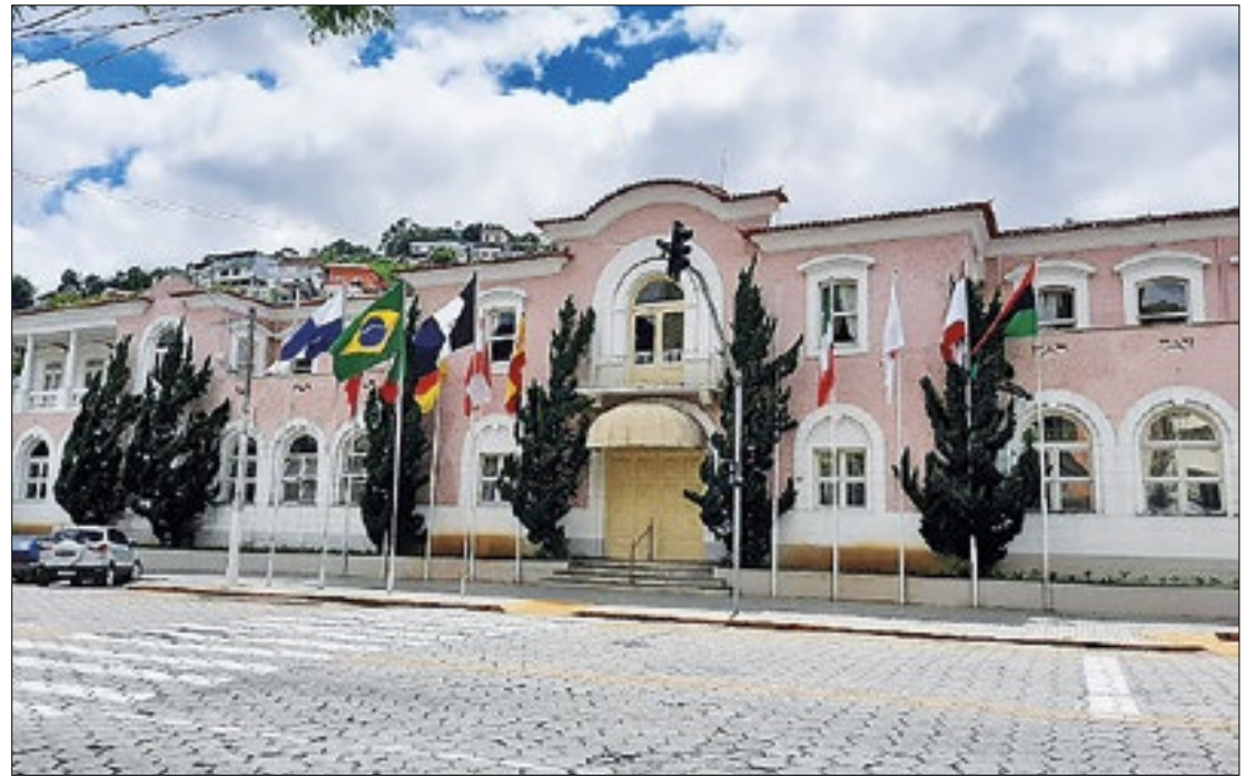
Somados, o patrimônio dos vices candidatos chega a quase R$ 3 milhões

Declarou R$ 224.500,00 em bens para as eleições de 2024. Destes: reais investidos