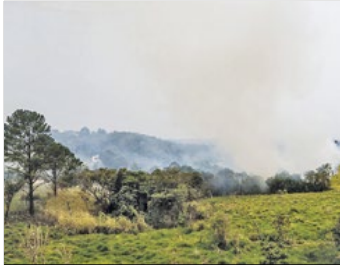
Produtores rurais afetados terão auxílio da Secretaria