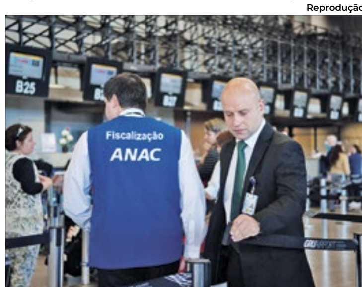
Agência assina acordo com Judiciário para reduzir ações