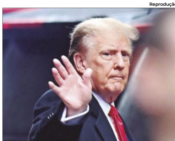
Trump é acusado de tentar reverter as eleições de 2020

Em seu esforço para adequar a antiga ação a esse novo entendimento da lei, os procuradores retiraram a acusação de que Trump tentou pressionar o Departamento de Justiça dos EUA ao agir para impedir a certificação da vitória de Bi-