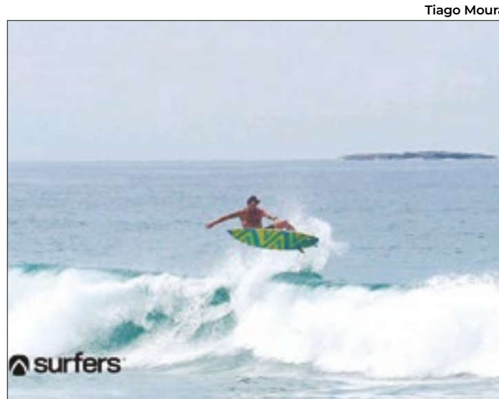
'Surfers' trará atividades de surfe ao Parque Garota de Ipanema