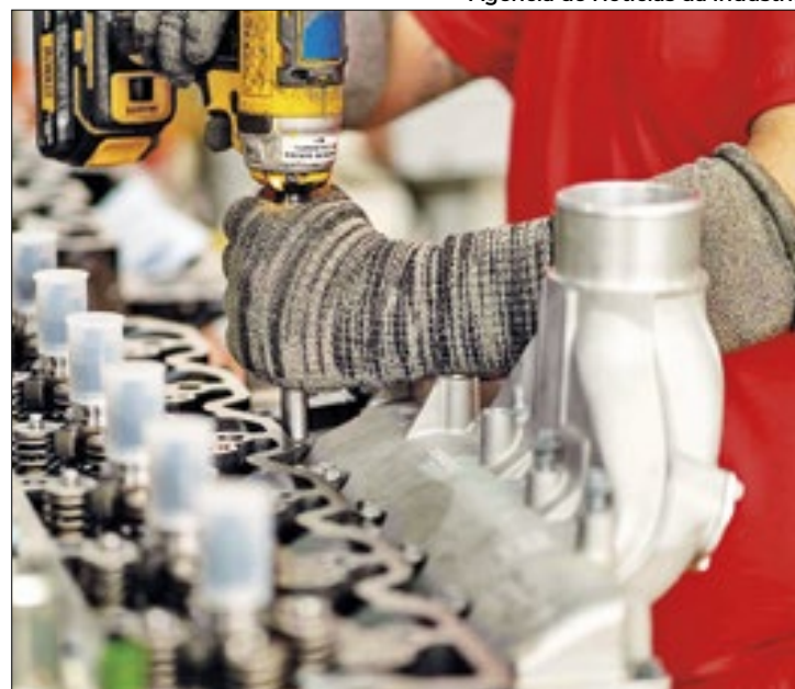
Indústria 'pisa no freio' e sinaliza estabilidade em agosto

Apesar da interrupção do ciclo de altas, o empresário do setor segue com perspectivas positivas relacionadas ao am-