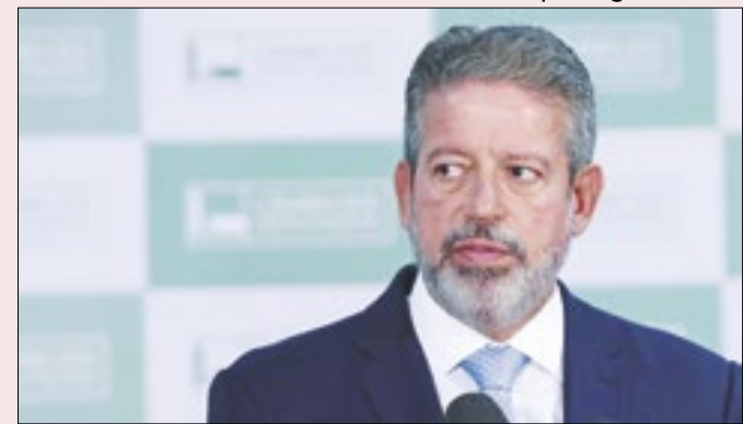
Presidente da Câmara quer evitar derrota