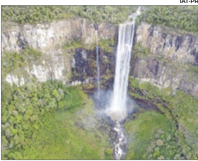
Salto São Francisco, paraíso natural em Guarapuava