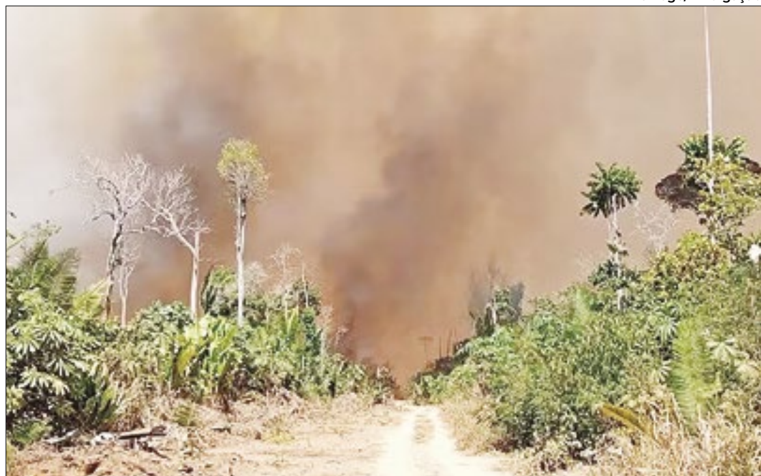
Fogo atinge Parque Guajará-Mirim, localizado em Nova Mamoré (RO)

A fumaça das queimadas se espalhou por 10 estados brasileiros, com origem em áreas protegidas, florestas públicas e fazendas que receberam financiamento rural. A InfoAmazonia, em parceria com o Greenpeace Brasil, sobrevoou