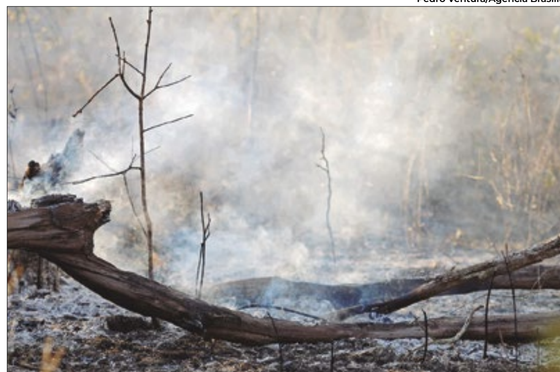
Na terça-feira, Brasília era a segunda cidade mais insalubre do país

Mato Grosso do Sul registrou um aumento de 4% na arrecadação do ITCD (Imposto sobre Transmissão Causa Mortis e Doações) em 2024, com uma média mensal de R$ 40 milhões. Esse crescimento se deve à antecipação de heranças após a Reforma Tributária.