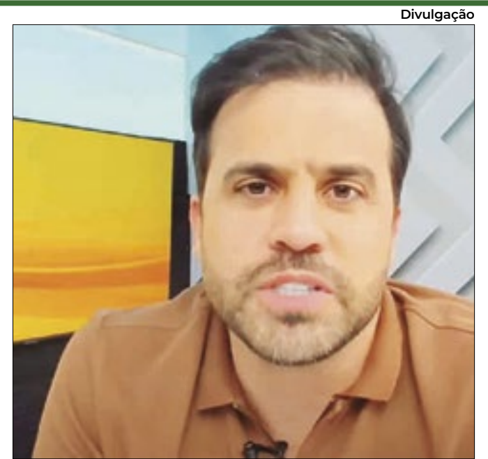
Justiça Eleitoral derruba perfis de Pablo Marçal