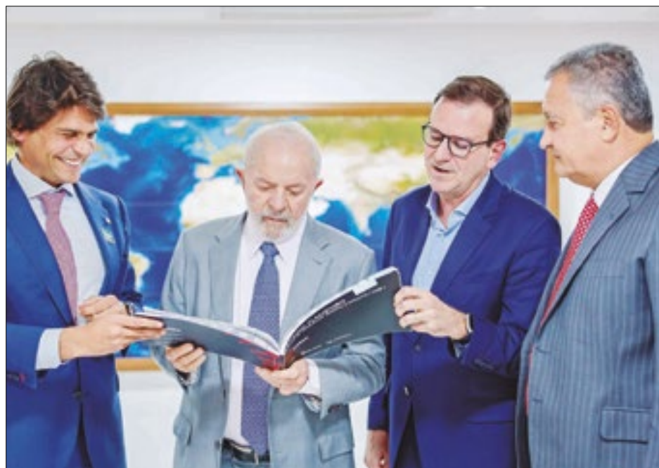
Prefeito do Rio, Eduardo Paes espera ajuda do presidente Lula para destravar estádio do Flamengo