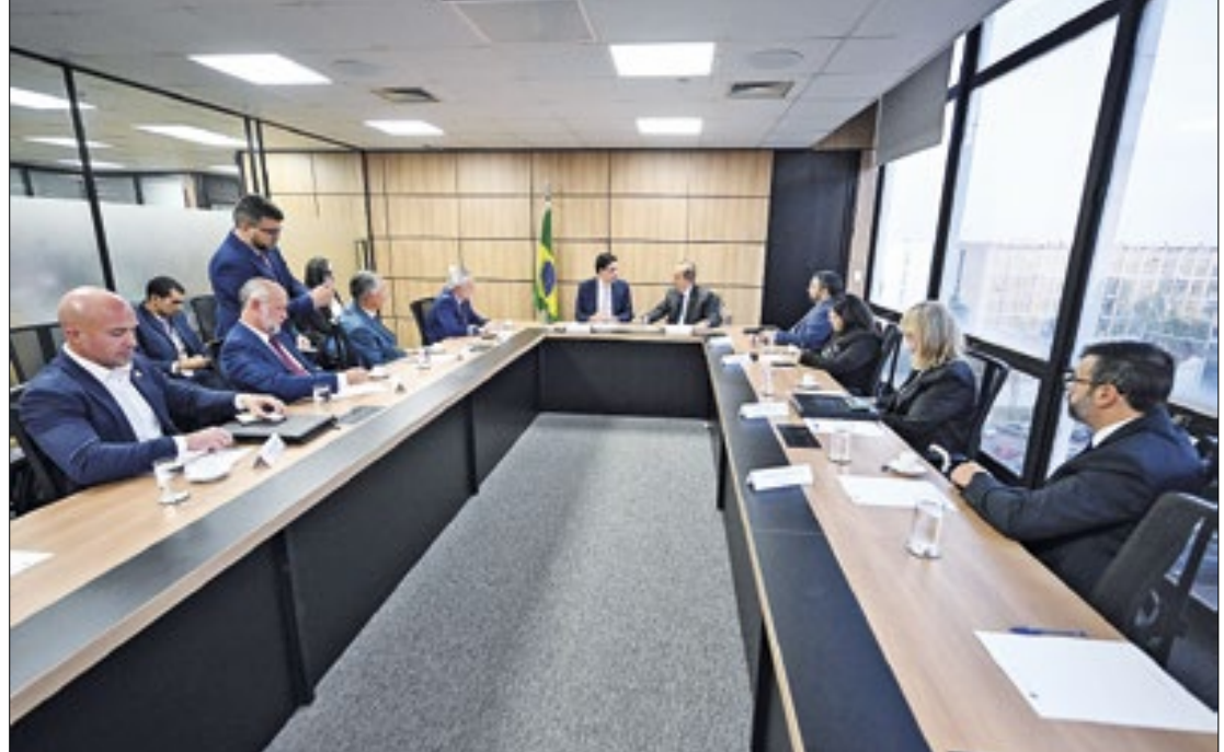
governador Jorginho Mello esteve com o ministro de Portos e Aeroportos Silvio Costa Filho

“A iniciativa busca garantir a eficiência logística e o crescimento econômico de Santa Catarina, não tenho dúvida que vai servir de exemplo para outros portos”, afirmou o governador após a reunião. Para