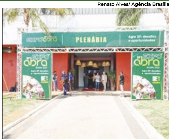
Expoabra 2024 inicia contagem regressiva

Soma da seca com a fumaça dos incêndios foi o fator