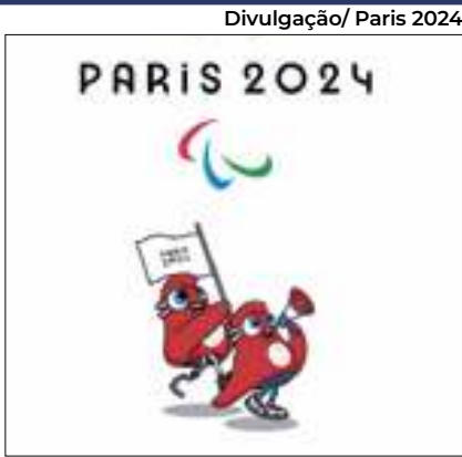
Paralimpíada será exibida em SP