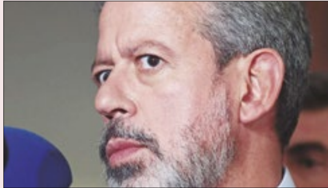
O orçamento é a principal ferramenta de Lira