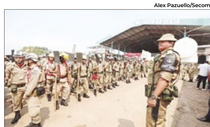
Mais 200 bombeiros chegam para enfrentar os incêndios

O MPF também enfatizou a importância de monitorar e investigar os focos de calor para evitar que a situação se agrave ainda mais.