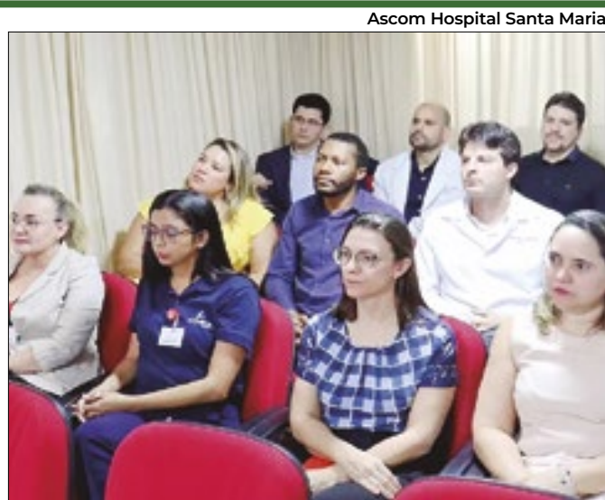
Ascom Hospital Santa Maria

Produtores rurais ampliam uso de energia solar fotovoltaica