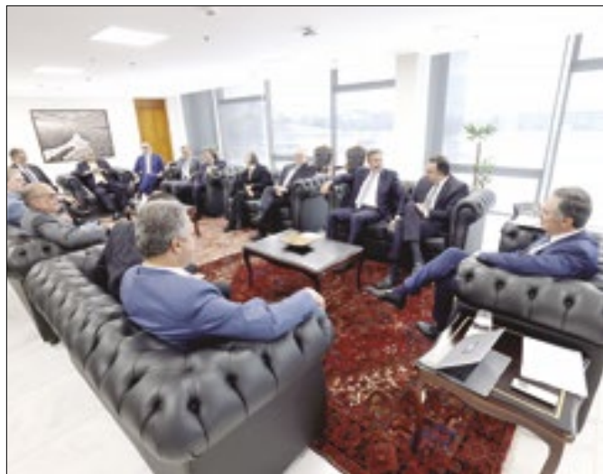
Na prática, o STF suspendeu alguma coisa?