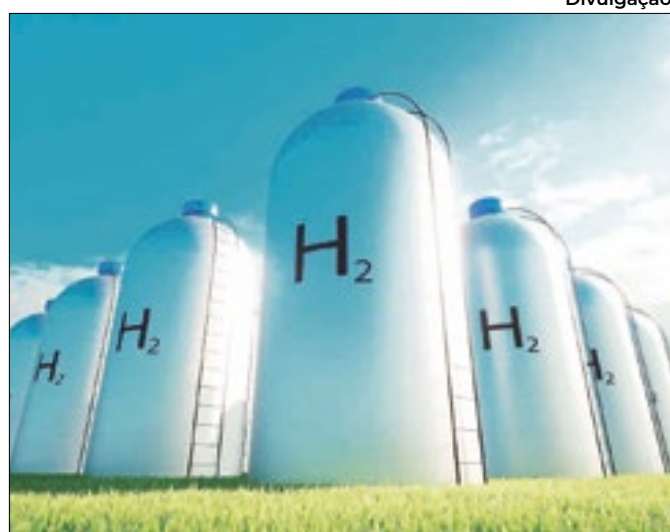
Hidrogênio verde: pela descarbonização da economia