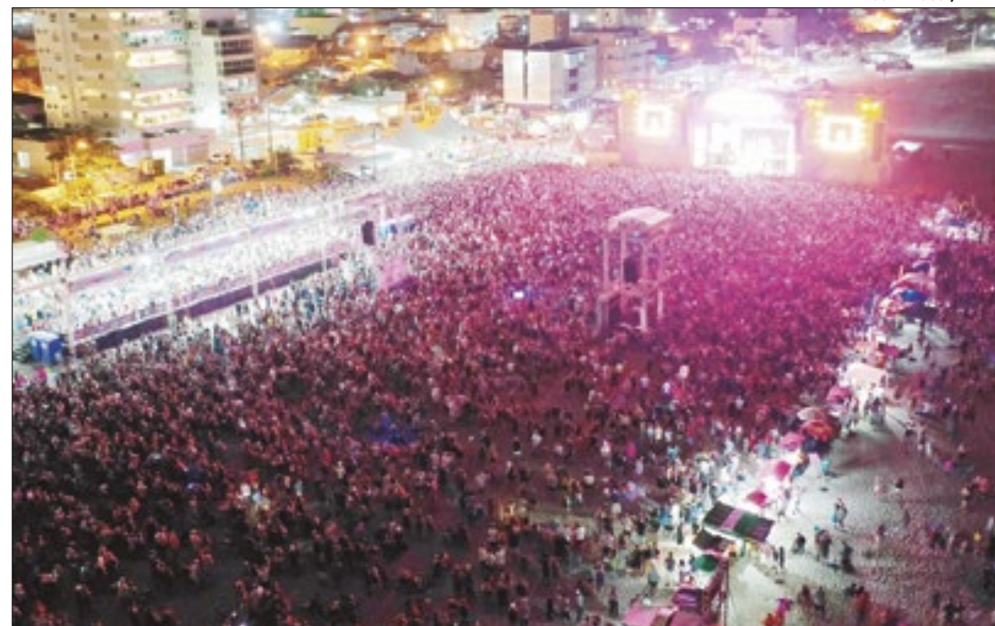
Verão Maior Paraná - Show da dupla Fernando e Sorocaba, em Matinhos.

Em todos os casos, não pode haver cobrança de valores adicionais do consumidor. E o espaço físico do evento deve ter estrutura necessária para assegurar o rápido resgate de participantes, em caso de problemas de saúde e de outras situações de perigo.