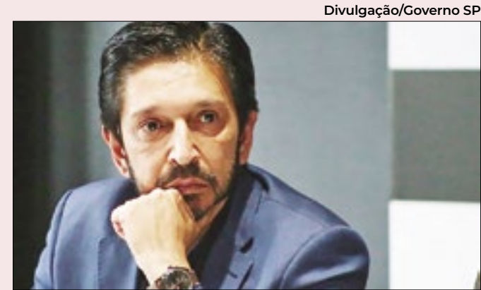
Prefeito de São Paulo: campanha mais agressiva

Informações de Italo Nogueira (Folhapress)