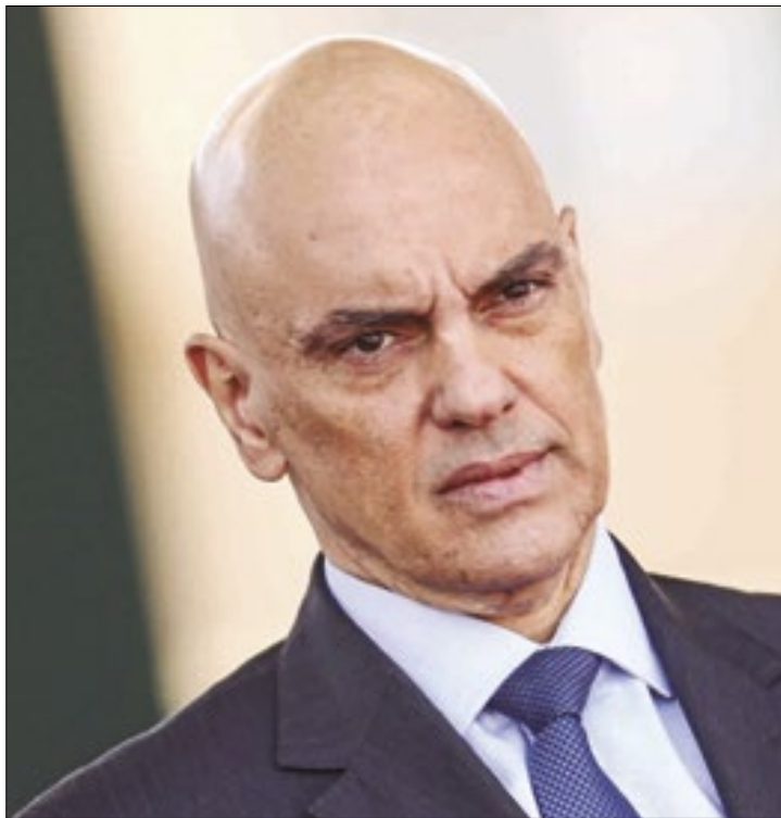
Filho de Moraes teria dado tapa na nuca de empresário

A defesa de Roberto Mantovani, denunciado sob acusação de hostilizar o ministro Alexandre de Moraes e familiares no aeroporto de Roma, afirma que trecho das imagens captadas pelo sistema de vídeo do terminal teria sido suprimido no material anexado ao inquérito. A tal imagem suprimida, dizem os advogados, mostraria o empresário sendo agredido inicialmente pelo advogado Alexandre Barci, filho do ministro do STF, com um “tapa na nuca”.