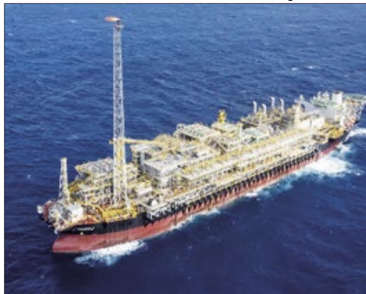
Coelho: chegou a hora de aferir 'apetite' do investidor

Ao lembrar as medidas tomadas, em 2016, com o objetivo de atrair mais players e estimular a concorrência e a decorrente queda do preço final do insumo, Coelho – também ex-secretário de Petróleo, Gás Natural e Biocombustíveis do Ministério de Minas e Energia, além de anos como diretor da Empresa de Pesquisa Energética (EPE) – assinala que "ao invés de propiciar uma abertura maior do mercado, você traz uma intervenção maior no mercado, com a ANP regulando tarifas de escoamento e