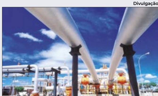
Decreto do gás natural teve má reação do mercado

O hidrogênio de fontes renováveis ou fósseis [captura e estocagem do dióxido de carbono (CO 2 )] é estratégico à descarbonização da economia.