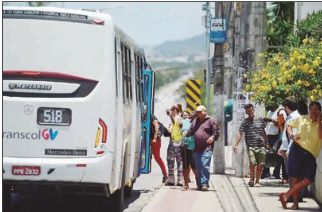
IPCA-15 de agosto teve maior influência da alta do grupo Transportes

Se considerados os últimos 12 meses, a 'prévia da inflação' variou 4,35%, patamar inferior aos 4,45% observados nos 12 meses imediatamente anteriores. Em agosto de 2023,