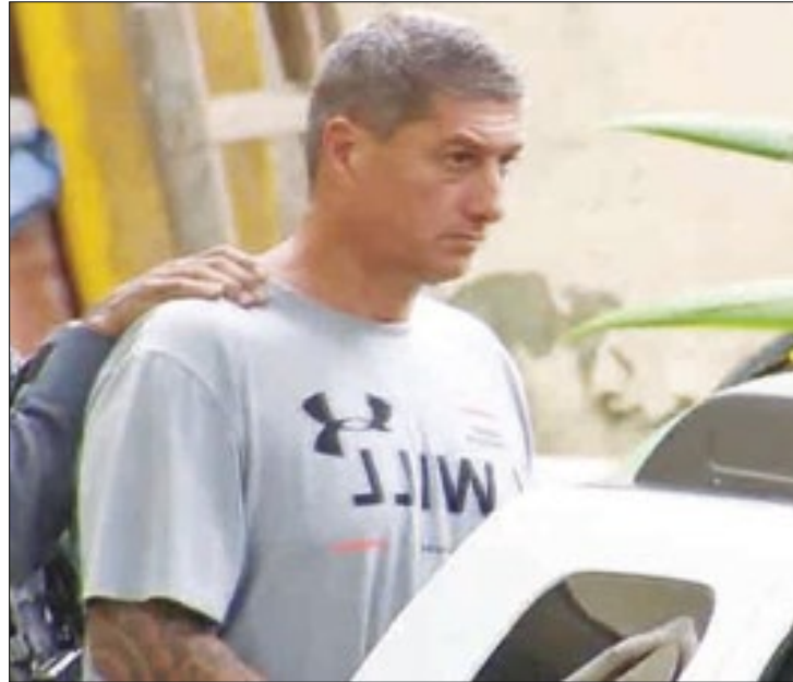
Ex-PM participou de audiência no Supremo Tribunal Federal