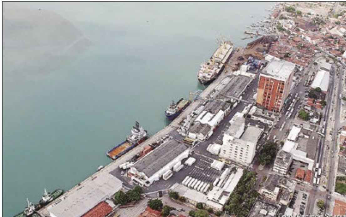
A estimativa foi apontada pela Companhia Docas do Rio Grande do Norte (Codern)

Ainda de acordo com a Codern, além das frutas, o terminal também pretende realizar o embarque de frutas produzidas no Vale do Rio São Francisco, em Petrolina (PE). O Porto de Natal passou por reformas que foram resultado de uma Parceria Público Privada (PPP) com