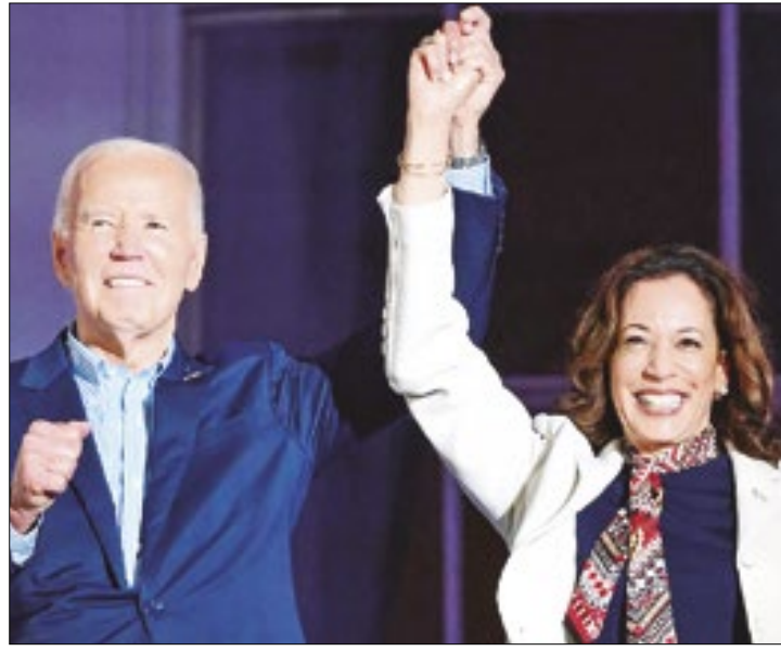
Kamala Harris fez discurso que agradeu sua base eleitoral

O discurso simplificou a corrida em duas oposições: classe média vs. bilionários, e futuro vs. passado.