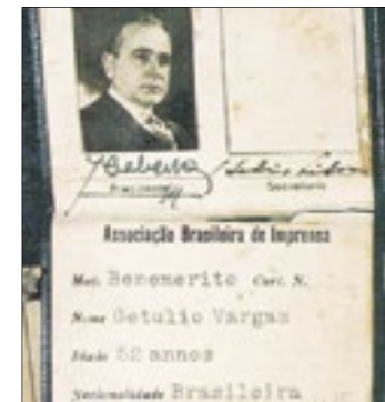
Getúlio Vargas era benemérito da ABI