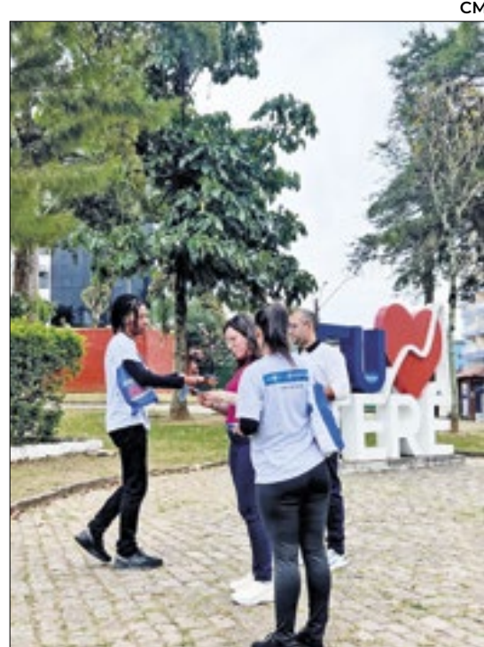
Ação em Teresópolis, na região Serrana

As vacinas são muito seguras! Elas passam por rigorosos processos de testes em várias fases, antes de serem aprovadas para uso e são monitoradas continuamente mesmo após a aprovação. Os países só registram e distribuem vacinas que atendem a rigorosos padrões de qualidade e segurança. As