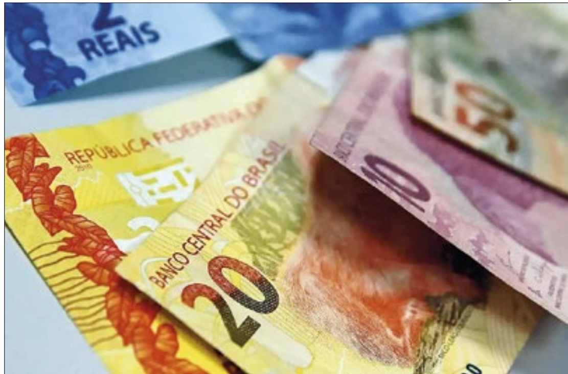
Lançamento do projeto da nova regra fiscal apresentou 'falha congênita'

Como pré-condição de êxito, os formuladores da nova regra fiscal sabiam que a 'sustentabilidade' da proposta requereria adoção de medidas 'duras' e 'impopulares'. Tal perspectiva, acentuam, teria sido perdida, face à previsível resistência da ala política em relação