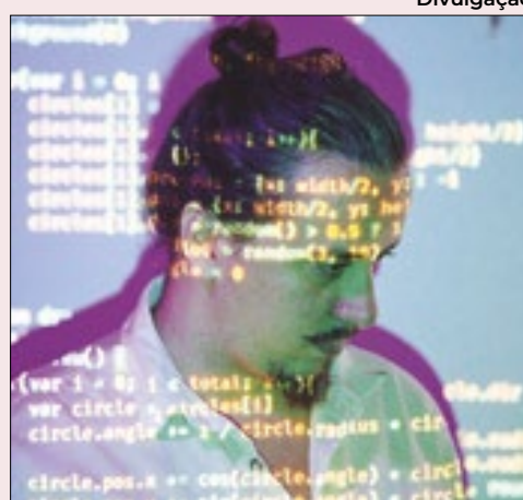
O artista visual Vamoss liberou os códigos de suas obras para permitir a interação dos visitantes em mostra na Meta Gallery