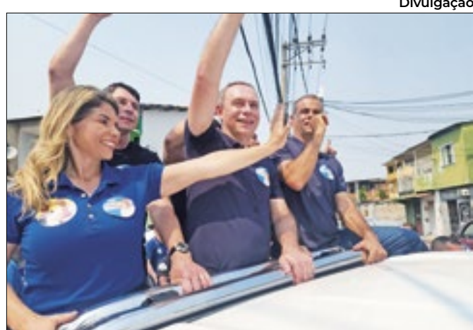
Candidato percorreu ruas da Prata e adjacências