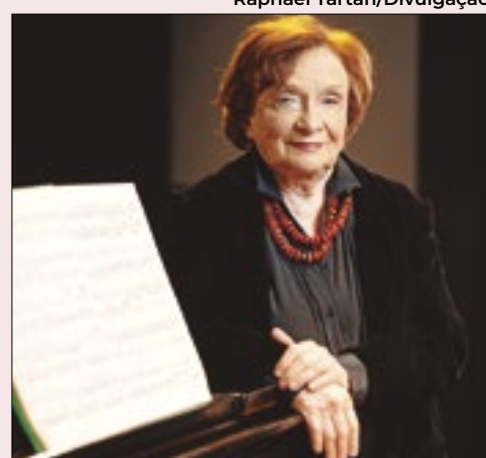
Grande dama do piano brasileiro, Clara Sverner chega aos 88 anos em plena atividade e se apresenta na Sala Cecília Meireles nesta terça