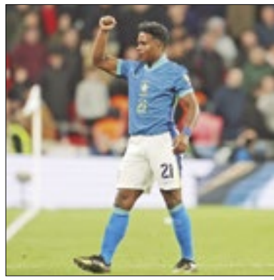
Endrick não jogou no Real Madrid

Carlo Ancelotti voltou a falar sobre a presença de Endrick no time do Real Madrid e garantiu que o ex-palmeirense -convocado por Dorival Júnior para a Seleção Brasileira- terá os minutos que merece. Porém, fez um alerta. “Ele tem qualidades impressionantes e terá os minutos que merece. Mas tem que ter em conta também a competição por espaço que existe nesta equipe”, justificou o treinador italiano Carlo Ancelotti.