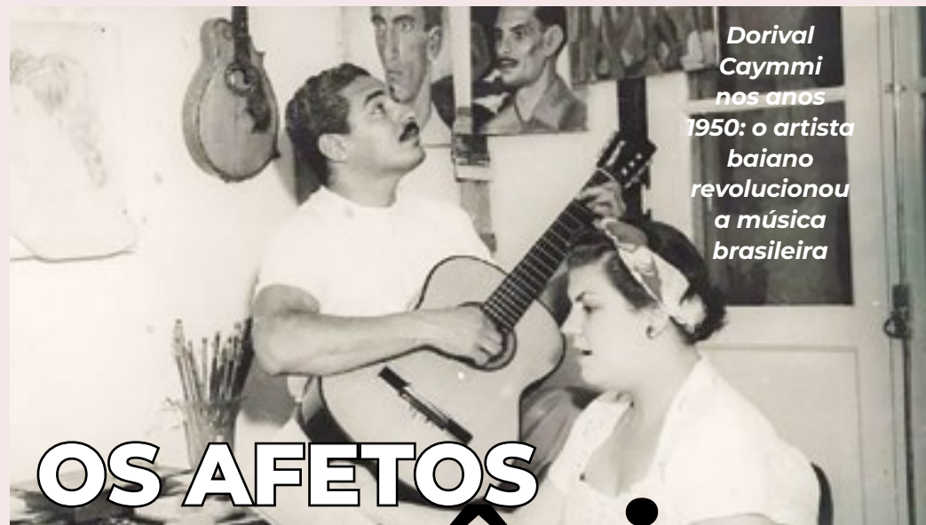
Dorival Caymmi nos anos 1950: o artista baiano revolucionou a música brasileira