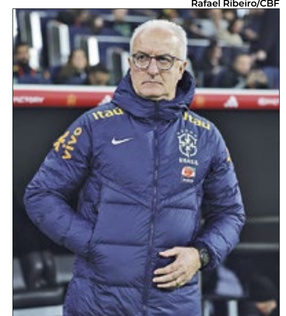
Dorival fez a convocação na sexta