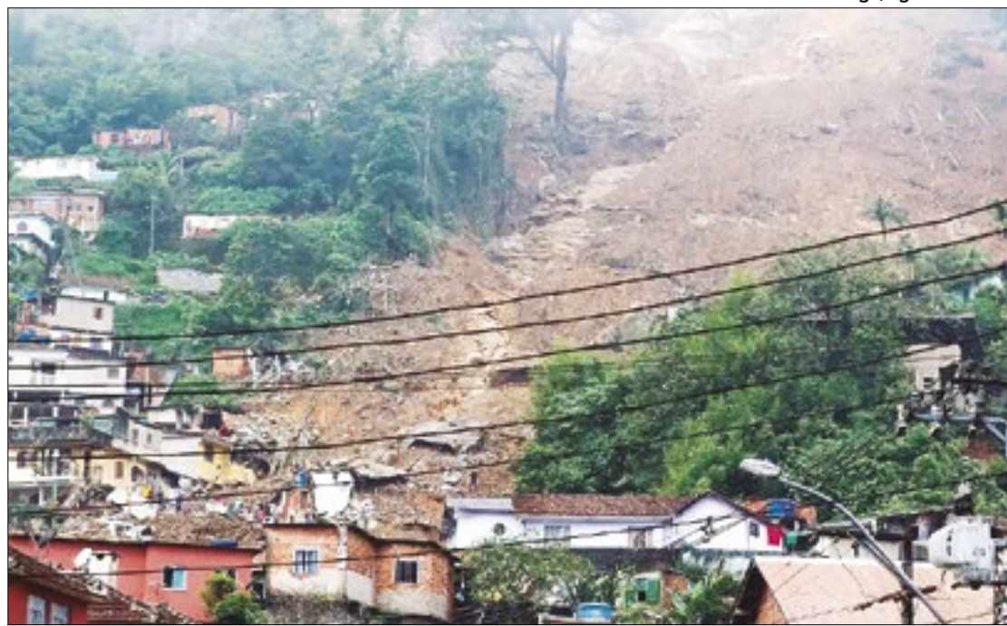
Petrópolis foi escolhida devido ao histórico de tragédias socioambientais

O seminário vai contar com a presença de representantes dos 146 projetos do Plano Integrado de Saúde nas Favelas RJ - Fiocruz/UFRJ/Uerj/PUC-Rio/Uenf/IFF/Abrasco/SBPC/Alerj, iniciativa que já financiou ações que impactaram diretamente e indiretamente aproximadamente 385 mil pessoas, com apoio a segurança alimentar, saúde mental,