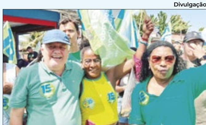
Candidato ouviu população e apresentou compromissos

a produzir mais de 50 milhões de viera no ano, ainda que esses números tenham diminuído nos últimos anos, por conta de alguns problemas, como a dificuldade na produção de sementes.