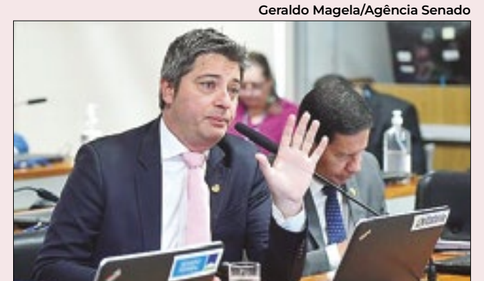
Portinho: leis mais rígidas se portaria não for dura

No caso desses eventos, não há restrição de horários. A adoção desta norma para as bets viabilizaria, por exemplo, alguma forma de propaganda em todas as transmissões de jogos de futebol. O Grupo Globo (associado à MGM) e a Caixa entrarão no mercado das bets.