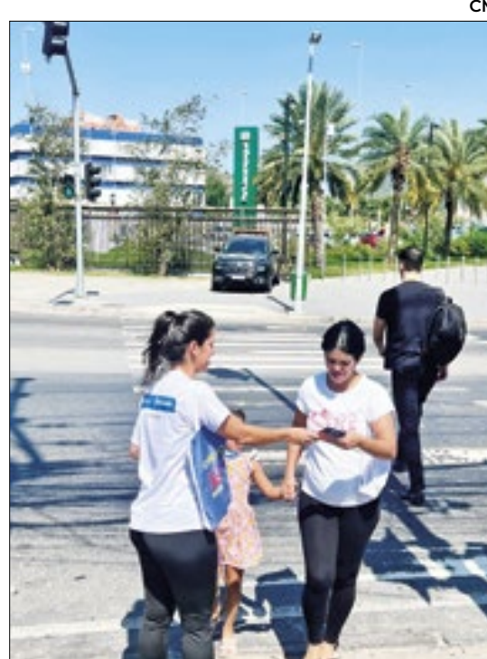
Ação na capital, em Campo Grande

vacinas podem apresentar algumas reações esperadas, sendo a maioria dor ou vermelhidão no local. Reações mais graves são extremamente raras e cuidadosamente monitora-