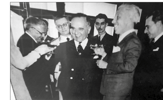
Getúlio Vargas com Herbert Moses, na inauguração da sede da ABI