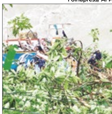
Acidente deixou 27 mortos

Ao menos 27 turistas indianos morreram no Nepal, na sexta (23), após o ônibus no qual viajavam cair em um rio ao lado de uma rodovia. Segundo Janardan Gautam, funcionário do distrito de Tanahun, havia 43 pessoas a bordo. Os socorristas retiraram 22 pessoas das águas do rio Marsyangdi, a cerca de 120 km de Katmandu. Dessas, 12 ficaram gravemente feridas e foram de avião para a capital. Ao menos seis pessoas morreram no hospital.