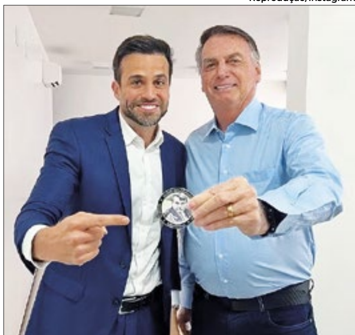
Bolsonaro, que apoia Nunes, tenta se afastar de Marçal