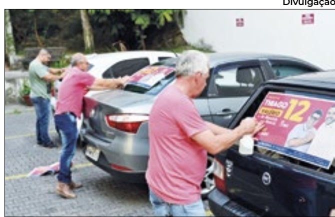
Comitê de campanha adesiva carros em Barra Mansa