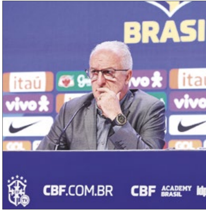
Dorival Júnior convocou jogadores do futebol brasileiro

Três atletas convocados por Dorival defendem clubes ativos na Copa do Brasil: Guilherme Arana (Atlético-MG), Gerson e Pedro (ambos do Flamengo) são titulares de suas equipes e presenças esperadas para os jogos de volta das quartas. O Galo receberá o São Paulo, e o Rubro-Negro enfrentará o Bahia em casa. Ambos os de-