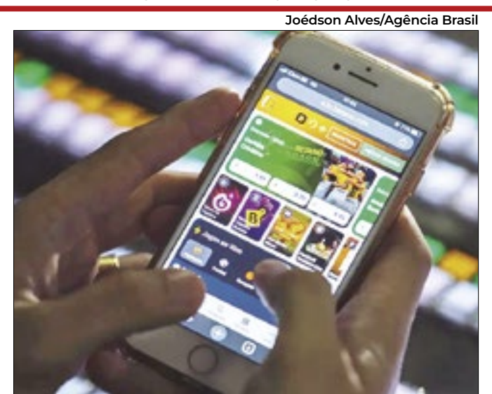
Portaria deve limitar horário de publicidade em TVs