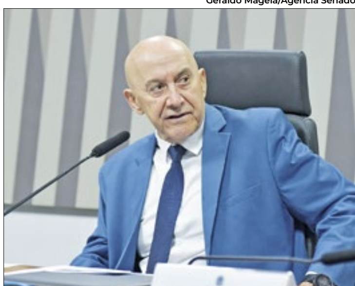
Confúcio: LDO terá que ser adaptada às novas regras

Outra emenda é do deputado Ivan Valente (Psol-SP) que implementa o Imposto sobre Grandes Fortunas (IGF), classificadas como o conjunto de bens que passe de R$ 10 milhões. A proposta determina que o tribu-