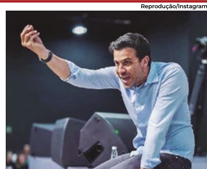
Empresário na frente entre evangélicos