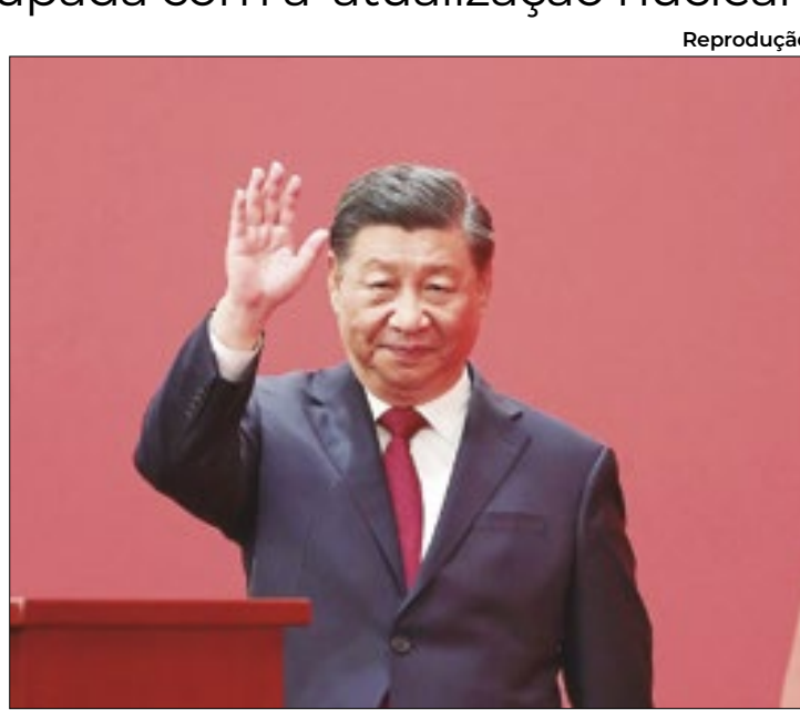
Reprodução Xi Jinping afirma que arsenal nuclear é apenas preventivo

Segundo os especialistas, há preocupação com o crescente arsenal chinês, que segundo o