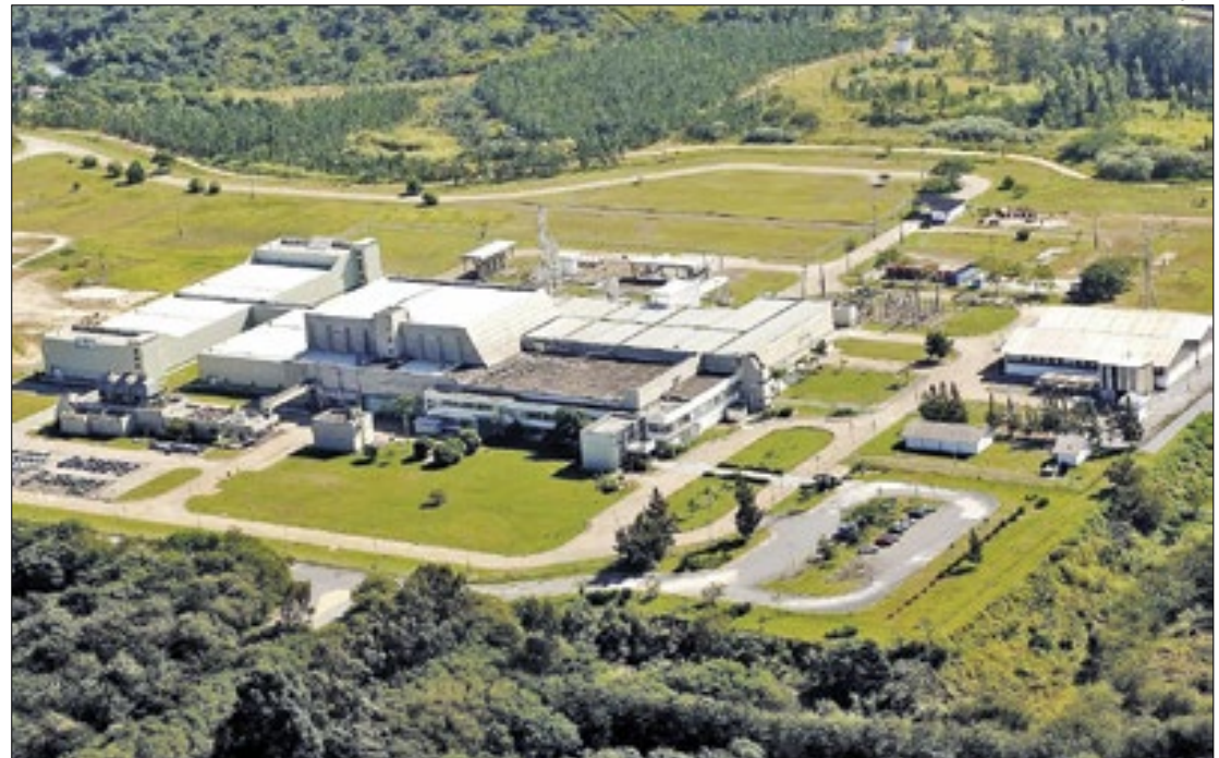
Fábrica de Combustível Nuclear da INB faz pesquisas em áreas com potencial mineral

Da mesma forma, o preço do urânio mais que triplicou nos últimos anos, trazendo