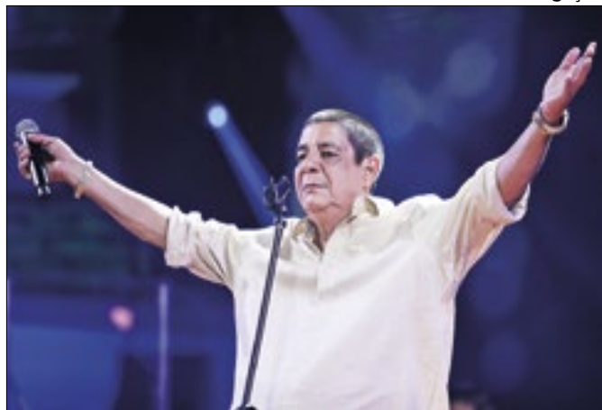
Zeca Pagodinho receberá grande honraria da Alerj