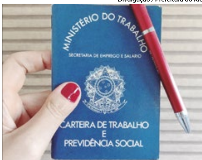
Vagas nas regiões Metropolitana, Médio Paraíba e Serrana