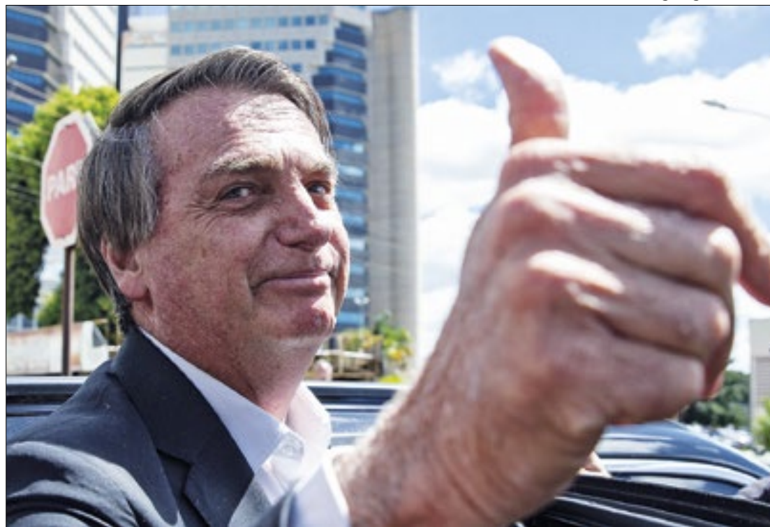
Mudança na Lei da Ficha Limpa pode recolocar Bolsonaro no páreo em 2026

Em sua justificativa, o relator da medida defendeu que o