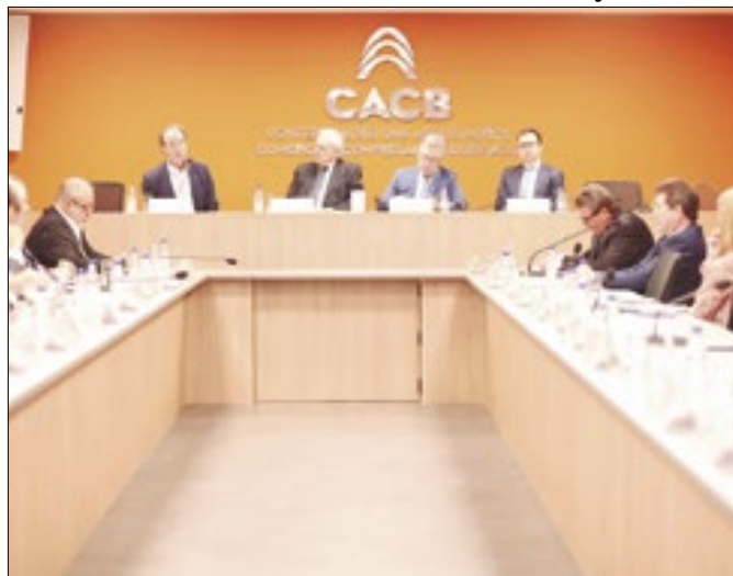
Debate discutiu riscos para o Simples na tributária