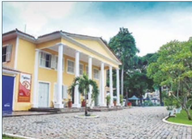
Sesc Barra Mansa é uma das unidades do projeto