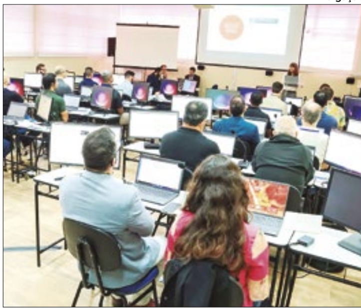
Evento reforçará a cultura de segurança no setor nuclear