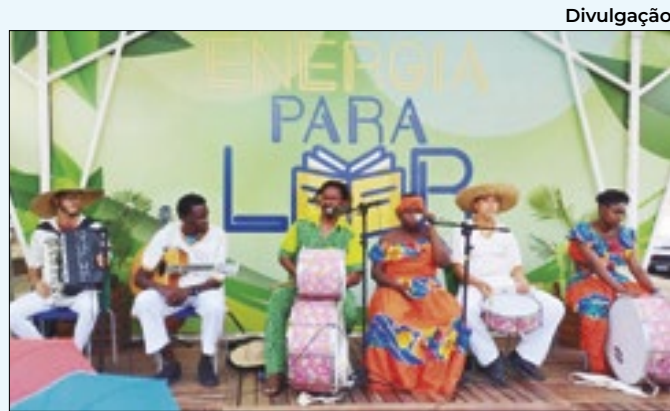
Evento terá programação com 10 horas diárias

projeto. “Tenho certeza que esse espaço vai transformar a vida de muitas famílias oferecendo atendimento de qualidade e promovendo a inclusão”, afirmou.