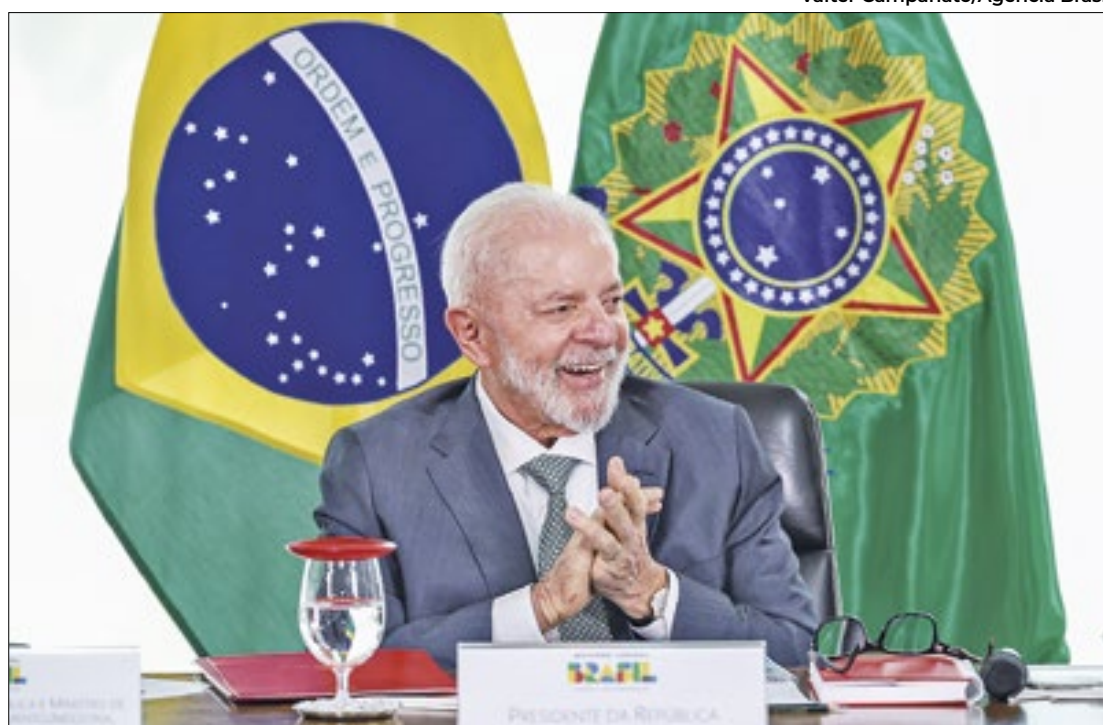
Lula comemorou o entendimento entre os poderes, a partir da reunião promovida no STF

Pouco antes de a cerimônia desta quarta começar, o ministro