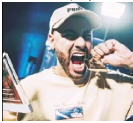
Neymar foi campeão de E-Sports

Fora dos gramados enquanto se recupera de lesão no joelho, Neymar participou da Copa do Mundo de E-Sports, na Arábia Saudita, que possui partidas exclusivas para celebridades. O atacante do Al Hilal foi campeão. Neymar jogou Counter-Strike 2, Rocket League e Tekken 8, e se sagrou campeão do duelo de celebridades após vencer Mossad Msdosary, campeão mundial de FIFA 18, no Tekken.