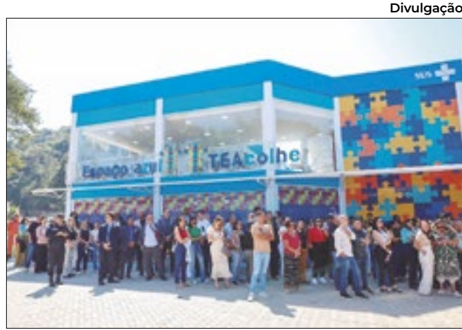
Centro permite o atendimento de 214 pessoas