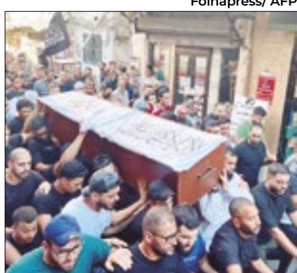
Israel matou o líder Khalil al Maqdash

Um ataque aéreo israelense matou o líder do braço armado do Fatah, no sul do Líbano, na quarta (21). O movimento palestino, rival do Hamas, acusou Tel Aviv de querer desencadear um conflito regional derivado da guerra na Faixa de Gaza. É a primeira vez desde o início da guerra que Israel mata um alto dirigente do Fatah, partido de Mahmoud Abbas, presidente da Autoridade Nacional Palestina, que gere a Cisjordânia.