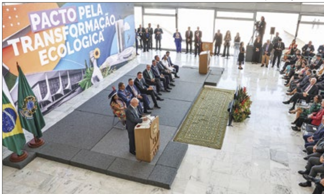
Pacto envolve compromissos dos três poderes

Os objetivos do pacto assinado nesta quarta, segundo o documento, são a sustentabilidade ecológica, o desenvolvimento econômico sustentável, justiça social, ambiental e climática. Há também considerações sobre os direitos das crianças e gerações futuras e a resiliência a eventos climáticos extremos.