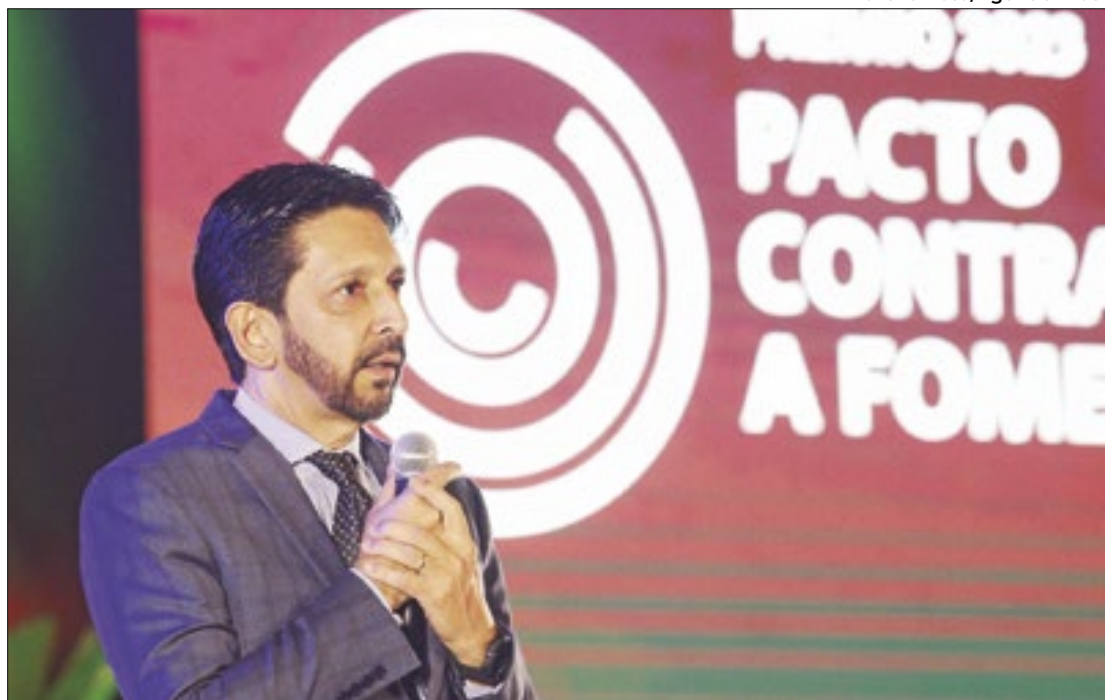
Ricardo Nunes pode ficar desidratado pela ascensão de Marçal

O AtlasIntel entrevistou 1.803 eleitores da Cidade de São Paulo, com idade a partir de 16 anos, entre os dias 15 e 20 de agosto. A pesquisa apresenta uma