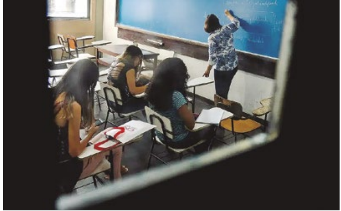
Descaso e constrangimento: cidades da Baixada estão abaixo da meta estabelecida pelo Ideb