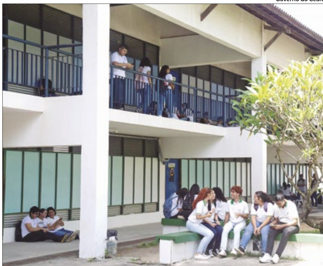
Escola de tempo integral no Ceará: nota 10 no Ideb, junto a outras mais de 60

No Ideb 2023, 21 escolas municipais atingiram a nota máxima do indicador, que varia de 0 a 10. A cidade de Sobral (CE) reúne cinco das unidades com média 10 no Ideb. Mucambo, Pires Fer-