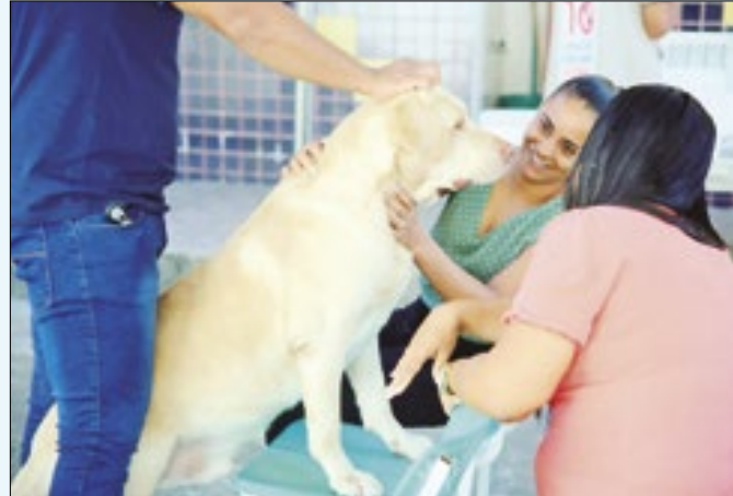
Magé imunizou cães e gatos em toda a cidade