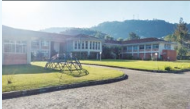
Colóquio acontecerá no LNCC, no Quitandinha