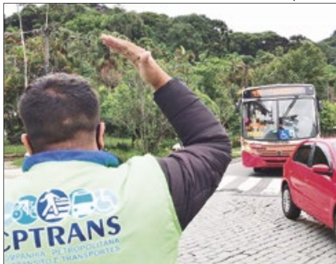
Concurso abriu 73 vagas para diferentes setores