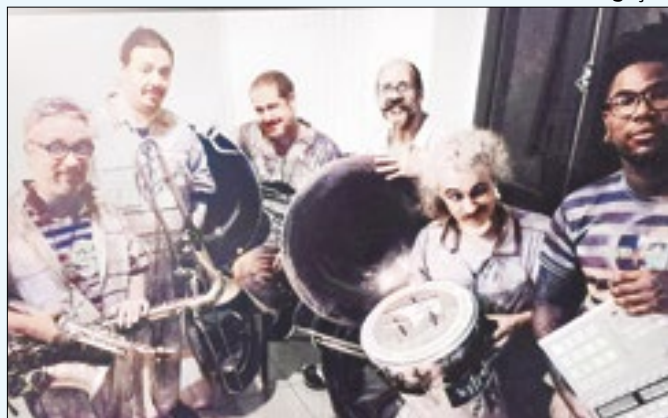
Programação especial vai das 12h às 17h, no Pechincha