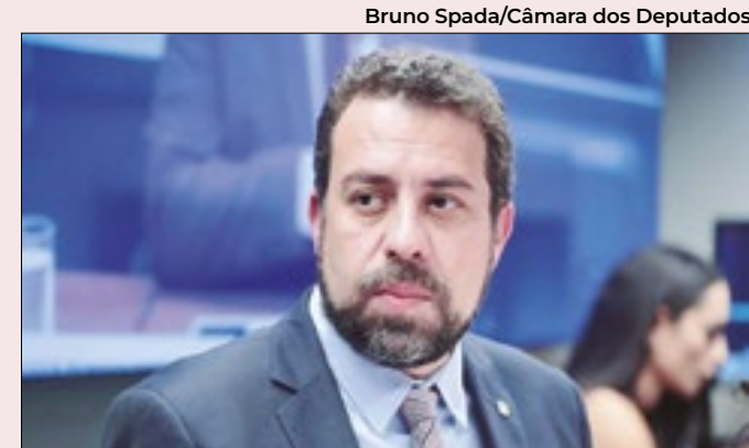
Guilherme Boulos lidera a nova pesquisa