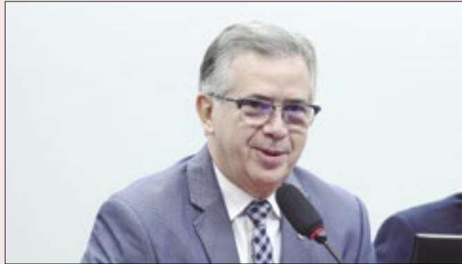
Passarinho: visão da Fazenda tem que ser mais ampla