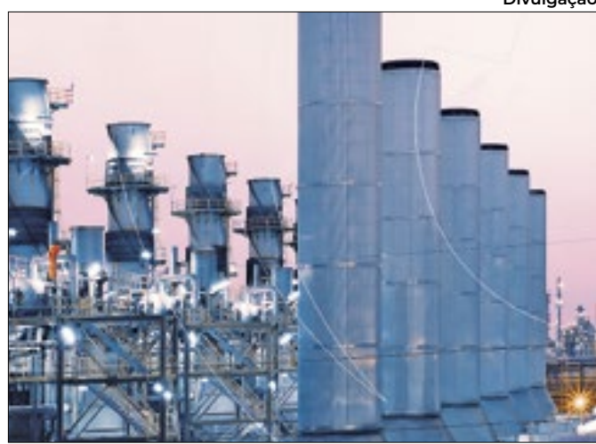
Divulgação Volume baixo de reservatórios aciona térmicas de novo