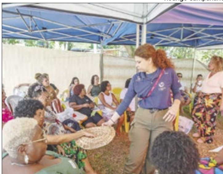
Nova campanha tem foco na sensibilização ambiental