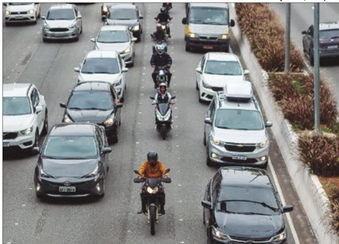
Motofaixa está valendo, ainda que de forma experimental, desde a segunda-feira (19)

A Prefeitura do Rio anunciou a operação da primeira motofaixa preferencial na cidade do Rio de Janeiro. Ela começou a ser demarcada na última segunda-feira (19). O modelo será adotado, ainda de forma experimental, no sentido Lagoa da Autoestrada Engenheiro Fernando Mac Dowell, popularmente conhecida como Lagoa-Barra. A velocidade máxima permitida nessa pista especial será de R$ 60 Km/h.