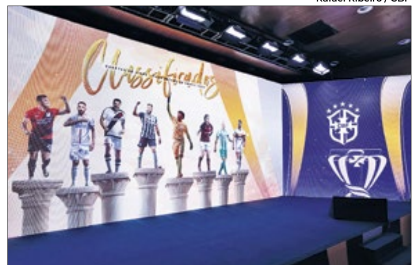
Vasco e Flamengo só vão se enfrentar em possível final

A CBF realizou o sorteio das quartas de final da Copa do Brasil. Pelo chaveamento do torneio, Vasco da Gama e Flamengo só vão se enfrentar numa possível final do torneio. Porém, o caminho para chegar lá não será fácil. O Cruzmaltino enfrentará o Athletico-PR, enquanto o Rubro-Negro vai enfrentar o Bahia de Éverton Ribeiro. Para o Vasco, há um tabu em jogo, já que a série será definida na Arena da Baixada, onde os cariocas jamais venceram. Já o Fla, que não vive boa fase, decidirá no Maracanã. Será que o Clássico dos Milhões vem aí?