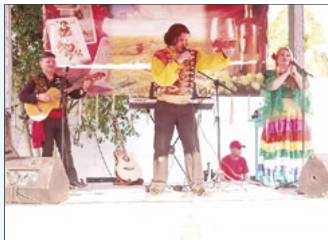
Encanto Cigano durante apresentação em Nova Iguaçu