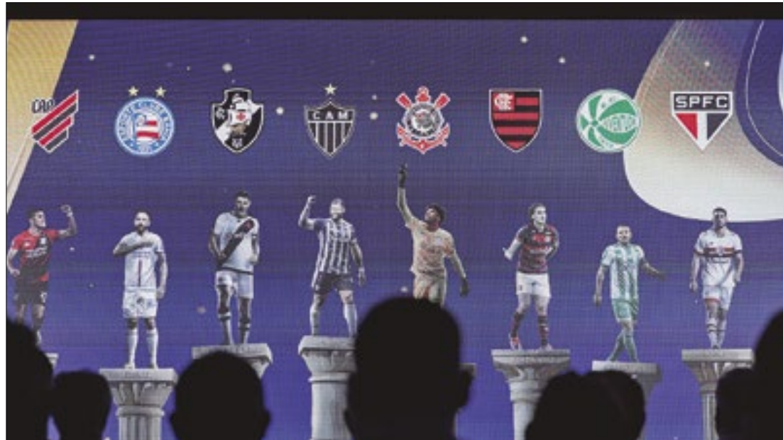
CBF sorteou os confrontos das quartas de final da Copa do Brasil

Já o Flamengo, que venceu a Copa do Brasil em quatro oportunidades -1990, 2006,