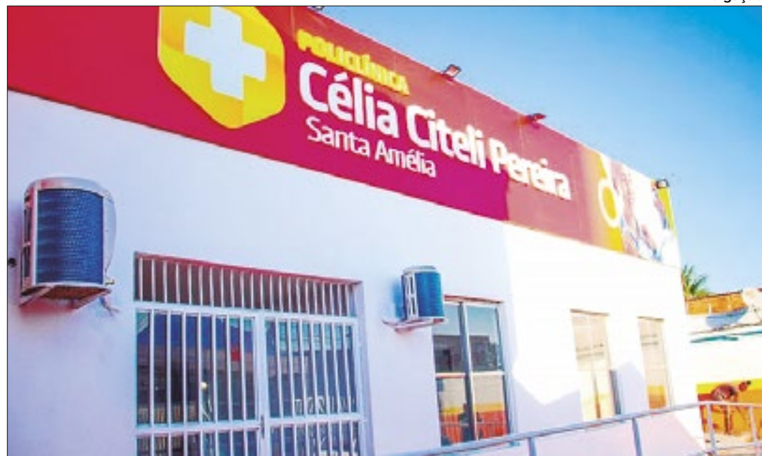
Prefeitura de Belford Roxo entregou policlínica aos moradores do bairro Santa Amélia