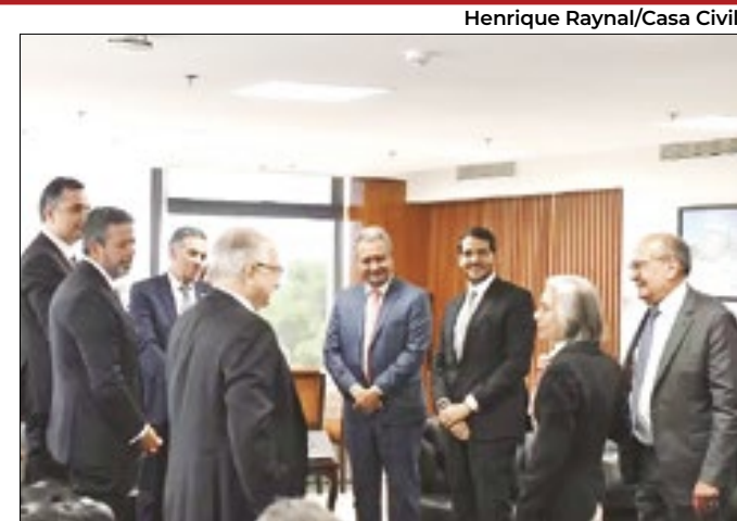
Henrique Raynal/Casa Civil

STF provocou reunião com Executivo e Legislativo