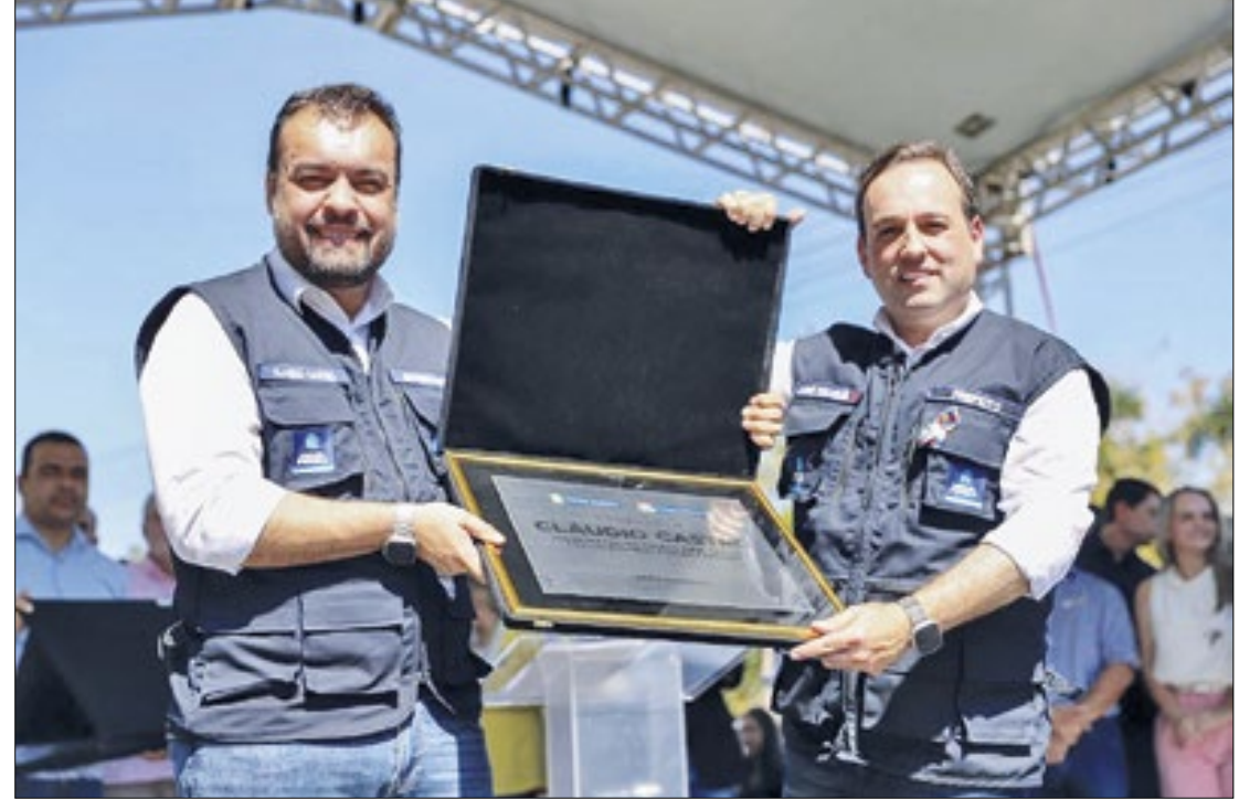
Governador Cláudio Castro (E) ao lado do prefeito de Miguel Pereira, André Português (D)

Outro ponto de visitação foi a Cidade da Justiça, um complexo judiciário que reúne