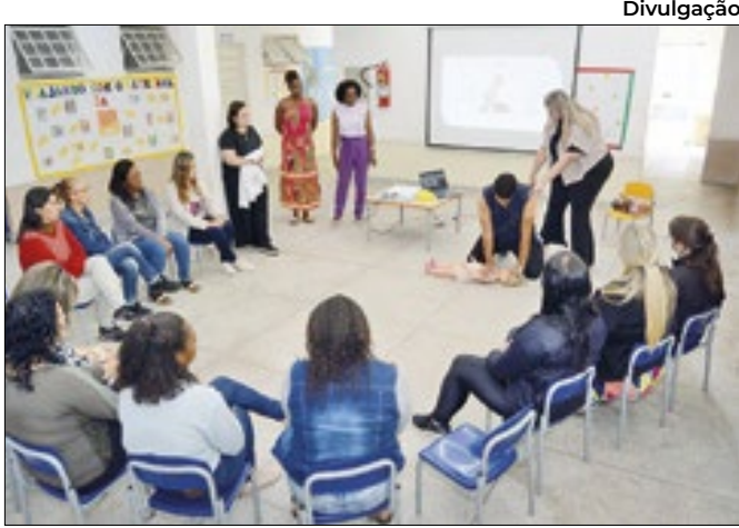
A Creche Dom Waldyr Calheiros foi treinada nesta semana