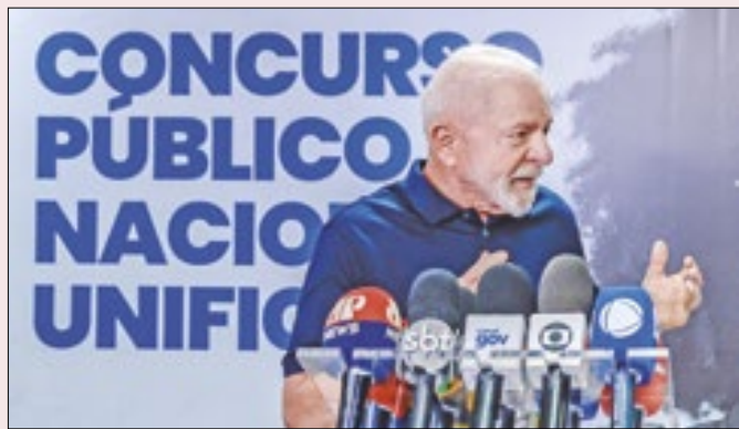
Lula está certo: não tem sentido emenda secreta