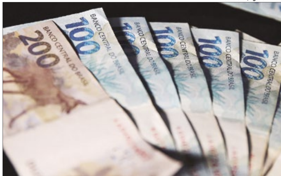
Candidatos à vice-prefeito declararam total de R$ 574 mil em patrimônio ao TSE