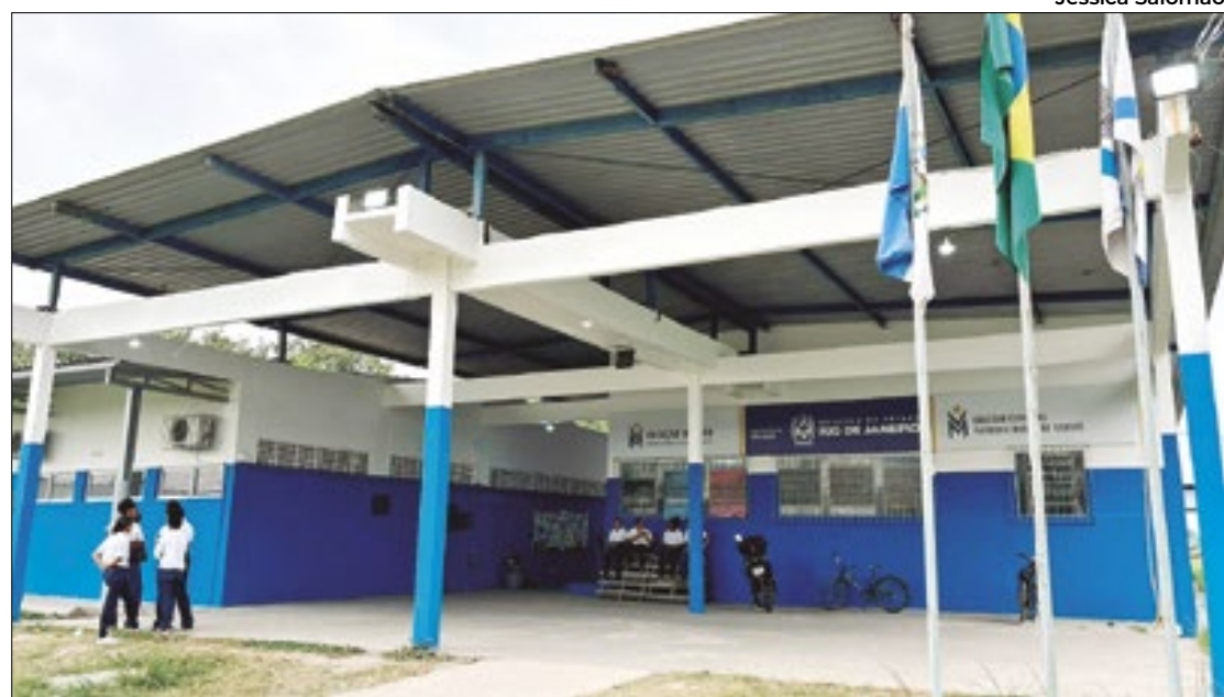
Colégio Estadual vocacionado ao ensino cívico-militar, em Duque de Caxias

Com 208 alunos, a unidade iniciou sua primeira turma de Ensino Médio vocacionada em 2022, atendendo os estudantes com os componentes obrigatórios da Base Nacional Comum Curricular - BNCC e com as disciplinas vocacionadas Educação Cívico-Militar e Período de Instrução, além de ordem unida. Os estudantes têm atividades do início da manhã até o final da tarde, passando o dia na escola, onde também fazem quatro refeições, tendo mais foco e saindo mais preparados, tanto para o mercado de trabalho quanto para o prosseguimento na vida acadêmica, sen-