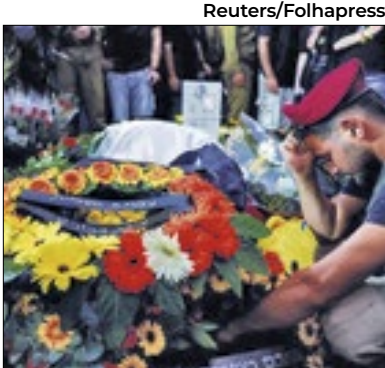
Israel resgatou seis corpos

A pessoa mais velha do mundo, a espanhola María Branyas Morera, morreu nesta terça-feira (20), aos 117 anos em Olot, região nordeste da Espanha. O anúncio foi feito pela família na rede social X (antigo Twitter).