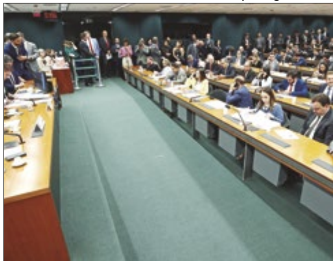
Comissão de Orçamento: ninguém tem tanto poder