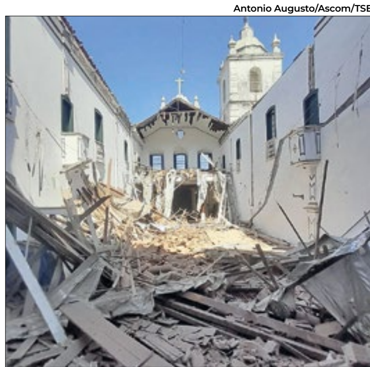
Igreja desaba no Centro de Angra dos Reis

Em nota ao Correio Sul Fluminense, a prefeitura de Angra informa que acionou o Instituto do Patrimônio Histórico e Artístico Nacional (Iphan),