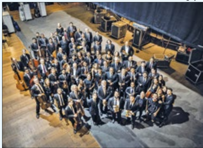
Projeto explora a música clássica de forma gratuita