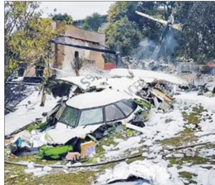
Comissão irá acompanhar investigações