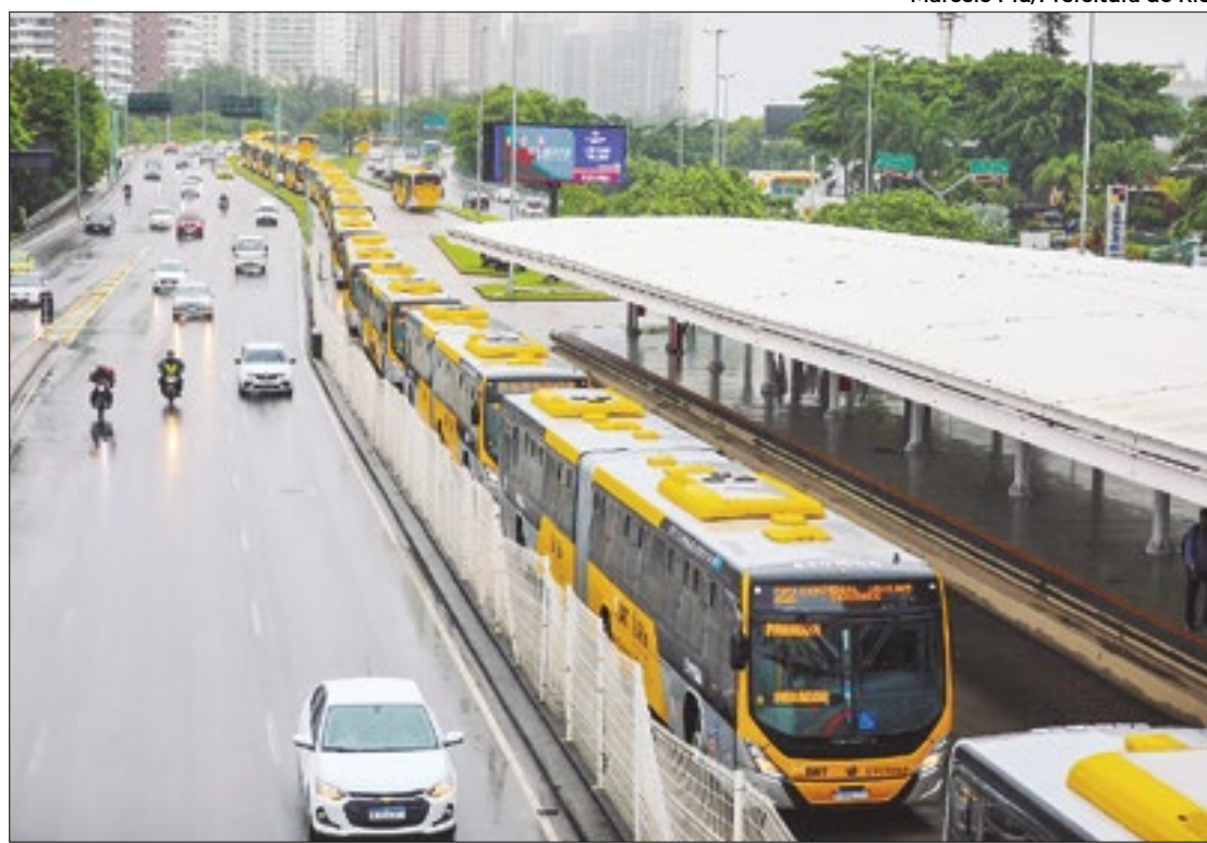
Neste ano, público terá a opção do ‘Expresso Rock in Rio’, sistema BRT levará até o festival

Vale destacar que o público deverá ter saldo compatível com as viagens de metrô, BRT e outros modos separadamente, pois as tarifas são distintas do valor cobrado para o serviço do BRT “Expresso Rock in Rio”, o qual fará o transporte direto até a Cidade do Rock.