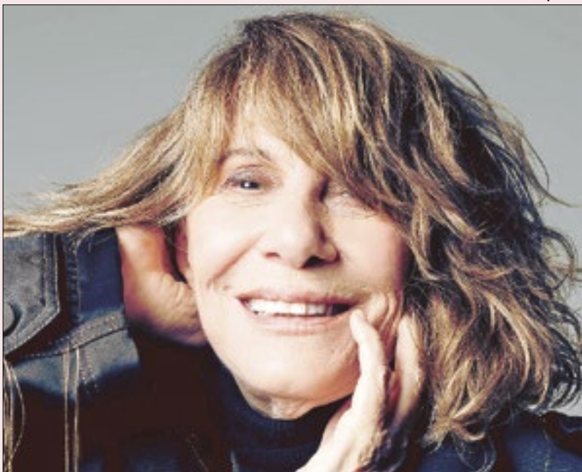
Renata Sorrah faz a estreia de 'Ao Vivo: na Cabela de Alguém'