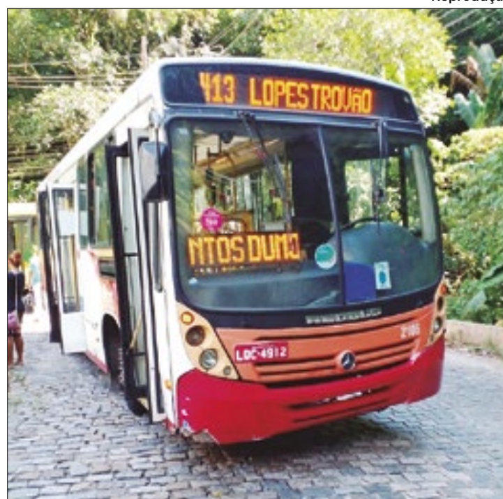
Petro Ita ainda opera em parte das linhas

Os decretos da Prefeitura determinaram a caducidade do contrato entre a Petro Ita e o município, em julho deste ano. No documento, a Prefeitura Municipal ressaltou que a empresa não possuía as condições capazes de dar continuidade à prestação do serviço, o que representa lesão ao contrato fe-