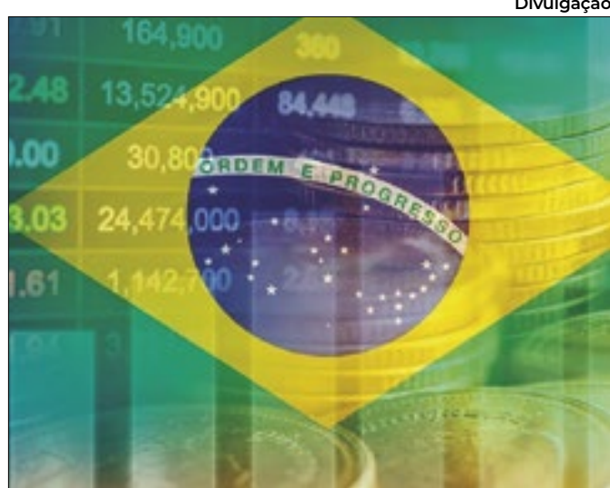
Alta de máquinas e equipamentos foi o diferencial