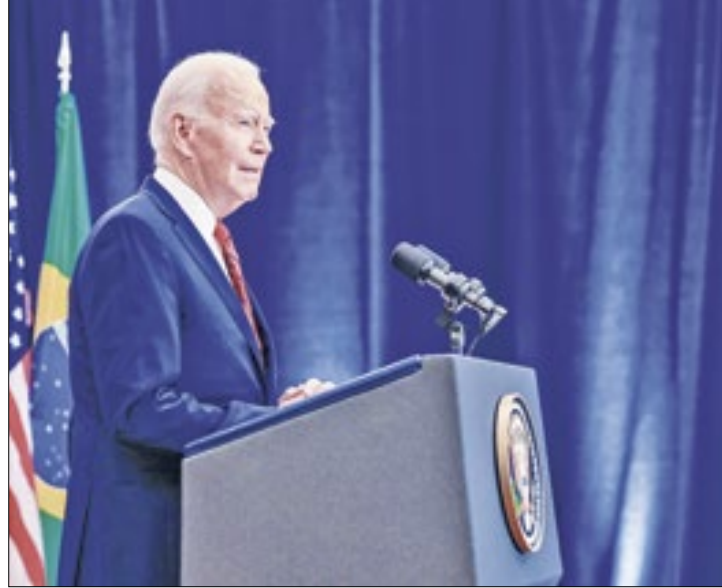
Biden teme ataque nuclear coordenado

Um deles, Vipin Narang, disse no começo do mês: "O presidente recentemente atualizou a orientação de emprego de ar-