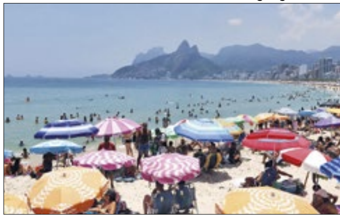
Rio tem semana de sol e tempo só muda na sexta-feira