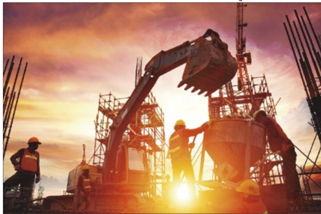
Agência de Notícias da Indústria

Tal sinalização positiva decorre da estabilidade, tanto da atividade industrial, quanto do contingente de empregados, na passagem de junho a julho, conforme indicadores da Sondagem da Indústria da Construção, elaborada pela Confederação Nacional da Indústria (CNI), que mostram um avanço, de 49,9 pontos para 50,1 pontos, referente ao nível de atividade. A alta do índice é significativa, pois ela representa a ultrapassagem da linha divisória de 50 pontos, que separa contração de expansão. Embora aquém dessa margem, o índice do número de empregados subiu de 48,8 pontos para 49,8 pontos.