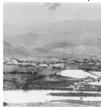
A antiga Itatiaia