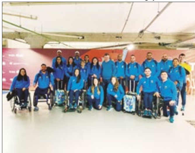
Atletas embarcam para os Jogos Paralímpicos de Paris