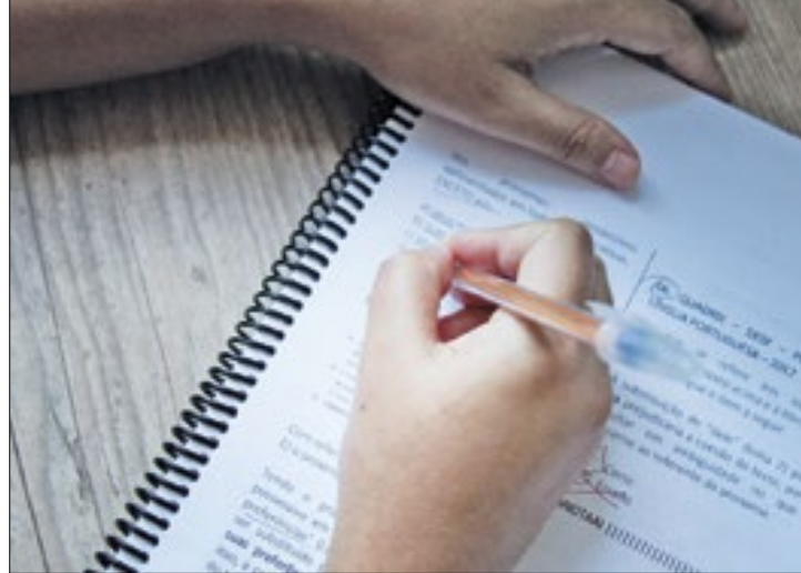
Pedido de apoio especial foi feito no momento da inscrição

As solicitações encaminhadas por essa parcela de candidatos incluem salas de fácil acesso, fornecimento de mesa