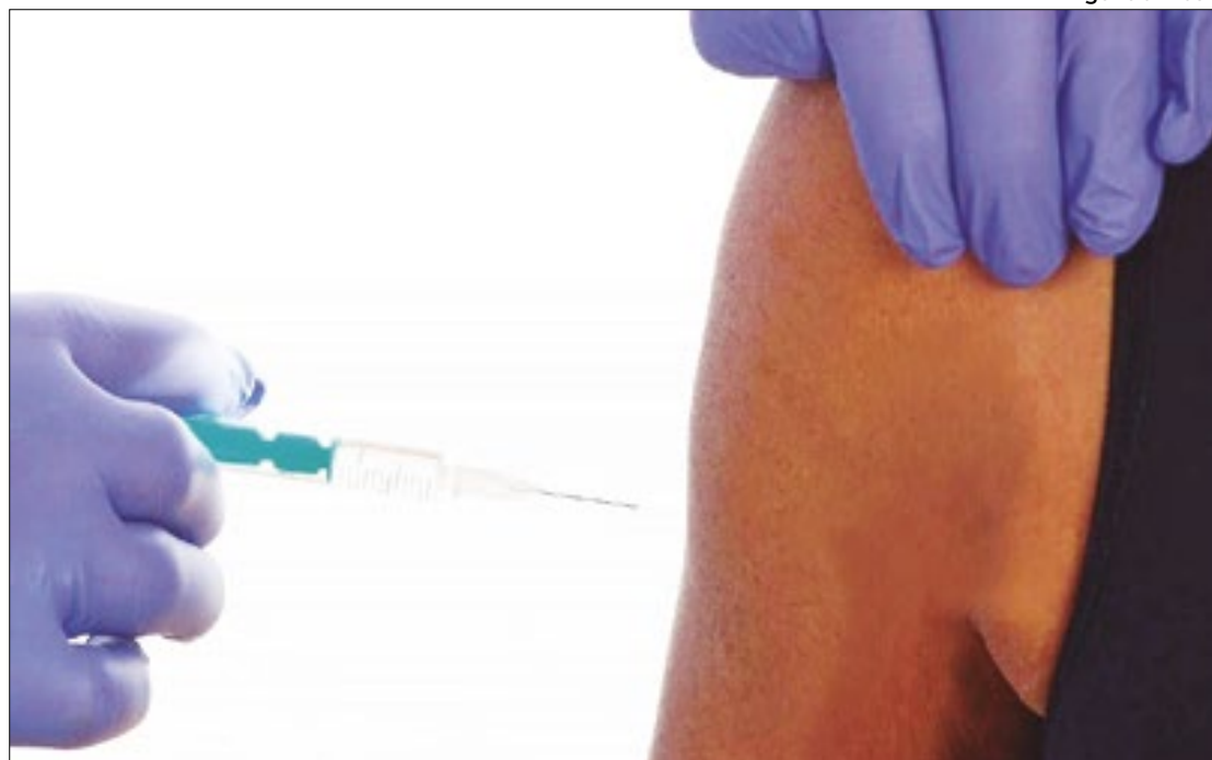
Ministério diz que “acompanha com atenção” a situação da mpox no mundo

Sobre vacinas contra a mpox, a pasta lembrou que, em 2023, a imunização contra