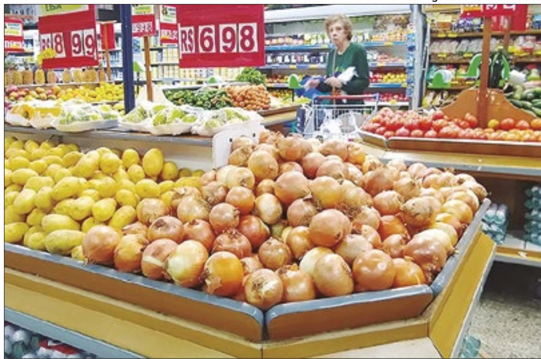
Helena Pontes - Agência IBGE de Notícias

Em contraste ao avanço dos preços, a expectativa em relação à economia este ano 'empacou' em 2,2% do cres-