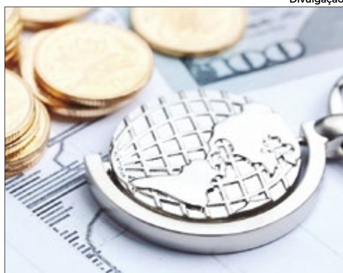
Mercado de capitais brasileiro voltou a ser atrativo