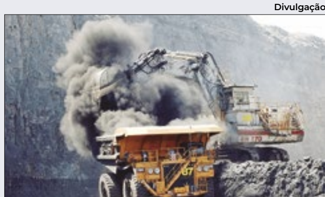
Minas Gerais foi o estado mais preservado dos cortes