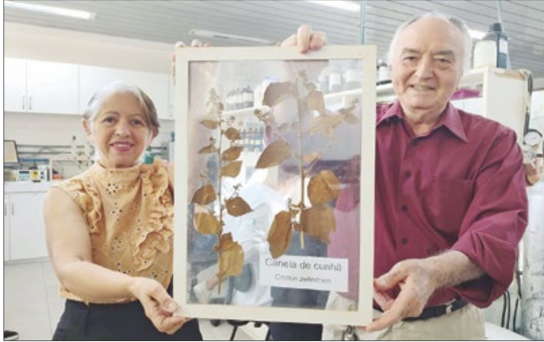
Óleo é capaz de tratar um problema de saúde ainda sem medicamentos disponíveis