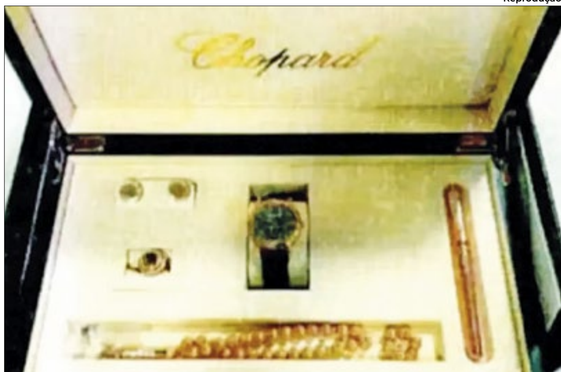
Um dos conjuntos de joias dado de presente ao ex-presidente da República

"A decisão administrativa que reconhece a licitude do comportamento — se isenta de vícios e cercada das formalidades legais — interfere diretamente na seara criminal, porque afasta a necessidade deste último controle, pelo princípio da subsidiariedade", diz a defesa.