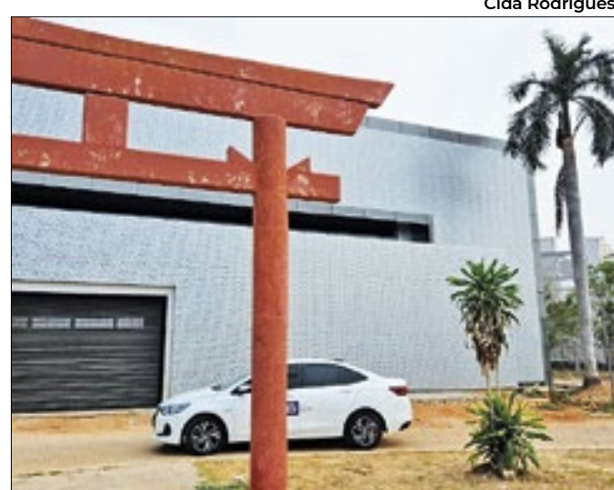
Espaço deve ser um dos melhores do país até outubro