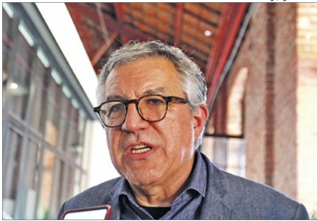
Padilha nega dedo do governo na proibição da emenda Pix

transferência conhecido, ao contrário das emendas de relator, nas emendas Pix os recursos não dependem de celebração de convênio e pertencem ao ente federado no ato da efetiva transferência financeira.