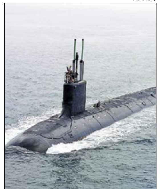
EUA anunciaram o envio do submarino