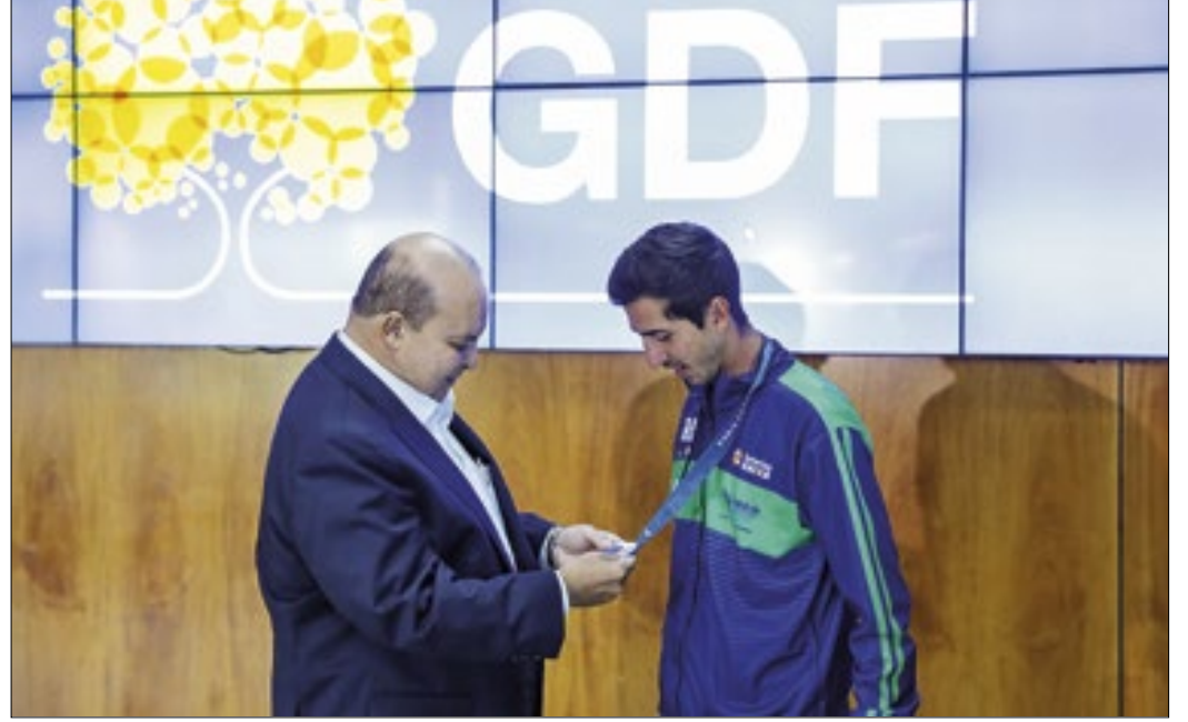
O atleta olímpico, Caio Bonfim, mostrando ao governador do Distrito Federal, Ibaneis Rocha, sua medalha de prata conquistada na prova da marcha atlética, em Paris

Nesta segunda (12), o governador do Distrito Federal, Ibaneis Rocha, concedeu uma homenagem ao marchador brasileiro Caio Bonfim pelo seu desempenho nos Jogos Olímpicos de