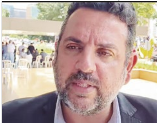
Fayad movimenta servidores contra PEC do BC