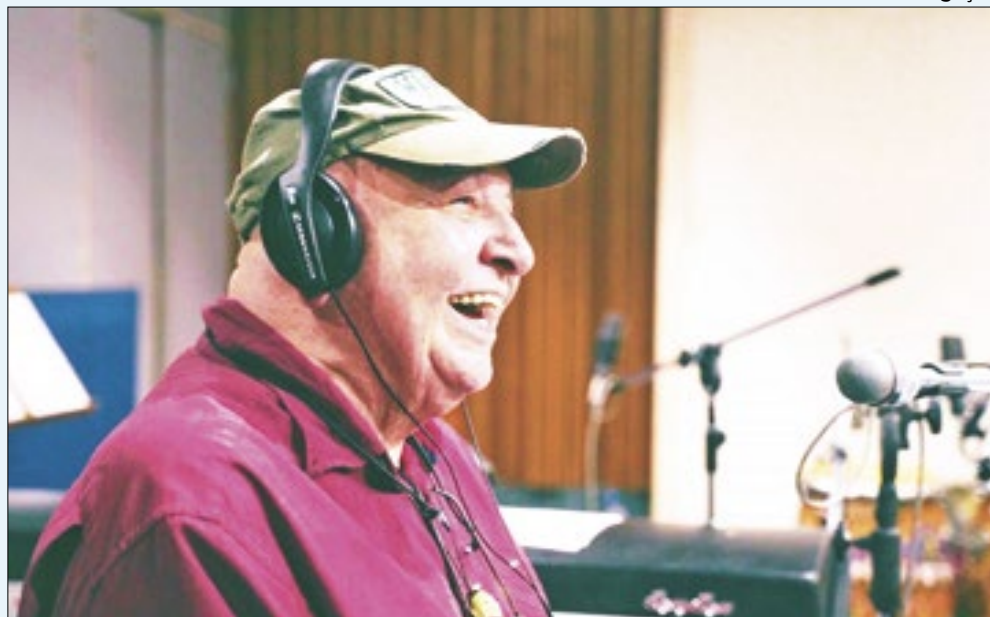
Álbum ao vivo do genial João Donato chega às plataformas de música