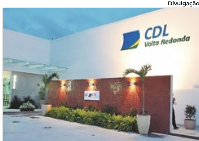
Oportunidades são para cargos de auxiliar e supervisor