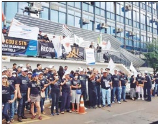
Servidores acusam o governo de 'intransigência'