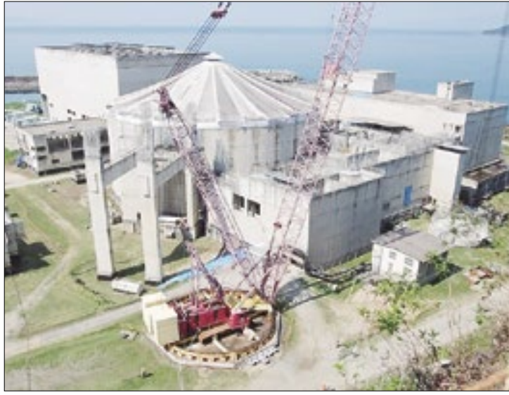
Greve nas usinas nucleares de Angra não afetou produção