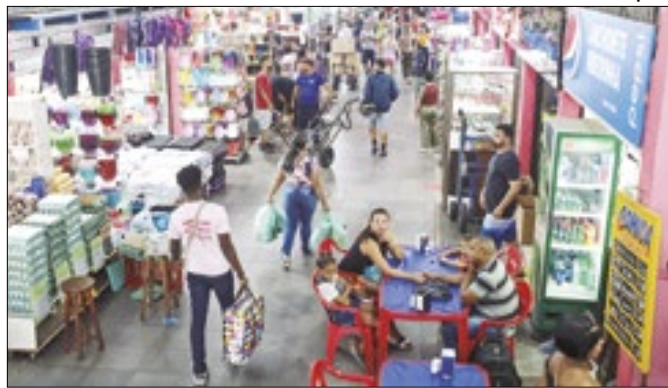
Mercadão de Madureira