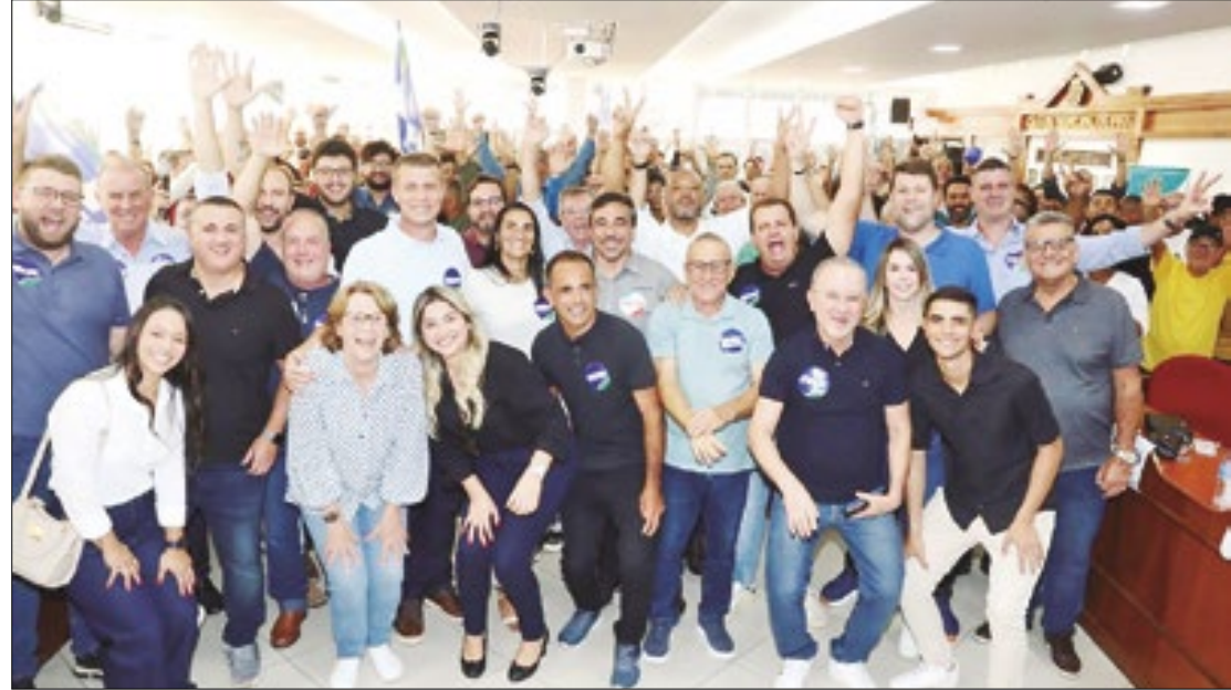
Convenção na Câmara de Pirai confirma 60 pré-candidatos a vereador