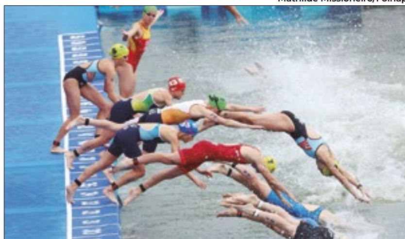
Alguns atletas desistiram do Triatlo após passarem mal no rio Sena

Após passarem mal nas etapas de qualificação, duas delegações do Triatlo desistem de seguir na competição por conta da questionável qualidade das águas do rio Sena. Localizado no coração de Paris, o rio deveria ser completamente despoluído para que atletas, parisienses e turistas pudessem se banhar nele durante e após a Olimpíada. Porém, a realidade está bem longe do projeto.