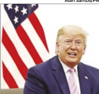
Trump fugiu de debate na TV

Ex-presidente dos EUA, Donald Trump, candidato a presidente pelo Partido Republicano, cancelou sua participação no debate do canal de televisão ABC News com a vice-presidente dos EUA