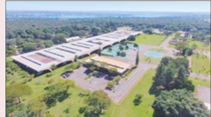
Sede da Escola Superior de Defesa