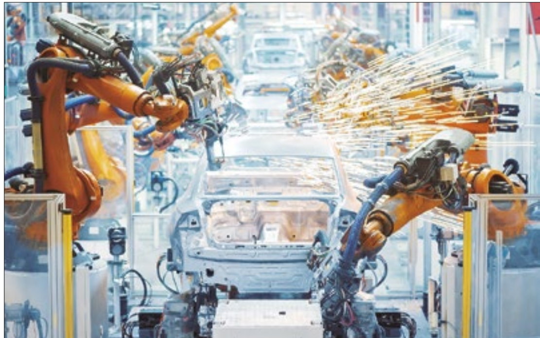
Salto industrial espetacular deverá ter reflexo no crescimento econômico brasileiro

Devido à retomada industrial, o XP Tracker reviu para cima a expectativa de crescimento do PIB no 2T24, que passou de 0,6% para 0,7%, en-