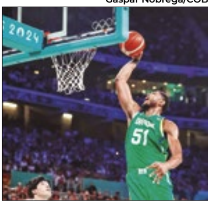
Caboclo é o craque do Brasil

Time com a segunda pior campanha na fase de grupos do basquete masculino, o Brasil vai encarar o 'Dream Team', favoritíssimo ao Ouro, nas quartas de final nesta terça (6). O técnico dos EUA, Steve Kerr, elogiou muito o time brasileiro. "Eles são muito físicos. Acho que é a equipe número 1 em rebotes ofensivos no torneio", disse o técnico da equipe dos EUA. "Eles têm muitos arremessadores realmente bons e jogam duro."