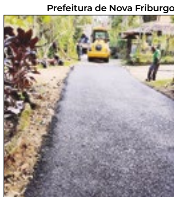
Pavimentação da via

A Prefeitura de Nova Friburgo, por meio da Subprefeitura de Lumiar e São Pedro da Serra, está executando o asfaltamento na Alameda Alcir Martins Costa, na localidade de Pedra Riscada, em Lumiar. A intervenção tem como objetivo garantir melhores condições de trafegabilidade para moradores, e o resultado parcial dos trabalhos já é visível. O serviço era uma demanda antiga, a localidade sofria com a falta da pavimentação, automóveis e pedestres tinham dificuldade em passar na região.