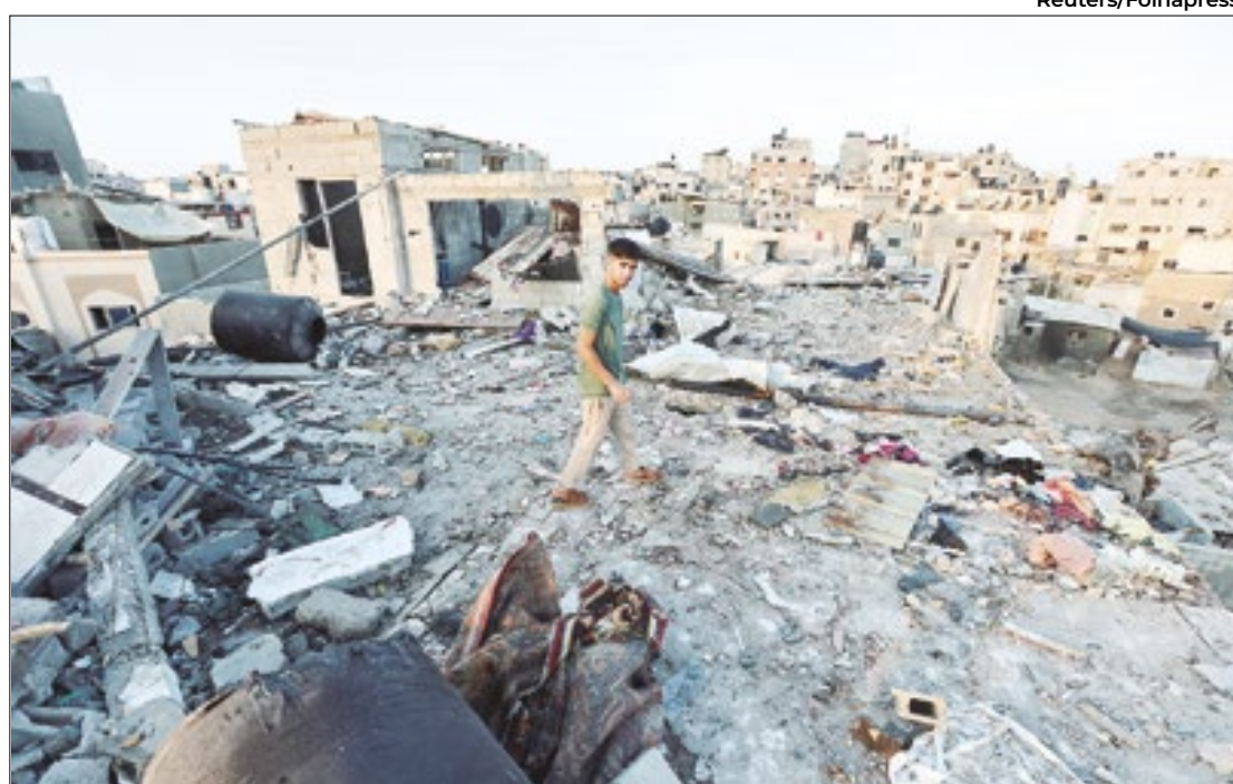
Ataque Israelense deixou 30 mortos em Gaza, onde palestinos se abrigavam da guerra

ção israelense deve ir à Cairo para discutir uma possível libertação de reféns e um acordo de cessar-fogo em Gaza. Israel calcula que 111 pessoas permanecem em cativeiro em Gaza, embora 39 delas tenham sido mortas.