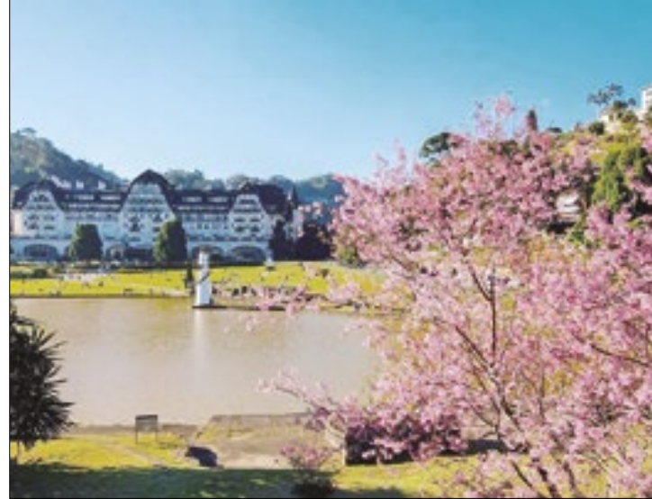
As cerejeiras estão espalhadas por diversos pontos

Entre final de julho e início de agosto, Petrópolis se transforma em um verdadeiro jardim de flores rosas e brancas com a floração das cerejeiras, que dura até três semanas. A cidade, que recebe cerca de 150 mil visitantes durante a alta temporada de inverno, tem neste “evento” proporcionado pela natureza um marco no calendário local, atraindo turistas de diversas regiões e deleitando os moradores. O Petrópolis Convention & Visitors Bureau destaca a importância do chamado turismo de contemplação, uma variante do ecoturismo.