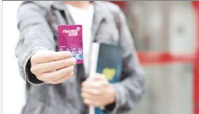
Recadastramento inicia nesta segunda-feira (05)