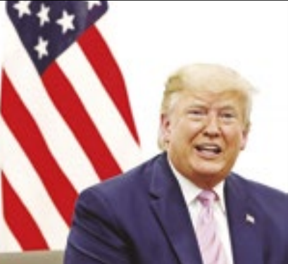
Trump fugiu de debate na TV

Ex-presidente dos EUA, Donald Trump, candidato a presidente pelo Partido Republicano, cancelou sua participação no debate do canal de televisão ABC News com a vice-presidente dos EUA