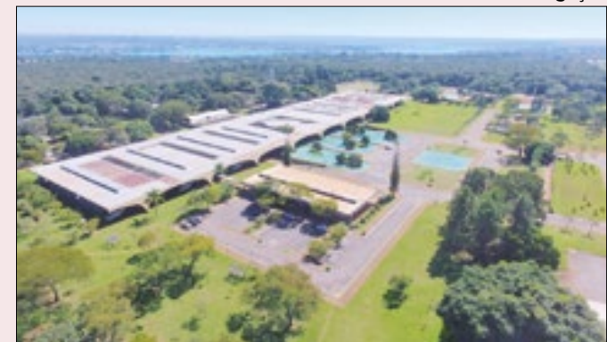
Sede da Escola Superior de Defesa