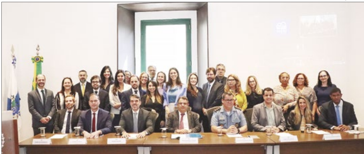
O termo envolve órgãos municipais e estaduais, além de entidades da sociedade civil

O evento teve ainda uma edição especial da Feira da Agricultura Familiar, que foi realizada em paralelo à tradicional edição de Aracatiba, e voltou a acontecer neste domingo (04), último dia da festa. O público presente aproveitou bastante as comidas típicas e várias atrações musicais.