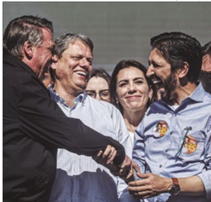
Bolsonaro na convenção que oficializou Nunes

O prefeito Ricardo Nunes oficializou sua candidatura para a Prefeitura de São Paulo em evento na manhã de sábado (3), em convenção municipal do MDB com a presença de bolsonaristas. O ex-presidente Jair Bolsonaro (PL) chegou a divulgar um vídeo convocando os aliados para o evento.