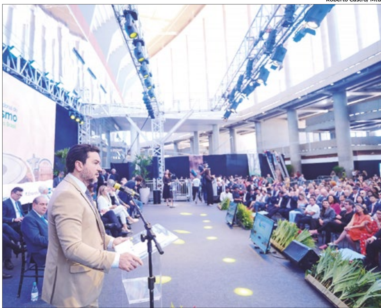
Ministro Celso Sabino durante a abertura do último Salão do Turismo, realizado no ano passado em Brasília

ACRE - Uma das principais experiências que o estado irá levar ao Salão é o Rio Croa. Localizado em Cruzeiro do Sul, o lugar tem paisagens naturais de muita beleza e riqueza de fauna e flora. O rio de águas escuras, com características de lago, chama atenção pela exuberância. No período de verão amazônico, as correntezas diminuem e o leito do rio