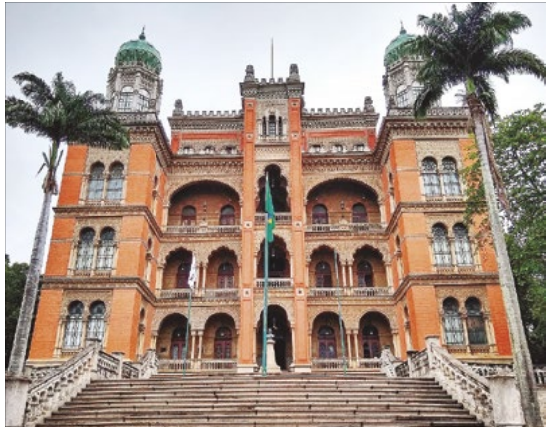
Fiocruz escolhe projeto que valoriza a ciência para adotar no Memorial da Covid-19

A Fundação Oswaldo Cruz (Fiocruz) começou esta semana 56 novos projetos de saúde integral em favelas do Rio de Janeiro. As ações ocorrem em parceria com instituições da sociedade civil e representam uma ampliação do plano iniciado em 2021. Os investimentos até agora são de R$ 22,2 milhões em 146 projetos, em 33 cidades do estado. Cerca de 385 mil pessoas já foram beneficiadas.