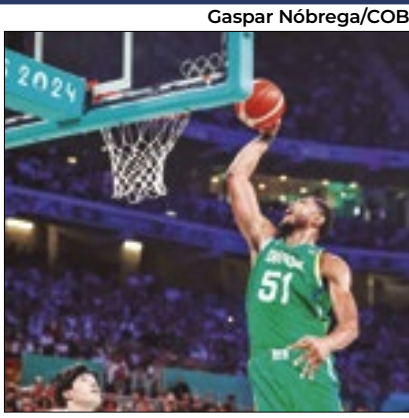
Caboclo é o craque do Brasil

Time com a segunda pior campanha na fase de grupos do basquete masculino, o Brasil vai encarar o 'Dream Team', favoritíssimo ao Ouro, nas quartas de final nesta terça (6). O técnico dos EUA, Steve Kerr, elogiou muito o time brasileiro. "Eles são muito físicos. Acho que é a equipe número 1 em rebotes ofensivos no torneio", disse o técnico da equipe dos EUA. "Eles têm muitos arremessadores realmente bons e jogam duro."