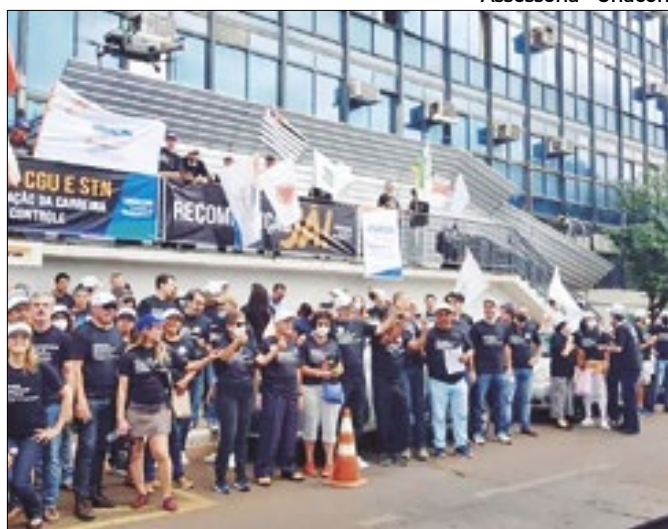
Servidores acusam o governo de 'intransigência'