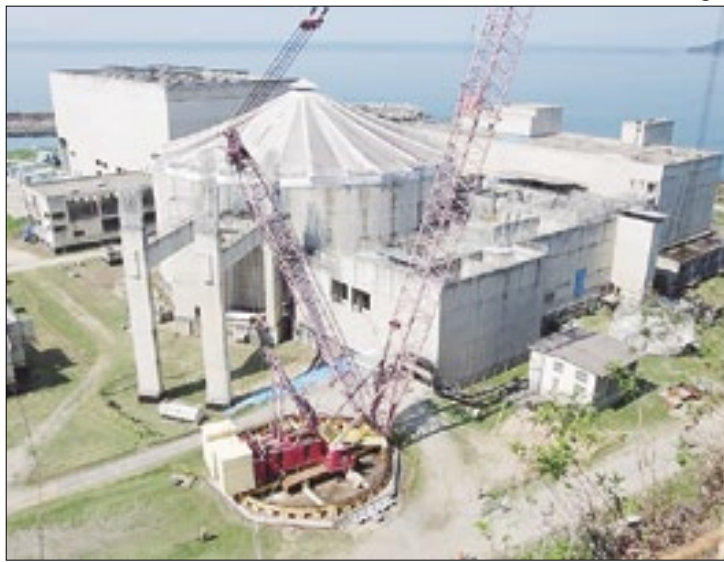
Greve nas usinas nucleares de Angra não afetou produção