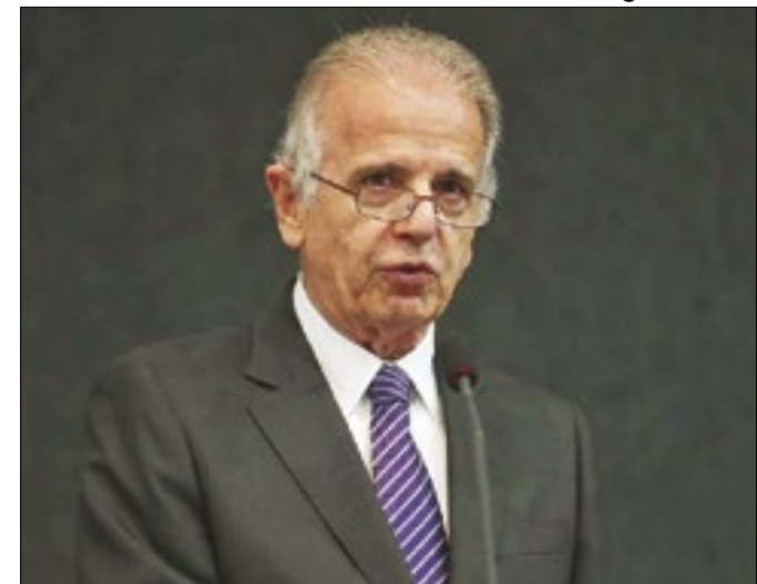
José Múcio, ministro da Defesa