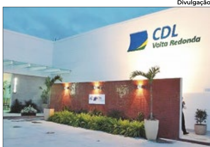
Oportunidades são para cargos de auxiliar e supervisor