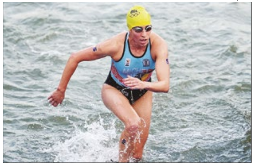
Com qualidade limítrofe da água, realização do revezamento misto é incerta

Caso não seja possível realizar a prova nesta segunda, ela será adiada para a terça. Se o problema persistir, a parte