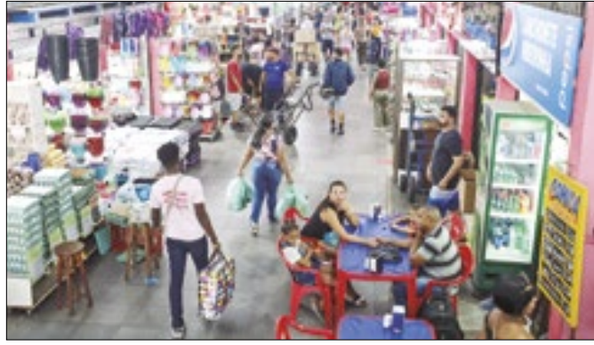
Mercadão de Madureira