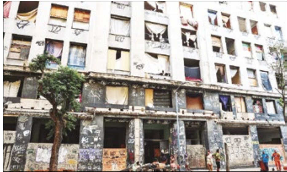
Ocupação Zumbi dos Palmares pode dar espaço a moradia popular

O governo do Rio de Janeiro se ofereceu para ser o executor de obra no prédio da ocupação Zumbi dos Palmares, no centro da cidade. Dezenas de famílias, incluindo mães solas e crianças, ocupam há meses o edifício sem uso no número 53 da Avenida Venezuela, que pertence ao Instituto Nacional do Seguro Social (INSS) interditado pela Defesa Civil municipal.