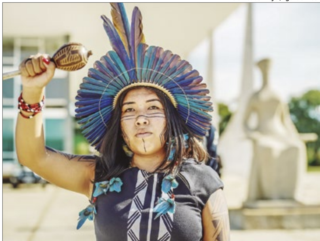
Gilmar tentará conciliação sobre marco temporal

Cabo de guerra entre os poderes Legislativo e Judiciário, a tese do marco temporal determina que os povos indígenas têm direito apenas às terras que ocupavam ou já disputavam em 5 de outubro de 1988, data de promulgação da Constituição. Em setembro de 2023, o STF julgou a tese como inconstitucional, porém o Congresso editou a Lei 14.701/2023, restabelecendo o marco temporal e voltando à discussão.