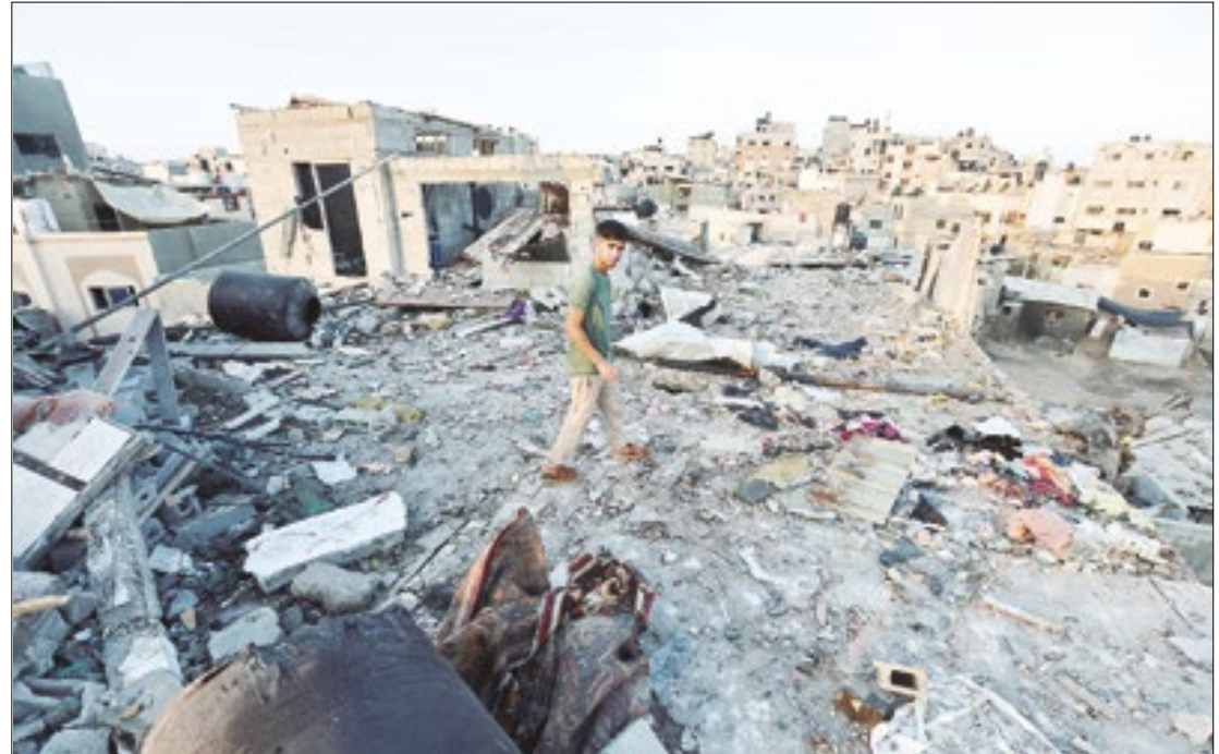
Ataque Israelense deixou 30 mortos em Gaza, onde palestinos se abrigavam da guerra

ção israelense deve ir à Cairo para discutir uma possível libertação de reféns e um acordo de cessar-fogo em Gaza. Israel calcula que 111 pessoas permanecem em cativeiro em Gaza, embora 39 delas tenham sido mortas.