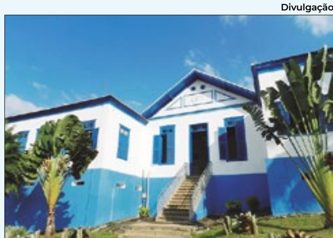
Processo seletivo vai até o dia 18 de agosto

Todas as vagas são exclusivas para pessoas com deficiência (PCDs). Os interessados nas vagas devem baixar o aplicativo e realizar seus cadastros na plataforma.