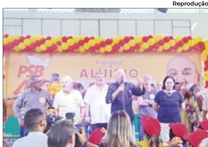
Aluísio Gama é candidato a prefeito de Nova Iguaçu pelo PSB