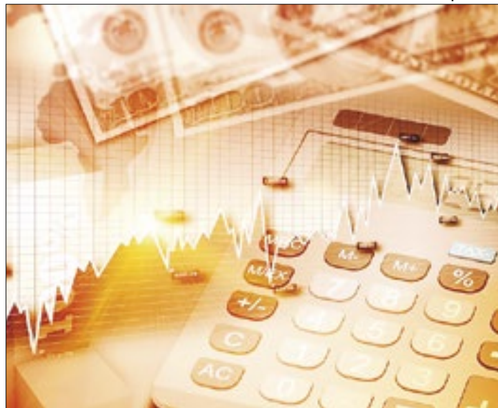
'Benesse fiscal equivale a uma 'sangria' anual de R$ 519 bi

Mas o que surpreende mesmo é o tamanho da conta: uma 'sangria astronômica' de R$ 519 bilhões no ano passado, o que teria levado o Executivo a intensificar contatos no Congresso, visando 'dar um fim' ao Programa Emergencial de Retomada do Setor de Eventos