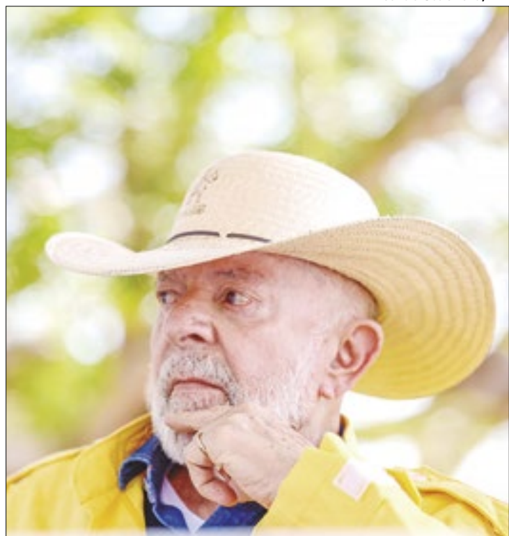
Lula tem 35% de aprovação, segundo Datafolha

A comparação com o segundo mandato de Lula no poder, iniciado em 2007 e encerrado no fim de 2010, traz diferenças marcantes. O presidente ostentava aprovação de 64%, enquanto apenas 8%