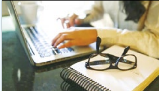
Ex-alunos podem concorrer às vagas de graduação