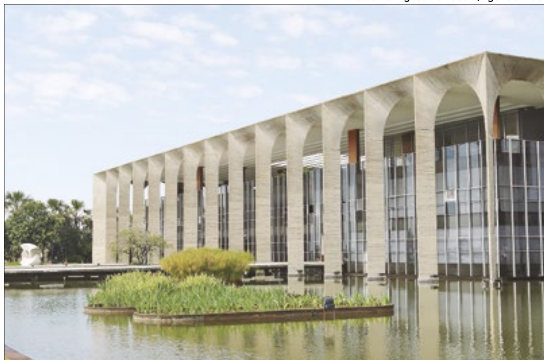
Depois dos tropeços iniciais, Itamaraty assume crise venezuelana

Em meio à crise, a diplomacia brasileira assumirá temporariamente as embaixadas da Argentina e do Peru loca-