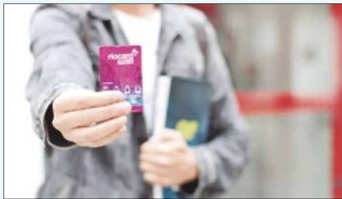
Recadastramento inicia nesta segunda-feira (05)