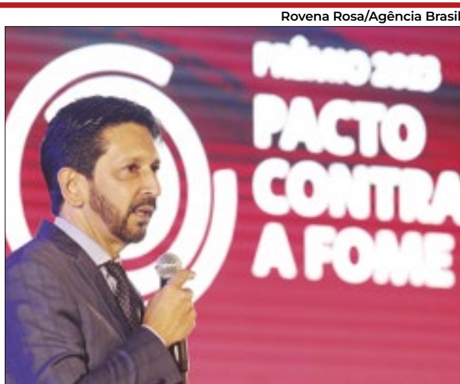
Ricardo Nunes era vice de Bruno Covas