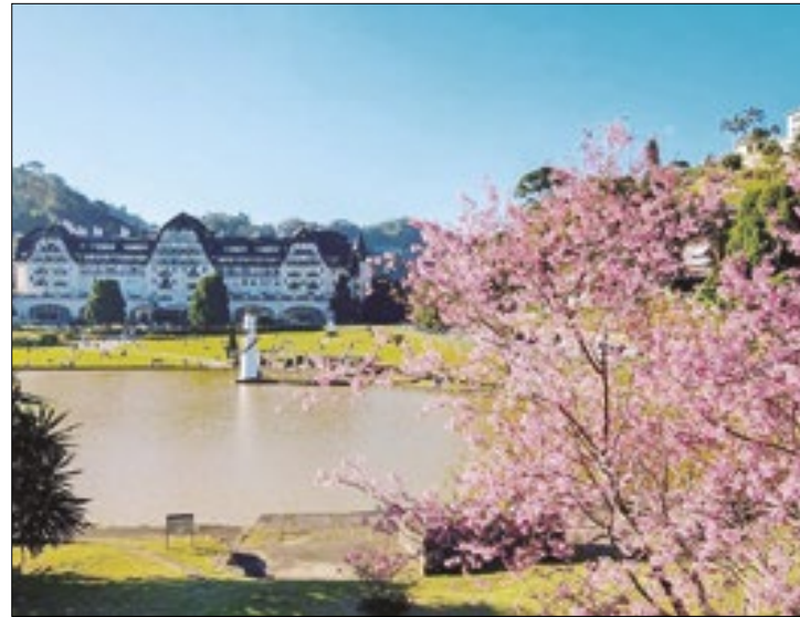
As cerejeiras estão espalhadas por diversos pontos

Entre final de julho e início de agosto, Petrópolis se transforma em um verdadeiro jardim de flores rosas e brancas com a floração das cerejeiras, que dura até três semanas. A cidade, que recebe cerca de 150 mil visitantes durante a alta temporada de inverno, tem neste “evento” proporcionado pela natureza um marco no calendário local, atraindo turistas de diversas regiões e deleitando os moradores. O Petrópolis Convention & Visitors Bureau destaca a importância do chamado turismo de contemplação, uma variante do ecoturismo.