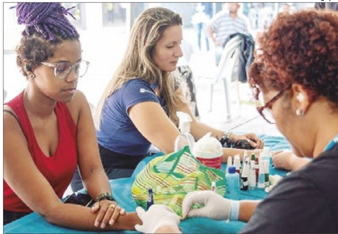
Corte de cabelo, manicure e cuidados com a saúde bucal foram alguns dos serviços oferecidos

Para promover ações sobre preservação ambiental, tam-