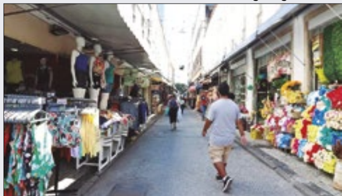
Abertura do mês é a maior da série da Junta Comercial