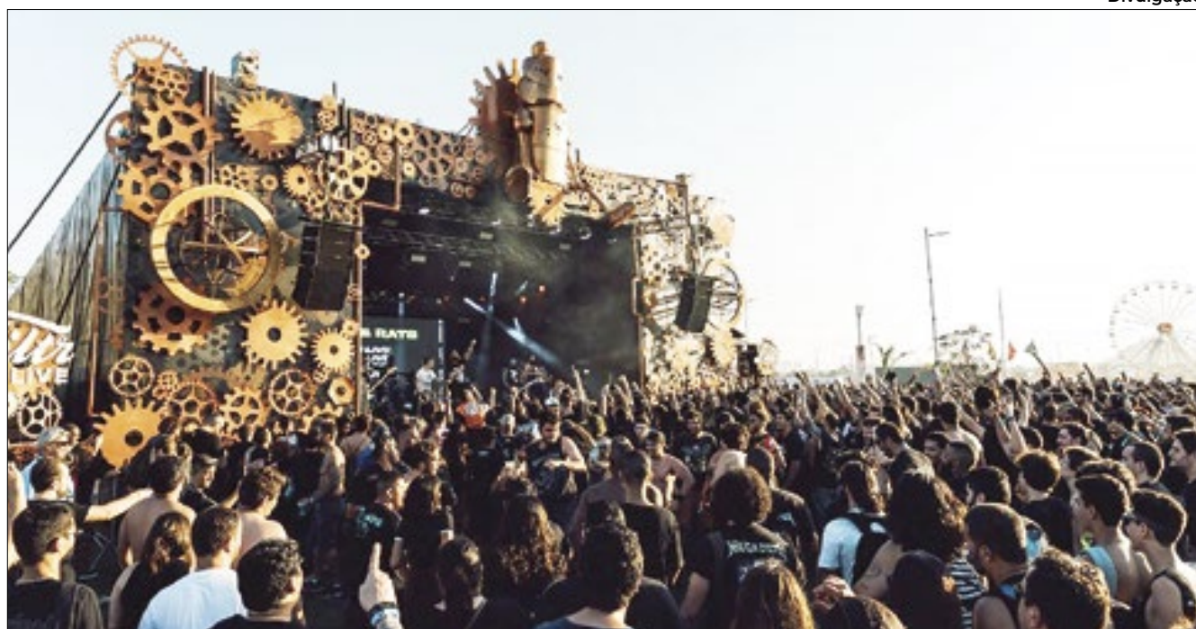
Palco criado em parceria com o Filtr Music Brasil foi sucesso nas últimas duas edições do festival

tando o hyper pop; a expoente banda latina do Darumas; a empoderada N.I.N.A, nome potente do rap contemporâneo; e, fechando a noite, a rapper Cynthia Luz, grande representante feminina do rap brasileiro. No sábado, “Dia Brasil”, o Supernova apresenta Chico Chico, filho de Cássia Eller, trazendo seu novo álbum “Estopim”; a banda Autoramas, com um show que celebra os 25 anos de carreira; Vanguard, em um show com muito indie rock; e o cantor e compositor do hip-hop Jean Tassy, encerrando a noite. No domingo, 22 de setembro e último dia do festival, a abertura fica com LZ da França, expoente do trap; seguido do cantor de pop Gabriel Froede; logo depois é a vez de Zaynara, fenômeno expoente do pop; e o headliner representando todo o poder do funk, DJ Topo, conhecido pelos seus remixes potentes.