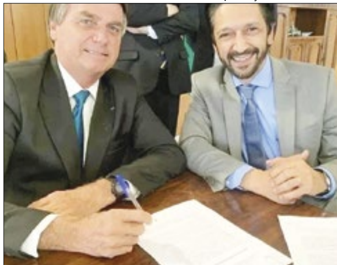
Até onde apoio de Bolsonaro ajuda Nunes?