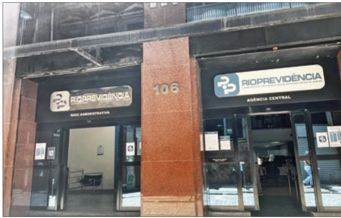
Recenseamento é obrigatório e pode ser feito em uma das agências do Rioprevidência