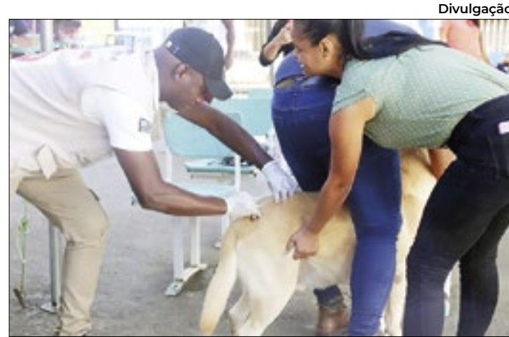
Dia D da campanha em Magé será em 10 de agosto