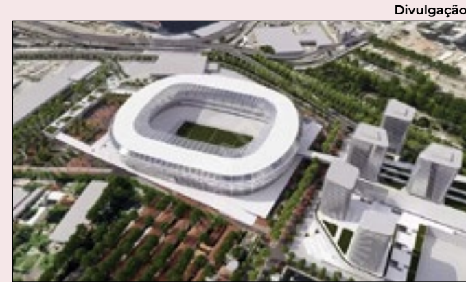
Estádio ficará em área de constantes engarrafamentos