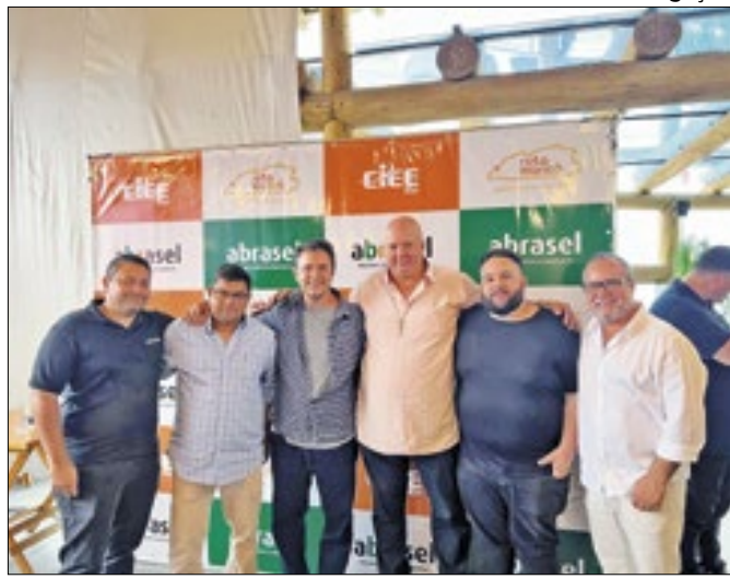
Tema do encontro foi relacionado aos estágios