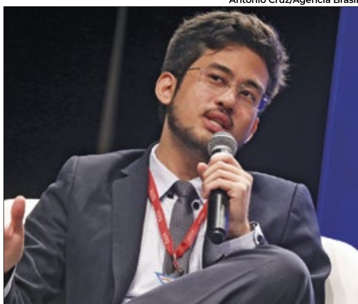
Kim diz ter sido “sabotado” por seu partido

O União Brasil é o terceiro maior partido em termos de verba do fundo eleitoral e de tempo de propaganda no rádio e na TV, atrás apenas de PL e PT. Isso será revertido para a campanha de Nunes.