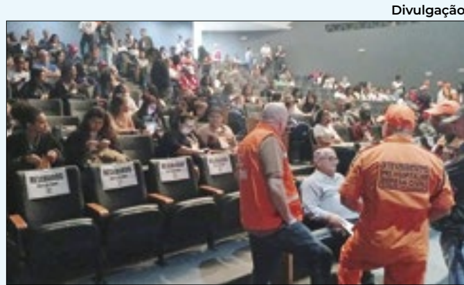
Prefeitura realizou Simpósio com equipes da Defesa Civil

Os coordenadores da coligação e da campanha do prefeito Abraãozinho creditam a larga vantagem nas pesquisas à principal marca de seu governo: a realização de várias obras de infraestrutura. O programa "Dá-lhe Obras", lançado em 2022, em parceria com o Governo do Estado, trouxe para Nilópolis um pacote com mais de 20 obras de contenção de encostas, as reformas do calçadão da Mirandela, do calçadão de Olinda, da Vila Olímpica e do Parque Sara Areal; além do Hospital Municipal e Maternidade, que está prevista para ser inaugurado no dia 21 de agosto, quando Nilópolis completa 77 anos.