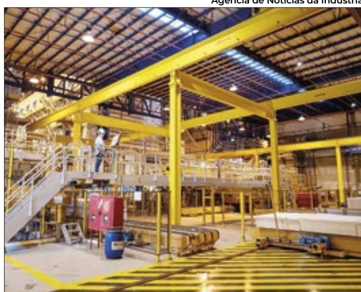
Agência de Notícias da Indústria

Em que pese esse avanço tecnológico, o maior desafio do