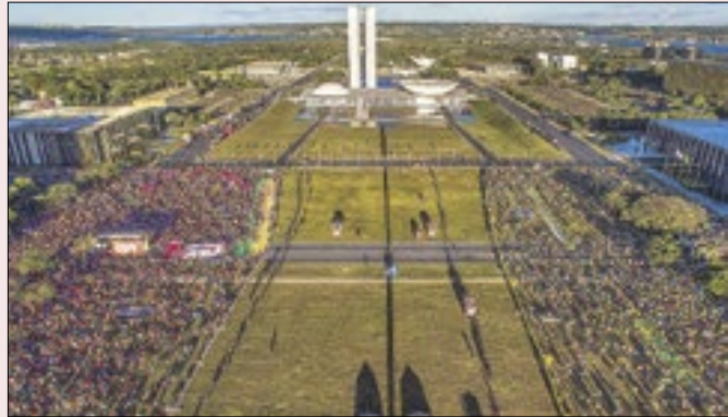
A polarização política cansou?