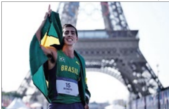
Caio Bonfim conquistou medalha de prata inédita