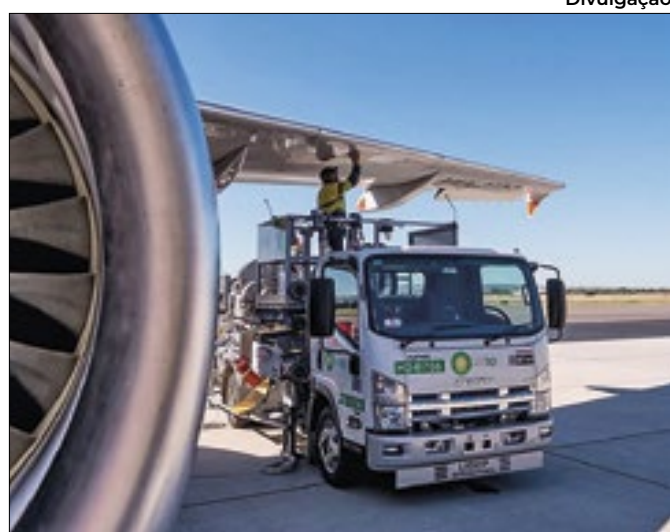
Novo reajuste do combustível acumula alta no ano