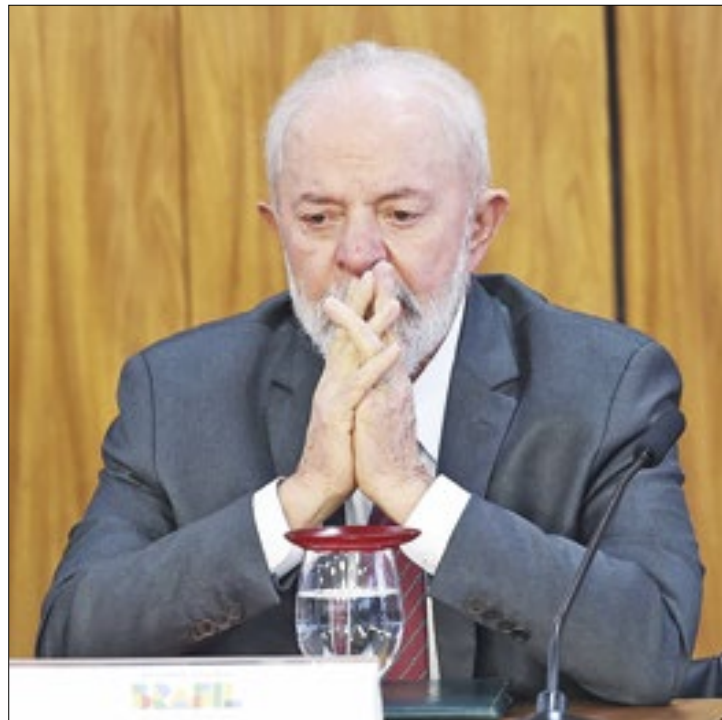
Lula não reconhece eleição sem divulgação de atas

Os presidentes do Brasil, do México e da Colômbia divulgaram, nesta quinta-feira (1), uma nota conjunta em que pedem divulgação de atas e verificação imparcial dos resultados da eleição na Venezuela.