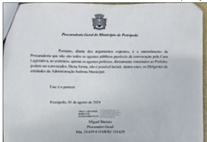
Parecer da Procuradoria Geral do Município