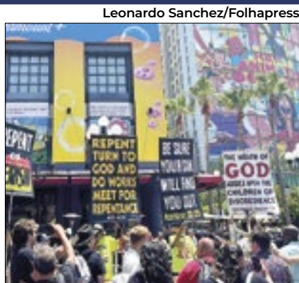
Esquema foi frustrado pela polícia

A polícia nigeriana dispersou o gás lacrimogêneo para dispersar centenas de manifestantes na capital do país, Abuja, e em Kano, que protestavam contra o governo e o aumento do custo de vida, segundo jornalistas locais.