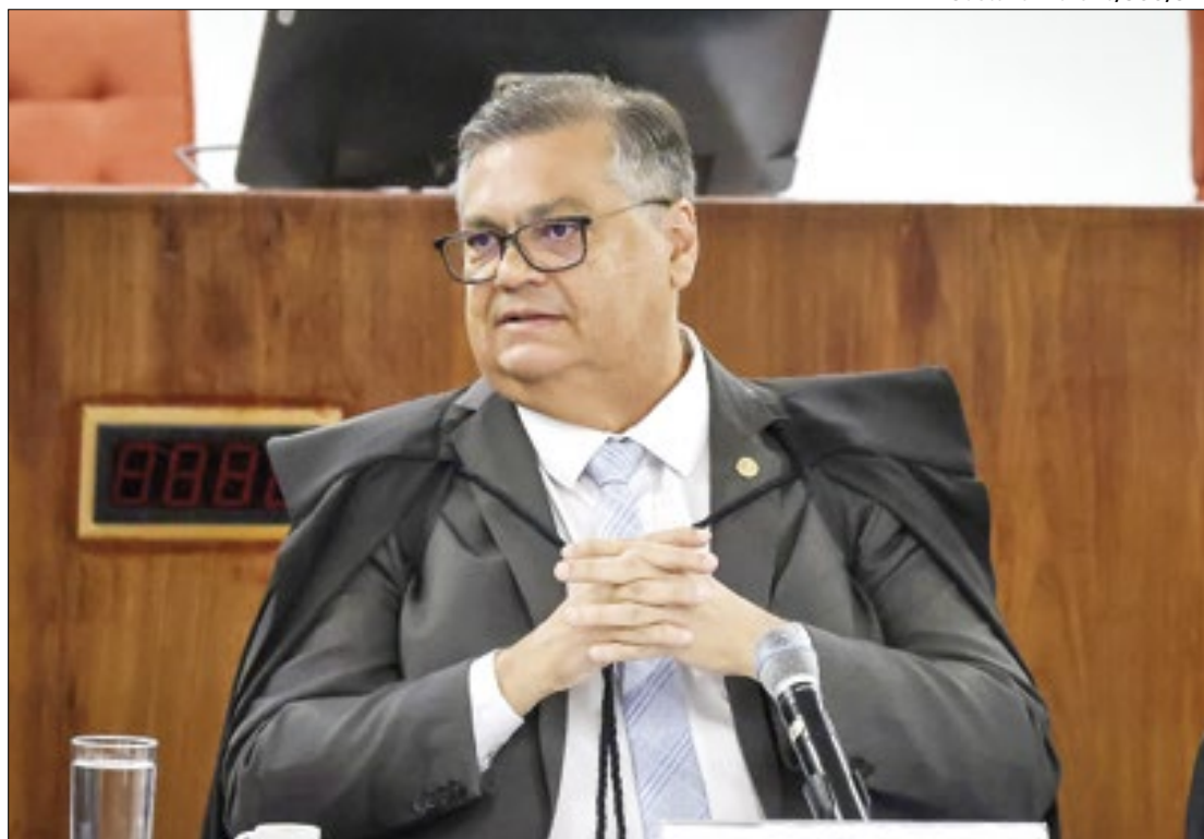
Dino quer discutir como restringir a farra das emendas PIX

Michel Temer, mas especialmente no governo Bolsonaro, o Congresso viu aumentado o seu poder na destinação de verbas orçamentárias por meio de emendas parlamentares. A forma com isso acontece vem sofrendo uma série de contestações, pela suposta falta de transparência com o tratamento de dinheiro público.