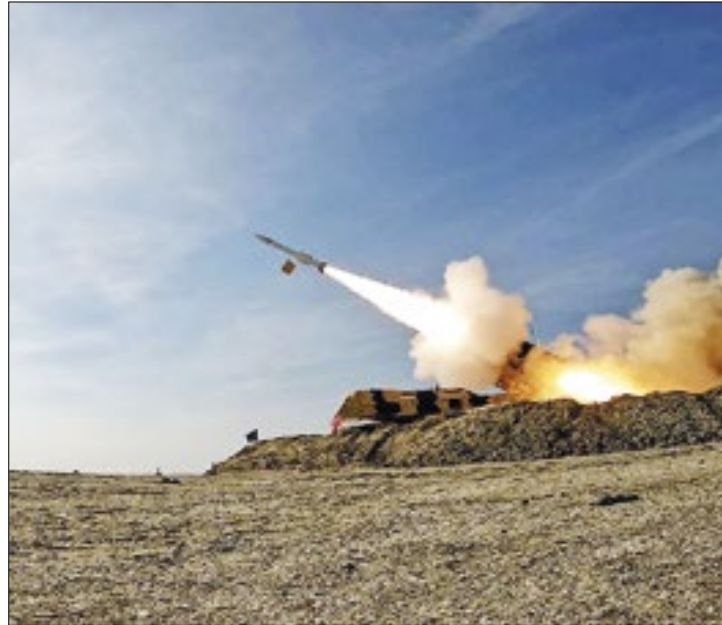
Autoridade do Irã podem definir futuro da guerra