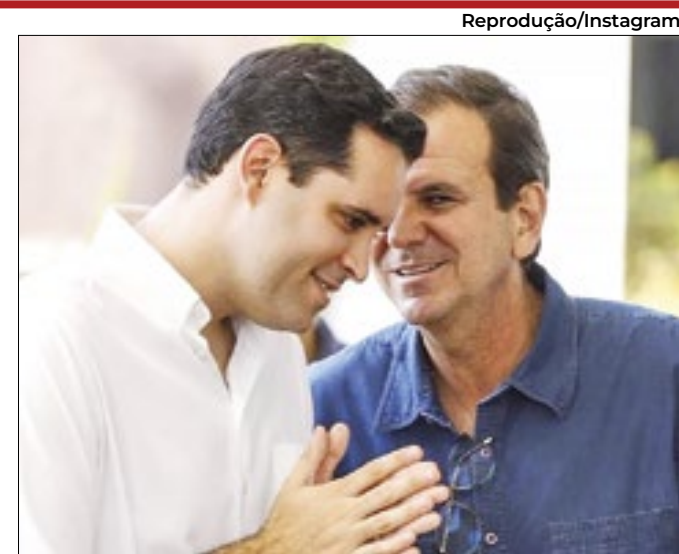
Cavaliere será o provável vice da chapa de Paes