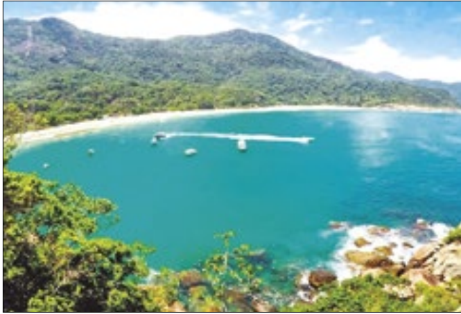
Plano emergencial foi acionado por condições climáticas