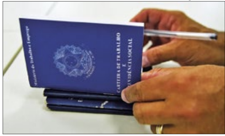
Estado se consolida como um dos que mais geram empregos