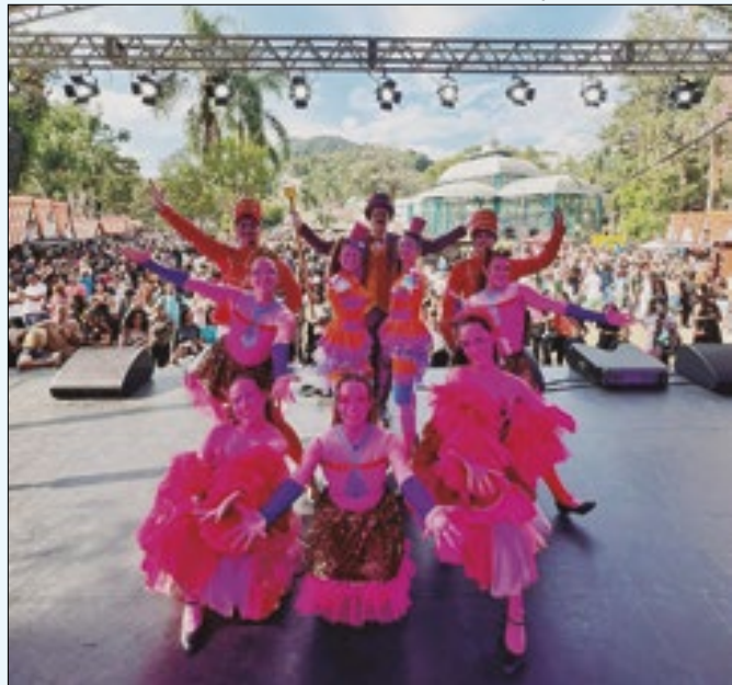
Evento será retomado na sexta-feira, 2 de agosto