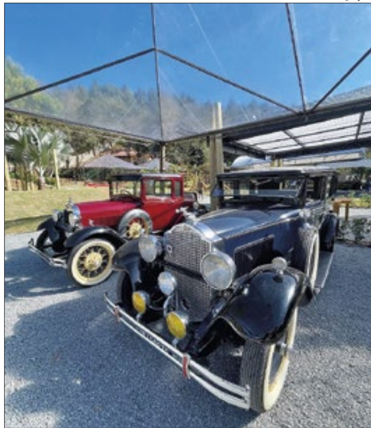
Expo D'Elegance retorna ao Bosque dos Vales