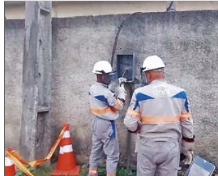
Energia Legal removeu furtos de energia em duas cidades