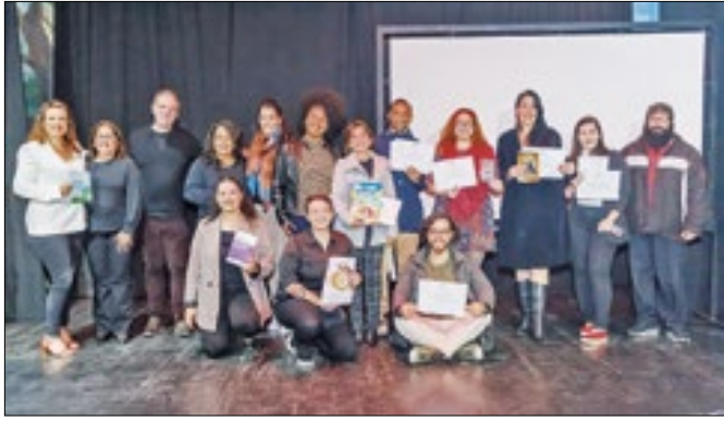
Exemplares serão distribuídos em escola municipais