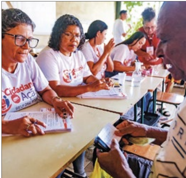
Projeto oferece uma série de serviços aos moradores