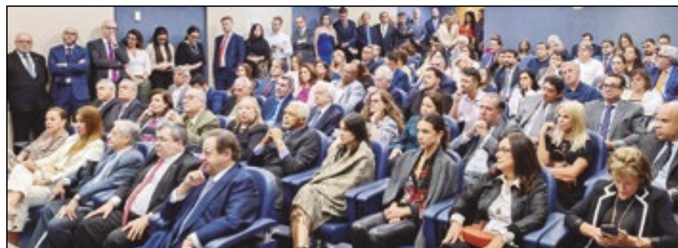
Público prestigiou a homenagem pela Emerj aos desembargadores na última segunda-feira