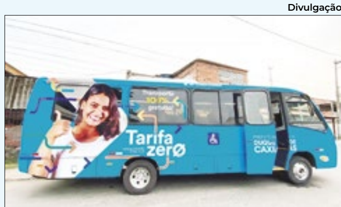
Município lançou terceira linha do Programa Tarifa Zero

mes publicados pelo Governo do Estado do Rio de Janeiro, no Diário Oficial. A entrega foi realizada na Estação da Cidadania, sede da Semascf, na Avenida Retiro da Imprensa, 1423, Bairro Piam, das 9h às 13h30 aos beneficiários com nomes iniciados pelas letras B, C e D.