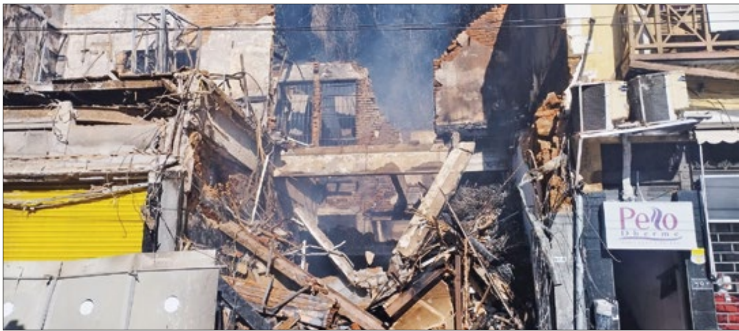
Órgãos de tombamento estão acompanhando os desdobramentos após mais um incêndio no Centro Histórico de Petrópolis