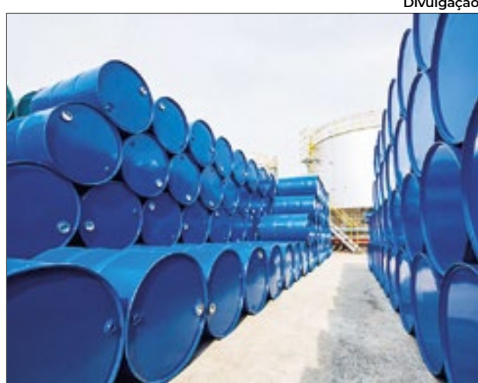
Previsão é de que certame deve levantar R$ 15 bilhões