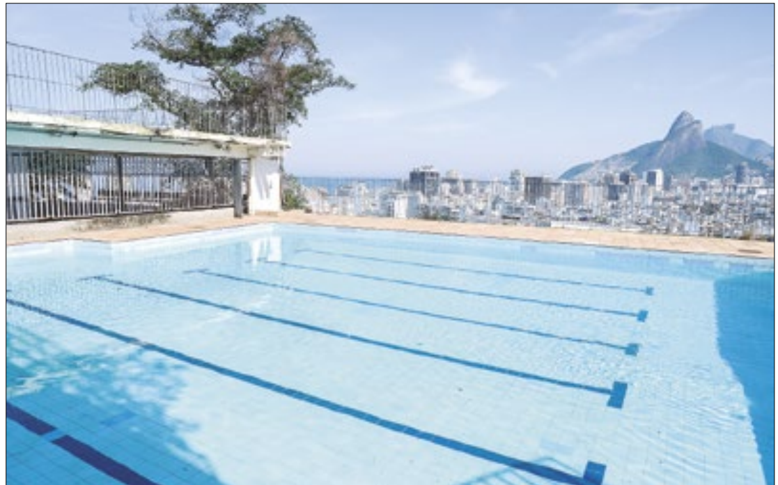
Com o investimento de R$ 15 milhões, reforma vai restabelecer serviços públicos gratuitos

Ao fim de todas as etapas, as intervenções trarão mais quatro elevadores, um Restaurante Escola da Faetec, além de uma Biblioteca Parque, um Núcleo de Atendimento ao Cidadão (NAC), o Museu de Favela do Cantagalo (MUF), uma área administrativa da Polícia Militar do Rio de Janeiro (batalhão) com o uso de elevadores exclusivos, uma feira de artesanato