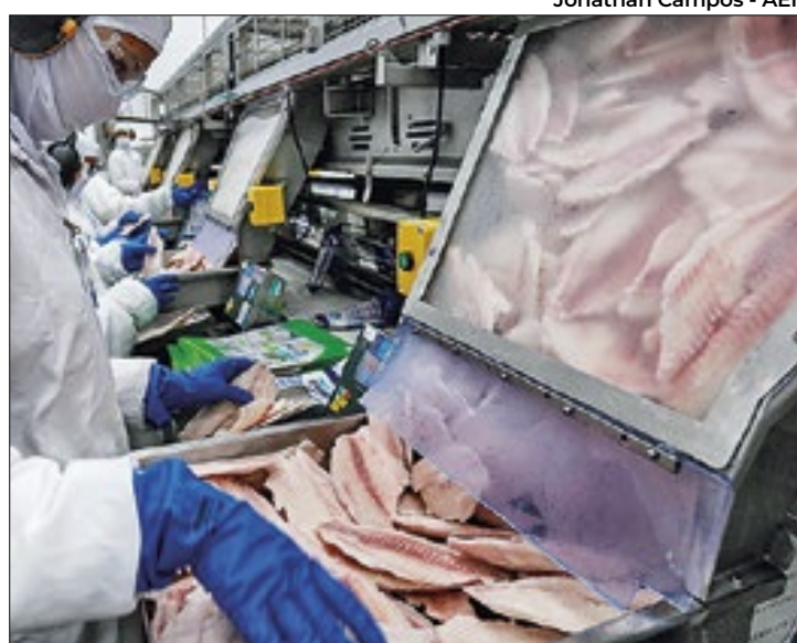
Indicador acumula alta de 4,19% nos últimos 12 meses,

Para o analista da pesquisa do instituto, Felipe Câmara, “esse resultado consolida o fim de um período de dominância do ciclo das commodities sobre a inflação industrial brasileira”, ao chamar a atenção para o contraste os resultados dos primeiros semestres de anos anteriores (inflação de 10,12% em junho