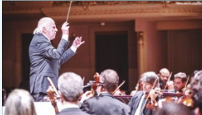
Maestro Isaac Karabtchevsky regerá a homenagem