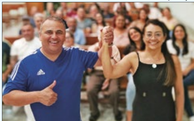
Convenção será realizada na Câmara Municipal