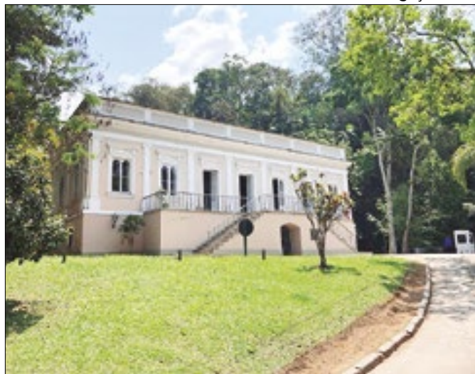
Espaço funcionará na Casa da Educação