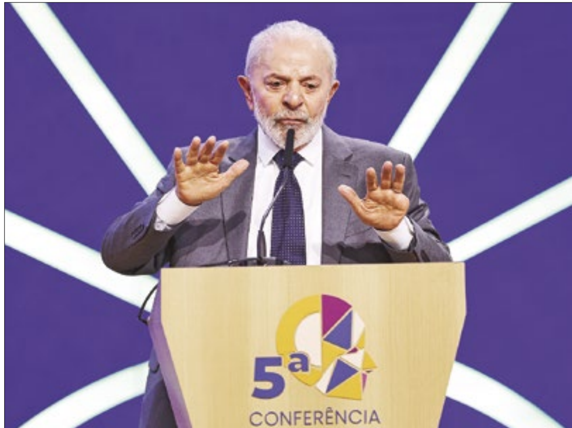
Lula considerou “normal” o processo eleitoral na Venezuela