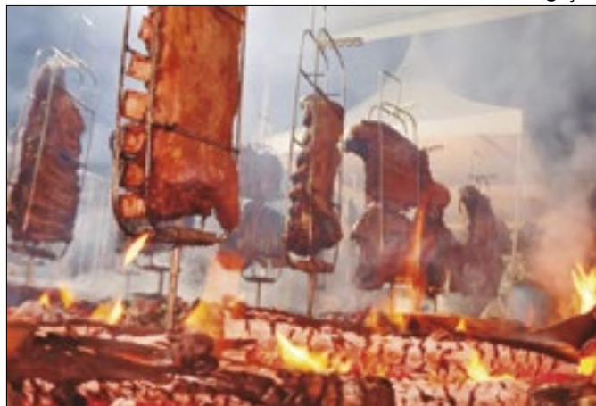
Blend BBQ Festival retorna ao ParkJacarepaguá