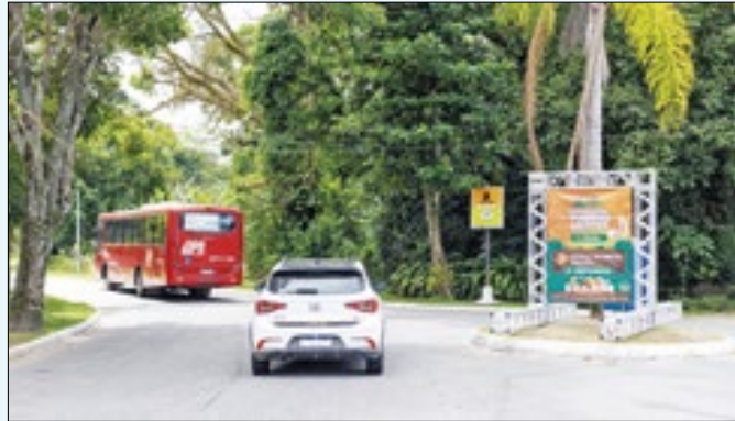
Quarta edição do evento tem como tema o Dia dos Pais