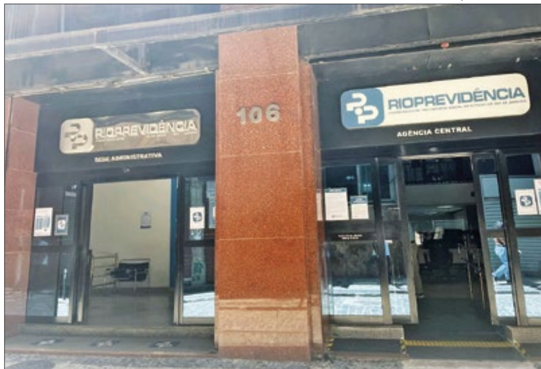
Recenseamento é obrigatório e pode ser feito em uma das agências do Rioprevidência

A história de Claudinho e Buchecha" e "Pedágio", filmes participantes da 23ª edição do Grande Prêmio do Cinema Brasileiro, concedido anualmente pela Academia Brasileira de Cinema. Após cada sessão, os espectadores poderão votar em suas obras preferidas.