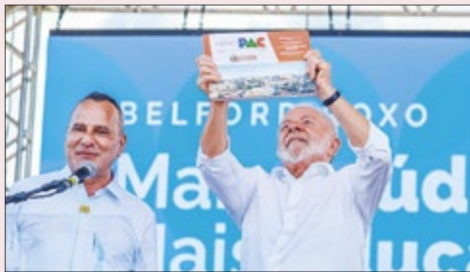
Waguinho é um dos nomes apoiados no Republicanos