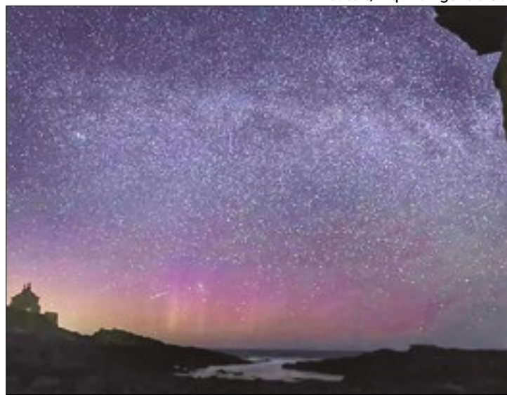
Evento astronômico pode ser visto em todo país

Os Alpha Capricornídeos, conhecidos por sua baixa taxa de meteoros, com uma média