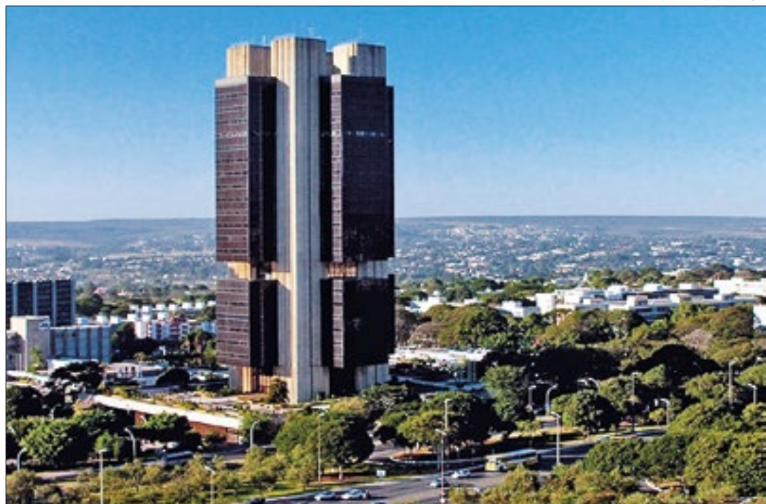
Expectativa do mercado é de que Copom mantenha taxa básica no patamar atual

Isso porque a decisão do colegiado, todavia, deve vir acompanhada de um ‘alerta’ quanto à possibilidade de a Selic voltar a subir de patamar, em decisões futuras, a depender da evolução dos indicadores macroeconômicos, a exemplo das expectativas de inflação e as recorrentes incertezas (ou desconfianças) que pairam no que toca ao cumprimento do arcabouço fiscal e a ‘promessa’ de déficit zero,