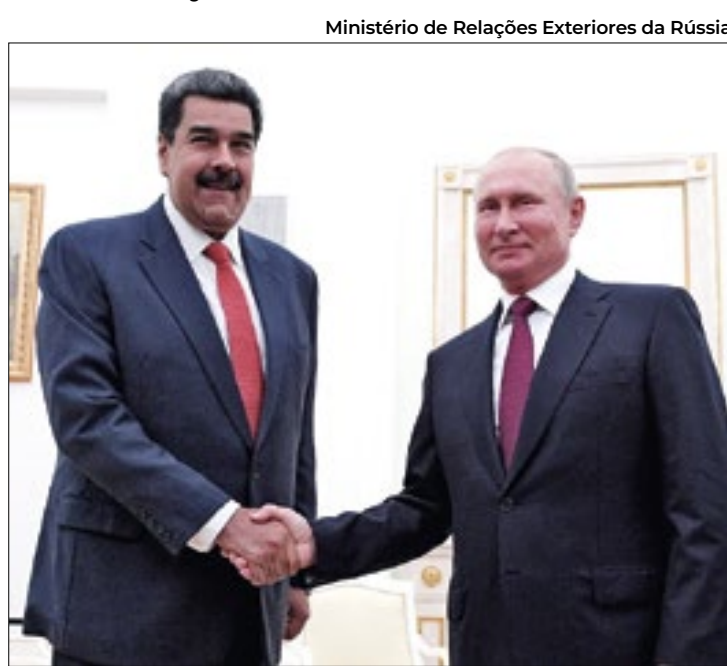
Ministério de Relações Exteriores da Rússia

Esse pode ser o início de mais uma longa jornada de manifestações no país, que vive múltiplas crises há mais de uma década. Liderados por María Corina Machado, os críticos ao regime denunciaram uma fraude no pleito de domingo (28) e afirmaram que a votação deu vitória para Edmun-