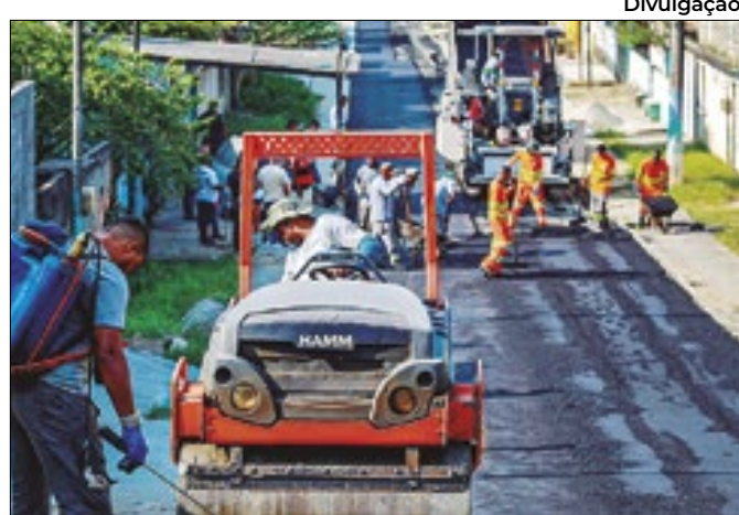
Vila Pauline recebe obras de drenagem e pavimentação