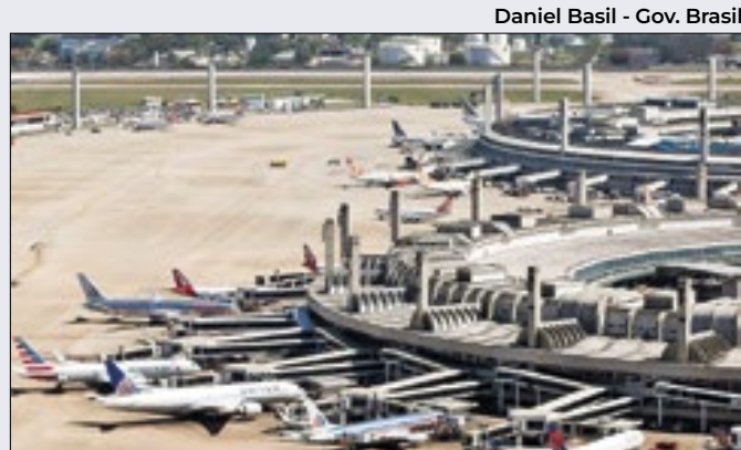
Afluxo de recurso externo supera o da Copa do Mundo

Se, durante a abertura das propostas, os preços ficarem muito próximos entre si, na etapa seguinte, o leilão passa a ser feito em viva-voz, em que cada empresa oferecerá um valor inferior ao limite mínimo de preço fixado pela Pré-Sal Petróleo, até que saia a vencedora.