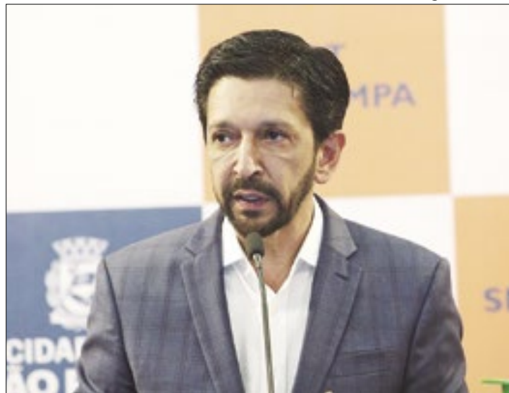
Ricardo Nunes lidera apenas um ponto à frente

O prefeito Ricardo Nunes (MDB), o deputado federal Guilherme Boulos (Psol) e o apresentador de TV José Luiz Datena (PSDB) aparecem empatados tecnicamente na disputa pela prefeitura de São Paulo em nova pesquisa do Instituto Quaest divulgada na terça-feira (30).