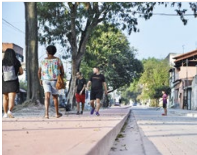
Novos trechos do MUVI, corredor viário de São Gonçalo