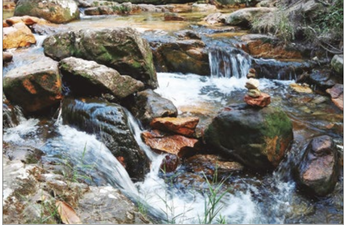
Trabalho é em atendimento a uma recomendação do Ministério Público do Rio de Janeiro

O Instituto Estadual do Ambiente (INEA) acatou a recomendação do Ministério Público do Estado do Rio de Janeiro (MPRJ) e, nesta terça-feira (30), foi publicada no Diário Oficial do Estado do Rio de Janeiro a portaria que cria o Grupo de Trabalho para revisar todas as licenças ambientais ou atos análogos dos últimos cinco anos na região Rio Dois Rios, onde foram ou vierem a ser identificados indícios de ilegalidade nos respectivos processos de concessão.