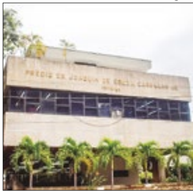
Ação para facilitar o acesso

A Secretaria Municipal de Assistência Social estará nesta quinta-feira (1), na Euclidelândia, em Cantagalo, com o “Suas em Casa”. O projeto tem como objetivo facilitar o morador do distrito, trazendo para ainda mais perto de casa, atendimento e orientações sobre os serviços e benefícios de proteção social básica e proteção social especial. A equipe de Assistência Social ainda ofertará fichas de inscrições para participação nas oficinas.