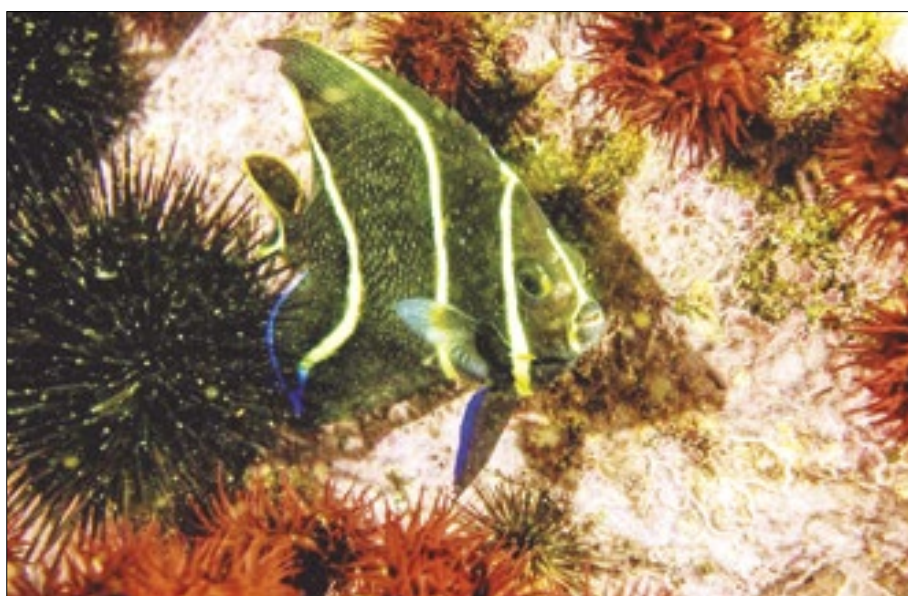
Peixe Paru na Praia do Flamengo