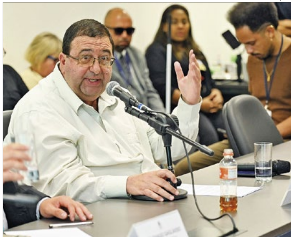
Deputado se reuniu com a superintendência da entidade, com o prefeito Neto e com SMS

O Programa de Triagem Pré-Natal visa a redução da transmissão vertical, a partir de triagem de oito patologias: sífi-