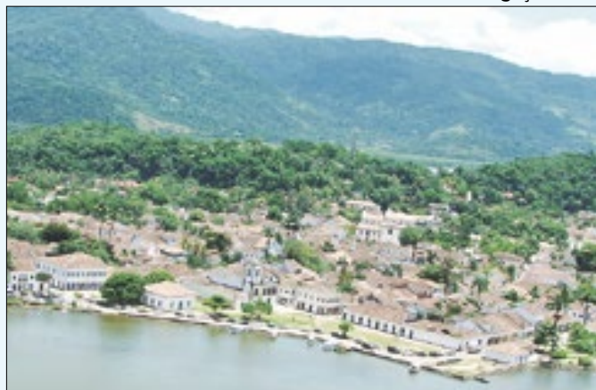
Queda de árvore de grande porte afetou a energia