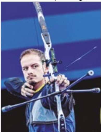
Marcus D'Almeida é esperança de medalha em Paris 2024