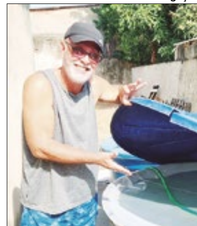
Moradores têm água em casa