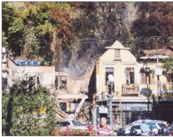
Incêndio destruiu imóvel na Rua do Imperador