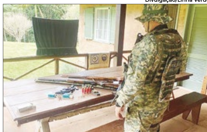
Denúncia foi feita ao programa Linha Verde

Os agentes dirigiram-se ao bairro Murry, onde localizaram e confiscaram quatro armas de fogo, um simulacro e 45 munições. Entre os materiais apreendidos estavam uma espingarda