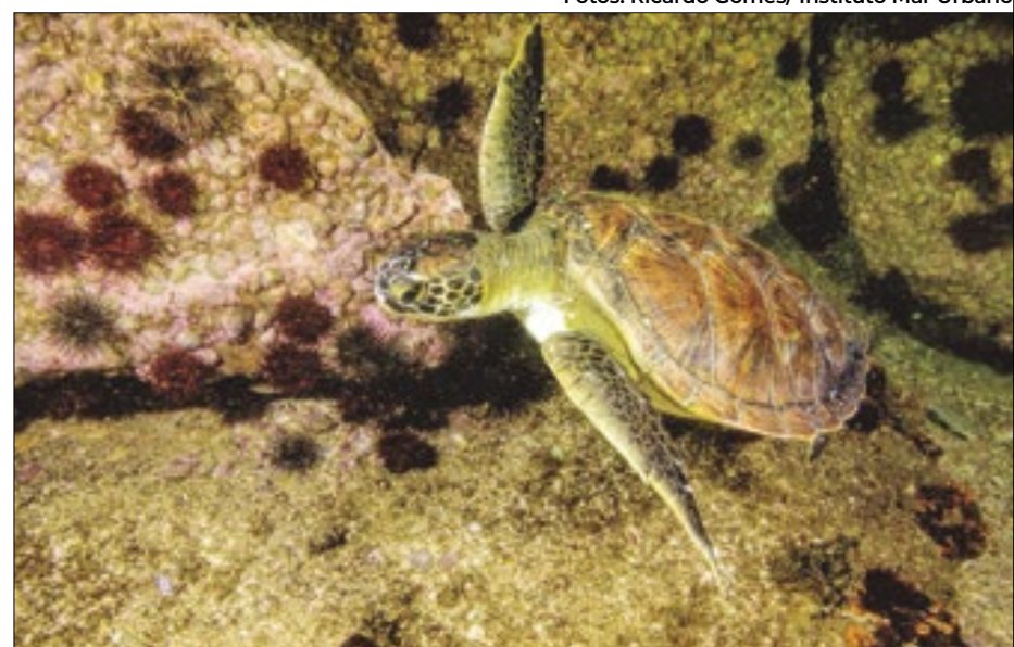
Tartaruga verde na Praia do Flamengo