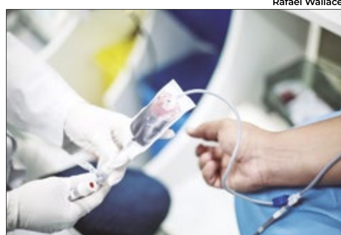
Ação quer aumentar o número de doadores diários