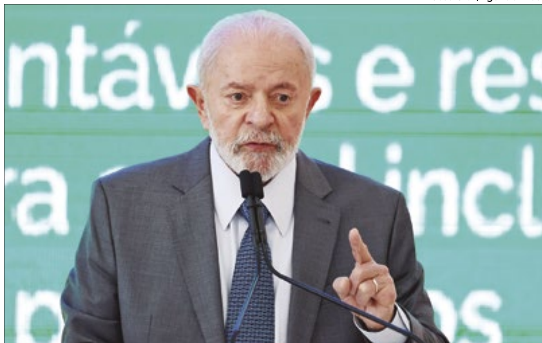
Lula fez pronunciamento na noite de domingo (28)

O PSDB acusa Lula de usar o espaço público para fazer propaganda eleitoral. “O presidente usou desse expediente para fazer propaganda da divisão do país da qual ele é um dos protagonistas e espalhar dados eleitorais para subsidiar o discurso de seus candidatos a prefeito e vereador neste ano”, manifestou o PSDB, por meio de nota assinada pelo presidente do partido, Marconi Perillo.