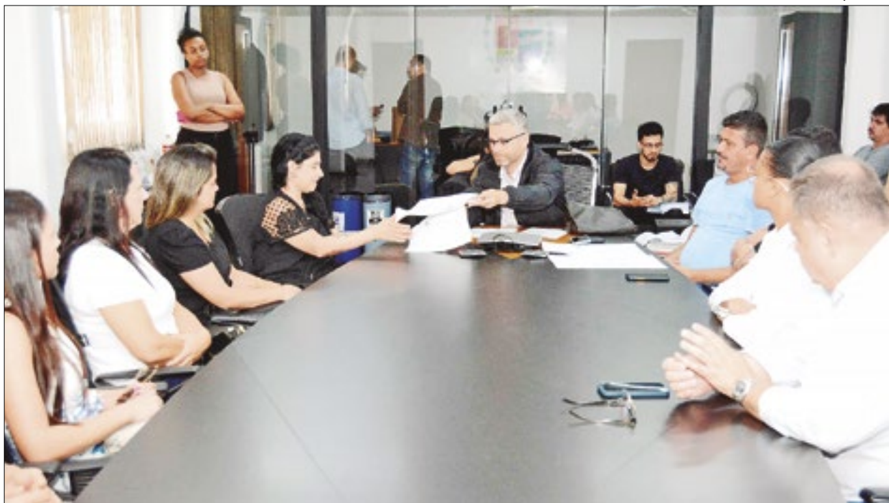
Prefeito também assina autorização para a construção do Mercado do Produtor e três pórticos nas entradas de Barra Mansa

bispo Santos, Centro. Mas áreas podem ser utilizadas para publicidade de soluções tecnológicas nas áreas de petróleo e gás, náutica e naval, energias, turismo, saúde e sustentabilidade. O espaço inclui salas de coworking, entre outras.