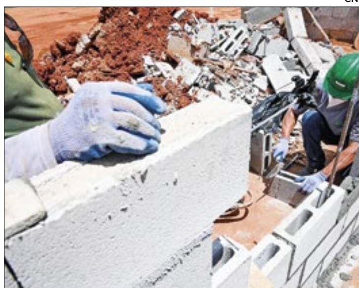
Setor vê dificuldade crescente para contratação de pessoal

Como resultante, o Índice de Confiança do Empresário da Indústria de Construção