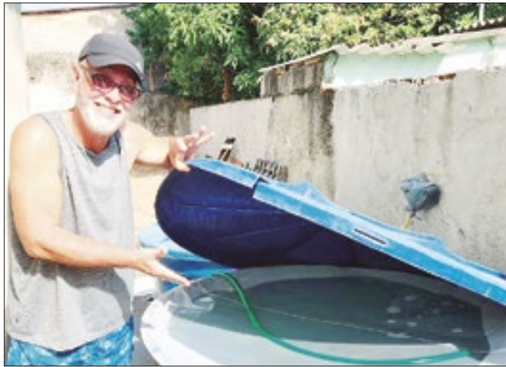
Moradores de Mesquita celebram revitalização no sistema de abastecimento