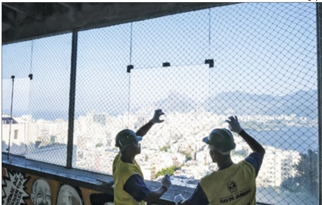
Início da primeira etapa da reforma do Edifício Multiuso no Pavão-Pavãozinho e Cantagalo

O endereço das unidades e os detalhes de todas as vagas oferecidas podem ser encontrados no Painel Interativo de Vagas da Secretaria de Trabalho.