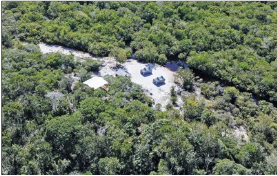
Brasileiros iniciaram inventário com dados da Floresta Amazônica

Quase cinco anos depois, as seis melhores soluções passaram pelo teste final neste mês de julho, dentro da Reserva de Desenvolvimento Sustentável do Rio Negro, a cerca de 25 quilômetros de Manaus, no Amazonas.