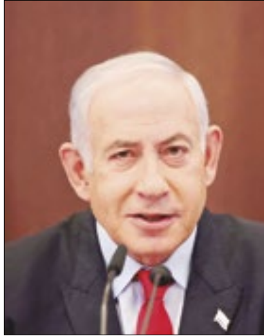
Netanyahu foi vaiado em Golã

Milhares de bombeiros dos EUA foram ajudados pela melhoria do tempo durante o fim de semana contra os incêndios florestais na Califórnia, mas precisaram fazer mais evacuações de emergência na região.