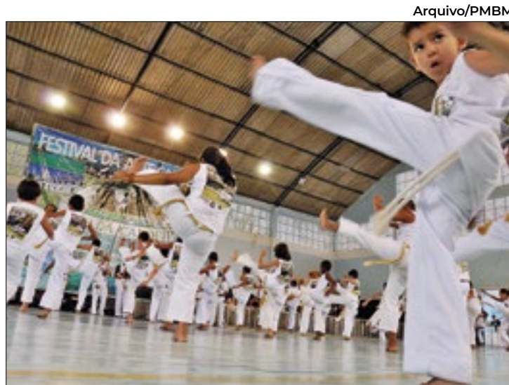
Mestre da capoeira serão homenageados em solenidade

Na cerimônia serão entregues certificados de 4º grau de mestre e roda de capoeira para os homenageados. Ao todo serão cinco mestres participando da solenidade, sendo três de Barra Mansa. Os demais são das cidades de Resende e Joinville (Santa Catarina). Todos os