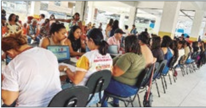
Prefeitura deu continuidade a entrega dos cartões