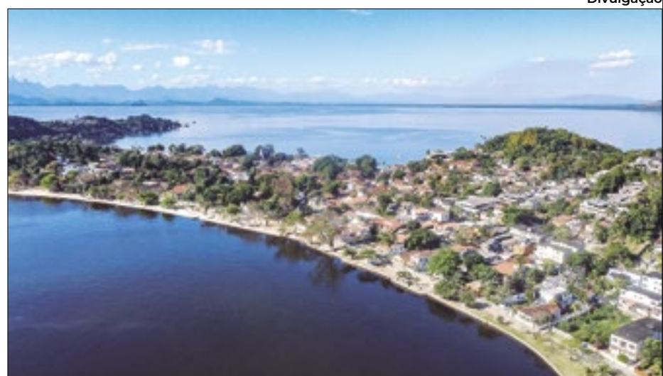
Águas mais limpas na Praia do Flamengo