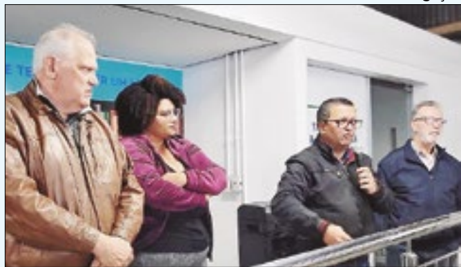
Anúncio foi feito na sede da Comdep no Quitandinha