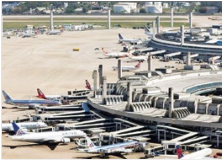
Aeroporto é porta de entrada para estrangeiros

O recorde de entrada de divisas caminha ao lado do au-