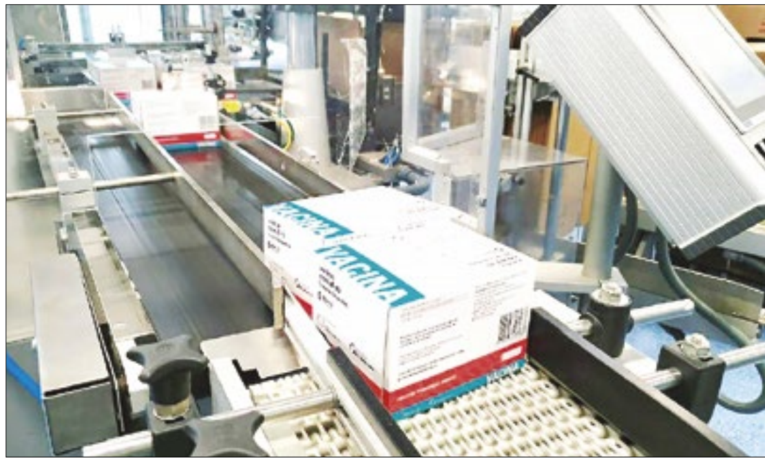
Biomanguinhos passa a integrar rede de preparação para epidemias

A rede deverá contribuir para reduzir o tempo neces-