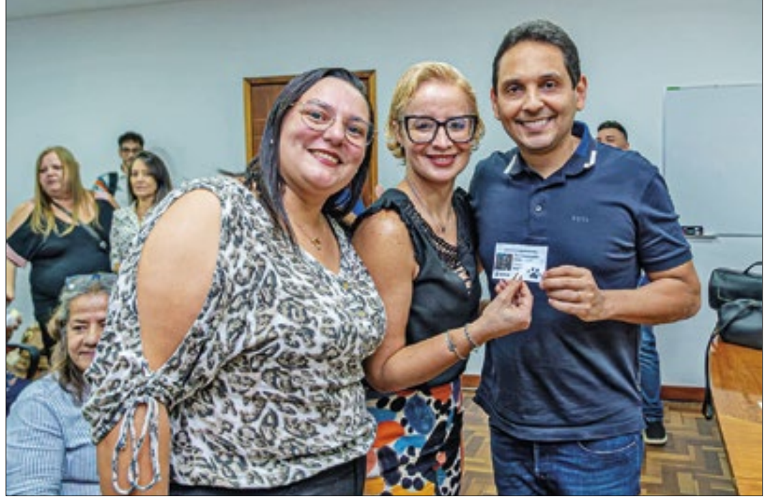
Protetores de animais receberam carteirinha do prefeito de Nilópolis, Abraãozinho

"Com essas carteirinhas, os protetores poderão levar até cinco animais para castração todos os meses. Quem não é protetor, pode levar um pet mensalmente. As doações de medicamentos e ração junto às pet shops que receberam o selo 'amigo dos animais' serão direcionadas, prioritariamente, aos protetores", garantiu Abraãozinho, acrescentando que a Clínica Municipal Veterinária