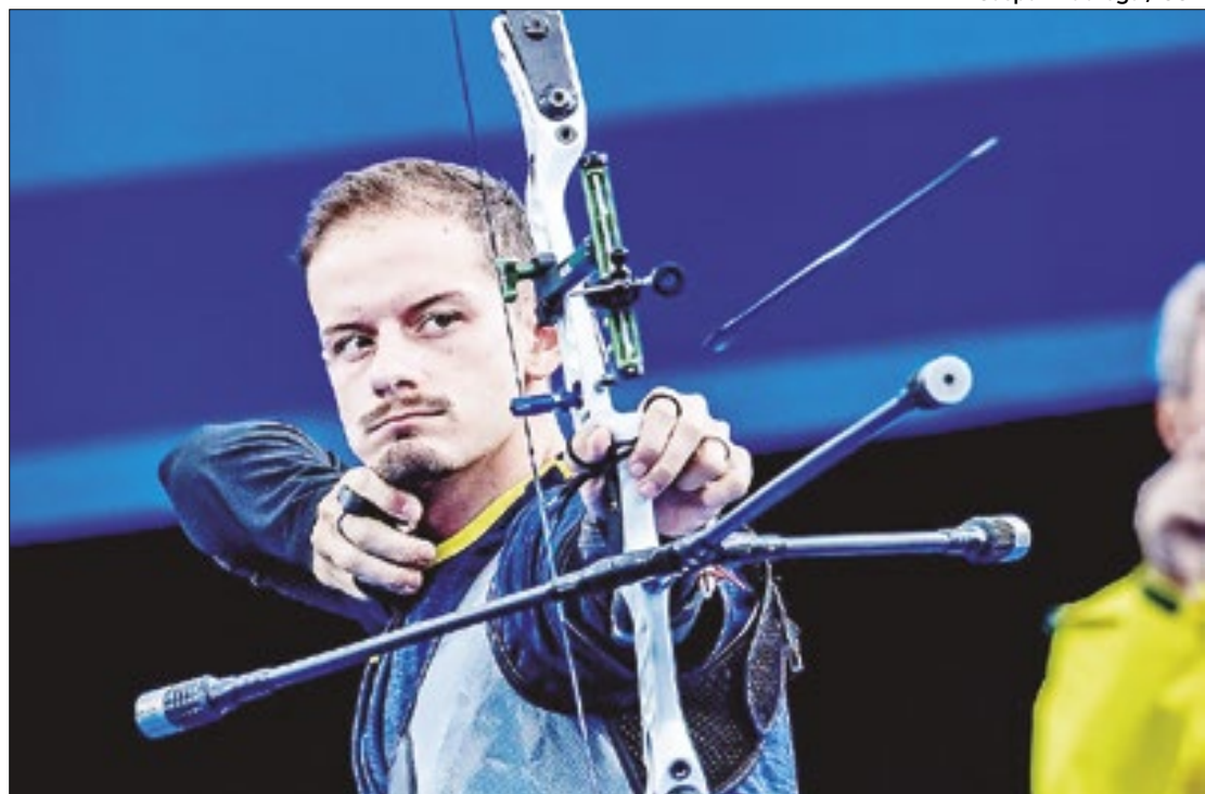
Número um do mundo e esperança de medalhas, Marcus D'Almeida é cria do Bolsa Atleta

O Bolsa Atleta RJ não tem fronteira. A premissa é apoiar, incentivar e fomentar o desenvolvimento do desporto e do paradesporto em todo o estado, com foco na base para revelar novos prodígios como Marcus D'Almeida. De Maricá, Região Metropolitana do Rio, o arqueiro, de 26 anos, chega a Paris com status de favorito ao pódio. Número 1 do mundo no tiro com arco, o atleta ainda comemora a conquista que consi-