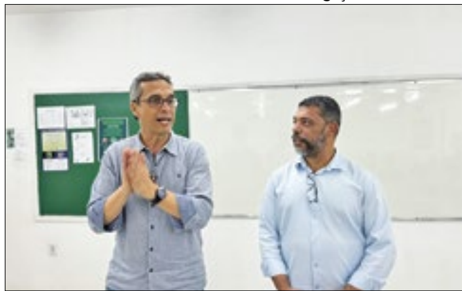
Deputado estadual apoiará o ex-prefeito de Pinheiral