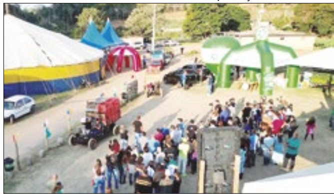
Evento atraiu os moradores do 2º distrito da cidade