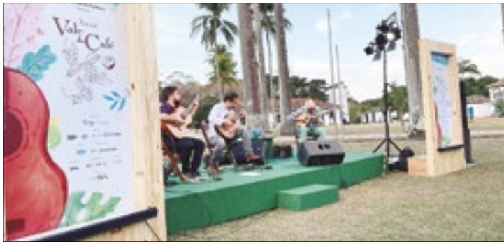
Convidados e hóspedes foram presenteados com uma boa música durante o encontro em Vassouras

Convidados e hóspedes da São Luiz da Boa Sorte assistiram ao pôr do sol de uma tarde mágica. Depois visitaram o Museu do Café e o Memorial do escravizado. Ouviram a história do “legado escravizado na Região” e encerraram a programação com um “queijos e vinhos”.