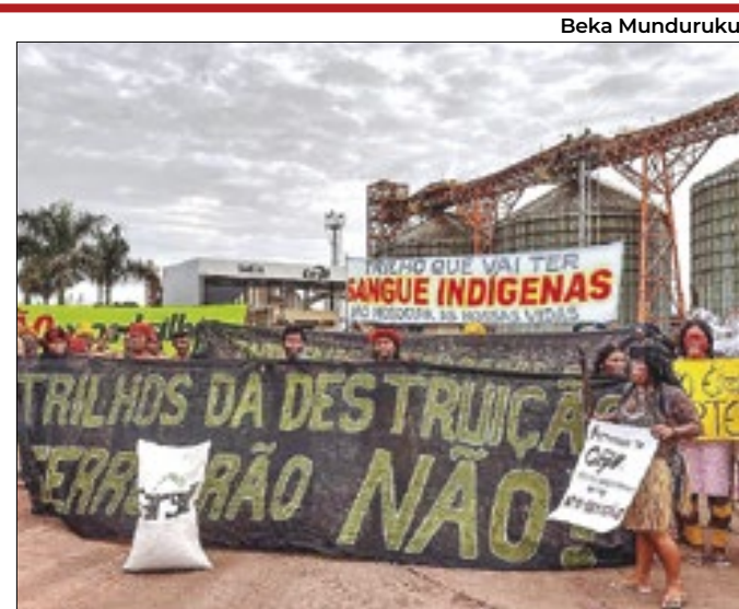
Indígenas protestam contra a Ferrogrão