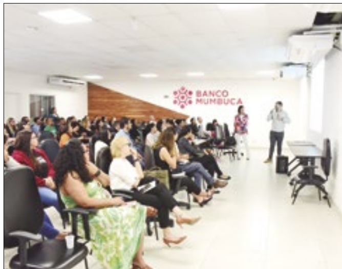
Plano consiste em apontar as metas orçamentárias