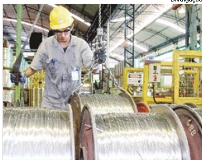
Indicador subiu 3,3 pontos em julho, para 101,7 pontos