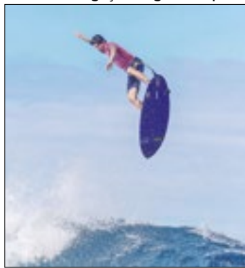
Medina teve a maior nota da história olímpica do surfe