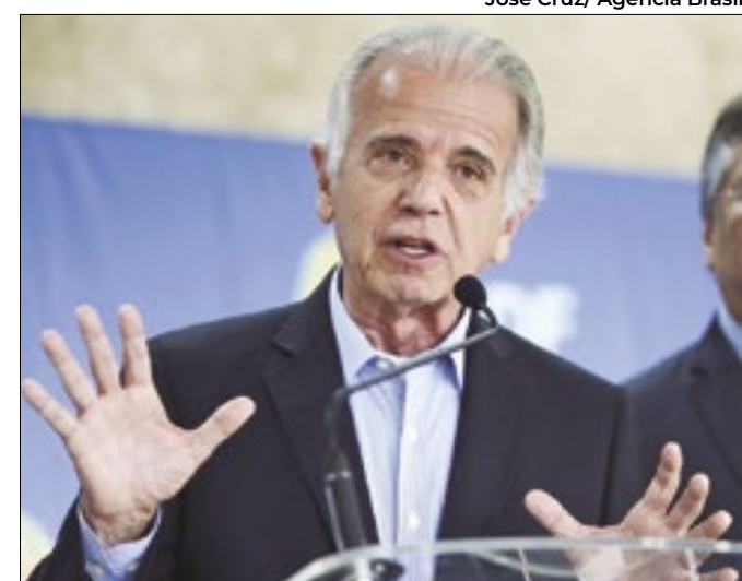
Ministro da Defesa, José Múcio.