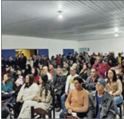
Evento acolheu todo o público