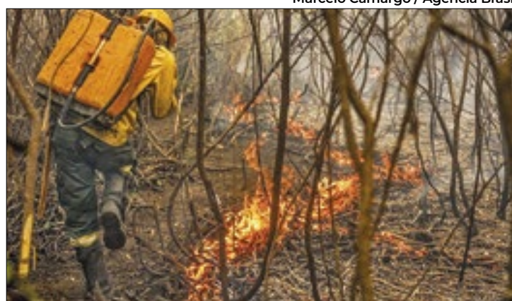
Umidade baixa e altas temperaturas agravam situação