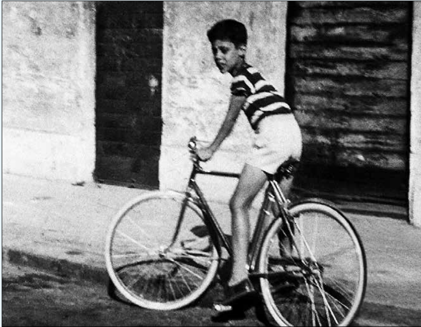
Imagem da infância de Chico Buarque em Roma nos anos 1950