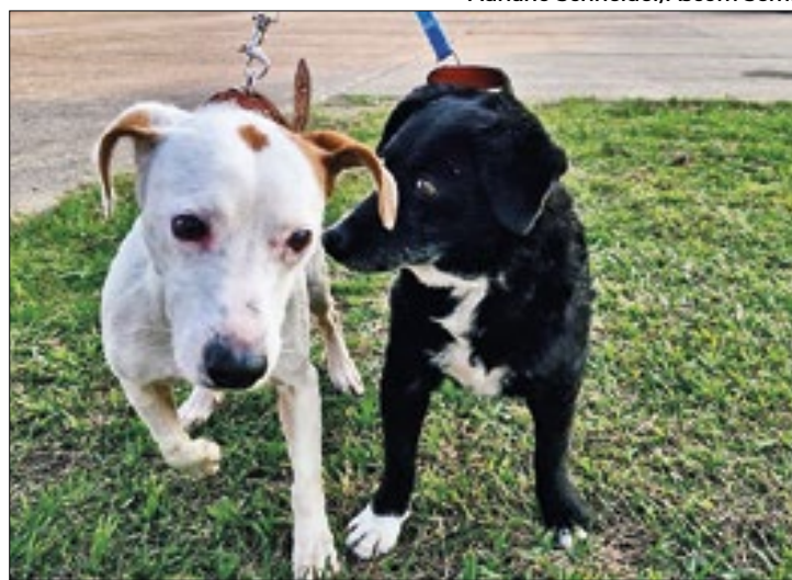
Força-tarefa envolve governo do RS, Exército e Força Aérea

O governo do Estado – por meio da Secretaria do Meio Ambiente e Infraestrutura (Sema) –, o Exército Brasileiro, a Força Aérea Brasileira (FAB) e os parceiros Arcanimal e Grupo de Resgate de Animais em Desastres (Grad) realizaram, na sexta-feira (26), uma nova força-tarefa para enviar, ao Rio de Janeiro (RJ), animais resgatados na enchente do Rio Grande do Sul.