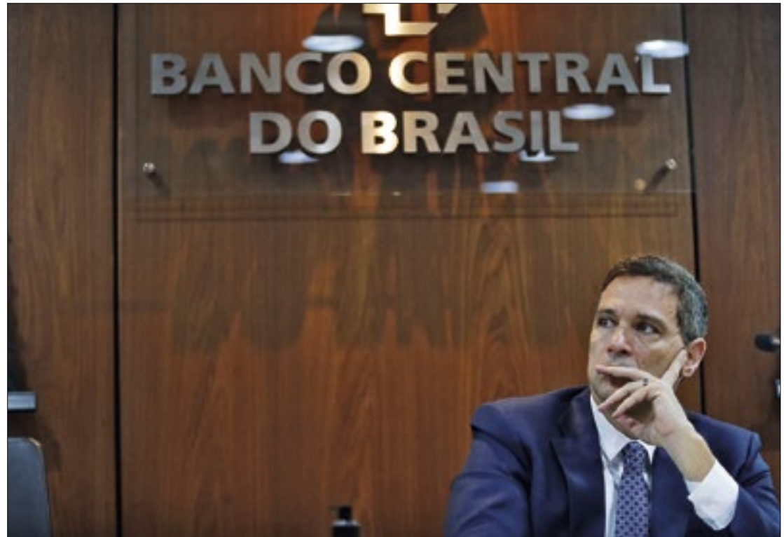
Expectativa sobre quem substituirá Campos Neto também gera pressão

Por isso, a expectativa de manutenção da taxa. O que, certamente, não deixará satis-