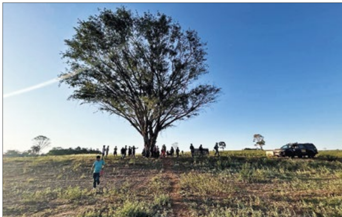
Funai explica que a preservação dos direitos humanos é um dos fundamentos do Estado

Em nota, a Funai explica que a preservação dos direitos humanos é um dos fundamentos do Estado brasileiro, con-