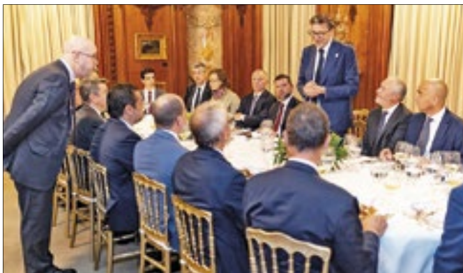
Giancarlo Giorgetti ressaltou o crescimento econômico do Brasil e o fortalecimento das parcerias empresariais