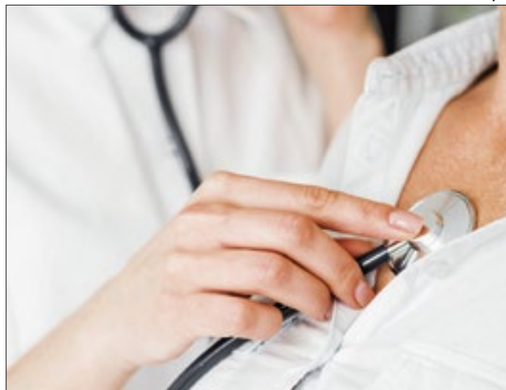
Baixa temperatura faz vasos sanguíneos se contraírem

“Uma das situações é que o frio faz os vasos sanguíneos se contraírem em resposta ao frio. Com isso, em alguns casos, pode ter aumento da pressão arterial e isso acaba criando uma resistência ao bombeamento de sangue do coração, o que pode sobrecarregar um pouco o coração. É um dos mecanismos”.