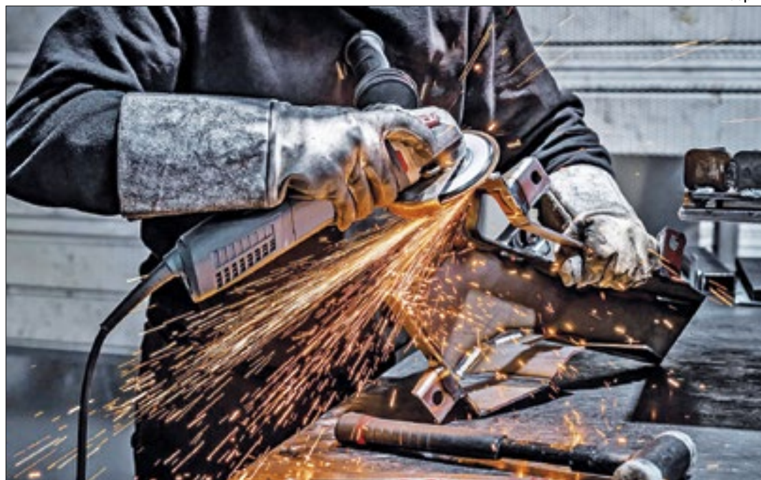
Preocupação é com atividades que levam riscos de amputações e cortes

“São raros os ofícios onde você não usa a mão e nós falamos que a cabeça pensa e a mão executa. Por isso a mão é nosso objeto de trabalho, de ataque e de defesa, porque se caímos é a mão que vai à frente, se alguém tenta jogar algo no nosso ros-