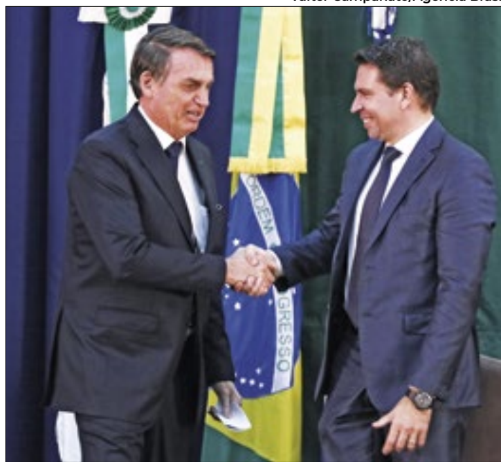
Ramagem passou orientações a Bolsonaro

Os dados estariam armazenados no e-mail do então diretor da Agência Brasileira de Inteligência. Neles, também constaria crítica à postura de ministros do Supremo Tribunal