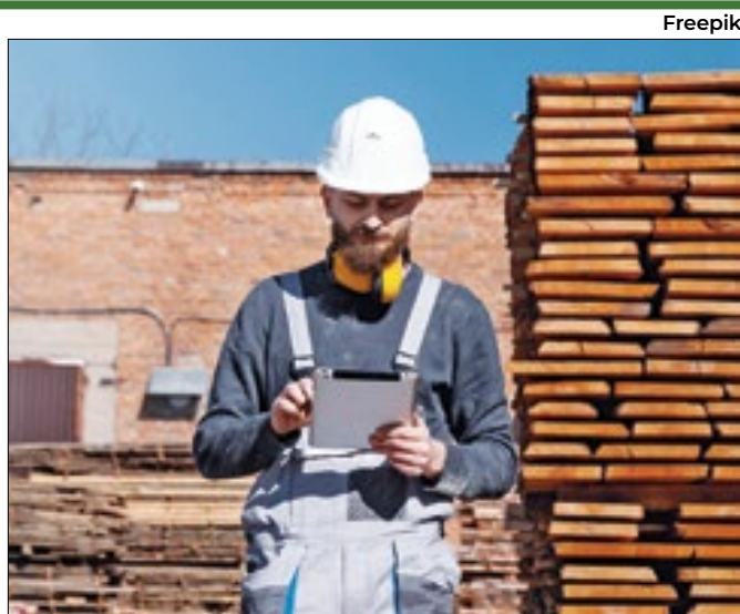
Brasil está em terceiro lugar em número de casos,