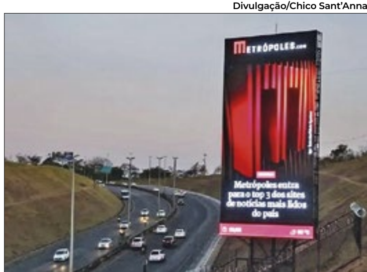
Painel na subida da Ponte JK deverá ser desligado

Há cerca de um mês, “Brasilienses” vem publicando uma série que trata da poluição visual que tomou conta do Distrito Federal – sobretudo na área tombada do Plano Piloto de Brasília – por conta da infestação dos painéis de LED instalados às margens das rodovias da cidade. A maior parte deles (os tótons vermelhos) é da empre-