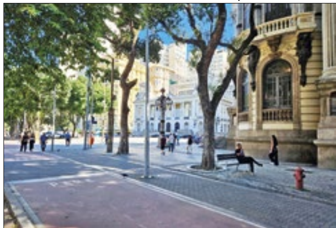
Centro teve sua importância histórica reconhecida

André Coelho/ Câmara Municipal do Rio de Janeiro