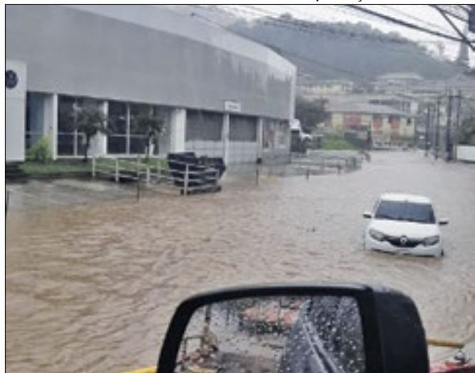
Projeto para conter cheias do Rio Quitandinha é escolhido