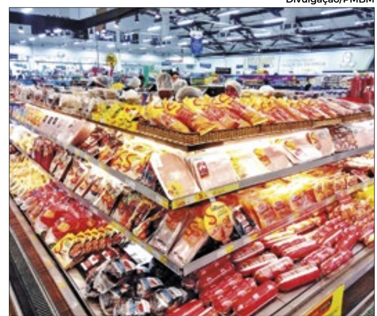
Procon pesquisa preços de 32 produtos em supermercados

O consumo das famílias brasileiras nos supermercados