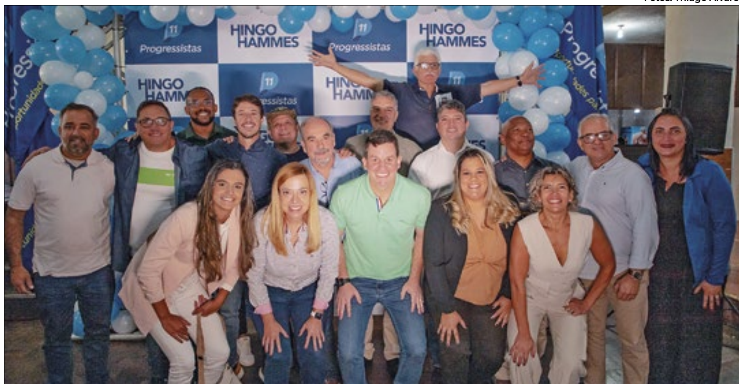
Foram confirmados os nomes dos dezesseis candidatos a vereadores que vão concorrer pelo PP em Petrópolis

“Esse é um momento muito especial. E de grande res-