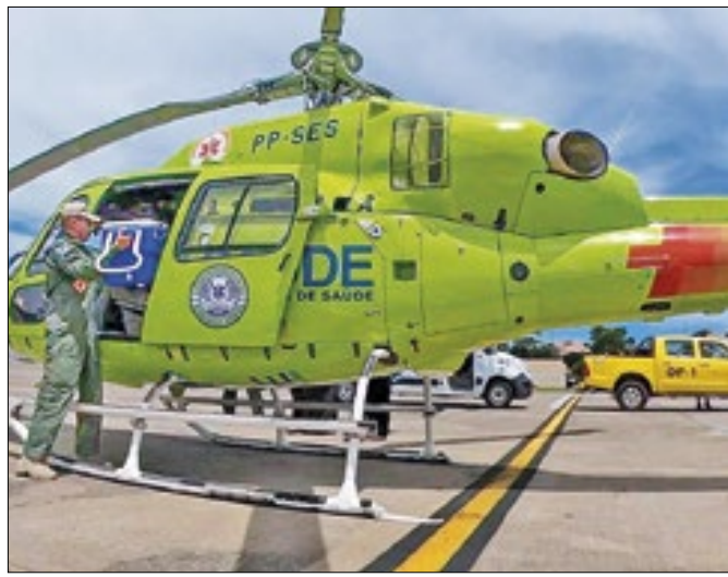
Rio é o único estado a fazer esse tipo de transporte