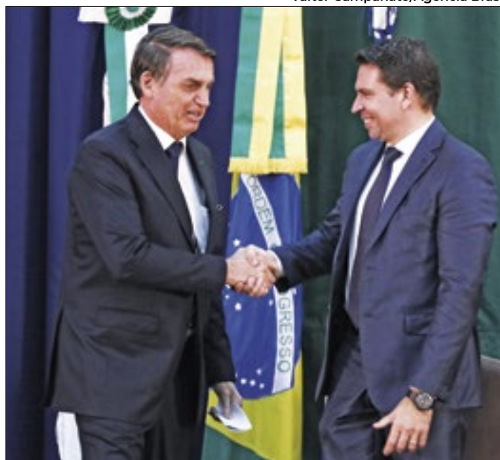
Ramagem passou orientações a Bolsonaro

Os dados estariam armazenados no e-mail do então diretor da Agência Brasileira de Inteligência. Neles, também constaria crítica à postura de ministros do Supremo Tribunal