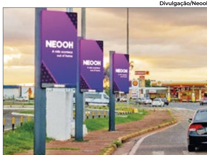
Painéis no Aeroporto JK não são atingidos pela medida

A Ação Popular trouxe à cena jurídica uma guerra de argumentos entre o DER-DF (a favor) e o Ministério Público (contra) os painéis de LED espalhados pela cidade. Muitas delas sobre as competências do