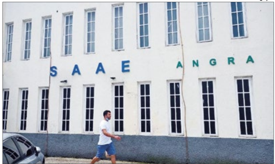
Prefeitura e Saae reforçam ações para economizar água e reduzir o desperdício

Os bairros que terão abastecimento intermitente nos