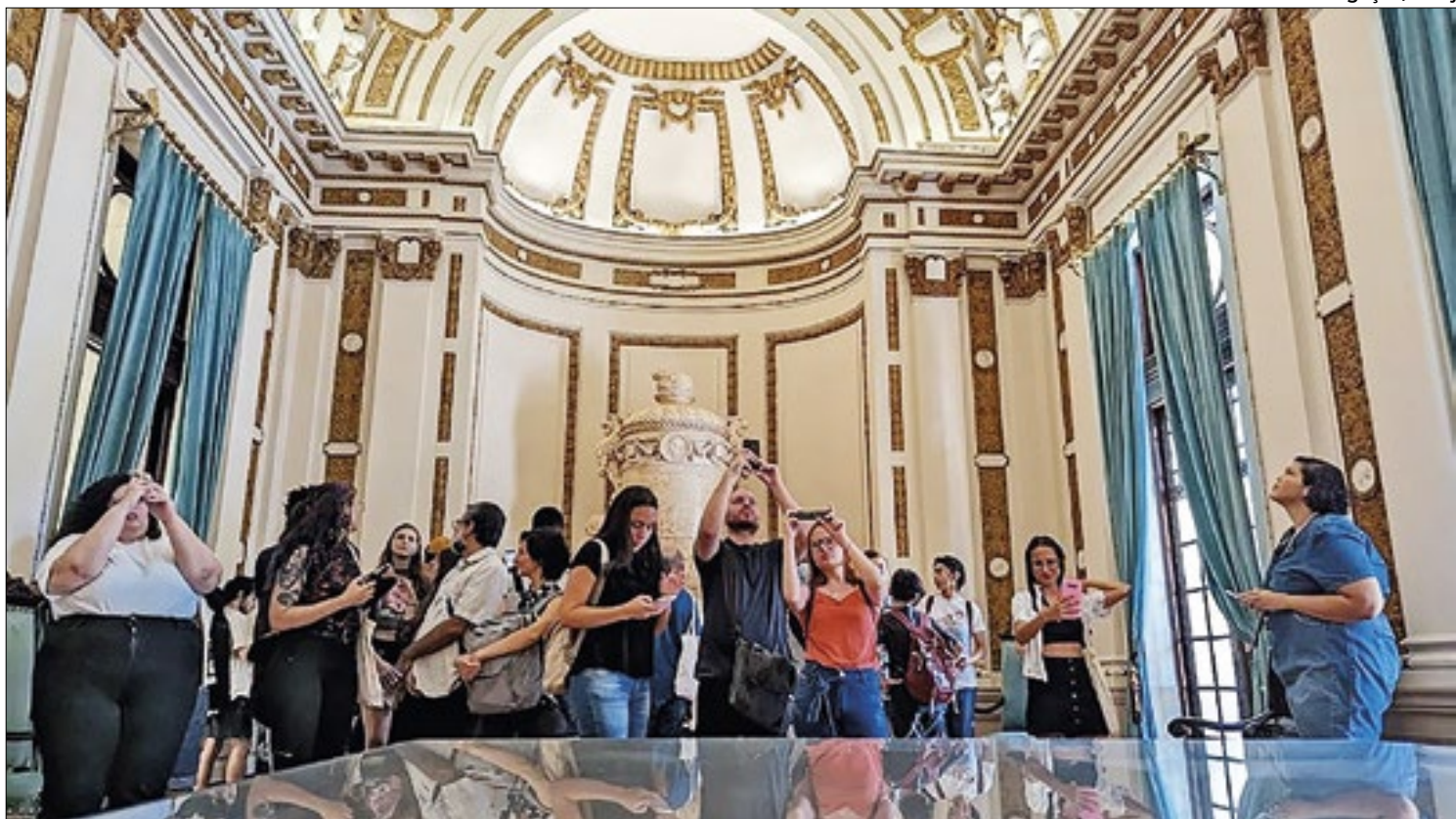
Palácio registrou cerca de três mil visitantes durante este mês de julho

“A proposta é apresentar e, também, expandir nossos próprios territórios com a força poética e musical de cada um, em um encontro de amigos”, disse Maria Gadú.