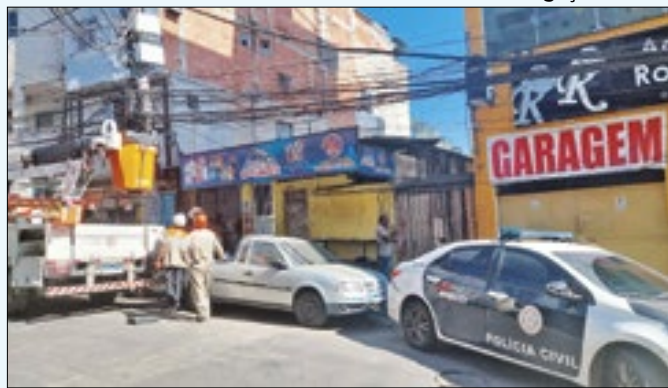
Ação Ordo em 16 comunidades da Zona Oeste