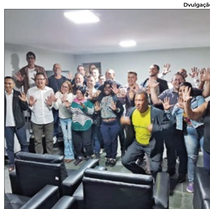
Republicanos faz convenção no Clube Municipal