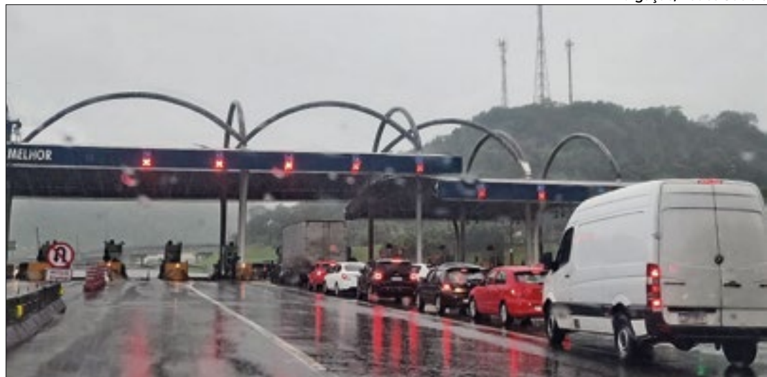
Leilão de concessão da BR-040/495/MG/RJ deve acontecer no primeiro semestre de 2025