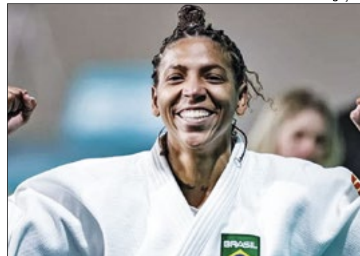
A campeã olímpica e mundial Rafaela Silva