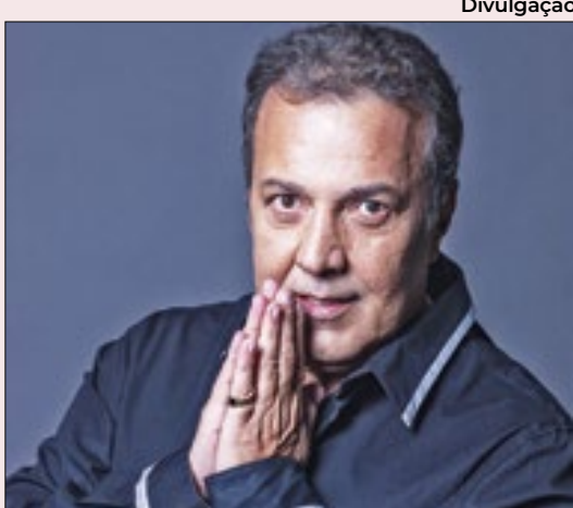
Referência da canção romântica, José Augusto falou com exclusividade ao Correio da Manhã às vésperas do show que fará em 16 de agosto no Vivo Rio. "O amor sempre vai existir", diz