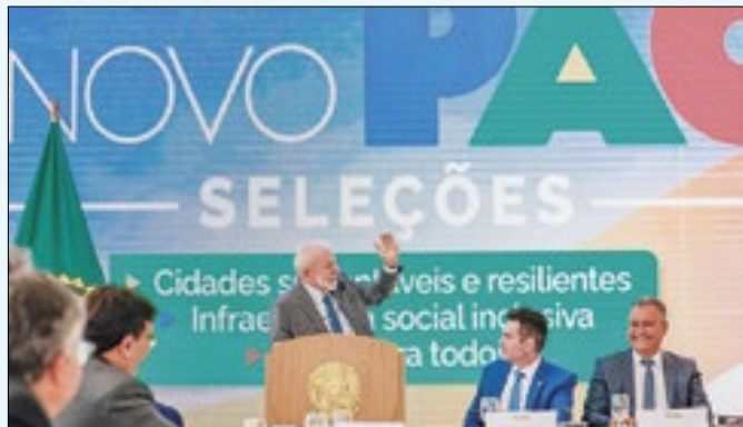
Anúncio foi feito pelo presidente Lula nesta sexta