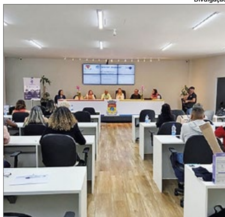
Profissionais de saúde participaram da capacitação