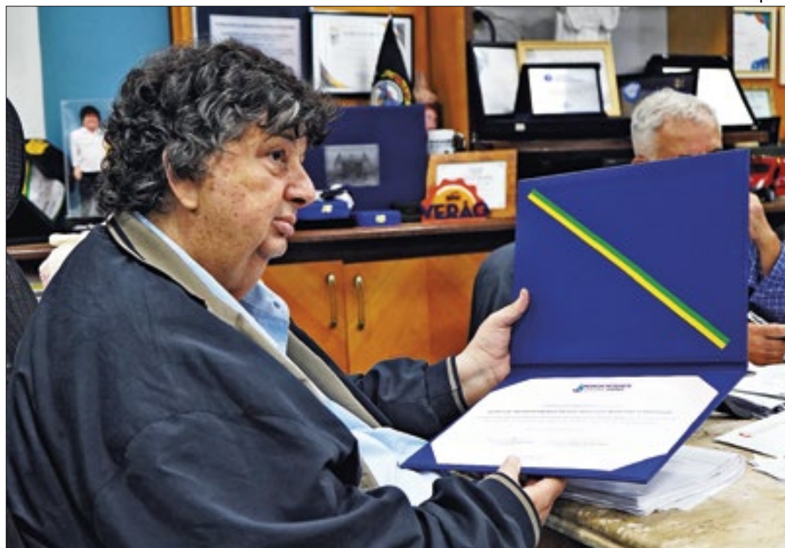
Prefeito de Volta Redonda, Antonio Francisco Neto

-Ninguém faz nada sozinho e contar com tanto apoio nos dá a certeza de que estamos no caminho certo. Volta Redonda precisa de união de todas as forças possíveis e foi isso que buscamos. Agradeço a todos que estão conosco em nossa jornada - afirmou o prefeito, que disputará o sexto mandato como prefeito da Cidade do