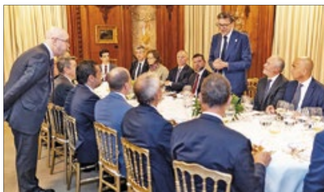
Giancarlo Giorgetti ressaltou o crescimento econômico do Brasil e o fortalecimento das parcerias empresariais