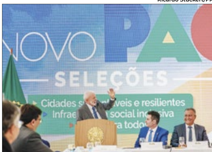
Lula anuncia PAC Seleções e garante: sem viés partidário

Lula agradeceu aos governadores que puderam comparecer ao evento e disse que, quando via-