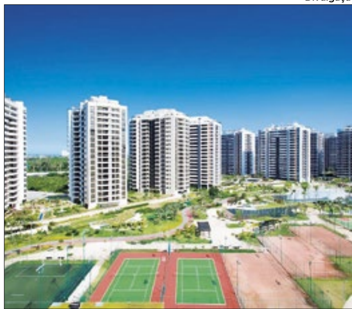
Estrutura do Ilha Pura abrigou os atletas da Rio 2016

Mas dos 3.604 apartamentos construídos, menos de 40% foram vendidos. Agentes do mercado imobiliário carioca avaliam que a taxa de ocupação dos apartamentos, com pessoas