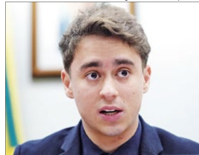
Deputado foi denunciado ao Supremo Tribunal Federal