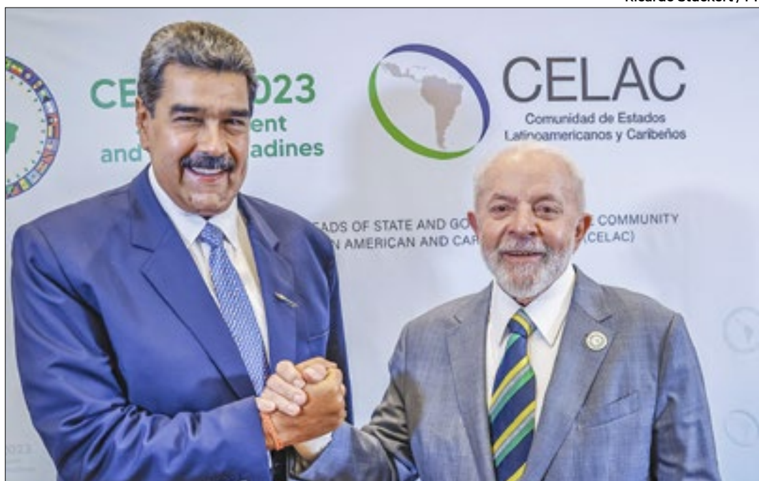
Lula manteve boa relação com Maduro, mas teme por problemas na Venezuela

Outros incidentes foram registrados em diferentes regiões. Em Carabobo, eleitores tiveram dificuldades devido a mudanças nos locais de votação, causando confusão. No estado de Bolívar, especificamente em Ciudad Guayana, houve atraso na montagem das mesas de votação devido à ausência de membros designados pelo Conselho Na-