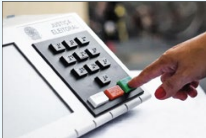
Pedágios não poderão ser cobrados durante a eleição