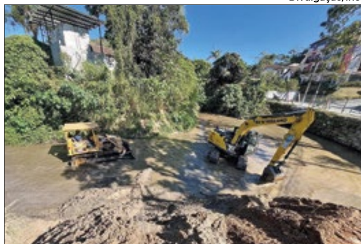
Serviço é realizado no Duarte da Silveira e outras três regiões

O governo do Estado, por meio da Secretaria do Ambiente e Sustentabilidade e do Inea, vem realizando a limpeza e o desassoreamento de rios e córregos de Petrópolis, com o objetivo de reduzir os alagamentos durante o período de chuvas. Segundo o Inea, em dois anos, mais de 50 localidades receberam o programa Limpa Rio. Atualmente, as equipes fazem a limpeza e o desassoreamento de rios em quatro regiões distintas da cidade: dois pontos do Rio Piabina - no Duarte da Silveira (Bingem) e no Nogueira - e nos rios Araras e Maria Comprida - nos distritos.