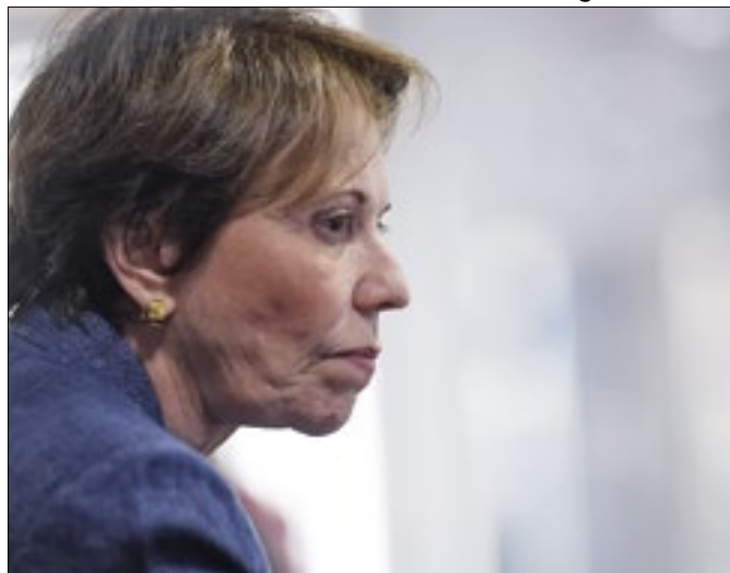
Acerto em Campo Grande contrariou Teresa Cristina