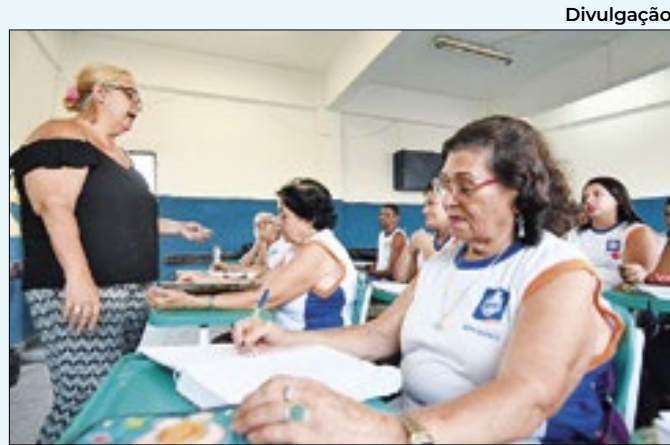
Nova Iguaçu reabre inscrições para EJA nesta segunda

tista. A convenção partidária foi realizada na sede do diretório municipal do PT, no centro de Mesquita, contando com a presença de lideranças, candidatos a vereadores, correligionários e apoiadores da candidatura. O nome do(a) vice ainda não foi divulgado.