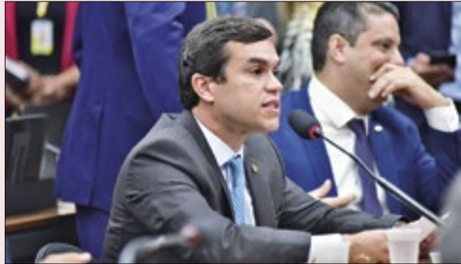
Apoio a Beto Pereira aproxima PL de PSDB e MDB