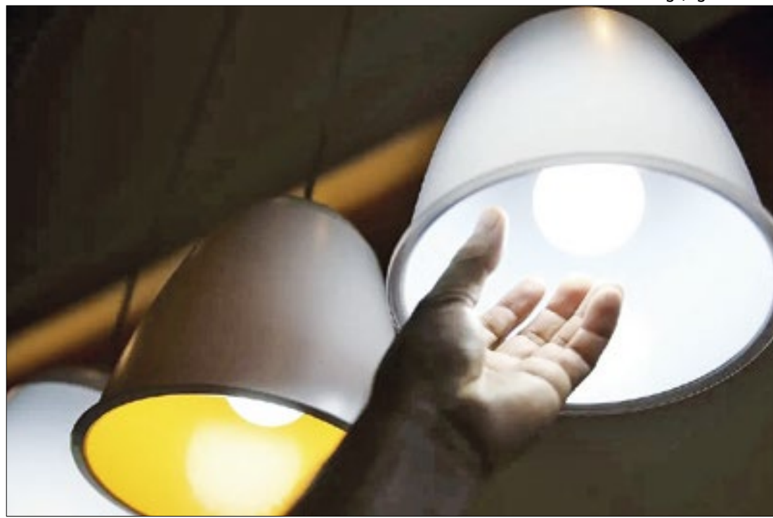
Empresa deveria garantir o fornecimento sem interrupções, segundo o ministro

Nas primeiras horas de sexta (26), agentes da 41ª Delegacia de Polícia (Tanque) e do Departamento-Geral de Polícia do Interior (DGPI), da Polícia Civil, prenderam um integrante da facção criminosa Comando Vermelho, na comunidade Gardênia Azul, em Jacarepaguá.