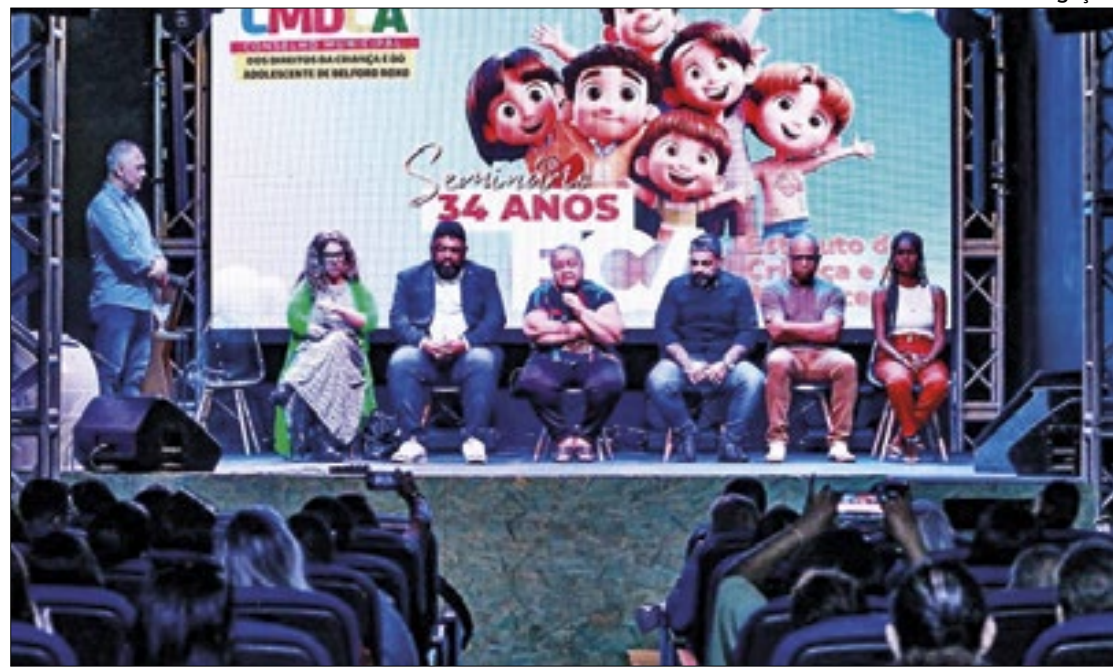
Seminário dos 34 anos do Estatuto da Criança e do Adolescente aconteceu no Teatro da Cidade

O seminário abordou assuntos relacionados ao ECA como: a apresentação de sua história; sua evolução, sua importância para promoção e defesa dos direitos da criança e do adolescente e sua aplicação de medidas socioeducativas estabelecidas. Também apresentou temas sobre o Conselho Tutelar à luz da legalidade; políticas públicas dos direitos da criança e do