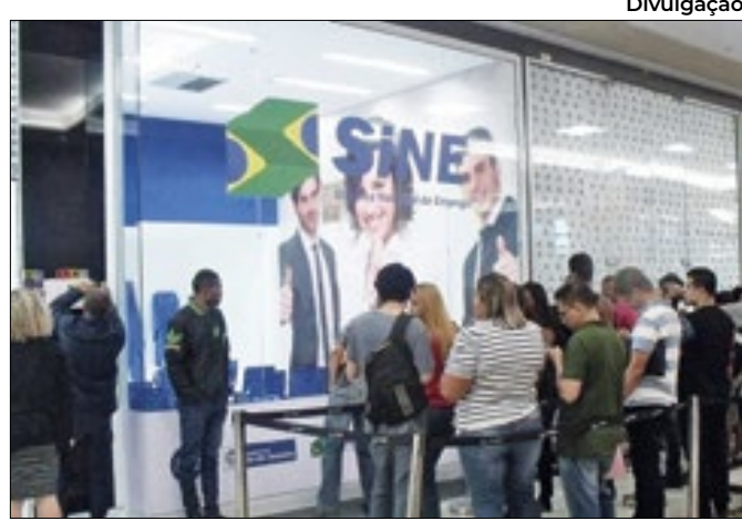
Inscrição pode ser feita na sede do Sine de V. Redonda