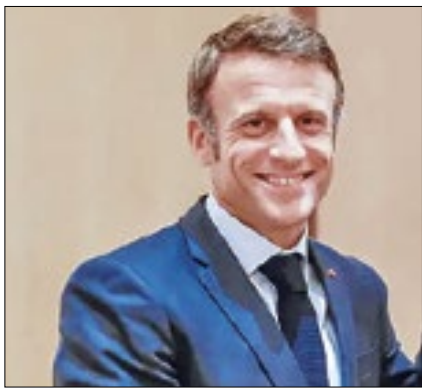
Macron confirmou abertura no Sena

O presidente da França, Emmanuel Macron, confirmou, nesta terça-feira (23), que a cerimônia de abertura dos Jogos Olímpicos será realizada conforme o chamado plano A.