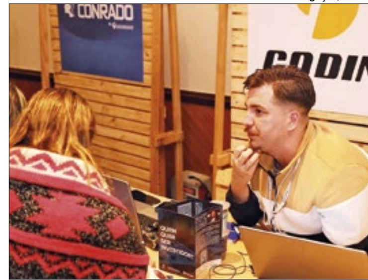
Terceira etapa do Codin Incentiva acontece em Itaperuna