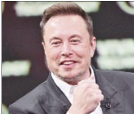
Elon Musk foi acusado de transfobia