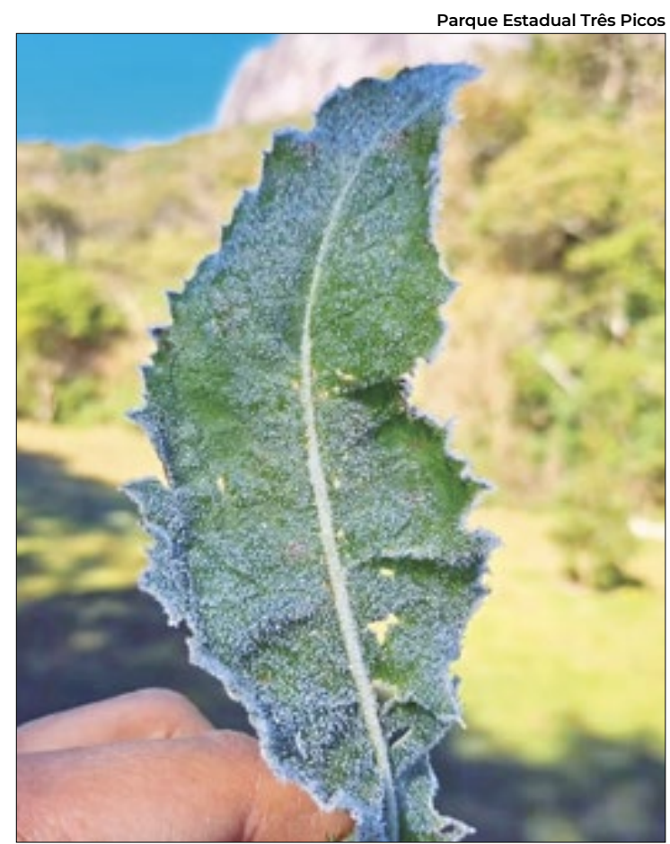
Em Nova Friburgo o termômetro chegou a marcar 0,2°C