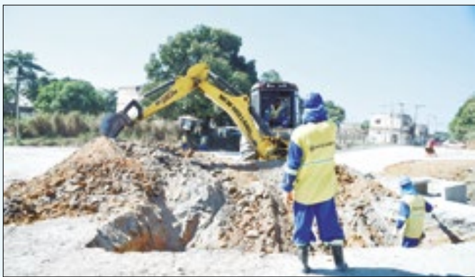
Governo investe mais de R$ 330 milhões no município