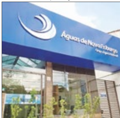
Objetivo é facilitar pagamentos

Águas de Nova Friburgo lançou a campanha "Pague com o Pix -Piscou, pagou", uma opção rápida, prática e segura para garantir comodidade no atendimento. Além de ser uma solução eficiente e moderna, oferecendo agilidade