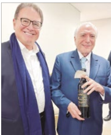
que foi inaugurado durante governo Temer, com liderança de investimentos do Ministério do Turismo, enquanto ele era ministro