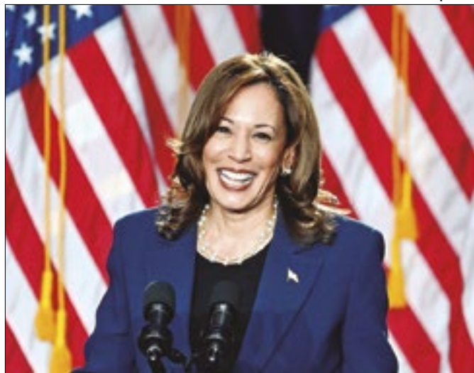
Vice americana é o principal nome para enfrentar Trump