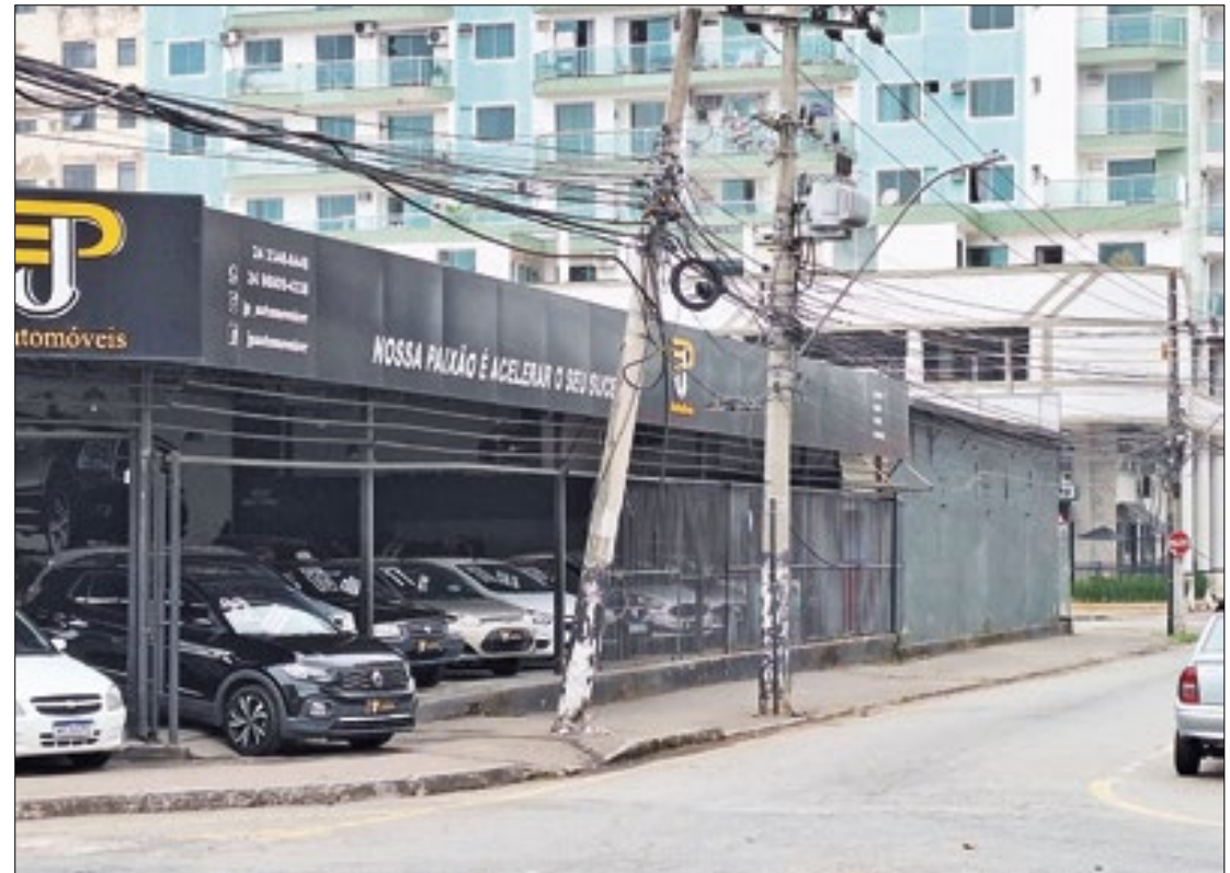
Light afirma que readequação compete às operadoras de telecomunicação

O local, que foi noticiado pelo Correio Sul Fluminense há 8 meses com o mesmo problema, chegou a registrar casos de ônibus que puxaram a fiação e ocasionou faíscas. “Sem contar que aqui perto possui uma creche, onde várias pessoas param o carro perto do poste danificado para buscar seus filhos, e se algum fio der curto, pode