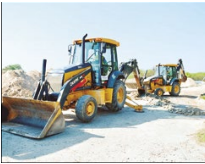
Obras do Parque RJ, nova área de lazer de São Gonçalo