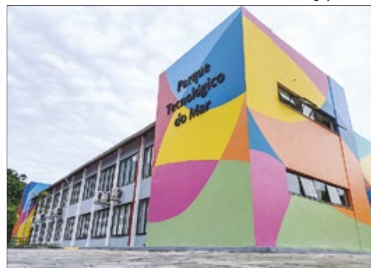
Cursos tem previsão de início entre agosto e setembro

Inscrições para três cursos gratuitos voltados à área de tecnologia estão abertos no Parque Tecnológico do Mar, em Angra dos Reis. Entre os cursos, há de Robótica para Crianças, Modelagem 3D e Automação de Processos Robóticos (RPA). Os cursos, que acontecerão em agosto e setembro, são promovidos pela Secretaria de Planejamento e Parcerias.