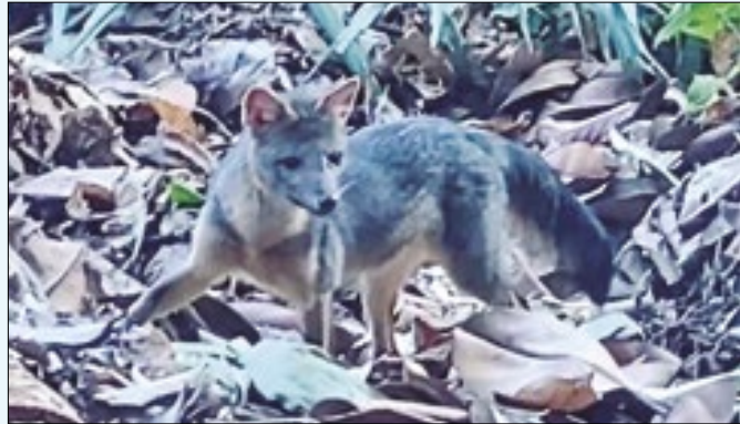
Cachorro-do-mato fez visita diurna ao Parque Lage