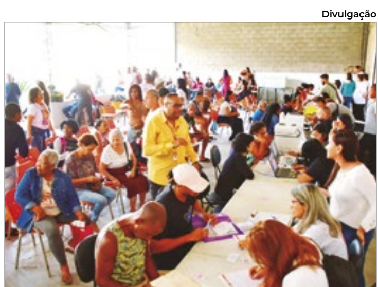
Mais de 600 atendimentos foram realizados durante ação

pitalização de pacientes com lesões provocadas por complicações da doença e estimular a melhoria da qualidade de vida. O atendimento ao portador de Diabetes Mellitus está disponível em todas as unidades da rede de Atenção Básica (ESFs e UBSs). De acordo com a complexidade do caso, o paciente é referenciado aos serviços de complexidade adequada ao seu caso, como ocorre com o paciente que evolui para o estado de Pé Diabético.