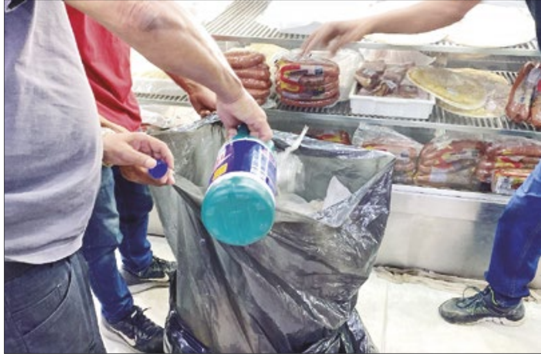
Agentes da Delegacia do Consumidor apreendem alimentos impróprios no Rio das Pedras

A Polícia Civil apreendeu nesta segunda-feira (22/07) 1.500 produtos falsificados em Rio das Pedras, na Zona Oeste do Rio. Foram realizadas três operações pela DRCPIM (Delegacia de Repressão aos Crimes Contra a Propriedade Imaterial), que resultaram na