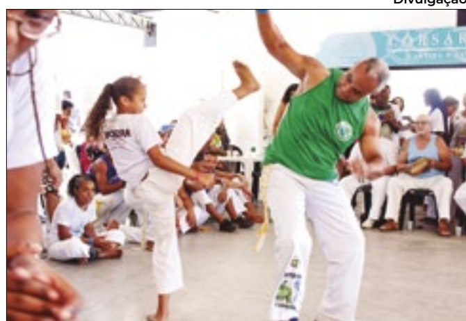
Encontro vai de 28 de julho a 3 de agosto no MAR