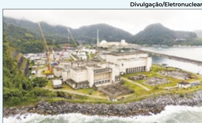
Obras de usina nuclear de Angra foram iniciadas em 1984