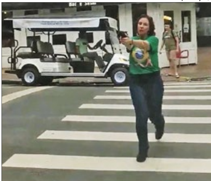
Zambelli sacou arma na véspera das eleições de 2022

foi revelado pela jornalista Andreia Sadi, colunista do G1.