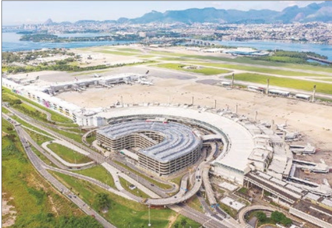
A crise de luz que atinge a Ilha do Governador tem causado desconforto térmico no Galeão

Procurada novamente nesta terça (23), a Light não se posicionou. No sábado (20), a concessionária afirmou que o apagão na Ilha do Governador ocorreu devido a um defeito na rede subterrânea, quando a "empresa precisou fazer uma parada emergencial em trechos de alguns bairros para reparar o sistema que abastece a região". Afirmou, ainda, que a energia havia sido totalmente restabelecida na madrugada de sábado.