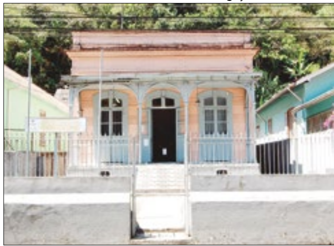
Sindicato dos Trabalhadores Rodoviários em Petrópolis