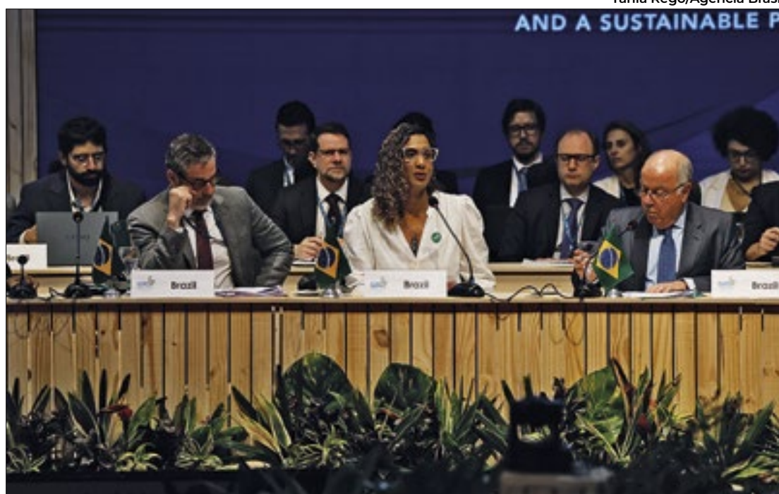
Reunião do G20 ocorre desde segunda-feira no Rio de Janeiro

Os ODS são uma agenda mundial para acabar com a pobreza e as desigualdades. Eles foram pactuados pelos 193 Estados-Membros da Organização das Nações Unidas (ONU) e