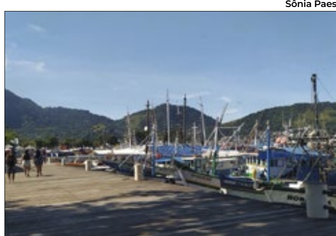
Angra dos Reis toma medidas para evitar tragédias