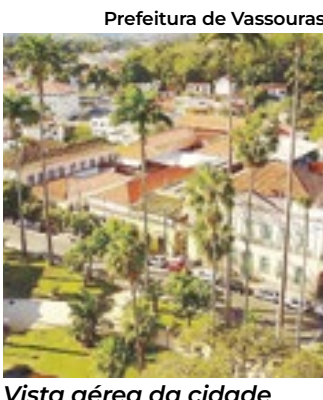
Vista aérea da cidade