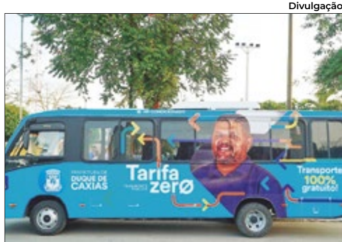
Prefeitura de Caxias implementa programa Tarifa Zero