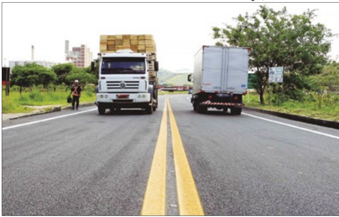
Dados do Instituto de Segurança apontaram queda de 41% nos registros de roubos de carga

vai beneficiar diretamente mais de 100 mil moradores de oito cidades: Duque de Caxias, Belford Roxo, São João de Meriti, Mesquita, Nilópolis, Nova Iguaçu, Queimados e Japeri. Os equipamentos são do modelo contêiner, e dez deles já estão na fase de implementação.