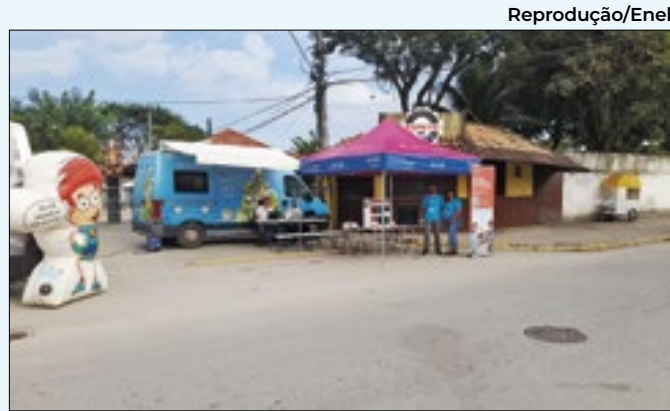
Projeto 'Energia Legal' chega em Guapimirim

Nova Iguaçu tem saído na frente da capacitação de proprietários rurais para a prevenção de incêndios florestais, uma iniciativa promovida pela prefeitura. Recentemente, proprietários rurais de Tinguá participaram do curso realizado pelo município.