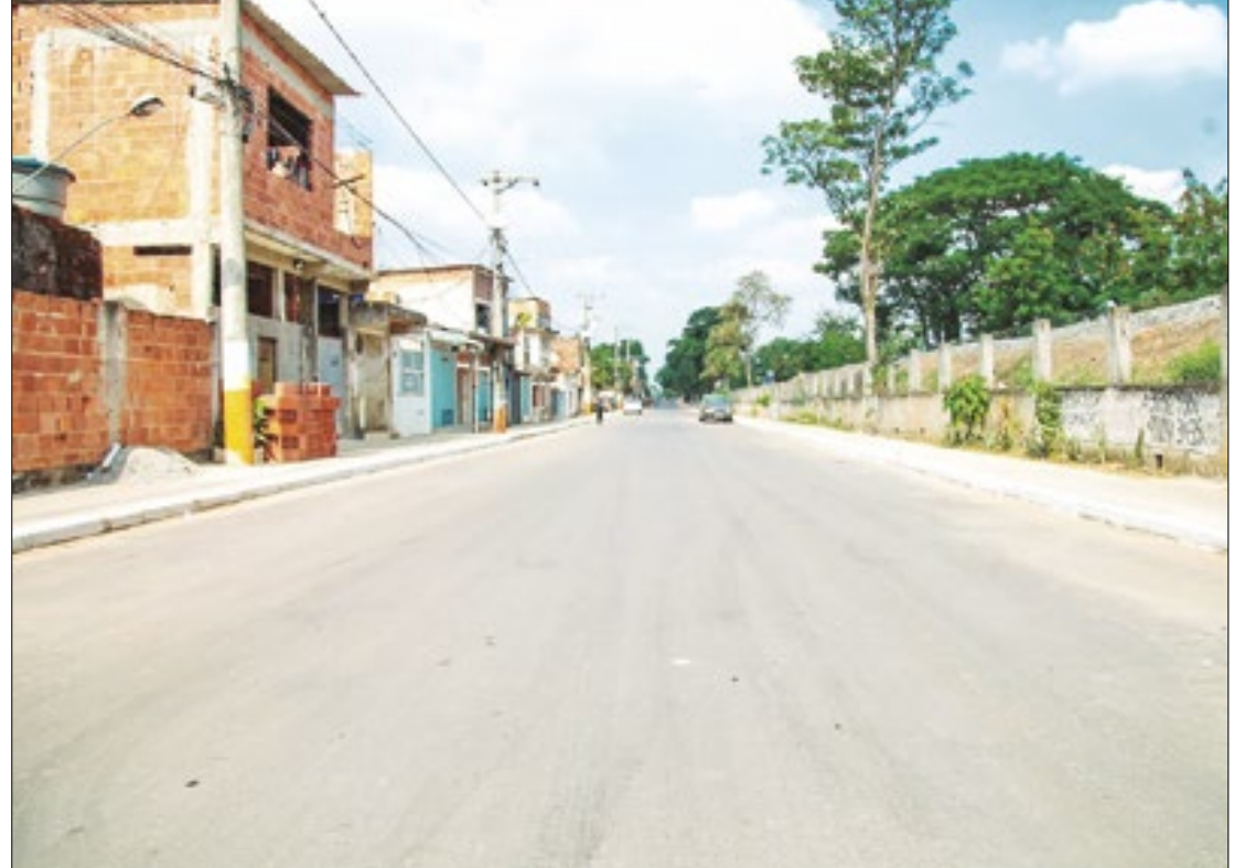
Prefeitura de Belford Roxo levou obras de urbanização ao bairro Jardim das Acácias

O prefeito Waguinho percorreu todas as ruas contempladas pelo projeto e ouviu novas demandas dos moradores da região. "Essa entrega faz parte do nosso compromisso de levar dignidade aos munícipes e desenvolver a cidade para que ela seja um lugar melhor para todos", afirmou. "Seguimos empenhados e dedicados na mesma missão de ampliar a qualidade de vida das famílias