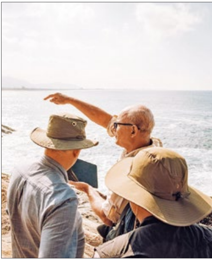
Avaliadores conheceram área localizada em Ponta Negra