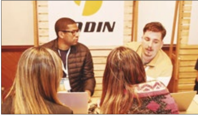
Empresas receberam informações sobre incentivos fiscais