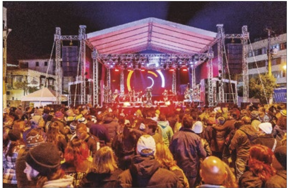
Programação plural do Festival Sesc de Inverno atrai visitantes e turistas a Teresópolis

De acordo com a Secretária Municipal de Turismo, a alta taxa de ocupação hoteleira de 94,57% em julho foi impulsionada por uma série de eventos e atrações que atraíram visitantes para a cidade. A taxa de ocupação entre os dias 19 e 21 de julho de 2024 foi de 92% no Centro, 96% no Alto,