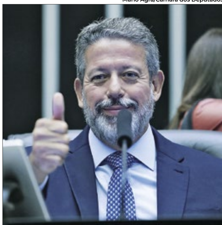
Arthur Lira fica como presidente até fevereiro

Segundo relatos, Bolsonaro lembrou do apoio de Elmar na disputa presidencial de 2022, quando o deputado criticou petistas durante atos na Bahia, um dos redutos eleitorais do PT. Na