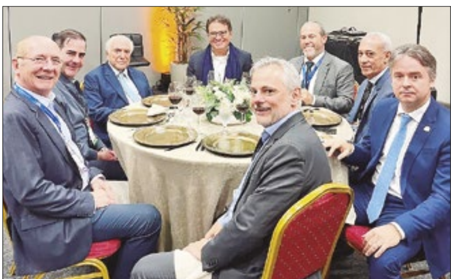
Michel Temer durante almoço com políticos, secretários e empresários em Balneário Camboriú

Temer realizou uma palestra abordando o impacto da política no crescimento do país e sua relação com o setor produtivo. Ainda durante sua ida ao município catarinense, o ex-presidente esteve ao lado de seu ex-ministro de Turismo, Vinicius Lummertz, e almoçou com políticos e empresários.