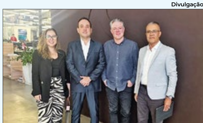
Prefeitura e representantes da empresa discutiram questão

nejamento da execução, mapeamento de risco, plano municipal de redução de risco, levantamentos complementares, sumário executivo e devolutivas.