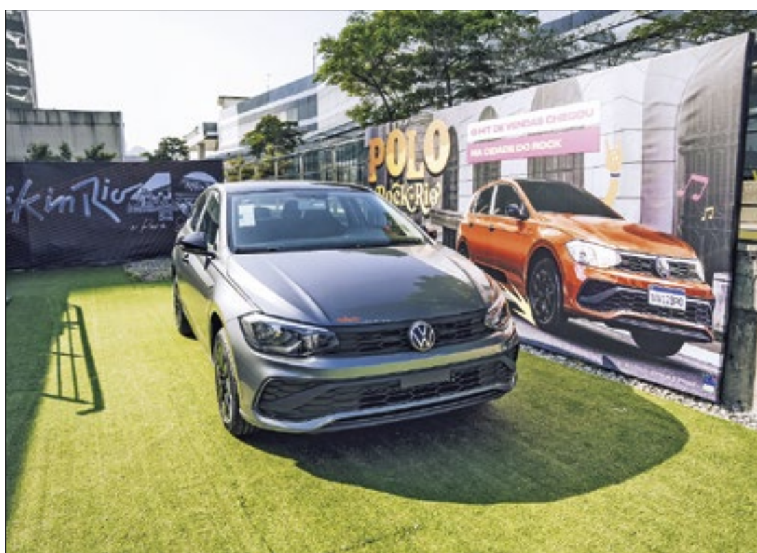
Modelo exposto da linha exclusiva de carros Polo Rock in Rio, da Volkswagen

Imprensa e convidados durante o evento realizado nesta terça-feira