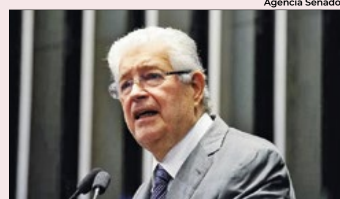
Roberto Requião foi senador por Paraná de 2011 a 2019

prefeito com 31 anos, algo que muitos consideram precoce para um jovem na política. Caiado está no quinto mandato como vereador e sua condução na Câmara Municipal vem sendo elogiada por diversos partidos, além de ter um trâmite nos bastidores da política carioca.