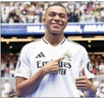
Mbappé usará a 9 do Real Madrid

Mbappé foi apresentado pelo Real Madrid e contou como Vinicius Jr contribuiu para o acerto com o Real e já projetou a parceria com o camisa 7 a partir da próxima temporada.