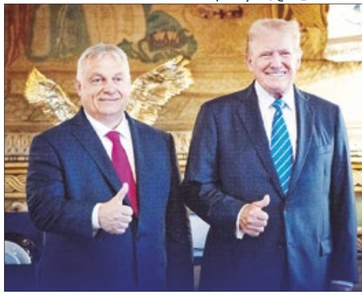
Orbán apoiou Donald Trump para os líderes europeus

Agora, ele completa sua intenção de tornar-se uma ponte para uma solução da guerra sa-