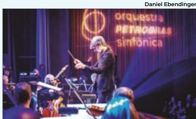
Repertório do concerto é de Hector Berlioz e Béla Bartók

Após um início de inverno com jeitão de verão, a friaca enfim chegou ao Rio de Janeiro, fazendo com que as pessoas tirem os casacos dos armários. Porém, o frio vai durar pouco, visto que a temperatura está prevista para aumentar a partir da próxima quinta-feira (18).