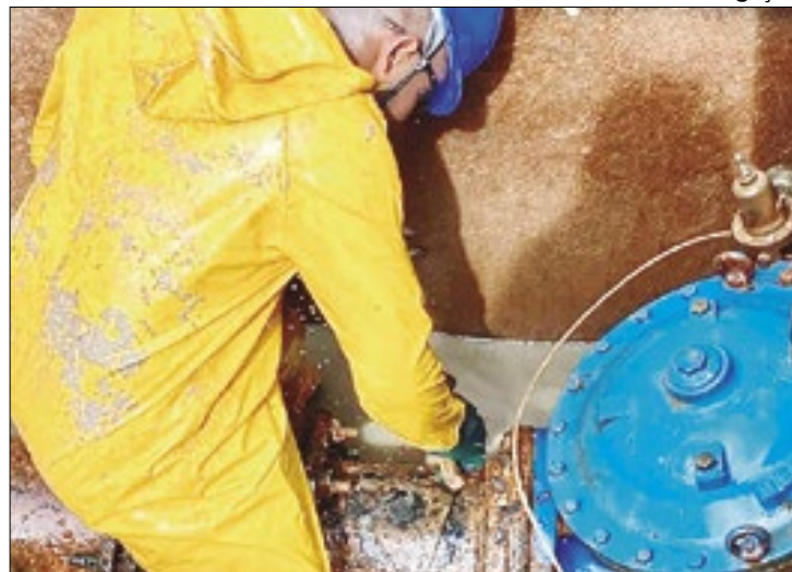
Concessionária Águas do Rio realiza investimentos em saneamento básico na Baixada Fluminense