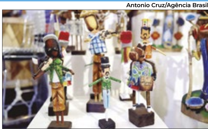
Os inscritos antes de 2015 devem atualizar os dados