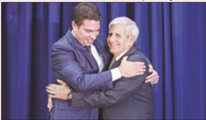
O que Ramagem e Heleno fizeram com a denúncia?