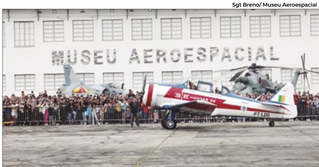
Programação do MUSAL é gratuita em homenagem aos 151 anos do ‘Pai da Aviação’

Museu Aeroespacial terá programação especial nos dias 20 e 21 de julho