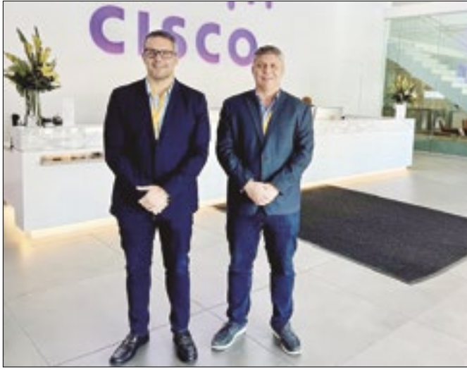
Secretário de Estado visitou sede da empresa Cisco