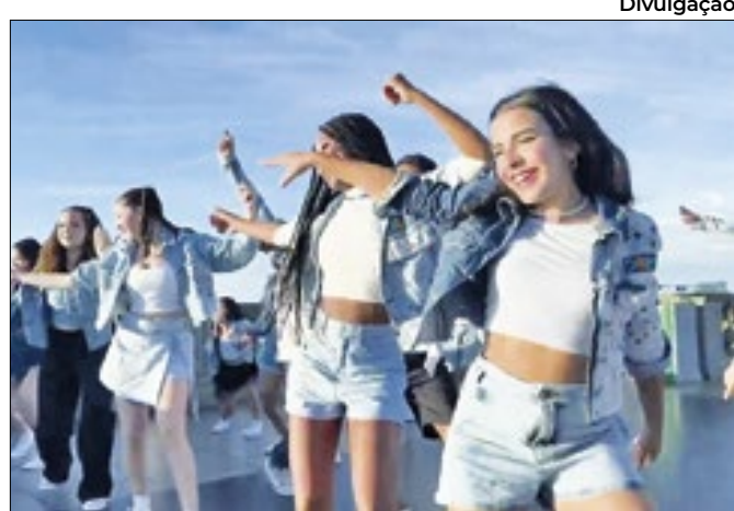
Crianças cantaram música tema no Cristo Redentor