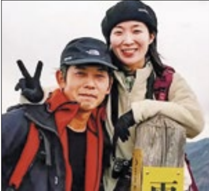
Casal faleceu no final de junho

Os influenciadores de turismo japonês Tsubasa Ito e a esposa Teitei morreram afogados em um rio no Japão, próximo a Gifu; O acidente ocorreu no final de junho, mas só agora veio a público. Tsubasa