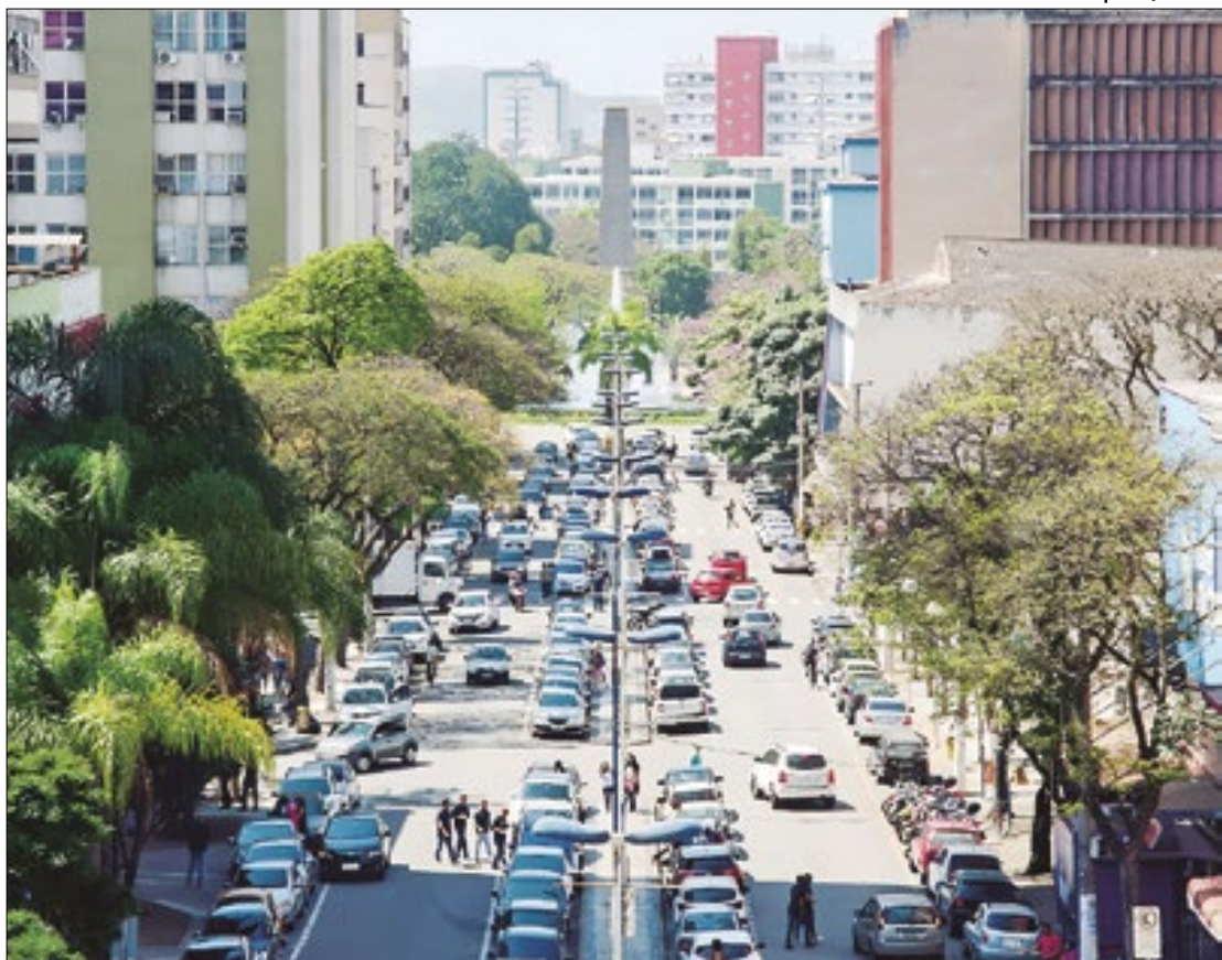
Comemorações do aniversário de Volta Redonda incluem a conclusão de obras