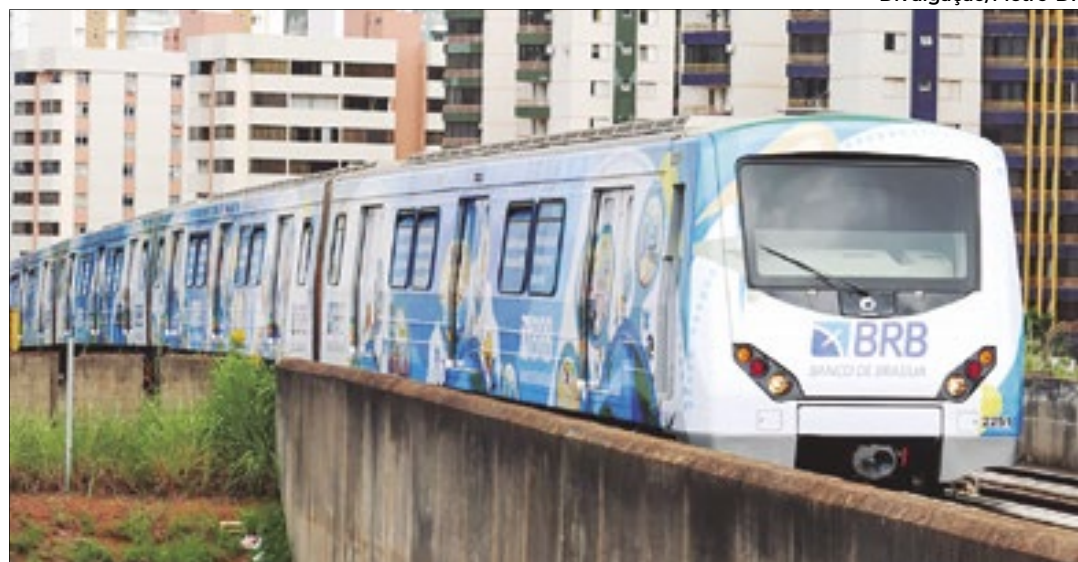
Metrô-DF arrecadou cerca de R$ 5 milhões com publicidade em 2023