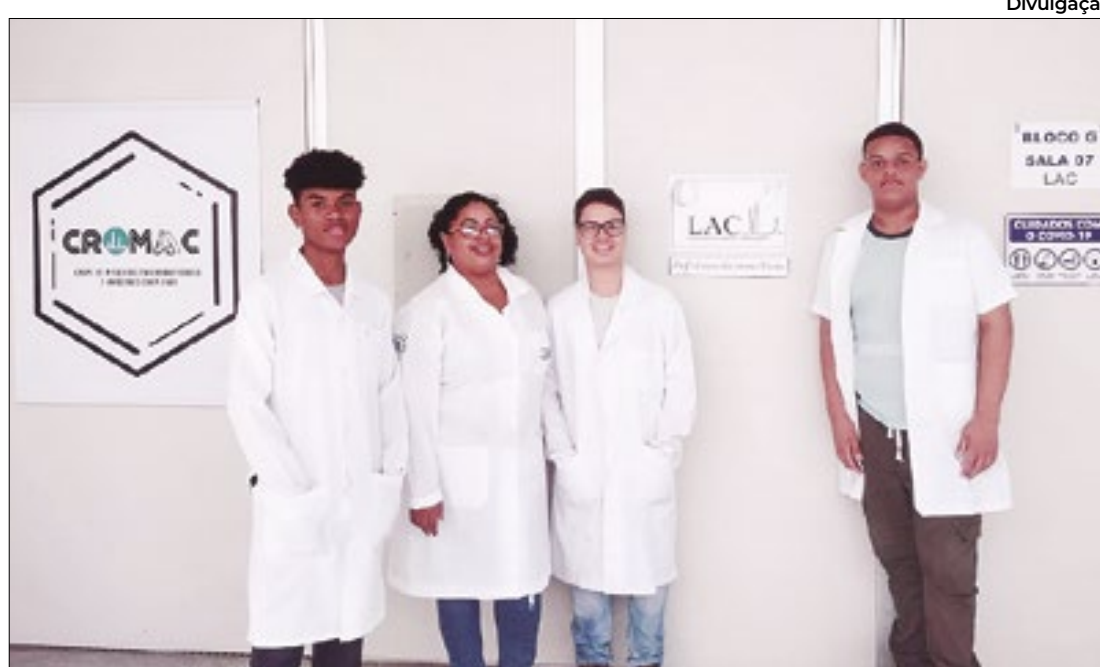
Iniciado em 2019, o projeto já acumula prêmios e representa Sergipe em feiras científicas.

Projeto utiliza resíduos da vagem para criar material adsorvente