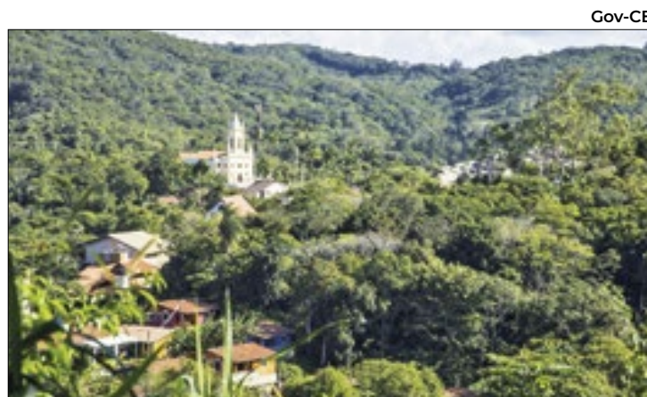
Ceará registra média de 84% na ocupação hoteleira