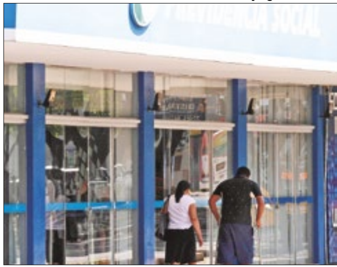
Reunião ocorreu no Ministério da Gestão