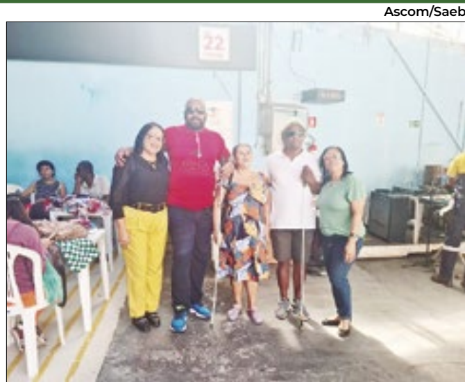
Evento destaca potencial de inclusão e solidariedade