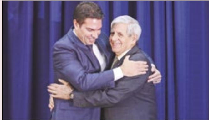
O que Ramagem e Heleno fizeram com a denúncia?