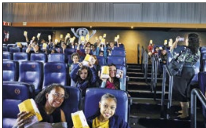
Pacientes pediátricos dos institutos federais do Rio

Antes mesmo das portas abrirem no Shopping Nova América, na zona norte do Rio de Janeiro, crianças e adolescentes acompanhados pelos responsáveis já chegavam ao local. Às 10 horas, uma fila agitada aguardava em frente ao cinema pela primeira sessão do dia. Assim, com apoio da rede de cinemas Kinoplex, jovens pacientes em tratamento no Instituto Nacional de Traumatologia e Ortopedia (INTO), no Instituto Nacional de Câncer (INCA) e no Instituto Nacional de Cardiologia (INC) puderam ter uma pausa na rotina de cuidados médicos para aproveitar um momento de lazer nesta terça-feira (16).