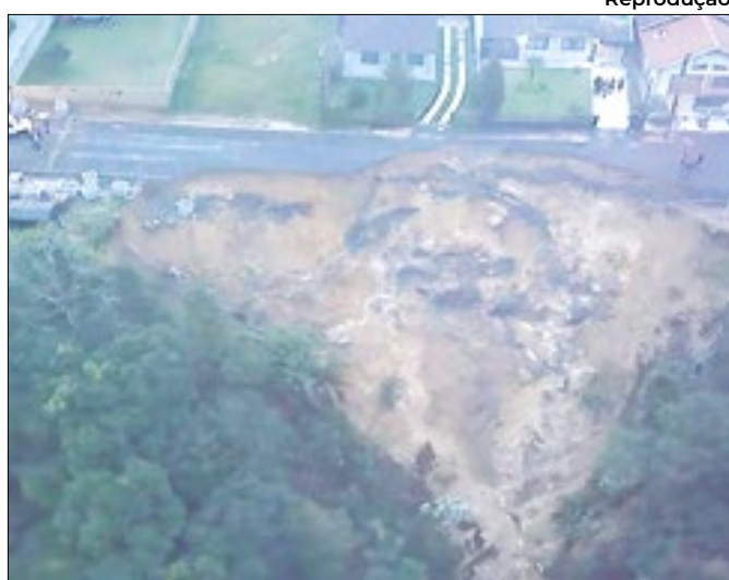
Chuva causou a instabilidade