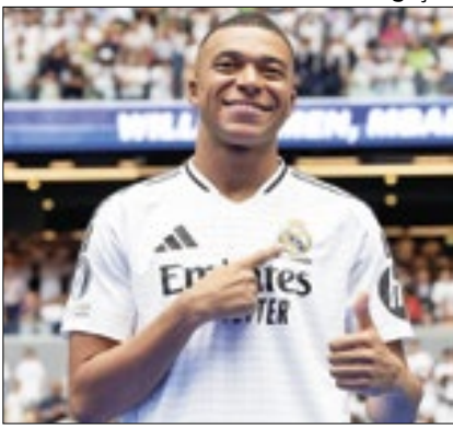
Mbappé usará a 9 do Real Madrid

Mbappé foi apresentado pelo Real Madrid e contou como Vinicius Jr contribuiu para o acerto com o Real e já projetou a parceria com o camisa 7 a partir da próxima temporada.