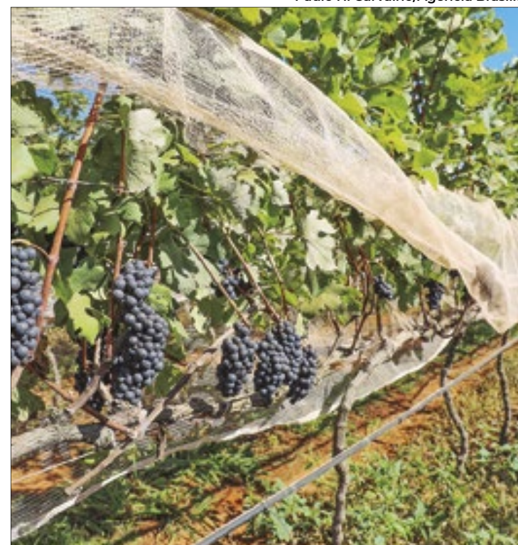
DF vem se tornando importante produtor de vinho