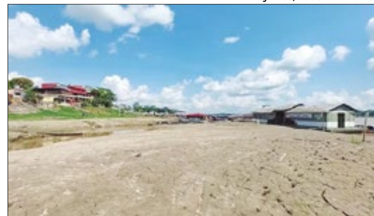
Nível do rio diminui, afetando transporte e comunidades