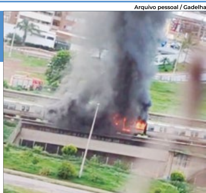
Em janeiro deste ano, um vagão pegou fogo próximo à estação Águas Claras. Motivo: curto-circuito. Não houve feridos

Mas, já que é um veículo, quanto o Metrô-DF arrecadou com essa exploração comercial? Em 2023, a receita extra tarifária somou R$ 5 milhões – segundo a companhia. Seria oriunda da cessão de lojas e da exploração de espaços para terminais bancários e quiosques –