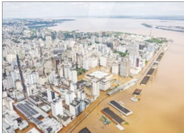
Próximo pagamento sai dia 22 de julho

O Ministério do Trabalho e Emprego (MTE) repassou, na segunda, o Apoio Financeiro de R$ 1.412 para 559 empregados domésticos com carteira assinada, afetados pelas enchentes no Rio Grande do Sul em maio e junho. No total, 1.009 trabalhadores já receberam o benefício após a adesão. O próximo pagamento está programado para o dia 22 de julho.