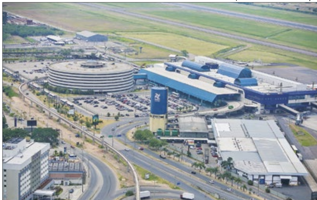
O anúncio foi feito nesta terça-feira (16) pelo ministro de Portos e Aeroportos