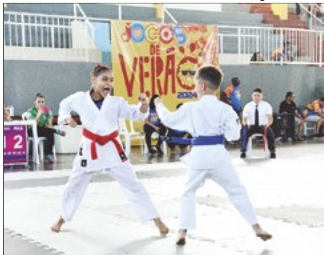
Evento reúne 10 modalidades esportivas