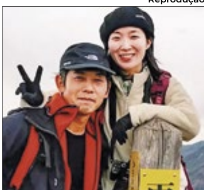
Casal faleceu no final de junho

Os influenciadores de turismo japonês Tsubasa Ito e a esposa Teitei morreram afogados em um rio no Japão, próximo a Gifu; O acidente ocorreu no final de junho, mas só agora veio a público. Tsubasa