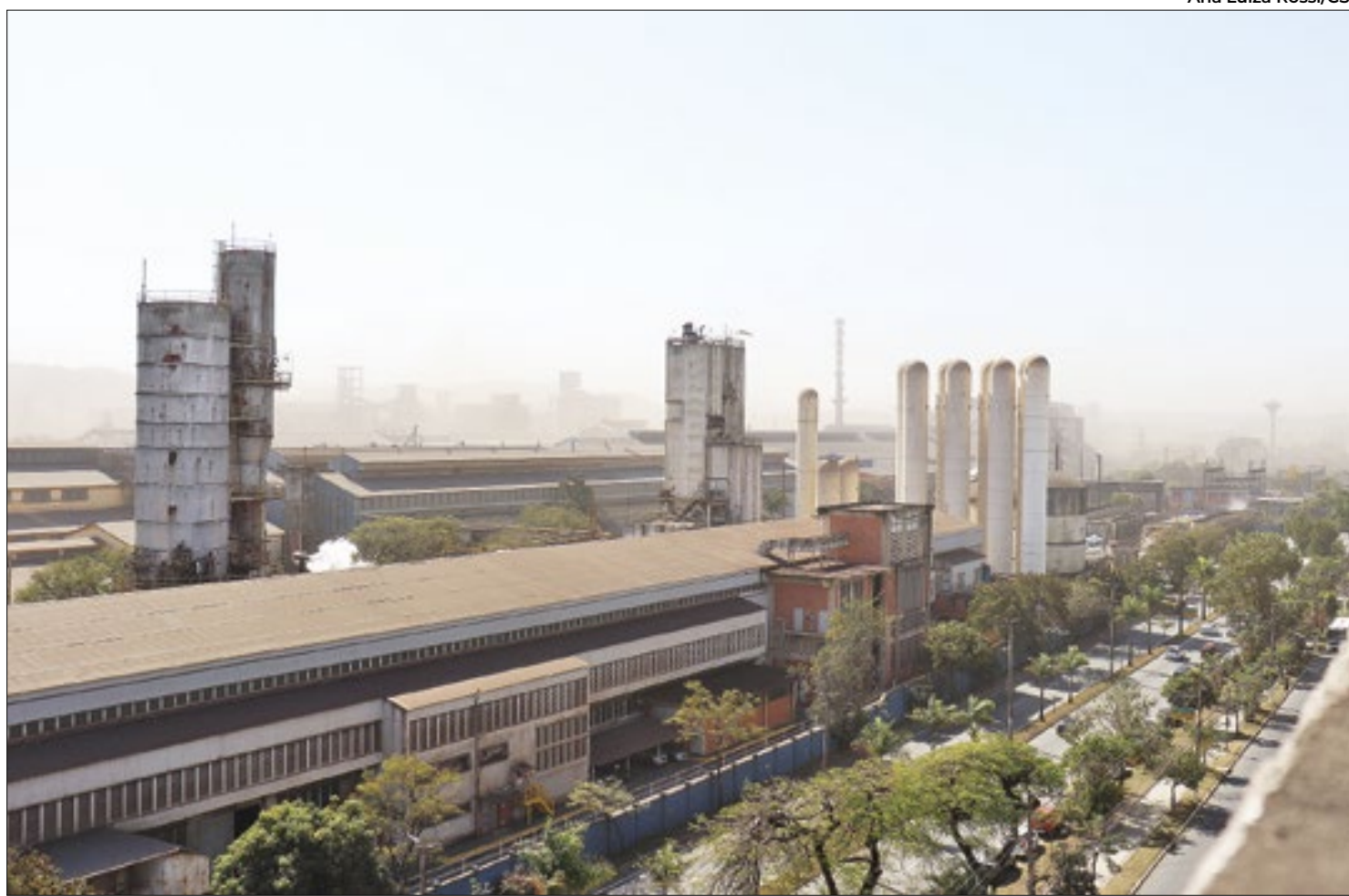
Ana Luiza Rossi/CSF

Documento emitido pelo MPF e MPRJ foi enviado ao Instituto Estadual do Ambiente (Inea)