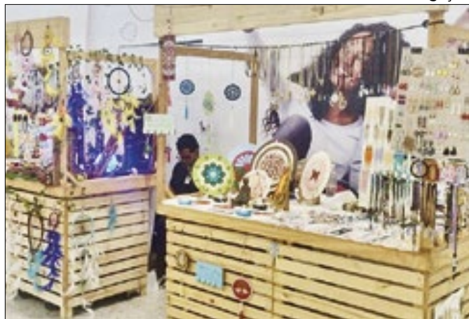
Nova Iguaçu realizará mais uma edição da Feira Top