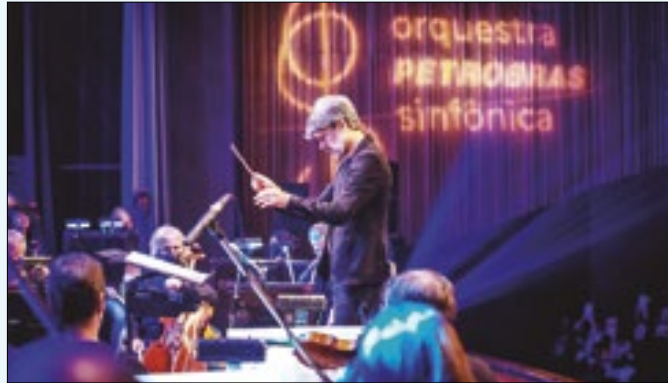
Repertório do concerto é de Hector Berlioz e Béla Bartók