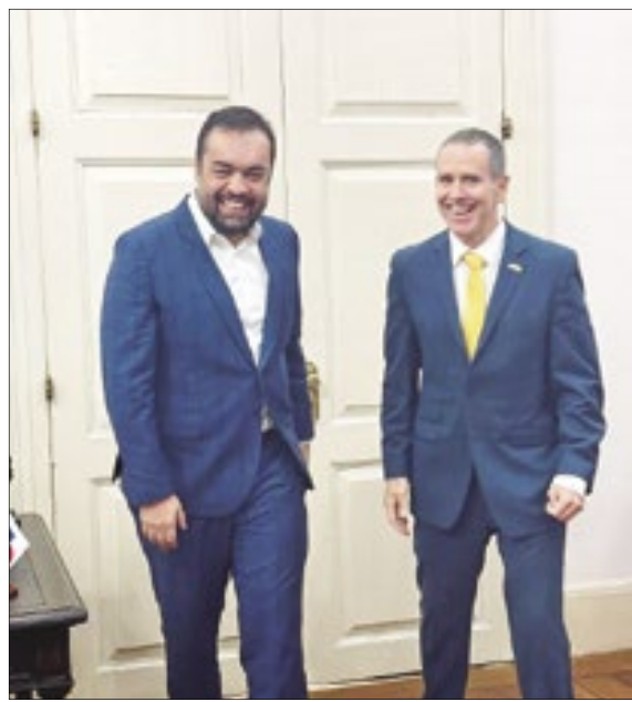
O governador Cláudio Castro com o novo cônsul geral dos EUA, Ryan Rowlands

Além disso, o consulado dos Estados Unidos é um dos parceiros do Projeto de Escolas Interculturais da Secretaria Estadual de Educação, apoiando o CIEP 117 Carlos Drummond de Andrade Brasil-Estados Unidos, localizado em Nova Iguaçu. A escola tem foco no ensino de Matemática e Geografia, além da Língua Inglesa.