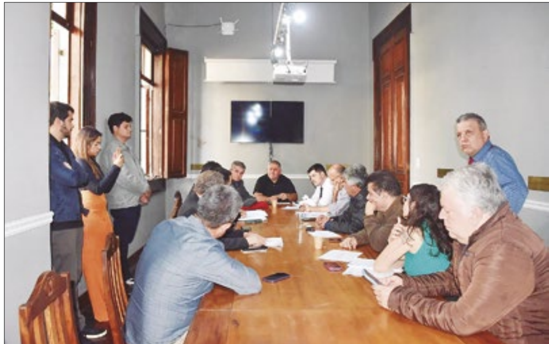
Votação foi adiada mais uma vez, texto final deve ser aprovado até o fim da semana

No primeiro documento apresentado em reunião na Câmara, no dia 9 de julho, foi constatado um déficit de R$ 270,7 milhões no INPAS e de R$ 289,2 milhões no orçamento do município ao final do ano de 2023. Agora, na nova documentação, há um su-