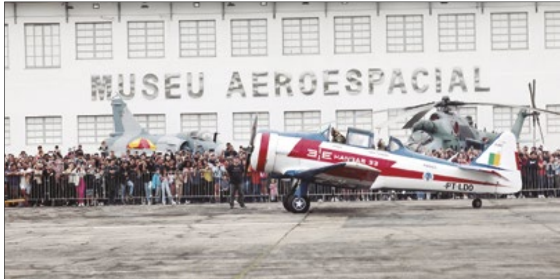
Programação do MUSAL é gratuita em homenagem aos 151 anos do ‘Pai da Aviação’

O Museu Aeroespacial (MUSAL) está se preparando para um evento especial e gratuito em celebração ao 151º aniversário de nascimento de Alberto Santos Dumont, conhecido como o Pai da Aviação. Nos dias 20 e 21 de julho de 2024, das 9h às 17h, os visitantes terão a oportunidade de participar de diversas atividades educativas, recreativas e culturais, além de assistir a emocionantes demonstrações aéreas. Este evento promete ser uma experiência única e enriquecedora para todas as idades, destacando a importância histórica e cultural da aviação.