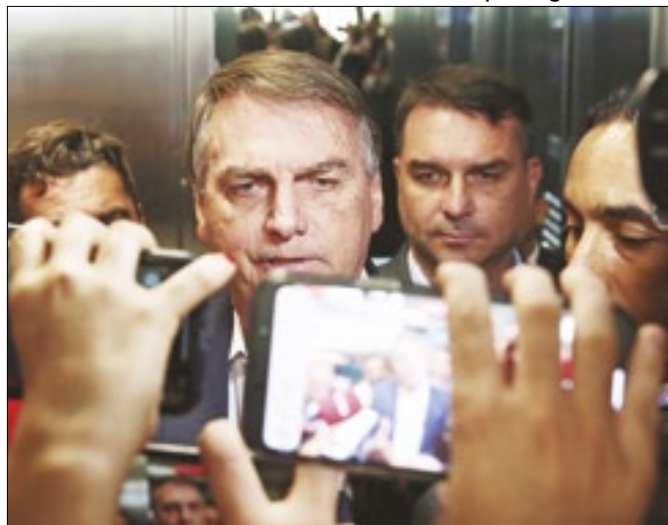
Apurar uma denúncia ou ajudar defesa?