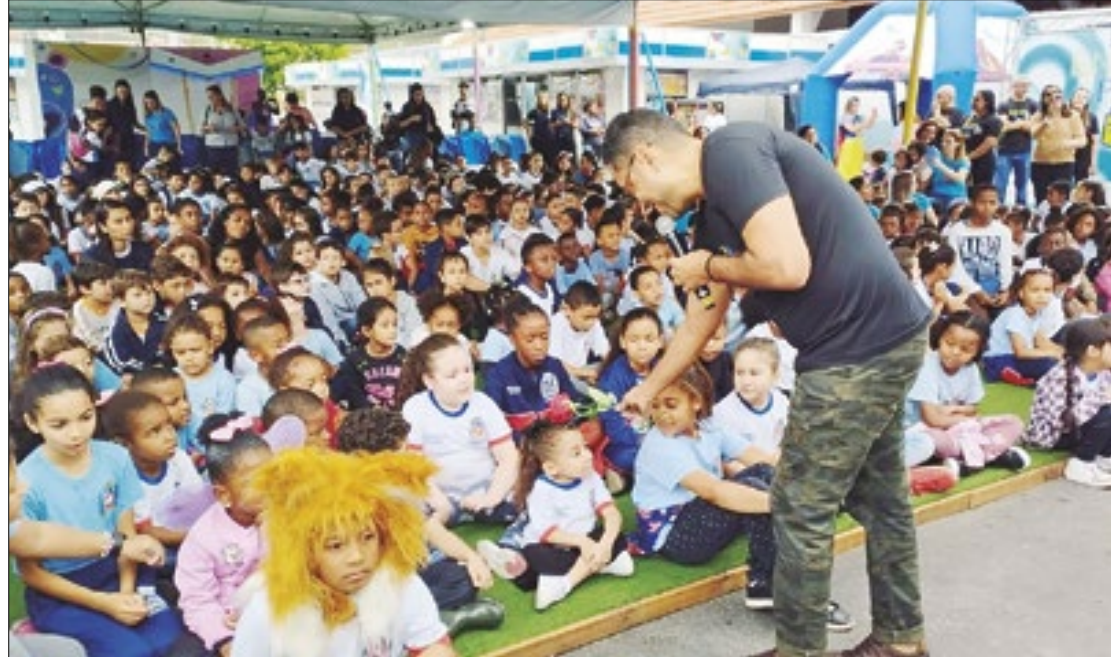
Festival Literário será realizado em municípios da região da Costa Verde

Além disso, o público poderá interagir com diversos espaços, como o Espaço eu amo ler, aberto aos alunos das redes