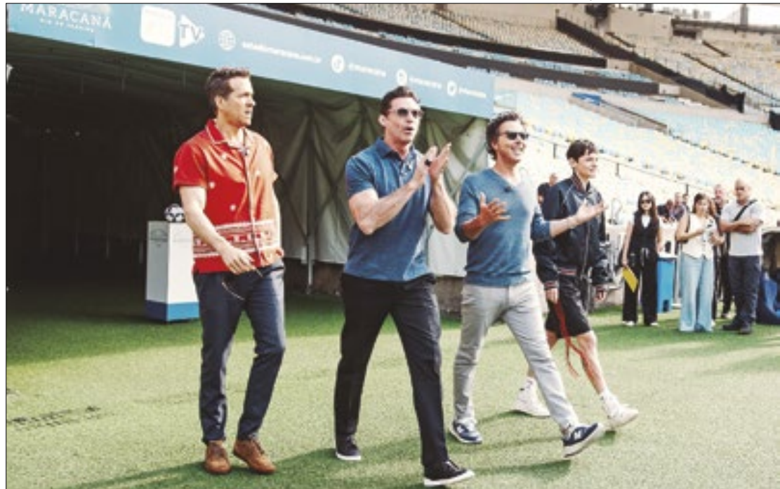
Elenco de ‘Deadpool &amp; Wolverine’ se divertiu cobrando pênaltis no gramado do Maracanã

E quem se aproveitou da presença do astro Hollywoodiano no Rio foram os fãs,