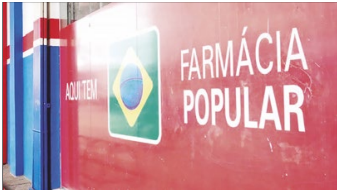
Agora, 95% dos medicamentos estão incluídos na lista

Os novos medicamentos contemplados são: Glaucoma - maleato de timolol 2,5mg; maleato de timolol 5mg/ Doença de Parkinson - carbidopa 25mg + levodopa 250mg; cloridrato de benserazida 25mg + levodopa 100mg/ Rinite - budesonida 50mcg, e dipropionato de beclometasona 50mcg/dose. Para ter acesso aos serviços, os indivíduos