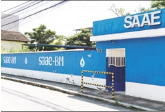
Saae executa obras para melhora captação de água