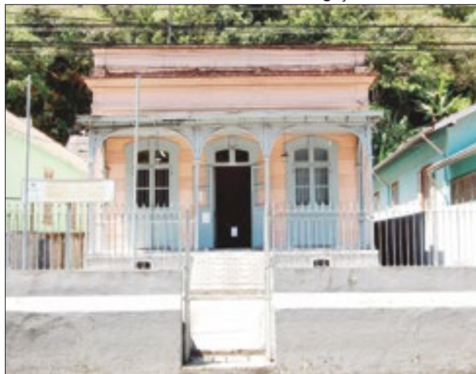
Sindicato dos Trabalhadores Rodoviários em Petrópolis