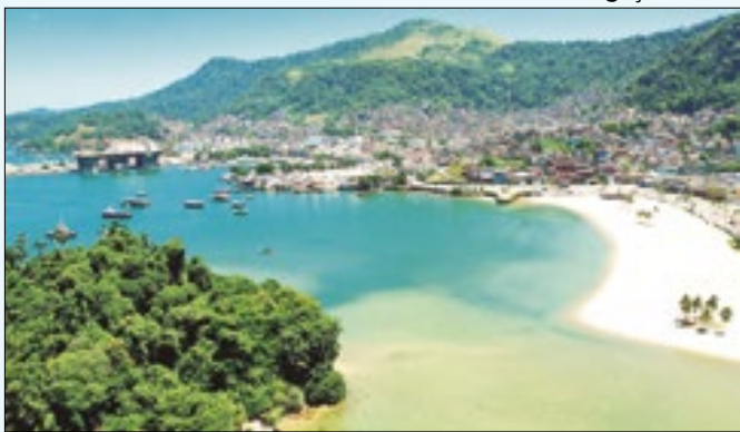
Angra dos Reis terá evento de motociclistas