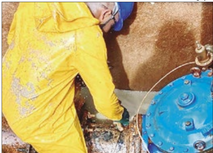
Concessionária Águas do Rio realiza investimentos em saneamento básico na Baixada Fluminense