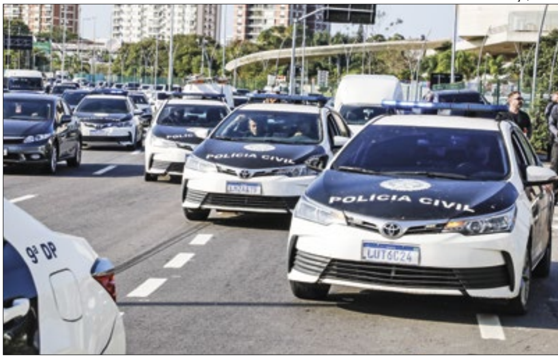
Ação Estruturada de Segurança Pública tem como foco as comunidades da Zona Oeste

idoso. O deputado Alan Lopes afirma que é preciso criar uma maior rede de proteção às vítimas e punir, verdadeiramente, os algozes, destacando ainda que a proposta tem como objetivo preservar os princípios da moralidade e da eficiência na administração pública.