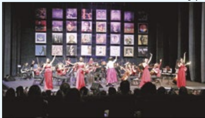
Orquestra Sinfônica Juvenil Chiquinha Gonzaga