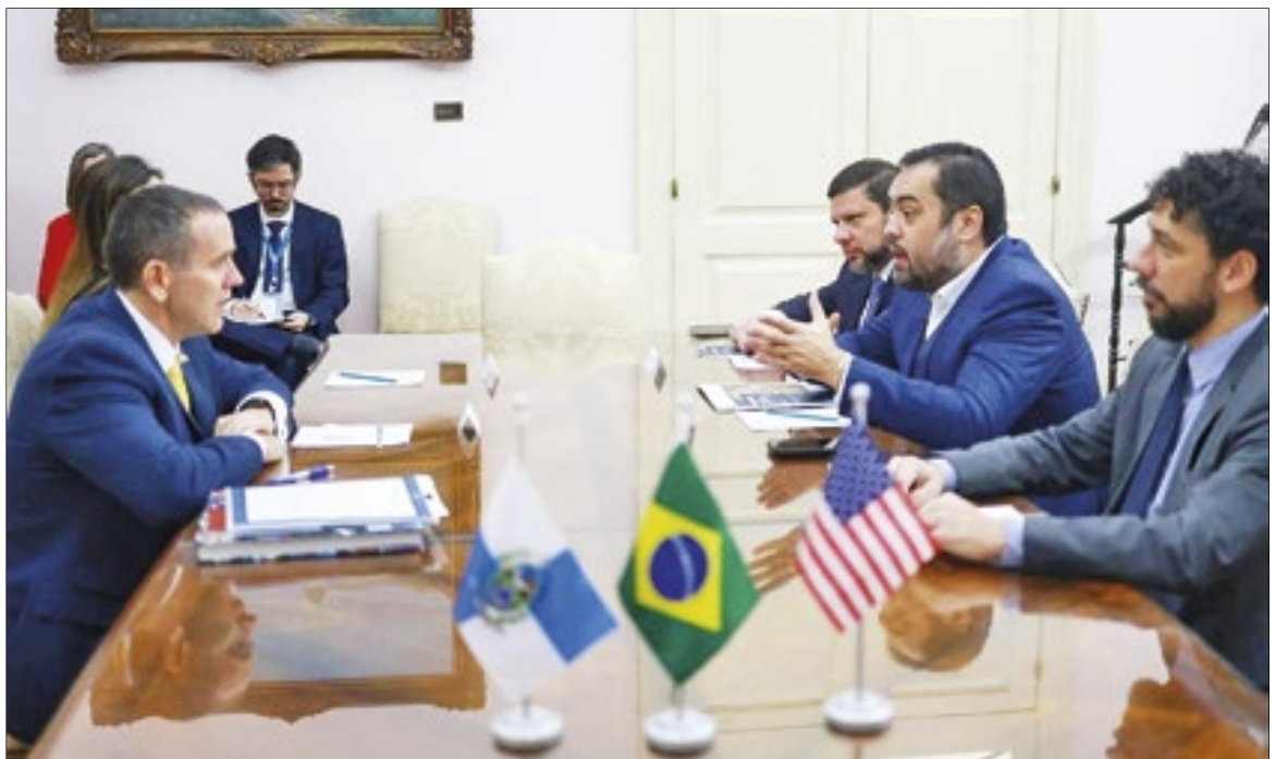
No encontro, o governador destacou índice de desenvolvimento do estado e enalteceu o turismo