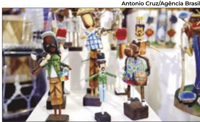
Os inscritos antes de 2015 devem atualizar os dados