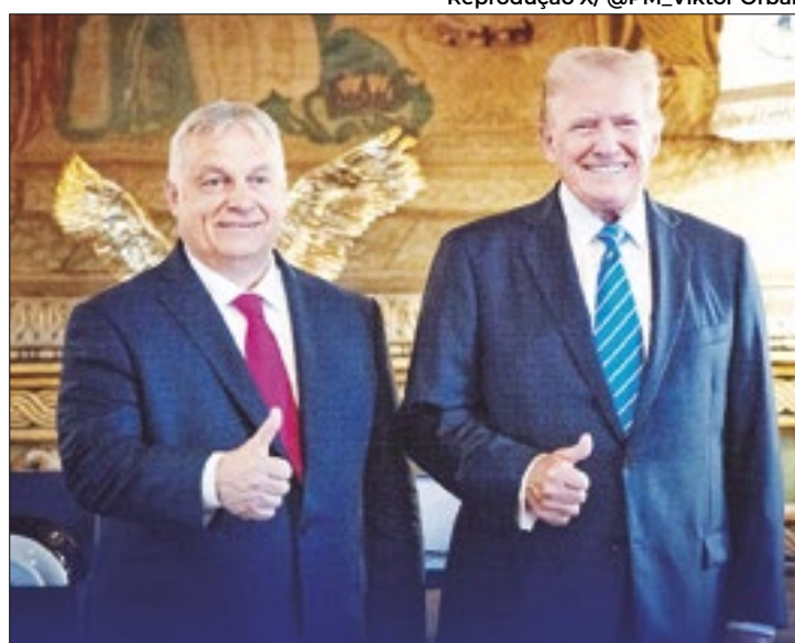
Orbán apoiou Donald Trump para os líderes europeus

Agora, ele completa sua intenção de tornar-se uma ponte para uma solução da guerra sa-