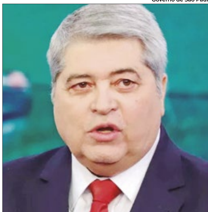
Datena pode desistir "se encherem o saco"

"Eu sou o político mais vitorioso da história. Eu nunca perdi uma eleição", ironizou o apresentador, que está de férias de seu programa diário. "A população confia na minha palavra. Questão política é ou-