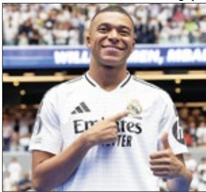
Mbappé usará a 9 do Real Madrid

Mbappé foi apresentado pelo Real Madrid e contou como Vinicius Jr contribuiu para o acerto com o Real e já projetou a parceria com o camisa 7 a partir da próxima temporada.