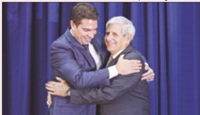
O que Ramagem e Heleno fizeram com a denúncia?