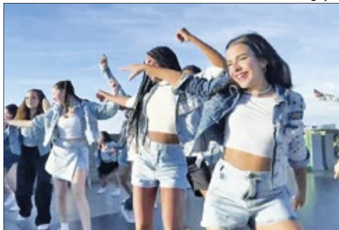
Crianças cantaram música tema no Cristo Redentor