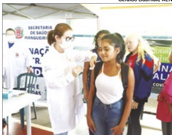
Foco é o Calendário Nacional de Vacinação