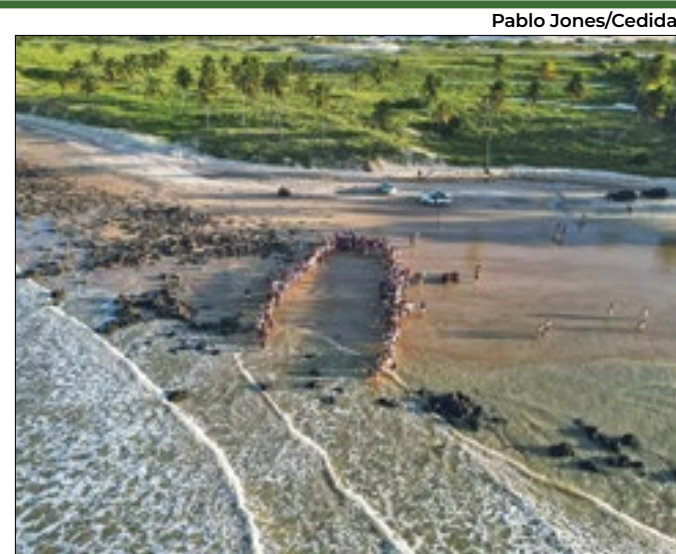
Ação de soltura é parte de projeto de conservação