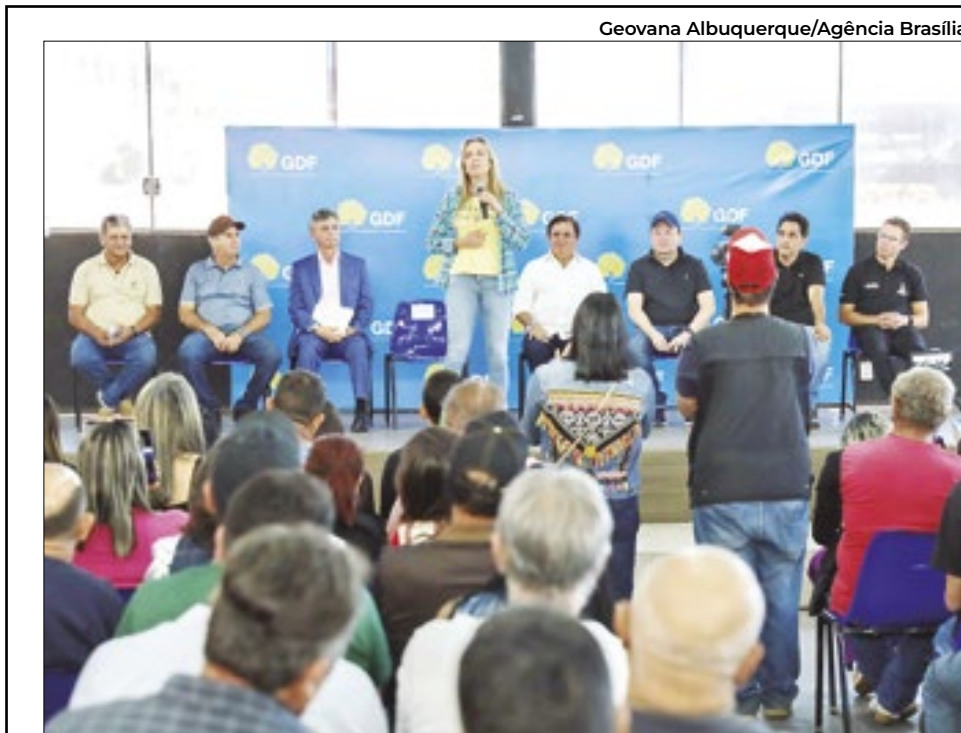
A vice-governadora do DF, Celina Leão, durante a cerimônia de assinatura