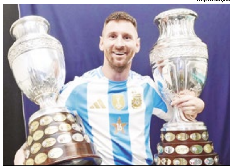
Messi se isolou como jogador mais vezes campeão do futebol