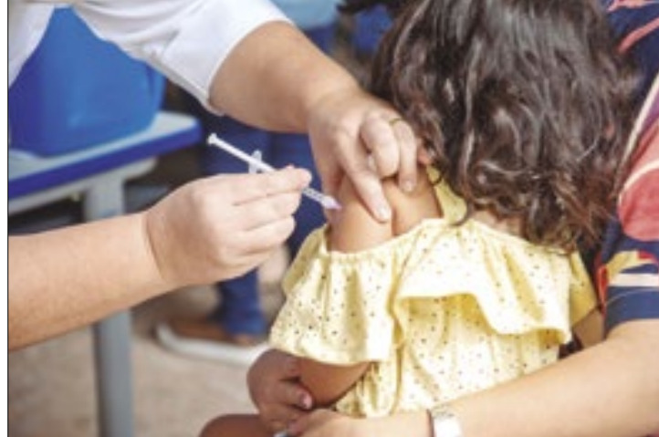
Em 2021, país ocupava a sétima posição no ranking

Com a redução na quantidade de crianças não vacinadas, o Brasil, que em 2021 era o sétimo no grupo dos países com