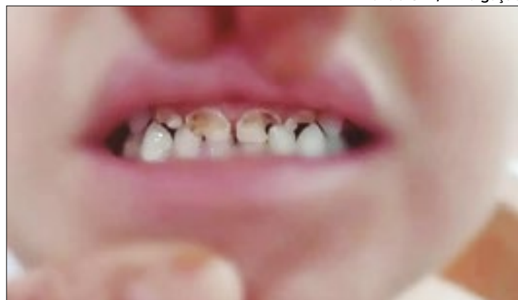
Criança estava com cáries nos dentes