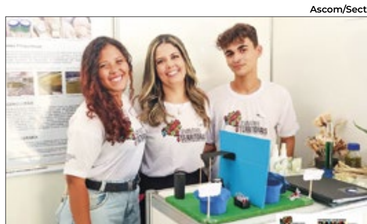
Estudantes utilizam sisal para criar inseticida e repelente

Além da denúncia, o MPCE propôs um acordo de não persecução penal para oito dos acusados, relacionados ao crime de peculato.