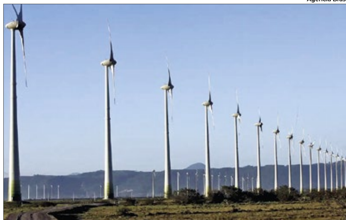
A Ventos Santa Tereza, do Complexo Cajuína, recebeu a primeira parcela do financiamento

Projetos na Bahia e no RN recebem financiamento do FDNE