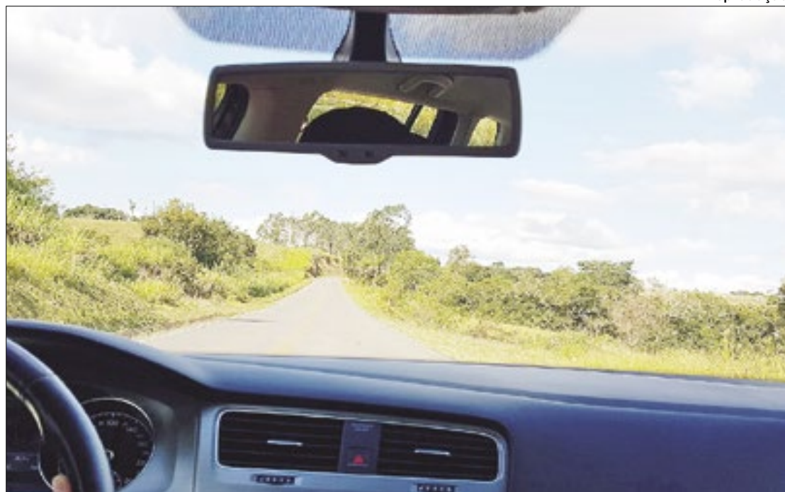
O aumento em 10 anos foi de 80%, segundo o Conselho Brasileiro de Oftalmologia

Na avaliação do conselho, diversos fatores contribuem para a crescente demanda por cuidados oculares entre motoristas brasileiros, incluindo o envelhecimento da população; a exposição prolongada às telas