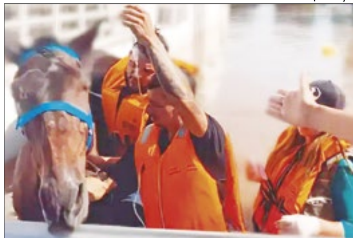
Ainda há 13 animais aguardando seus donos no abrigo

Proprietários de cavalos que foram resgatados após as enchentes de maio têm até esta terça-feira (16) para retirar os animais do abrigo de equinos da EPTC (Empresa Pública de Transporte e Circulação), no bairro Lami, em Porto Alegre.