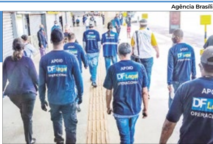
Fiscalização do DF Legal vai às ruas para atuar contra ilegalidades. Mas, quais são elas?

A Secretaria de Ordem Urbanística fala pouco. Ou nada. Segundo a sua assessoria de comunicação social afirmou, em nota à esta coluna, “o secretário não gosta de dar entrevistas. Ele nunca aceitou nenhuma que pediram”.