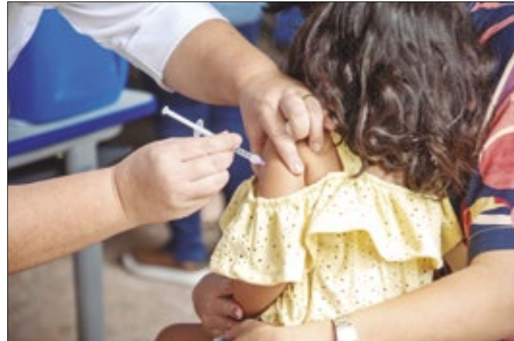
Em 2021, país ocupava a sétima posição no ranking

Com a redução na quantidade de crianças não vacinadas, o Brasil, que em 2021 era o sétimo no grupo dos países com