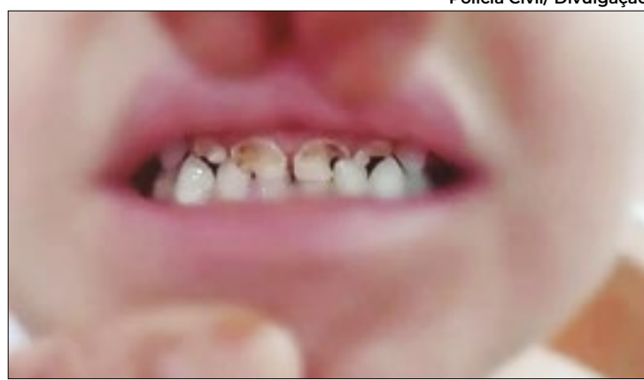
Criança estava com cáries nos dentes