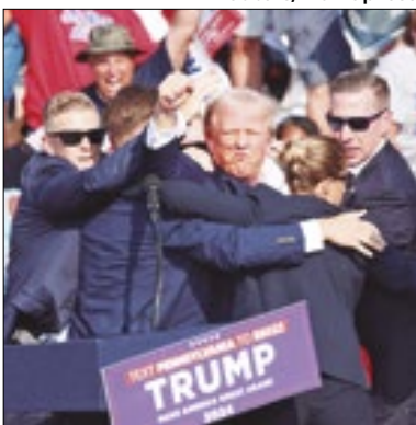
Trump foi atingido de raspão