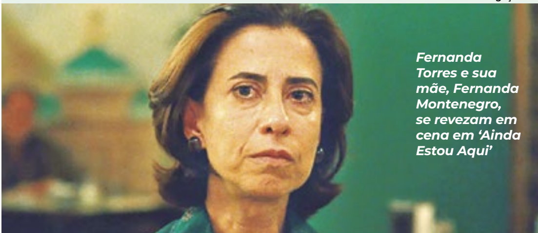
Fernanda Torres e sua mãe, Fernanda Montenegro, se revezam em cena em 'Ainda Estou Aqui'

O Festival de Veneza se aproxima e começam as especulações sobre os filmes que se destacarão no evento. O Brasil entra forte na disputa com 'Ainda Estou aqui', de Walter Salles