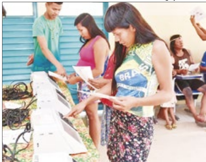
TRE registra aumento significativo de representantes