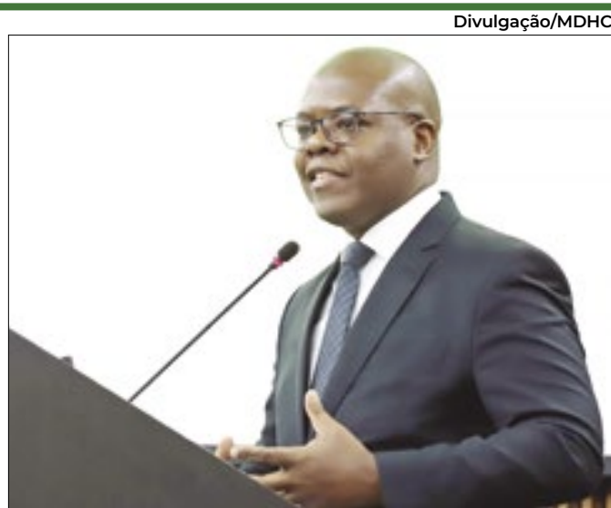
Ministro quer diálogo com governadores