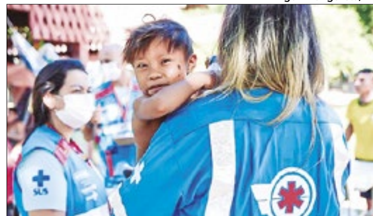
Crianças e idosos são mais afetados com as doenças