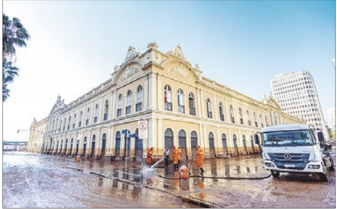
Serão contempladas famílias que tiveram suas casas destruídas

Eles devem informar o nome de cada um dos membros