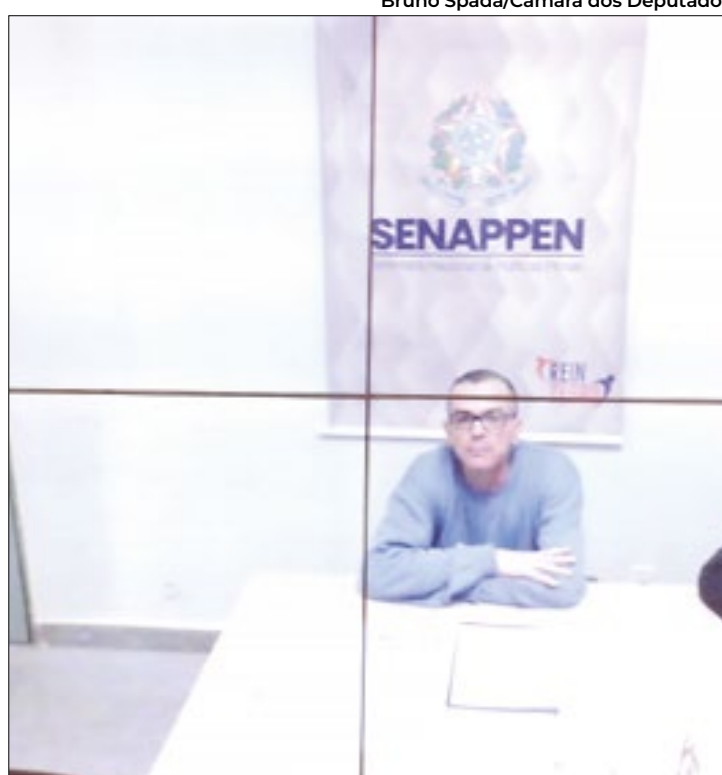
Rivaldo depôs remotamente da penitenciária

“Nunca tive contato com essas pessoas, desde o dia em que nasci, eu nunca falei com nenhum irmão Brazão. Algo profissional, político, religioso ou de lazer. A milícia é um câncer que faz com que mortes aconteçam”, se defendeu.