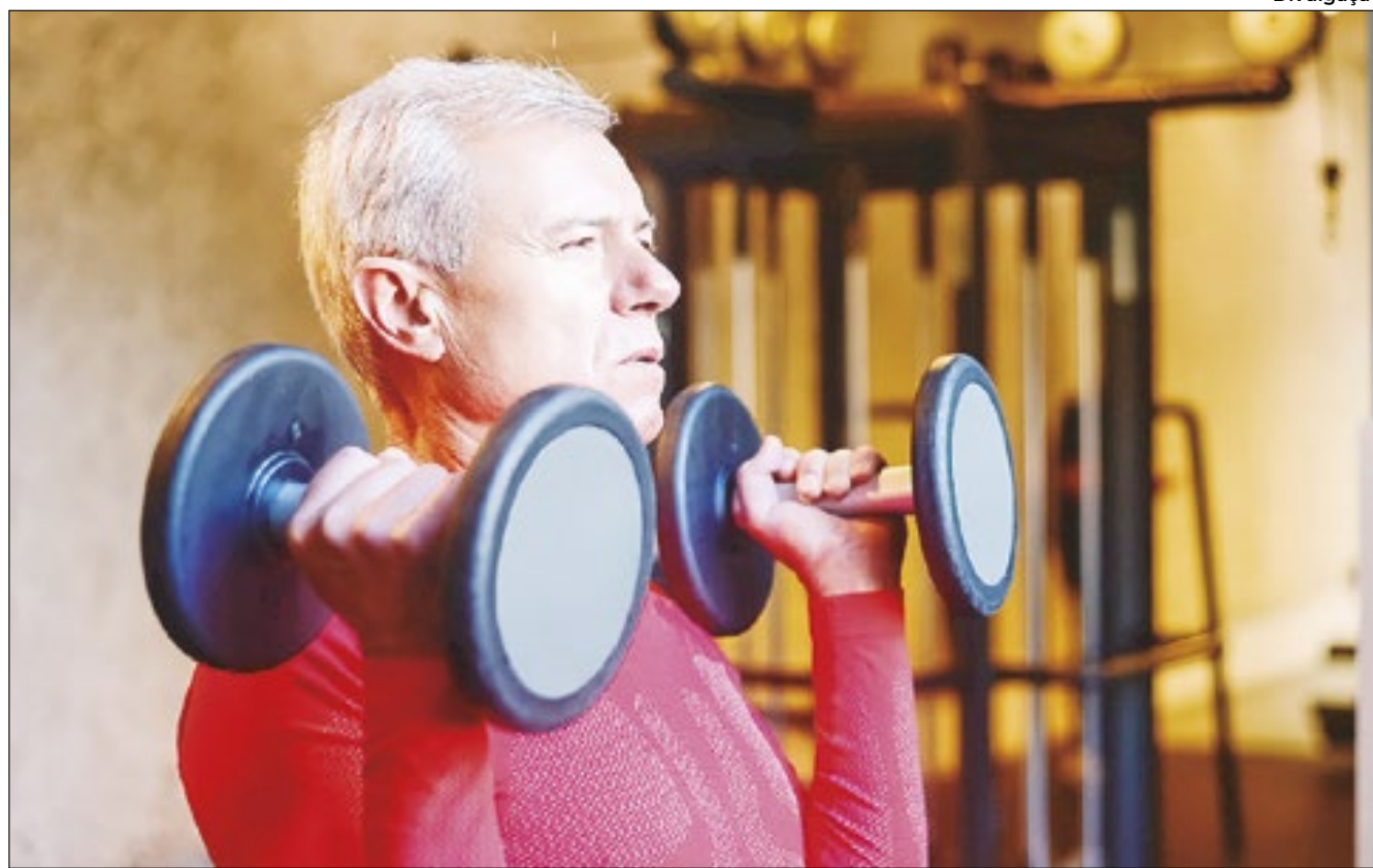
Estudo indica que musculação melhora a função cerebral

Além dos benefícios diretos na prevenção dessas doenças, a prática regular