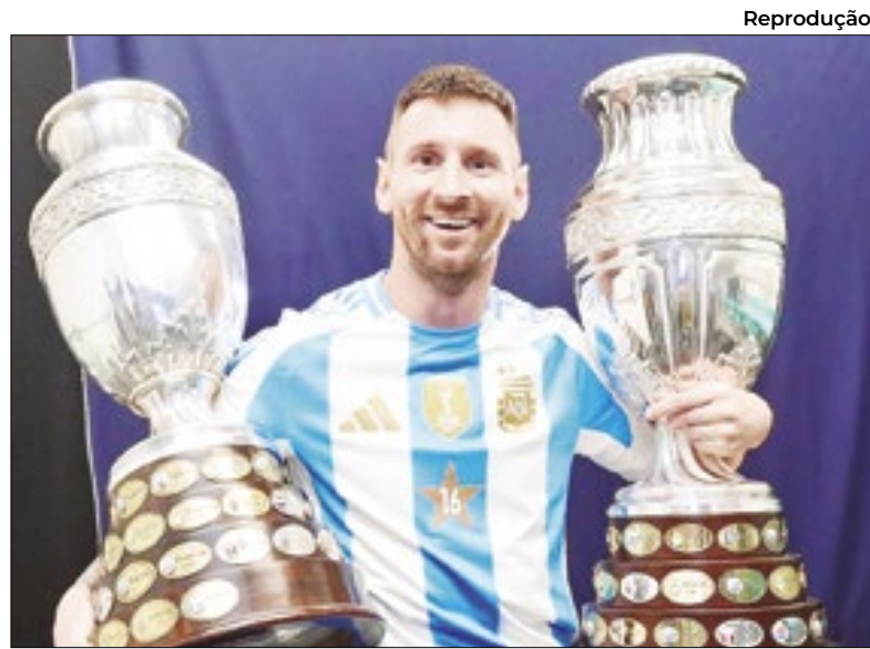
Messi se isolou como jogador mais vezes campeão do futebol