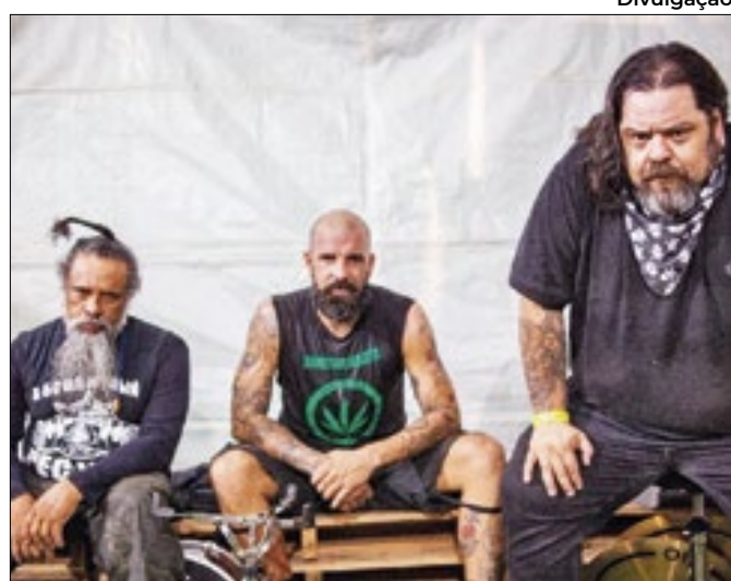
Banda A.R.D. conta com apoio de programa cultural

Estudo busca potencial de, ao menos, 10 espécies nativas