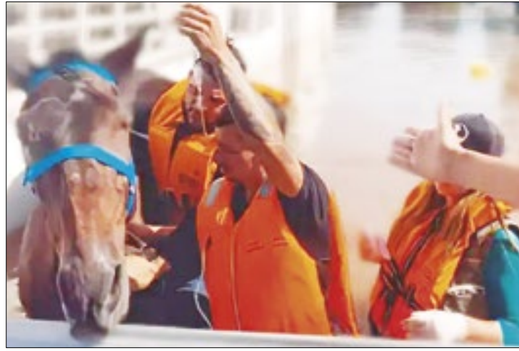
Ainda há 13 animais aguardando seus donos no abrigo

Proprietários de cavalos que foram resgatados após as enchentes de maio têm até esta terça-feira (16) para retirar os animais do abrigo de equinos da EPTC (Empresa Pública de Transporte e Circulação), no bairro Lami, em Porto Alegre.