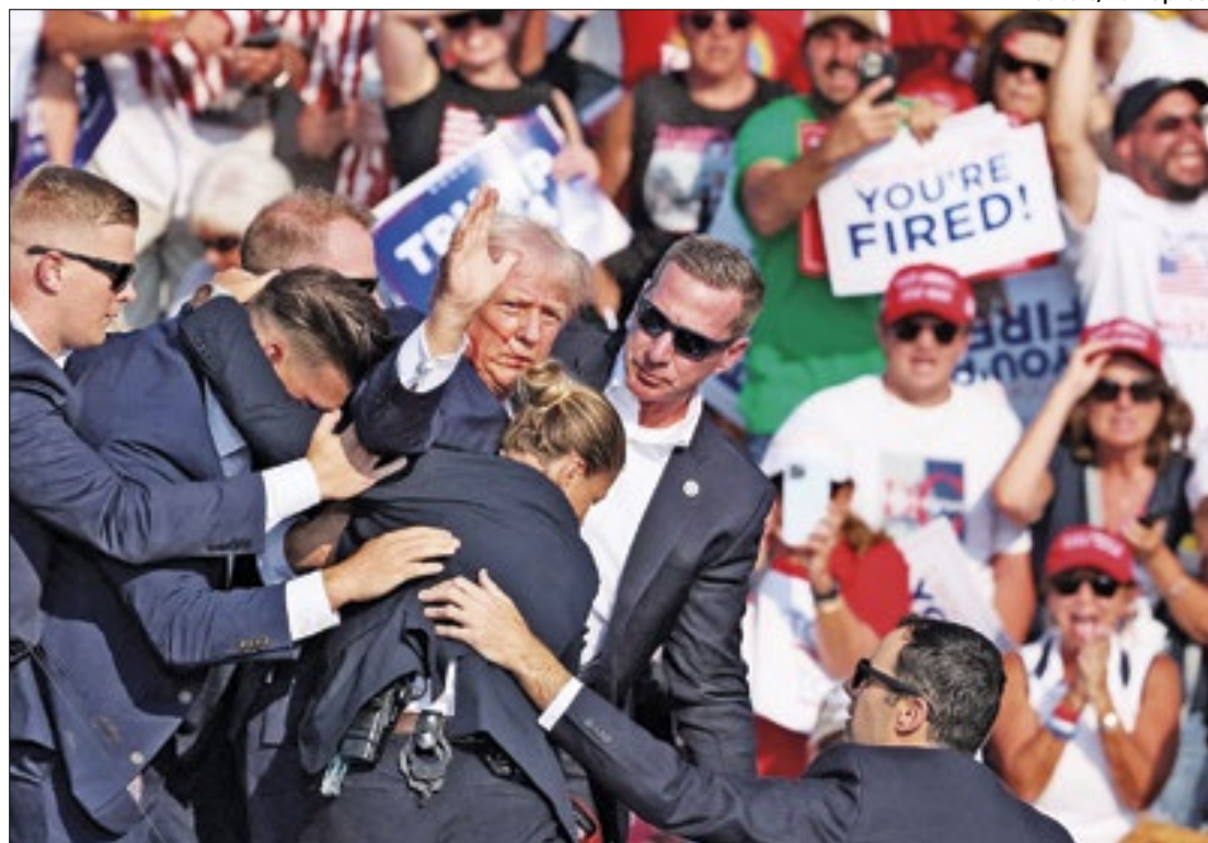
Atentado ao ex-presidente americano também deve mexer tabuleiro brasileiro

“Eu não sei se isso vai fortalecer alguém. Isso empobrece a democracia. Em vez de a gente ficar analisado se alguém ganha ou perde com isso, o que temos que ter certeza é que a democracia perde. Os valores do diálogo, os valores do argumento, de sentar em uma mesa de forma diplomática e buscar soluções para os problemas, vão indo pelo ralo”, disse o presidente, ao ser perguntado se o ataque fortalece a extrema-direita no mundo.