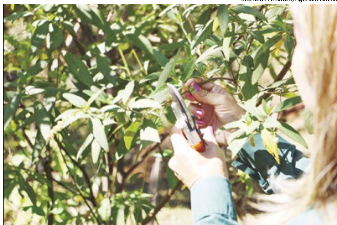
Estudos promissores para o uso das plantas no combate ao diabetes

A Prefeitura de Jaraguá (GO) abriu concurso com 666 vagas na Secretaria Municipal de Educação, Esporte e Cultura. São cargos de nível médio e superior, como pedagogo, psicólogo e fonoaudiólogo, com salários de até R$ 3.295,95. As inscrições vão até 8 de agosto.