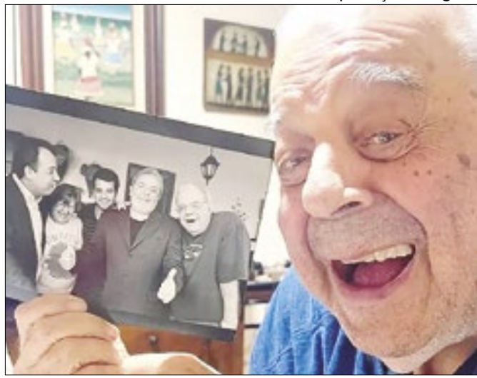
Sérgio Cabral faleceu no último domingo aos 87 anos