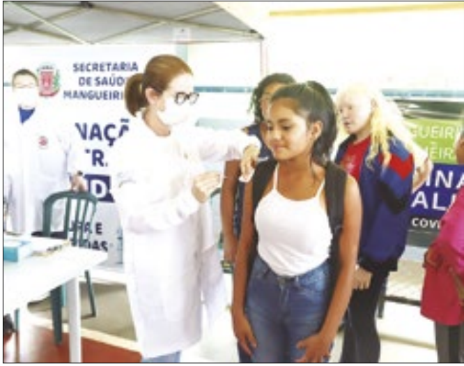
Foco é o Calendário Nacional de Vacinação