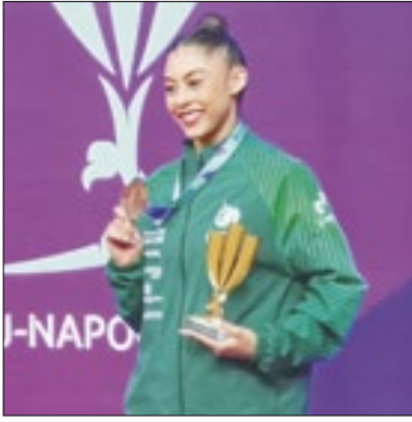
Babi levou bronze na Copa