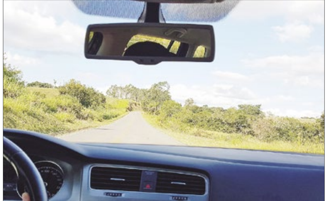
O aumento em 10 anos foi de 80%, segundo o Conselho Brasileiro de Oftalmologia

Na avaliação do conselho, diversos fatores contribuem para a crescente demanda por cuidados oculares entre motoristas brasileiros, incluindo o envelhecimento da população; a exposição prolongada às telas