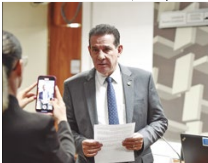
Vanderlan: normas para moralizar emendas PIX