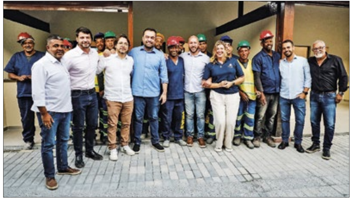
investimentos do Governo do Estado nas melhorias da Feirarte atingiram R$ 12,9 milhões

destacou que o enoturismo é um segmento que vem ganhando força e crescendo em Teresópolis, uma cidade que possui solo, clima e grande potencial para a indústria vinícola. Ele ressaltou que o estímulo ao cultivo de uvas representa uma indústria limpa, capaz de atrair novos negócios, aumentar o fluxo de visitantes e fortalecer o turismo rural, gerando renda e oportunidades para os moradores.