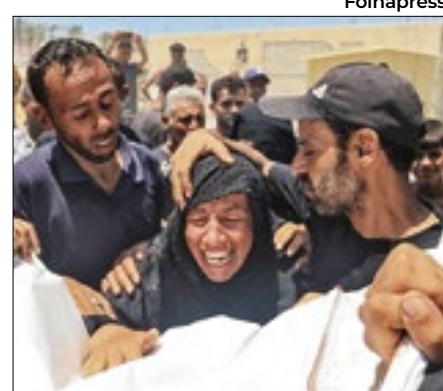
Netanyahu não disse se Deif foi morto

Israel atacou Khan Yunis, no sul da Faixa de Gaza, no sábado (13), que visava atingir um comandante do Hamas, Mohammed Deif. Autoridades de Gaza afirmam que ao menos 90 palestinos inocentes morreram e 289 ficaram feridos. Não se sabe se Deif foi morto. A Rádio do Exército disse que ele estava se escondendo em um prédio na zona humanitária designada por Israel, a oeste de Khan Yunis.