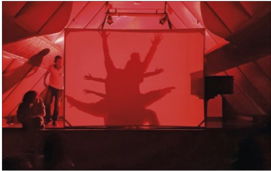
De quarta a domingo, a programação inclui oficinas para crianças de diferentes idades.

No dia 18, a oficina Uma Arte Toda Sua convida os participantes a aprender a técnica de desenho tendo como tema a cultura egípcia. A ideia é ocupar os ambientes de uma casa imaginária, inspirada nas recorrentes intervenções artísticas que ocorrem no espaço da Casa Museu. Já na Oficina de Escrita Pictográfica, as crianças observarão como diferentes cul-