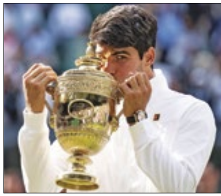
Alcaraz bateu Djokovic novamente

Campeão de Wimbledon em 2023, o tenista espanhol Carlos Alcaraz, 21, reafirmou sua posição no domingo (14), ao vencer pela segunda vez consecutiva o sérvio Novak Djokovic, 37, na final de simples masculina. Em uma partida disputada para Djokovic, Alcaraz não baixou a guarda do início ao fim e derrotou o rival por 3 sets a 0, com parciais de 6-2, 6-2, 7-6.