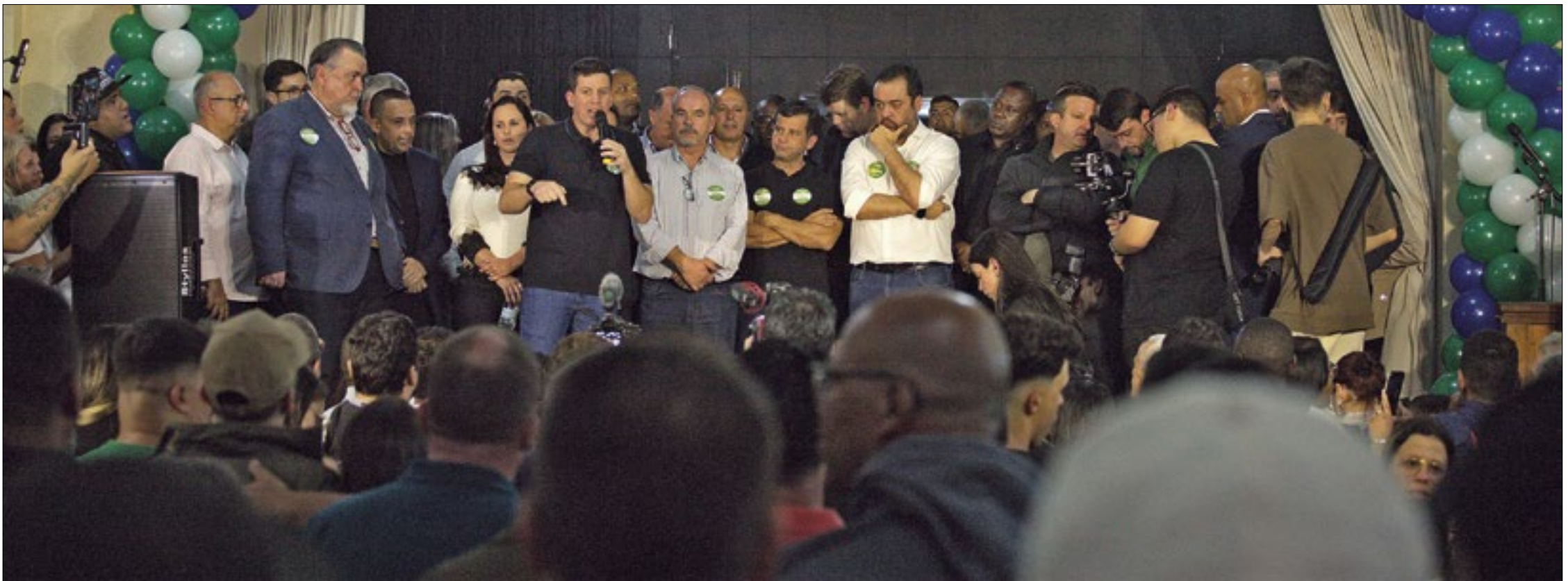
Pré-candidatura de Hingo Hammes em Petrópolis tem apoio do governador Cláudio Castro, que prestigiou o evento durante agenda oficial na Região Serrana na sexta-feira (12)

O evento de lançamento da pré-candidatura de Hingo Hammes pelo Partido Progressistas à Prefeitura de Petrópolis, na última sexta-feira, reuniu mais de 2 mil pessoas no Sport Club Magnólia. Também foi anunciado o pré-candidato a vice-prefeito, Albano Baninho. Hingo, que foi prefeito interino no município em 2021, conquistou o apoio do governador Cláudio Castro, e de nomes importantes da política do Rio, que foram prestigiar o evento. Estiveram presentes o presidente do PP no RJ, deputado federal Dr. Luizinho, o secretário de Estado de Turismo do RJ, Gustavo Tutuca (PP); o senador Carlos Portinho (PL); o ex-prefeito de Petrópolis e atual secretário de Estado de Meio Ambiente, Bernardo Rossi (Solidariedade).