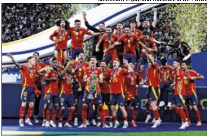
Lamine Yamal e seus companheiros encantaram a Europa

Em final emocionante, a Espanha bateu a Inglaterra por 2x1 e conquistou sua quarta Eurocopa da história. Com a taça, os espanhóis se consolidaram como os maiores campeões do torneio. Com um time recheado de jovens, a Espanha tem grande esperança no futuro e agora mira a 'Finalíssima'.