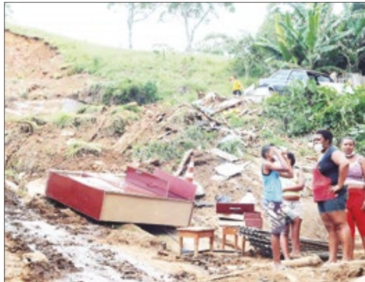
Registros da maior tragédia socioambiental da Região Serrana