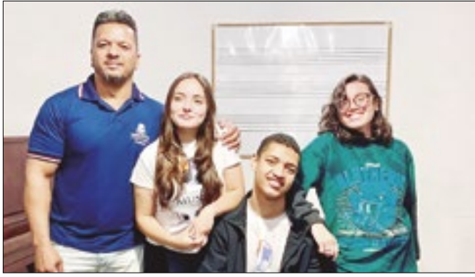
Alunos que concluíram o curso de formação musical