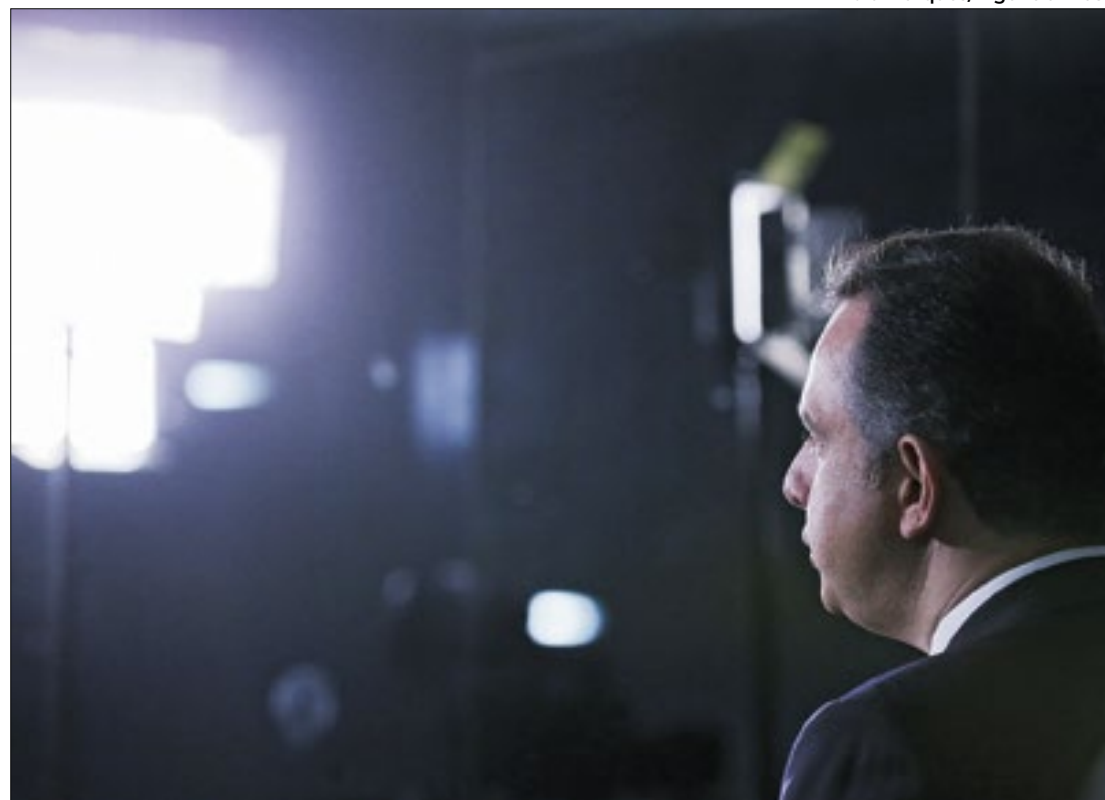
Pacheco confia em aprovação após acordo com o governo

O conteúdo do acordo tramita na forma do projeto de lei (PL) do senador licenciado Efraim Filho (União-PB), e relatado pelo senador Jaques Wagner (PT-BA), líder do governo no Senado. Nele está prevista a volta gradual da tributação sobre a folha de pagamento de certos segmentos e de municípios até 2028, mas a folha fica desonerada até o final deste ano. Acontece que o governo foi contra a desoneração desde que o Congresso Nacional a prorrogou por mais quatro