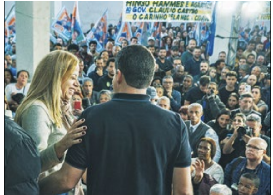
Pré-candidatos ao legislativo municipal e lideranças compareceram ao evento