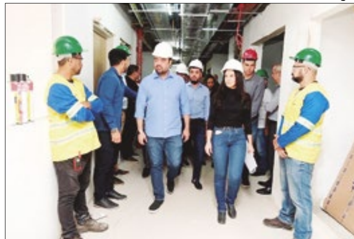
Governador Cláudio Castro visitou as novas instalações

O novo hospital será equipado para atender pacientes oncológicos adultos e contará com 58 leitos, incluindo 10 unidades de terapia intensiva e 48 leitos de enfermaria. A estrutura de atendimento incluirá serviços de diagnóstico, cirurgia oncológica, oncologia clínica, medidas de suporte, reabilitação, cuidados paliativos, uma central de