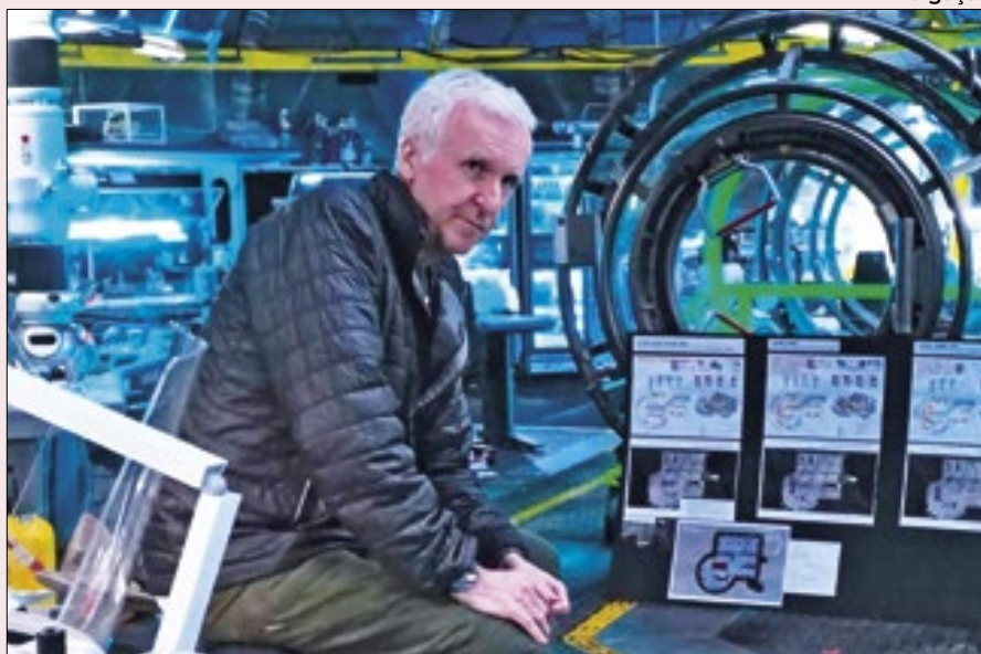
Cameron no set de filmagens de 'Avatar', um de seus maiores êxitos