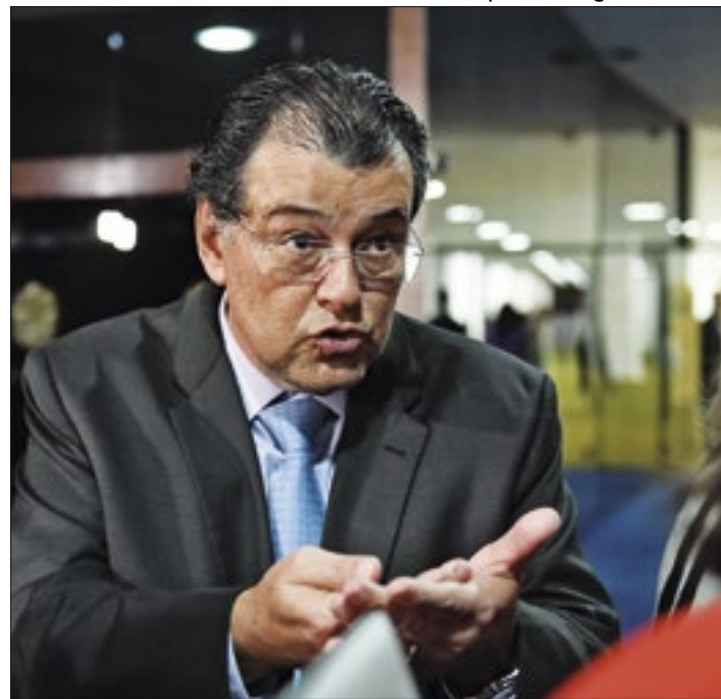
Senador não terá pressa na análise do projeto da tributária

A escolha de Pacheco segue um caminho oposto ao adotado pelo presidente da Câmara, Arthur Lira (PP-AL). Eduardo Braga foi o relator no Senado da Proposta de Emenda à Constituição (PEC) 45/2019 que determinava a reforma tributária e seguirá como o relator no projeto para regulamentá-la. A pedido de Pacheco, ele elaborará um cronograma de análise visando à ampliação do