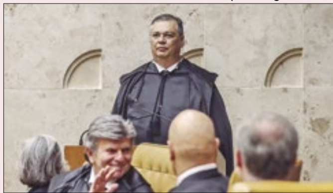
Dino fará audiência para discutir orçamento secreto