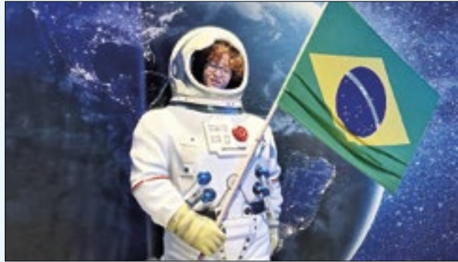
'Galaxion' está instalada no Shopping Fashion Mall