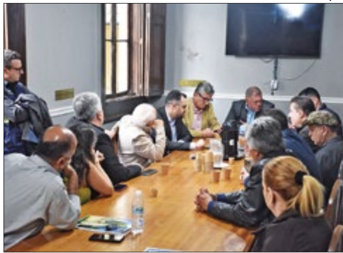
Câmara pede esclarecimentos sobre inconsistências