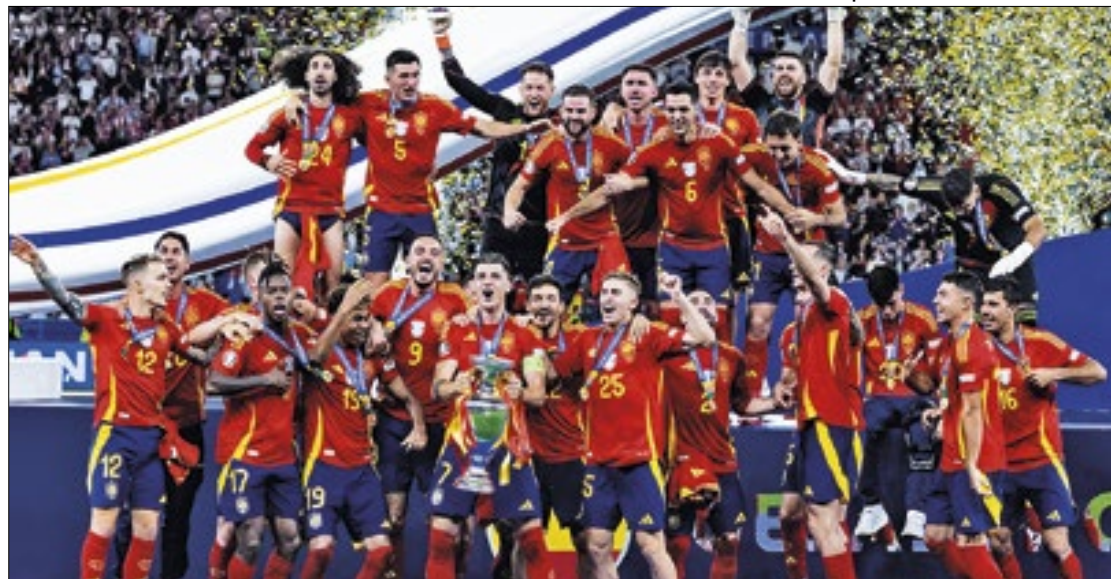
Selección Española Masculina de Fútbol

Espanha e Inglaterra fizeram um primeiro tempo bastante equilibrado e com poucas chances de gols. As duas equipes tiveram apenas uma finalização certa cada uma. Ainda no intervalo, porém, a Espanha teve uma baixa importante. Rodri, destaque do meio de cam-