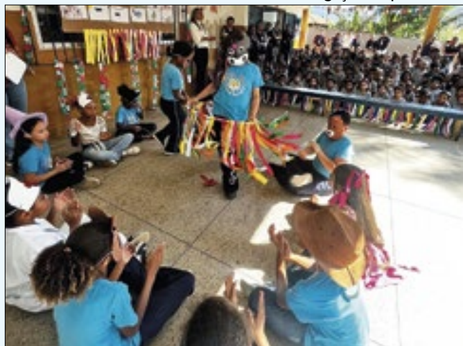
Pequena Tribo atende 70 alunos de duas escolas