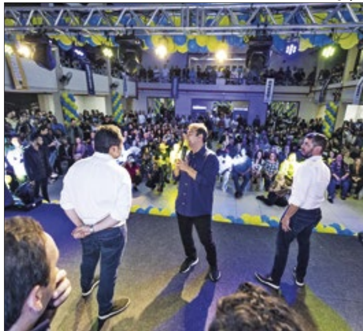
Evento contou com a presença de 1,5 mil pessoas no CAER