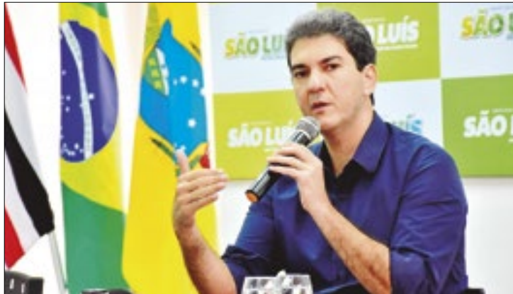
Decisão judicial impõe multa de R$ 50 mil diários