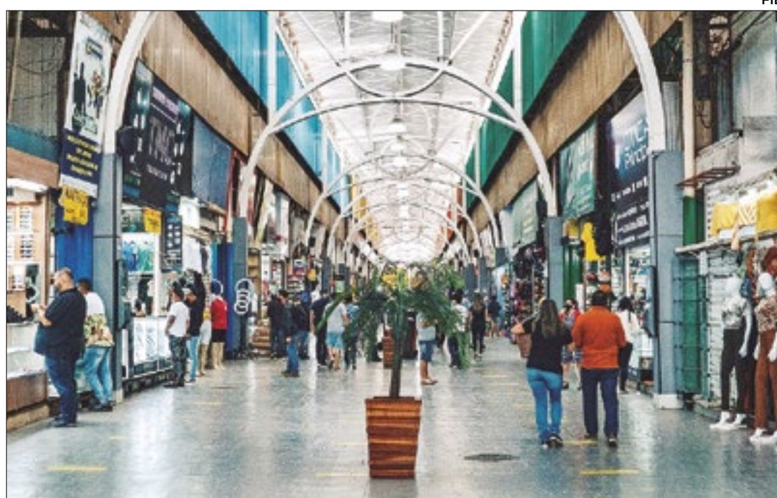
Um dos alvos da operação da PF e da Receita foi a Feira dos Importados

Quadrilha importou ilegalmente 500 mil aparelhos