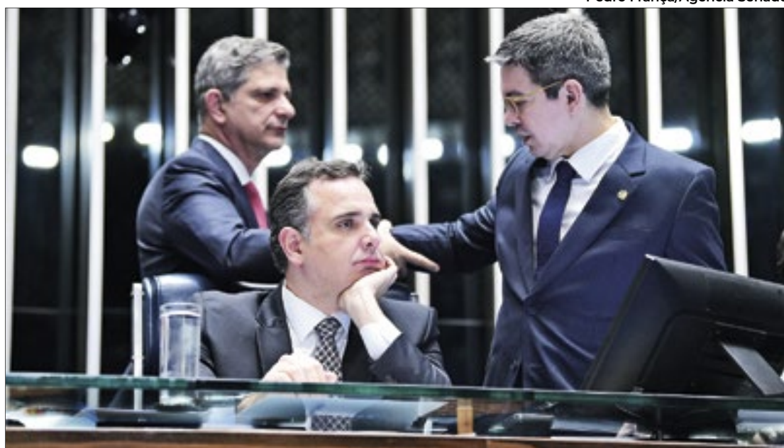
Projeto da reoneração ficou sem data prevista para ser votado

O presidente do Senado também já tinha afirmado que as taxações recentemente aprovadas para compras internacionais abaixo de US$ 50 e de valores acima de R$ 2.640 em apostas esportivas também poderiam ser fontes de arrecadação vinculadas ao regime de transição. “Tudo isso é suficiente para arrecadação necessária para 2024”, afirmou Pacheco, na última terça-feira (9). Até o fechamento desta edição, os parlamentares ainda não tinham definido um novo dia para a votação.