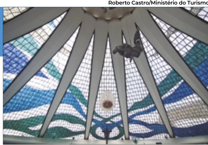
Catedral de Brasília, um dos ícones do design arquitetônico de Brasília

Segundo o MTur, na cartilha “Orientações Básicas para o Turismo Cultural”, de 2010, “cabe observar que o turismo em cidades históricas e culturais (...) pode ser um vetor para sua descaracterização e destruição (...) uma vez que a especulação imobiliária ‘expulsa’ os moradores tradicionais e altera a paisagem, e a ampliação da infraestrutura tu-