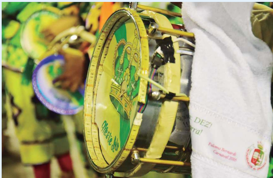
Instrumento de origens africanas, a cuíca foi sendo adaptada ao longo dos anos