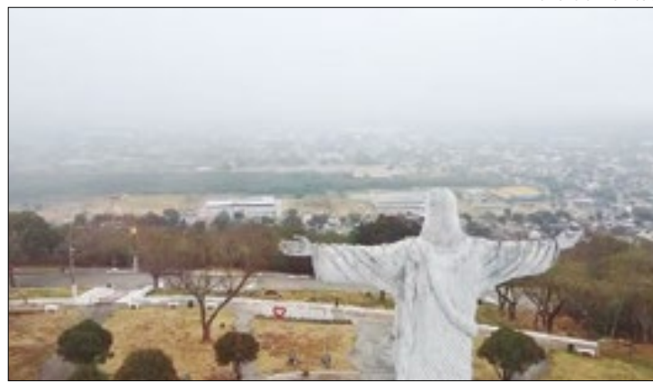
Corumbá nesta terça-feira (10)