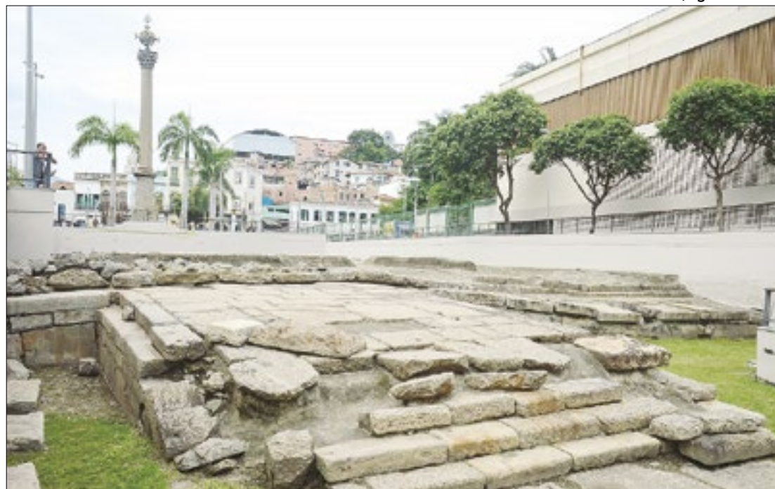
Concurso vai escolher arquiteto negro para o projeto do Centro Cultural Rio-África

Traços de um arquiteto negro vão definir como será o Centro Cultural Rio-África, que ficará na região carioca conhecida como Pequena África, por reunir fragmentos físicos e culturais da presença negra no Rio de Janeiro e no país.