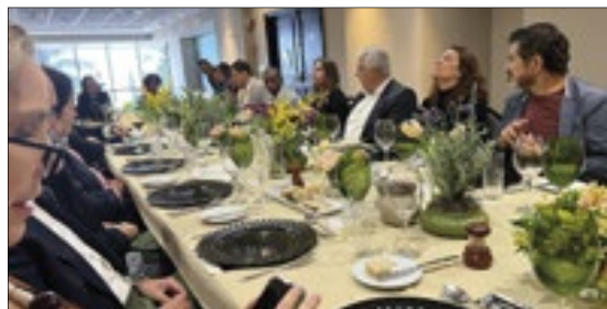
O evento foi realizado no JW Marriot Rio de Janeiro, na última terça-feira