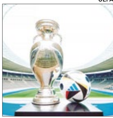
Final será neste domingo (14)

A final da Eurocopa 2024 está decidida. A Inglaterra bateu a Holanda por 2 a 1, de virada, e carimbou seu passaporte para Berlim, onde enfrentará a Espanha no próximo domingo (14) às 16h. O jogo será disputado no Estádio Olímpico de Berlim, que foi construído para as Olimpíadas de 1936. A Espanha vai em busca de sua quarta Eurocopa, podendo ser a única seleção a conseguir tal feito. Já a Inglaterra quer ganhar sua primeira Eurocopa da história.