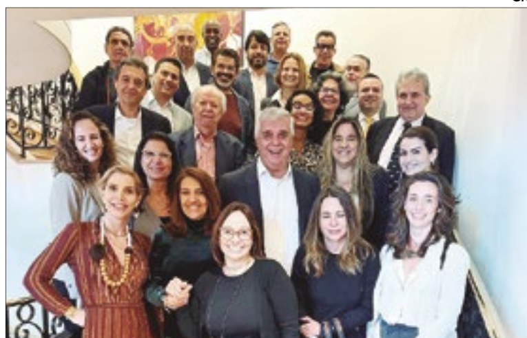
Almoço com os gerentes gerais e diretores dos hotéis 5 estrelas do Rio acontece mensalmente

■ TRANSFORMAÇÃO DIGITAL - O secretário de Estado de Transformação Digital, Mauro Farias, participou, nesta quarta-feira (10), do evento Transformar Juntos, promovido pelo Sebrae, em Brasília. O gestor apresentou as principais ações do estado na área como, por exemplo, o Programa RJ Digital e sua expansão aos municípios. O Rio de Janeiro tem hoje o maior projeto de transformação digital do país. O evento fomentou o debate sobre políticas