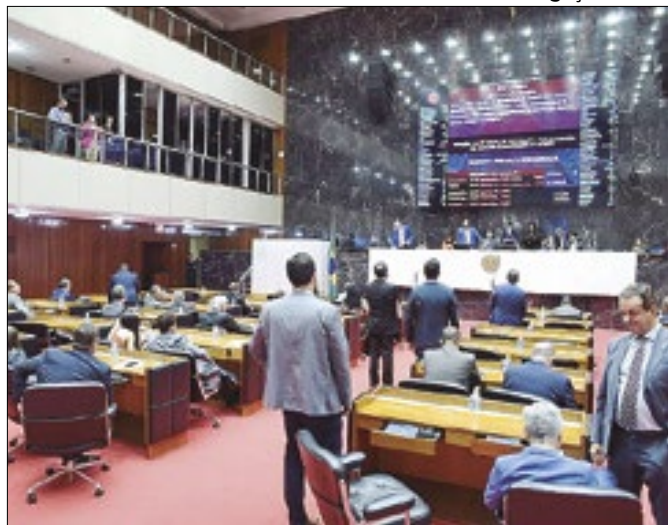
Mensagens do governador serão votadas na ALMG