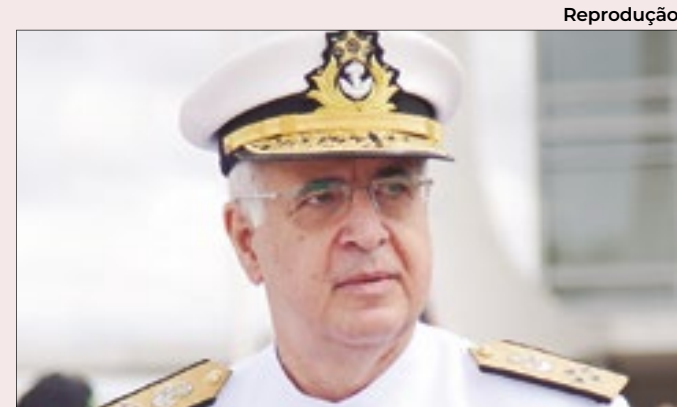
Portaria foi assinada pelo almirante Aguiar Freire

O posicionamento do petista diante da decisão do Comitê de Política Monetária (Copom) de manter a taxa básica de juros a 10,50% também foi bem avaliado entre apoiadores de Bolsonaro: 51% daqueles que votaram no ex-presidente também concordam com apontamentos de Lula contrários à atuação do Banco Central, 36% discordam e 13% não souberam responder.