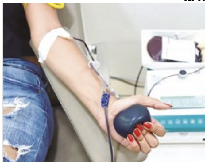
Iniciativa beneficia doadores de sangue, leite e livros