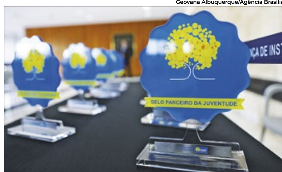
Prêmio destaca esforço para ampliar mercado de trabalho