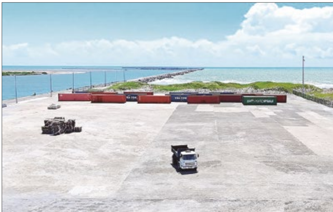
Operação teste será feita em alto mar e visa reduzir custos e agilizar exportações

O governo do Piauí, através da Investe Piauí e da Companhia Porto Piauí, está atuando com a mineradora Lion Mining e a empresa asiática Rocktree Logistics para realizar a primeira operação de exportação de minério de ferro no Porto de Luís Correia ainda em 2024. A operação teste envolve a transferência de minério de ferro de um barco menor para um navio maior em alto mar, um procedimento conhecido como transshipment.