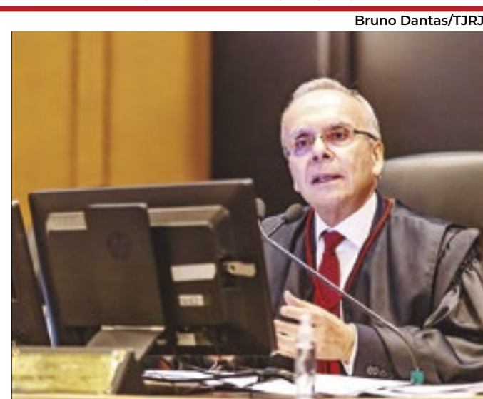
Presidente do TJRJ implantou nova ferramenta