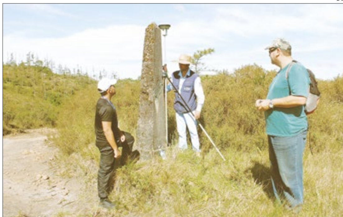
A origem da descoberta do IAT é uma multa aplicada pela Polícia Ambiental

A Polícia Ambiental tem uma atenção especial para a região porque ali está a APA de