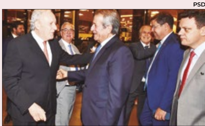
Ministros de Lula: Lewandowski com Valdemar

Lira chegou mesmo a propor um pacto a Lula. Na negociação das candidaturas, um teria poder de veto sobre a indicação do outro. É um sinal de que Lira já compreendeu que terá de conversar. Já Lula tenta agora ficar distante da disputa. Mas mandou ao jantar seus ministros.