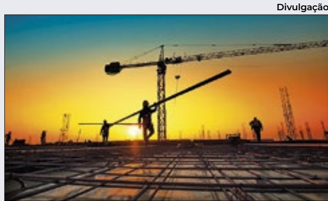
Construção civil apresenta forte alta no mês de junho

Sem citar medidas que evitem novas ocorrências, a autarquia revelou que os clientes serão notificados por aplicativo ou pelo Internet banking. "Nem o BC, nem as instituições participantes usarão quaisquer outros meios de comunicação aos usuários afetados".