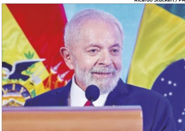
Popularidade melhora após mudanças na comunicação

Já o trabalho do presidente, o seu “modo de governar”, é aprovado por 54% dos eleitores e reprovado por 43%, aponta pesquisa, outros 4% não sabem ou não responderam. O resultado indica que a aprovação voltou a se descolar da reprovação. Na última pesquisa, divulgada em maio, os percentuais eram de 50% e 47%, o que indicava empate técnico entre os dois indicadores. Segundo a pesquisa, os que mais bem avaliam o trabalho do presidente são os entrevistados com renda familiar de até dois salários