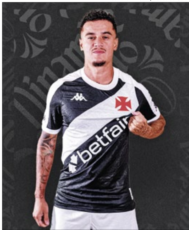
Coutinho vestirá a lendária camisa 11 do Vasco da Gama

Ao fim de sua passagem no Vasco, Coutinho disputou 44 partidas com a camisa profissional do clube. Ele rumou para a Inter de Milão, onde foi campeão da Copa da Itália e da Supercopa da Itália, mas não se firmou e acabou emprestado ao Espanyol, em 2012. Pelo clube da Espanha, o garoto teve mais