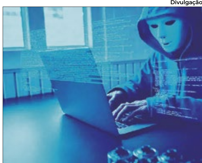
Ocorrência mais recente é a sexta, somente este ano

Variação anualizada já 'encosta' no teto da meta de inflação (4,5%)