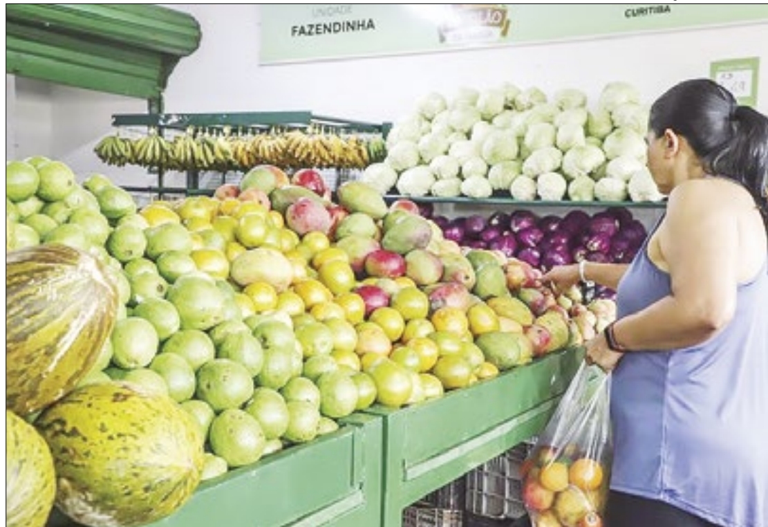
Grupo Alimentos é o que mais influenciou no recuo do IPCA em junho

Em junho de 2023, houve deflação de 0,08%. Se considerado o primeiro semestre do ano (1S24), porém, o ranking da carestia é puxado pela manga (69,5%), se-