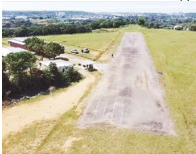
Pista foi construído em área preservada do Recife