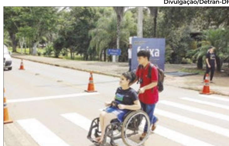
A faixa de pedestres poderá se tornar patrimônio imaterial de Brasília

O processo de reconhecimento será feito a partir do voto de 5 voluntários, que se apresentaram durante a última reunião do Condepac, a 24ª, realizada na última ter-