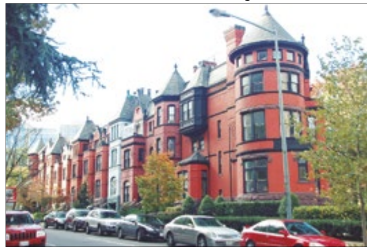
A capital dos EUA é cidade-irmã de Brasília desde 2013. Washington tem padrões rígidos que impedem sua poluição visual

rística, sem respeitar o padrão de arquitetura local, com a utilização de materiais exóticos, provoca poluição visual e o comprometimento da paisagem cultural”.