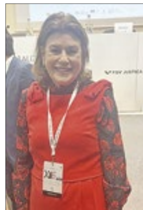
Guimar Mendes, esposa do ministro Gilmar Mendes, do STF, muito atenta e acompanhando o marido