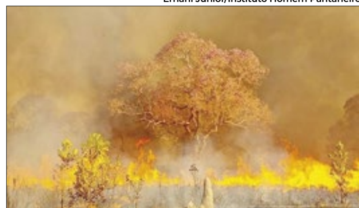
Fogo já queimou 520 mil hectares no Pantanal