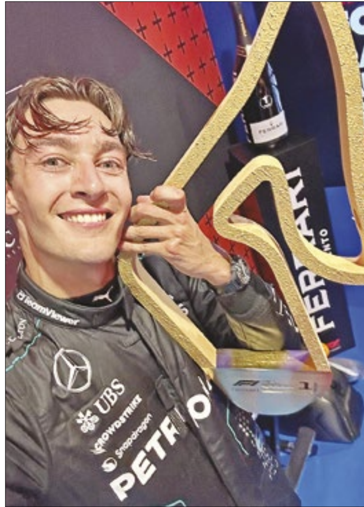
George Russell surpreendeu e vence o GP da Áustria 2024

Charles Leclerc foi aos boxes novamente na 17ª volta. Ele