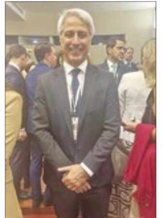
O deputado Alessandro Molon também participou do Fórum de Lisboa

a Federação dos Produtores de Arroz do Rio Grande do Sul (Federarroz) divulgou um anúncio dizendo o que poderia ser feito com os R$ 7,2 bilhões que serão gastos na importação de arroz. Segundo o anúncio, daria para, por exemplo, recuperar os 8,4 km de estradas destruídas na chuva (R$ 3,3 bilhões). Ou reconstruir todas as escolas afetadas (R$ 755 milhões). Adquirir 3,9 mil moradias populares (R$ 713 milhões). Ou retomar a operação por lá.