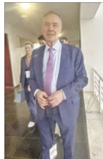
O presidente do STF, ministro Luís Roberto Barroso, mal conseguia caminhar, atendendo aos pedidos de fotos