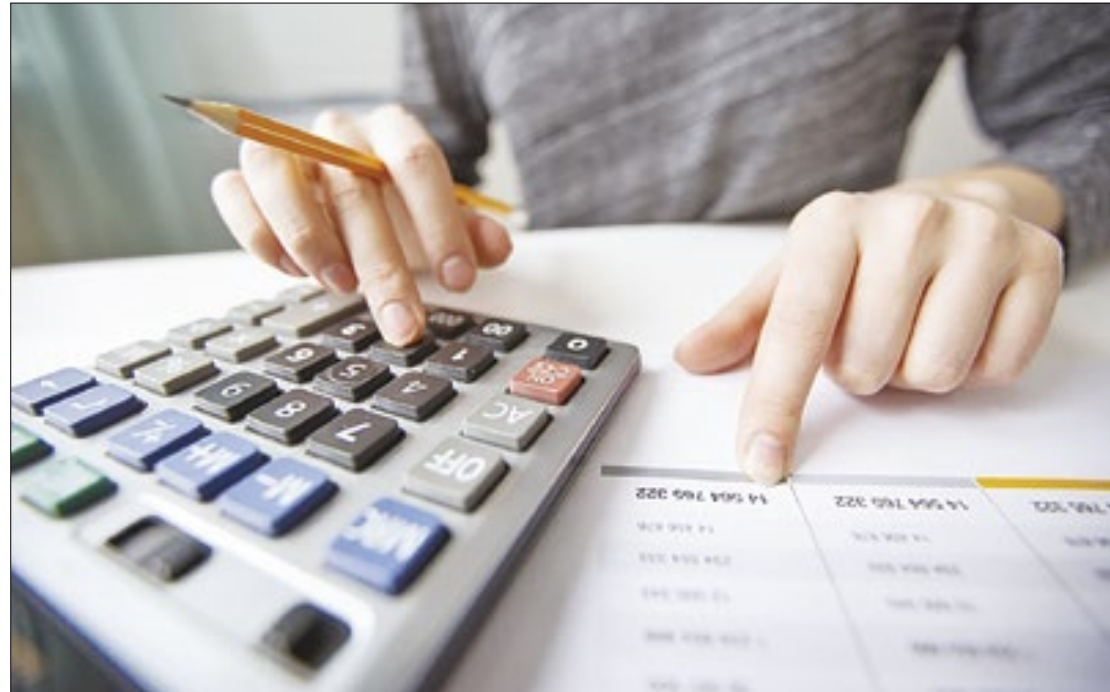
Especialistas explicam as ações para evitar fraudes com o seu cartão

Os consumidores que foram vítimas de fraudes com máquinas de cartão de crédito têm uma série de direitos que devem ser assegurados. “Primeiramente, é fundamental que o consumidor entre em