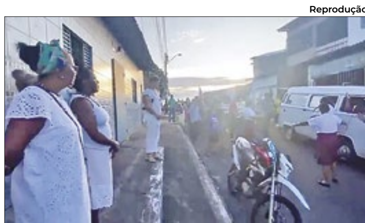
Líderes realizaram um culto em frente a um terreiro em MA

A equipe desenvolveu gráficos que mostram a quantidade de acessos aos livros por turma e relatórios enviados aos alunos a cada empréstimo.