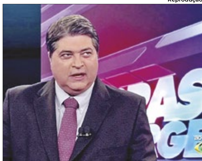
Se desta vez for até o fim, para onde irá Datena?