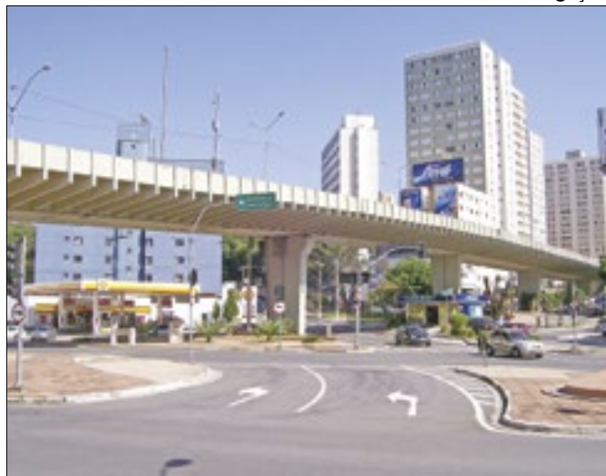
Novo viaduto Roza Cabinda é inaugurado