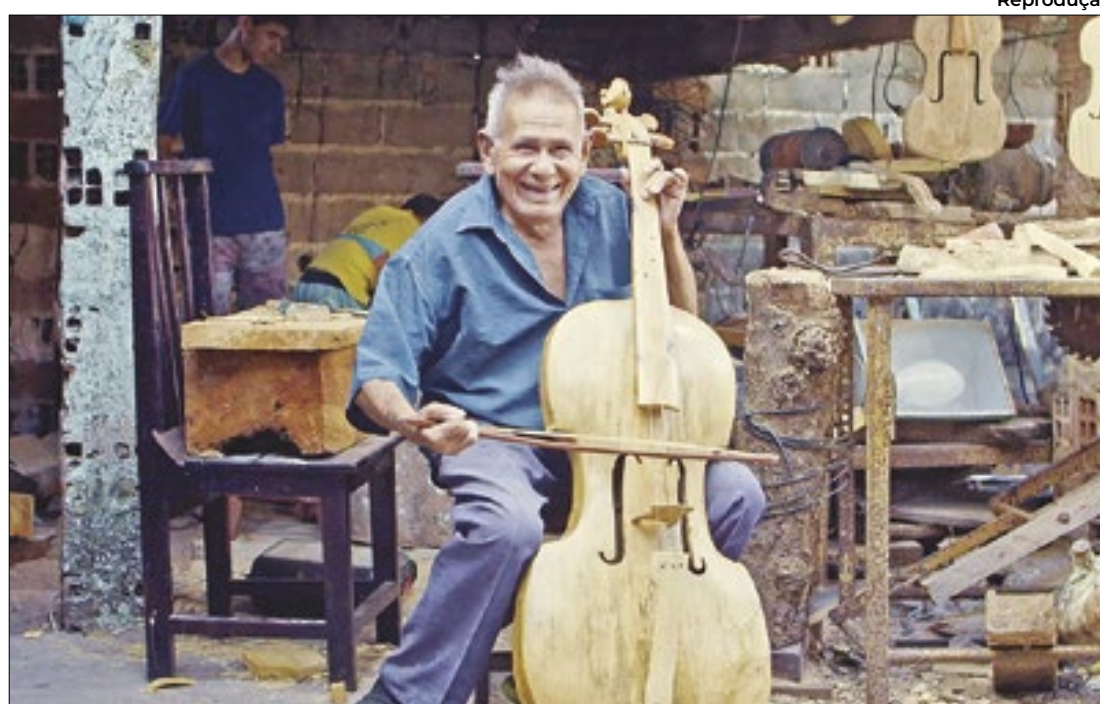
PL reconhece acervo artesanal e musical do músico como patrimônio cultural de Alagoas

Governo de Alagoas sanciona lei que reconhece legado do músico