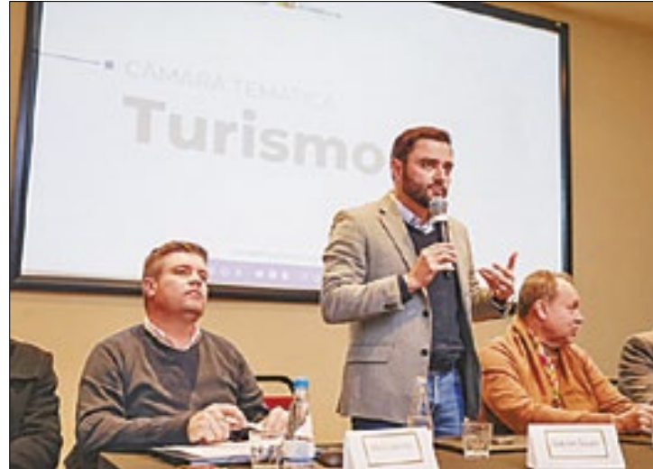
Conselho do Plano Rio Grande ouviu demandas regionais