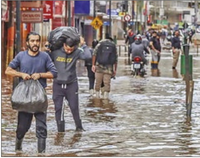
Vítimas das chuvas, 34 pessoas seguem desaparecidas