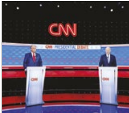
Jornal quer que democrata desista

O jornal americano The New York Times, um dos mais importantes e influentes do país, pediu em editorial na última sexta que o presidente dos EUA, Joe Biden,