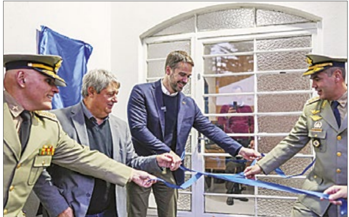
As duas novas unidades fortalecem uma atuação mais estratégica

“Reforçamos a integração e a sinergia entre as forças policiais. Tivemos uma forte redução dos indicadores de criminalidade nos últimos anos. O ano passado foi o mais seguro da série histórica