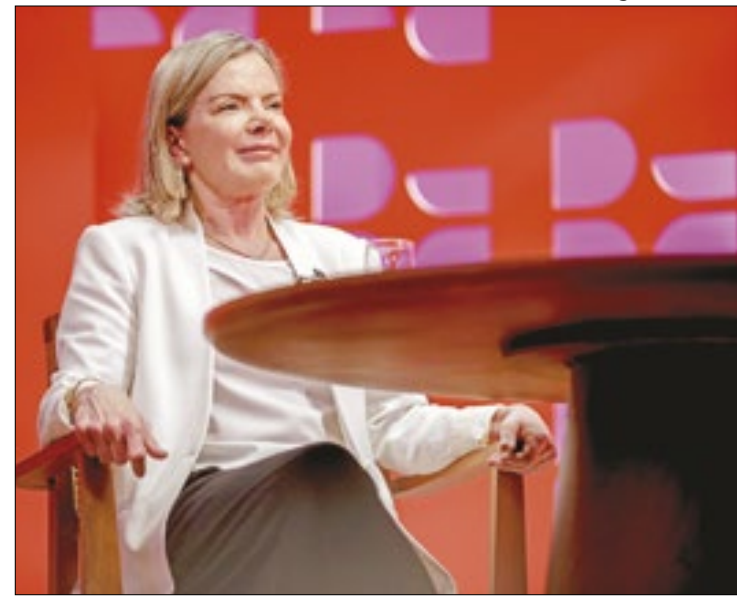
PT de Gleisi Hoffmann é o partido com mais "cabeças"