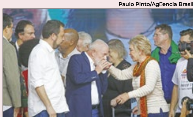
Racha da direita em São Paulo pode ajudar Lula

Ainda que haja divergências entre esses números e os mostrados um pouco antes em pesquisas do Datafolha e Paraná, há um claro fator repetido em todas elas. Datena e o candidato do PRTB, Pablo Marçal, tiram votos de Ricardo Nunes. Provocam uma divisão à direita.