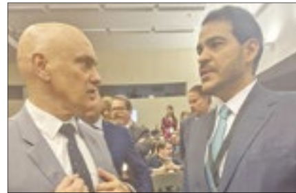
Esta foto marca uma rápida conversa entre o ministro Alexandre de Moraes, do STF, e Jorge Messias, da AGU, citado por alguns advogados como potencial nome para o Supremo