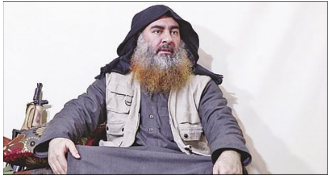
Coalizão internacional freou avanços do EI; Abu Bakr al-Baghdadi foi morto em 2019

Dez anos depois, o EI está enfraquecido, mas não aniquilado.