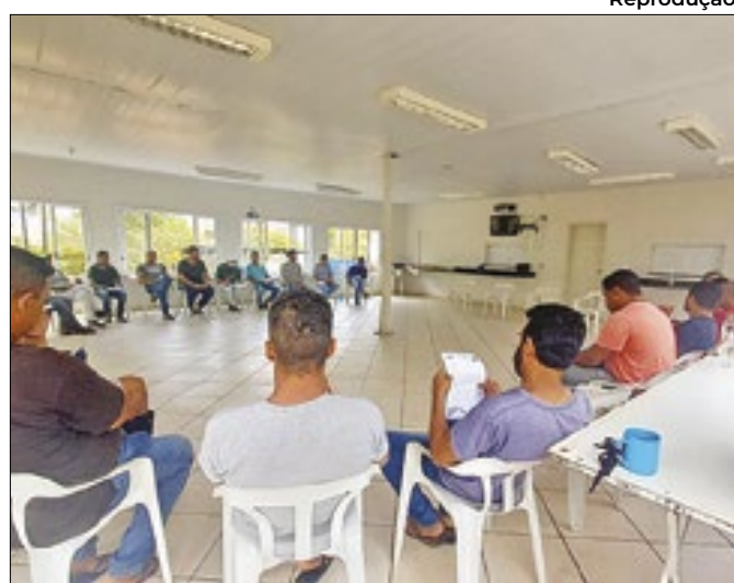
Ferramenta ficará disponível para pesquisa