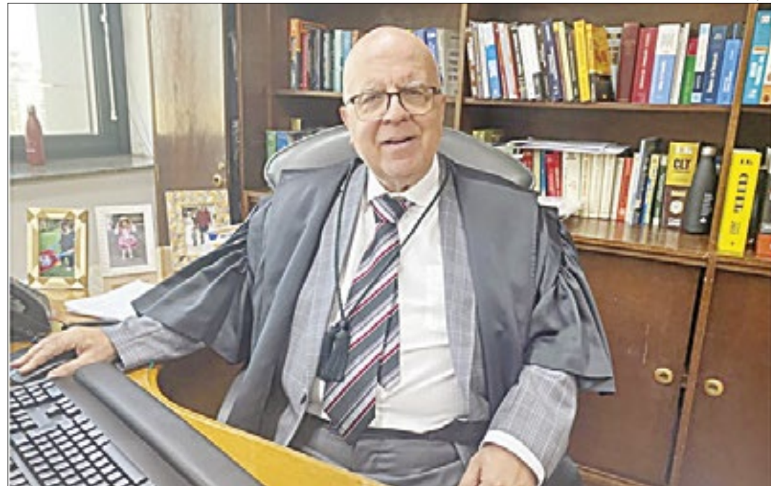
Desembargador Marcelo Freire Gonçalves está à frente do CEJUSC Coletivo

O piso nacional da enfermagem foi estabelecido pela Lei no. 14.434/2022 e traz um valor mínimo único em todo o país para enfermeiros, técnicos em enfermagem, auxiliares de enfermagem e parteiras.