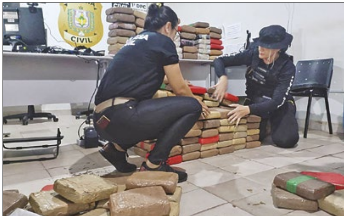
PC comanda operação conjunta para combater tráfico

Ele acrescentou que o grupo operava há aproximadamente três anos, enviando meio tone-