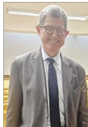
O economista Joaquim Levy, ex-ministro do governo Dilma, prestigiou o evento