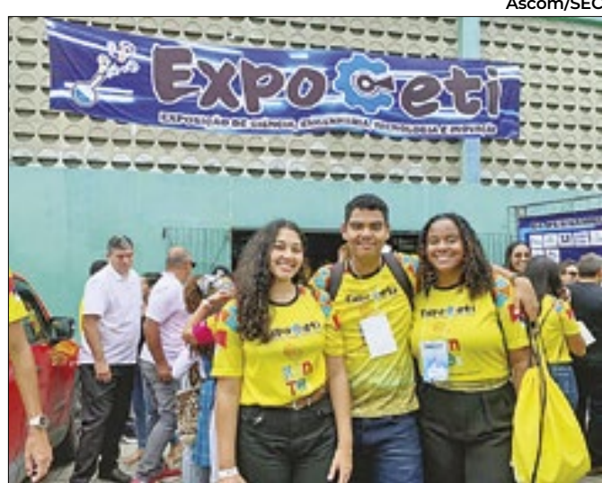
Estudantes criam alternativa sustentável para o papel