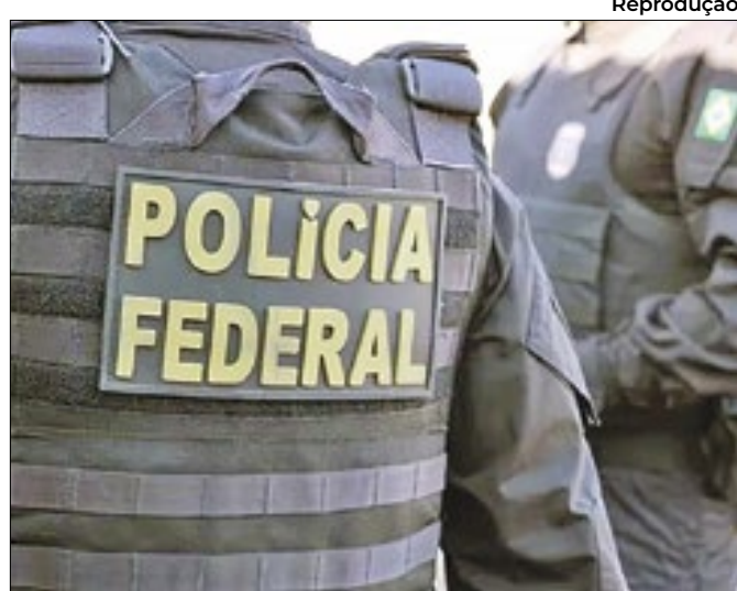
PF deflagra a Operação Obscene em RO