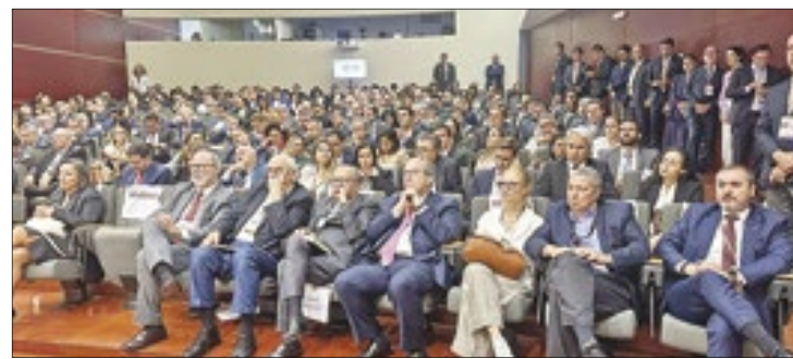
Plateia de ministros e autoridades, no prestigiado painel Jurisdição Constitucional e separação dos poderes