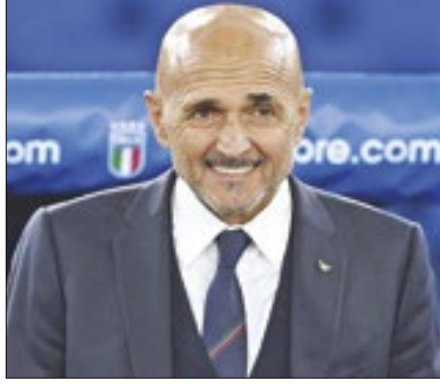
Spalletti segue à frente da Itália

Luciano Spalletti, técnico da seleção italiana, será mantido no cargo mesmo após a eliminação da Azzurra nas oitavas de final da Eurocopa pela Suíça. A informação foi confirmada pelo presidente da Federação Italiana de Futebol, Gabriele Gravina, durante entrevista coletiva. Spalletti deverá permanecer até 2026, ano em que acaba seu contrato. A prioridade é classificar para o Mundial de 2026.