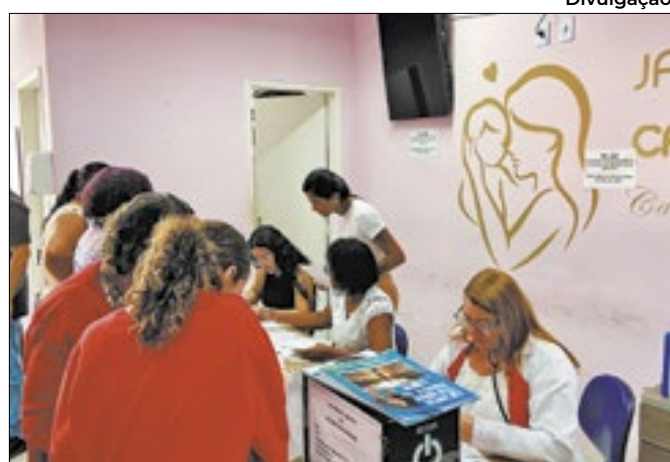
Iniciativa oferece atendimentos médicos gratuitos