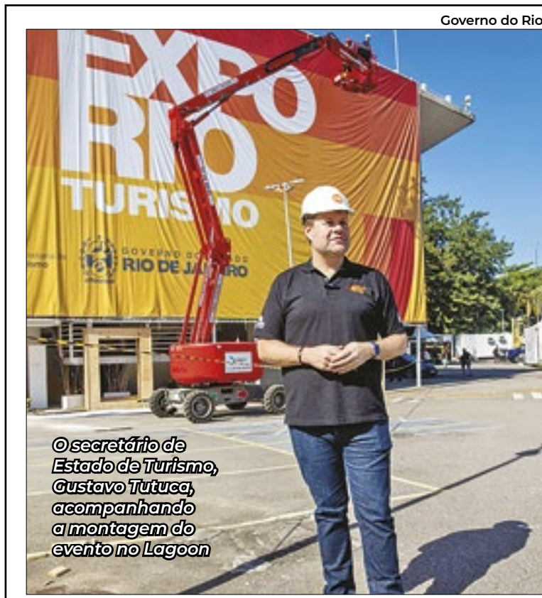
©secretário de Estado de Turismo, Gustavo Tutuca, acompanhando a montagem do evento no Lagoon