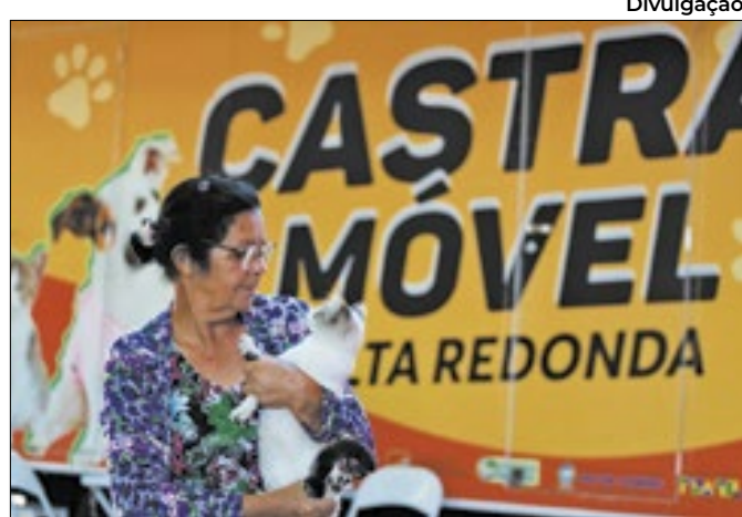
Cães e gatos de até 20 quilos podem ser castrados