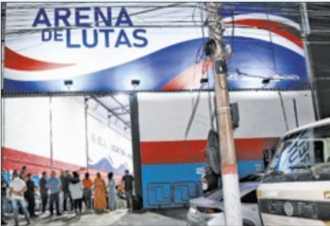
Boxe, kickboxing, judô, jiu-jitsu são uma das modalidades