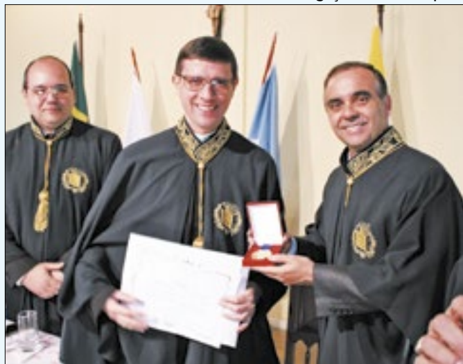
Cerimônia de posse aconteceu na última quinta