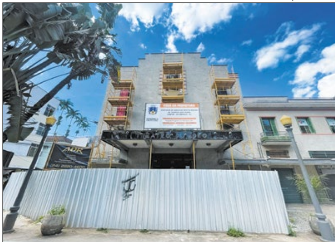
Principal teatro de Petrópolis está fechado há cerca de quatro anos para reforma

Fechado há cerca de 4 anos, a reabertura do Theatro Dom Pedro II em Petrópolis continua uma incógnita. Segundo a placa, que contém as informações e prazos sobre o projeto de revitalização, instalada na frente do prédio, as obras deverão ser entregues até 23 de julho deste ano, porém o andamento delas é o que preocupa a classe artística petropolitana. Em uma reunião realizada no início do mês, no Conselho Municipal de Cultura (CMC), o futuro do teatro municipal foi discutido após o grupo de trabalho e acompanhamento das obras, formada por conselheiros e membros da sociedade civil no CMC, apresentar um relatório onde questionam as condições de acessibilidade, previsão de abertura dentre outras questões. Referente a entrega, a administração informou que não há previsão.