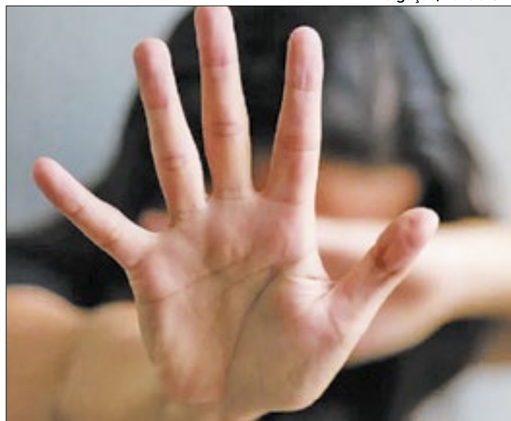
Escalada da violência contra a mulher preocupa

Esses números crescem a cada dia em todo o Brasil, de acordo com o levantamento do Fórum Nacional de Segurança Pública, também em 2022, 245.713 mulheres foram