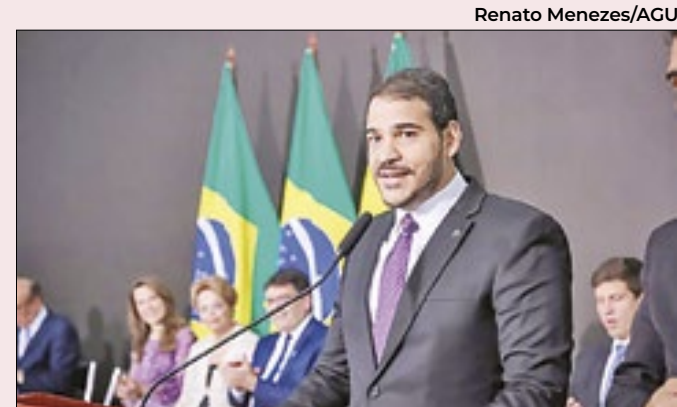
Jorge Messias, advogado-geral da União, contesta lei