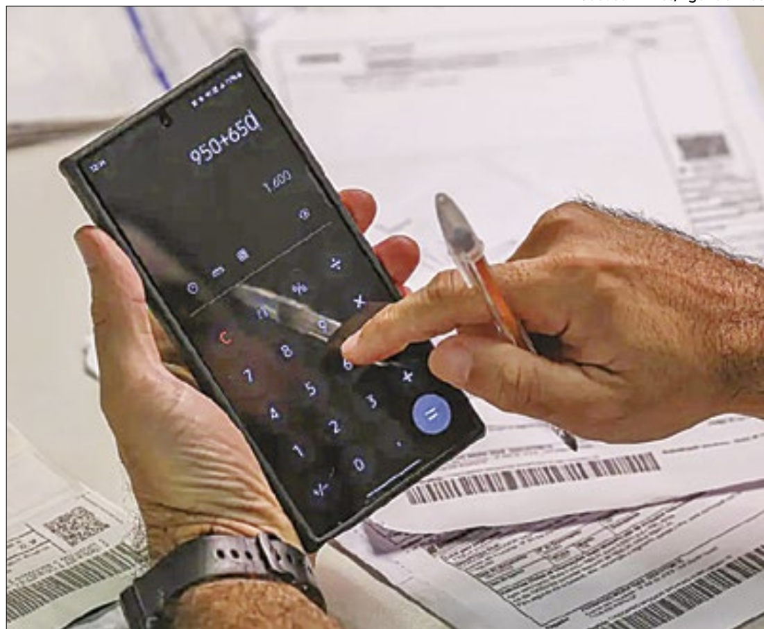
Somente em SP, 4 milhões de pessoas poderão ser beneficiadas

“Caberá também ao credor enviar as informações da dívida e os dados do devedor ao cartório de protesto, com elementos que permitam a identificação e localização do devedor para convite eletrônico para a efetivação da proposta de solução negociada prévia ao protesto, assim como seus dados bancários e prazo a ser concedido ao devedor para o direito de resposta a partir da data de sua intimação – observado o limite de 30 dias”, explicou o Ieptb/SP.