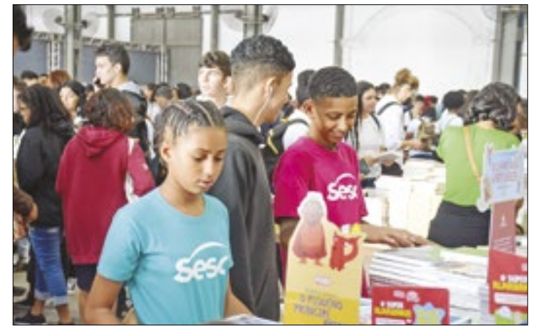
O público poderá consultar o acervo de 3 mil títulos