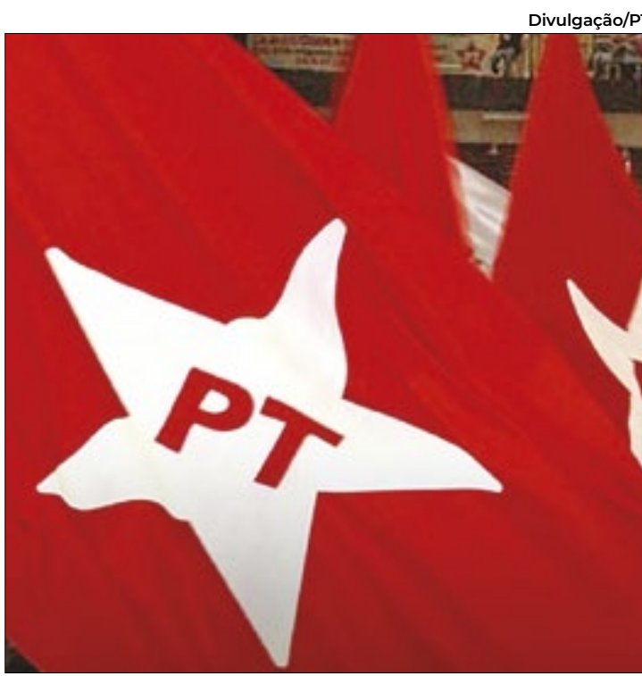
Alas do PT brigam por divisão do fundo eleitoral