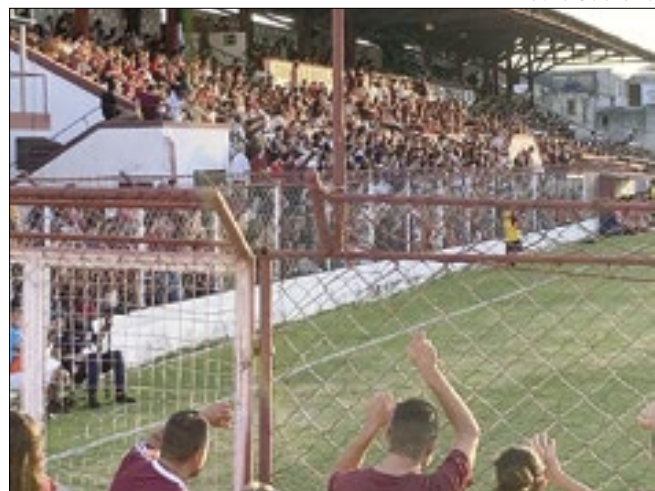
Torcedores elogiam e criticam jogadores de pertinho