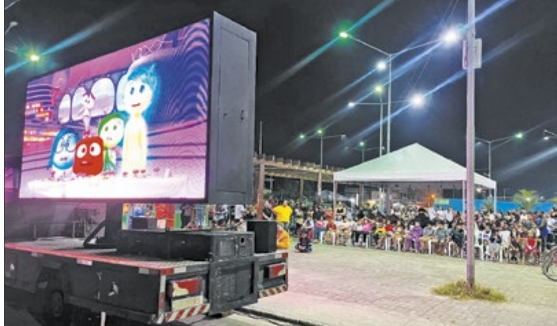
Evento foi realizado na Praça do Skate, no bairro Nova Belém, no município de Japeri

"É muito importante ações como essas para que cada vez mais as pessoas tenham acesso à diversão e cultura. Numa exibição des-