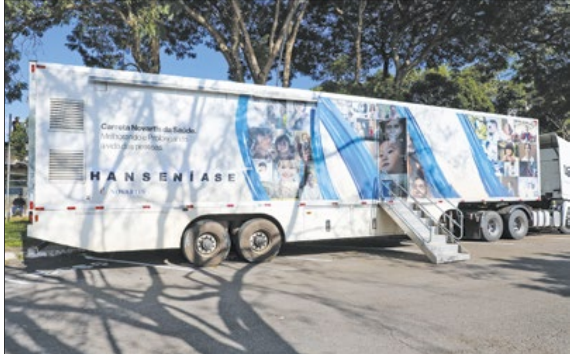
Projeto é do Ministério da Saúde, em conjunto com as secretarias estaduais e municipais