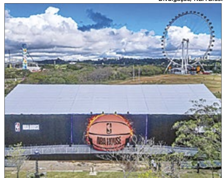
Evento reuniu fãs de basquete de todas as idades em SP

O troféu Larry O’Brien também marcou presença, assim como equipes oficiais de dança das equipes, e atrações musicais. Os fãs também puderam jogar basquete e participar de atividades valendo brindes oficiais. É um evento incrível que seria muito bem-vindo no Rio de Janeiro na próxima temporada.