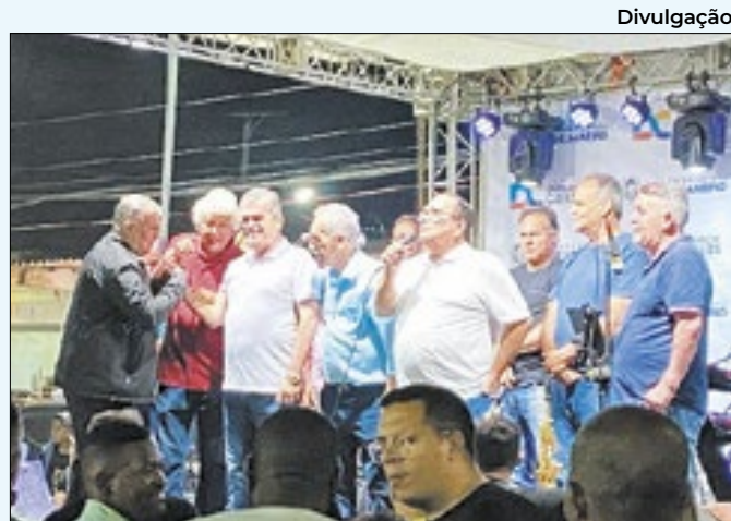
Prefeitura e Estado construíram nova área de lazer

Centros de Especialidades e na Casa da Mulher do município de Japeri. Para ter acesso aos serviços, basta se dirigir ao local com documentos de identificação e cartão do SUS. Vale lembrar que os atendimentos funcionam das 8h às 13h.