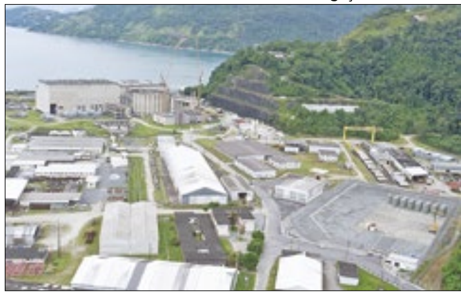
Concurso foi o último antes da privatização da usina