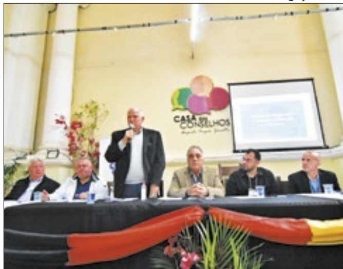
Prefeito de Petrópolis faz apelo durante 11ª ComCidade