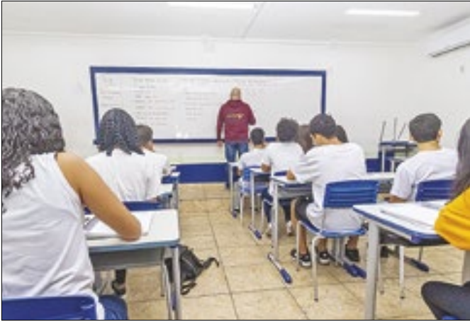
Reforço na sala de aula começará a partir do 2º semestre