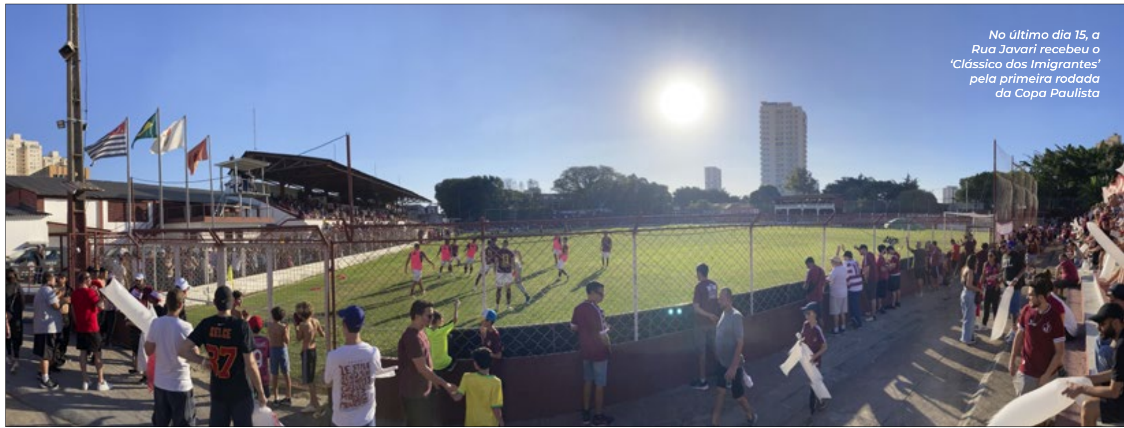
No último dia 15, a Rua Javari recebeu o 'Clássico dos Imigrantes' pela primeira rodada da Copa Paulista