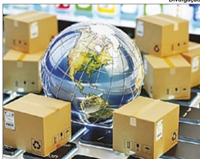
Divulgação Receita alerta para golpes utilizando o nome do Fisco