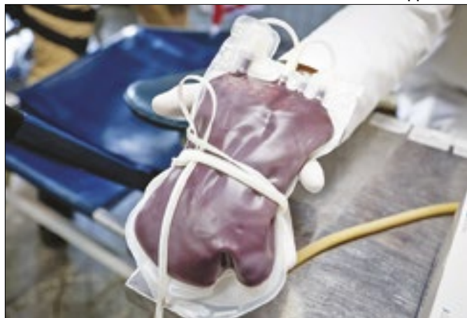
Campanha do Salgado Filho visa abastecer o Hemório