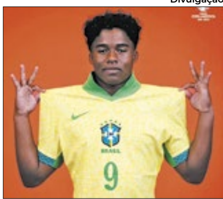
Geração brasileira é promissora