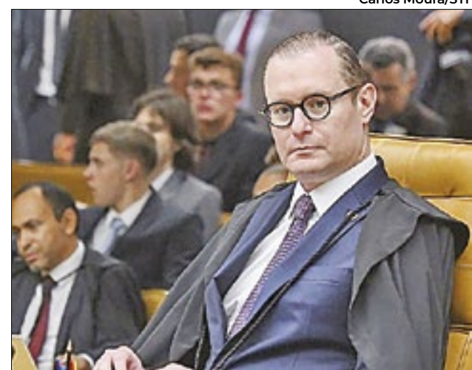
Ministro se manifestou depois de quase onze meses