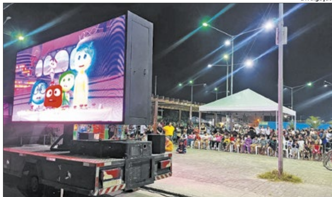
Evento foi realizado na Praça do Skate, no bairro Nova Belém, no município de Japeri

"É muito importante ações como essas para que cada vez mais as pessoas tenham acesso à diversão e cultura. Numa exibição des-