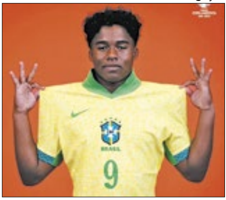
Geração brasileira é promissora