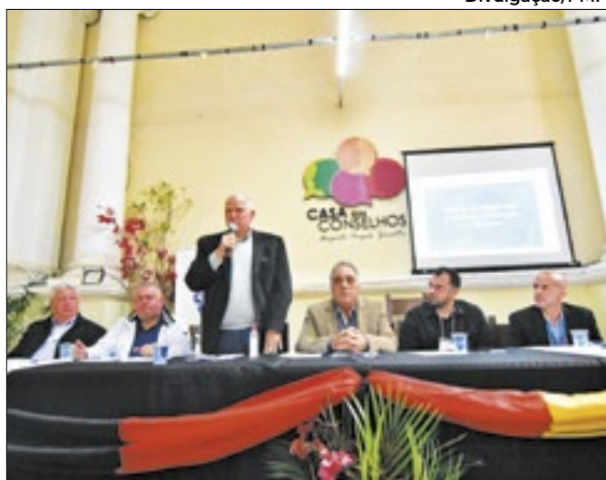
Prefeito de Petrópolis faz apelo durante 11ª ComCidade