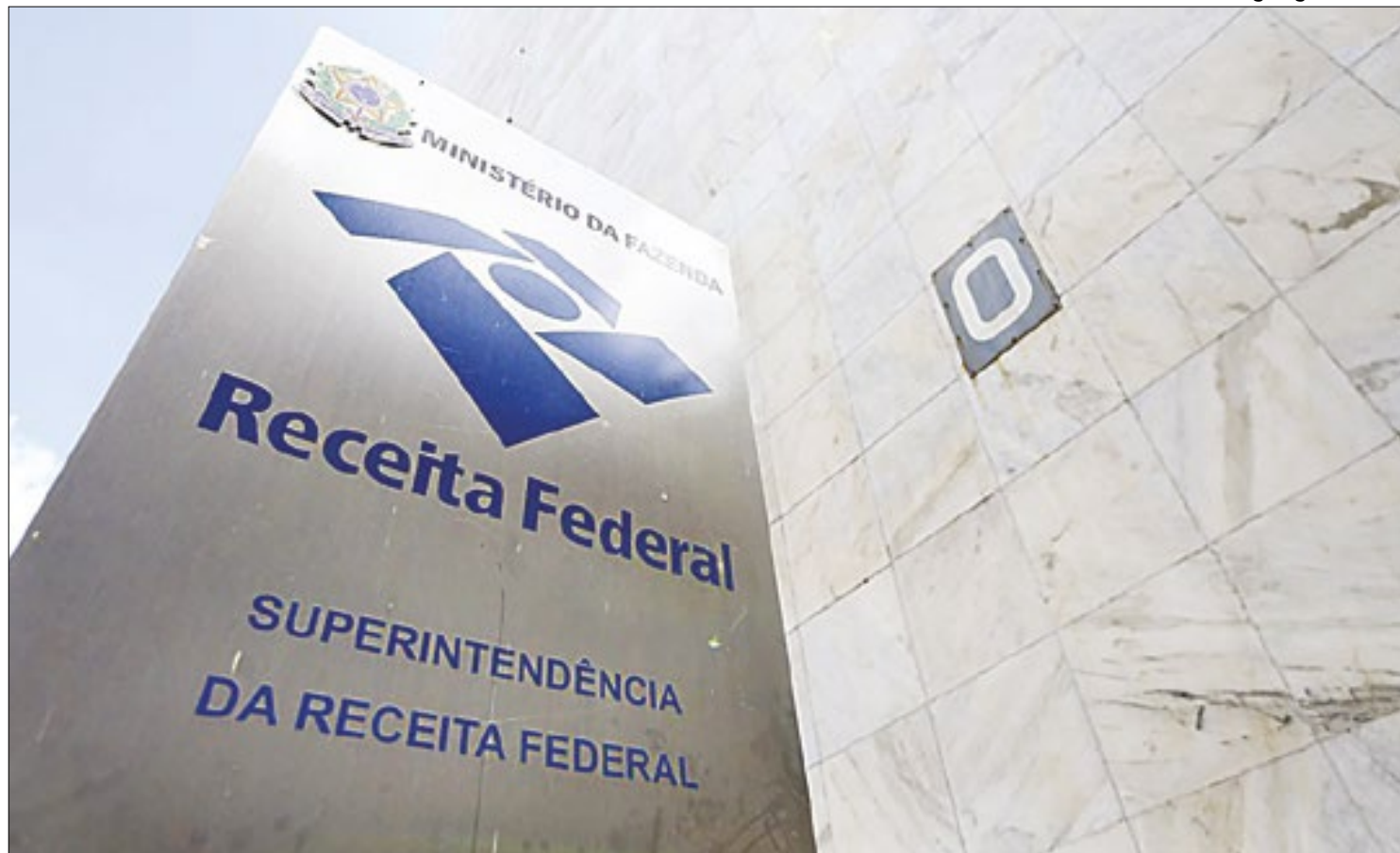
Seminário deve contar com a presença do secretário da Receita Federal, Robinson Barreirinhas

evento (28) contará com duas mesas redondas. Uma, pela manhã, sobre as “Perspectivas e desafios para o financiamento da Seguridade Social no