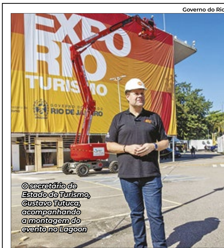
©secretário de Estado de Turismo, Gustavo Tutuca, acompanhando a montagem do evento no Lagoon