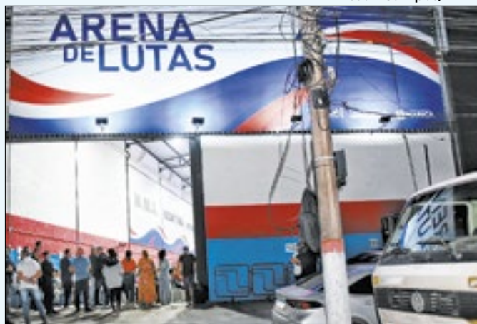
Boxe, kickboxing, judô, jiu-jitsu são uma das modalidades