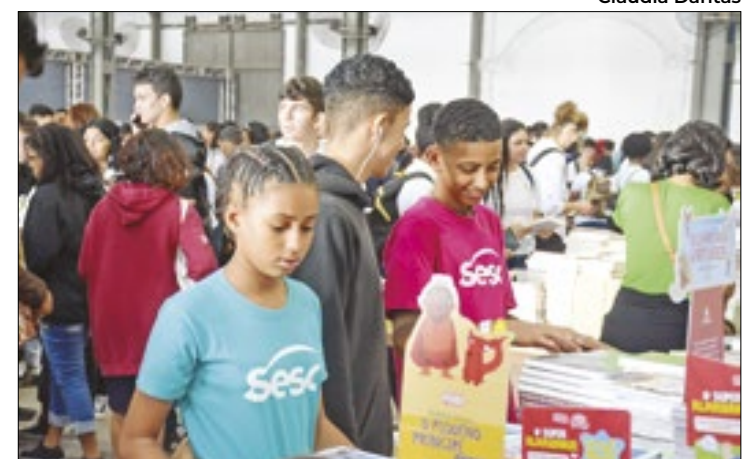
O público poderá consultar o acervo de 3 mil títulos