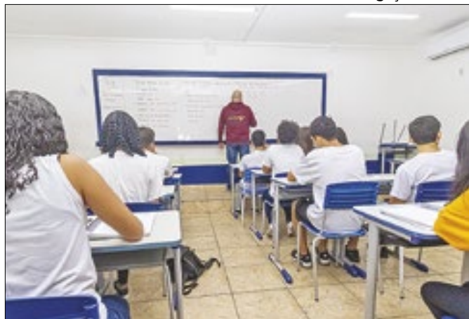
Reforço na sala de aula começará a partir do 2º semestre