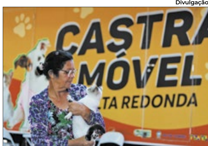
Cães e gatos de até 20 quilos podem ser castrados