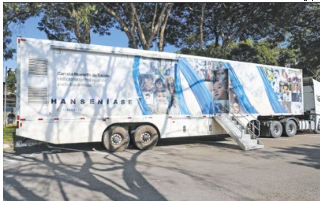
Projeto é do Ministério da Saúde, em conjunto com as secretarias estaduais e municipais