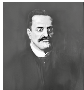
Barão de Rio Negro