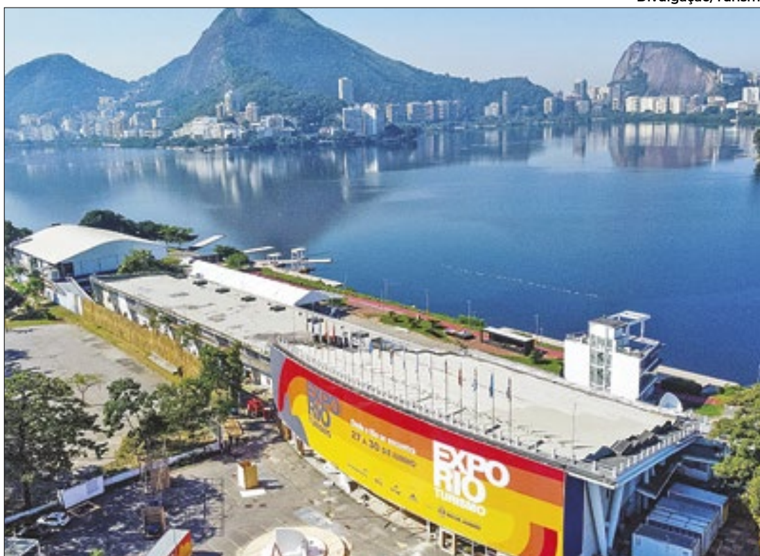
3ª edição da ExpoRio Turismo vai reunir os principais players da cadeia produtiva do segmento