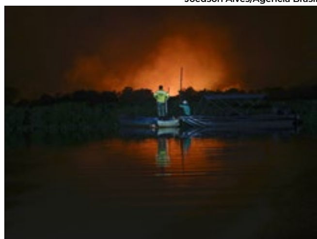
Situação no bioma está pior do que no ano passado