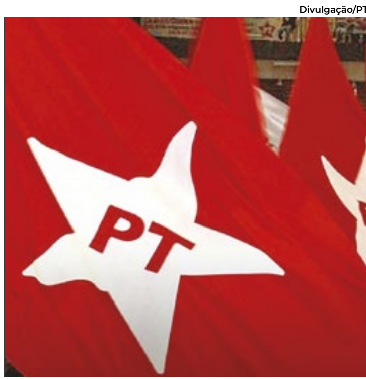
Alas do PT brigam por divisão do fundo eleitoral