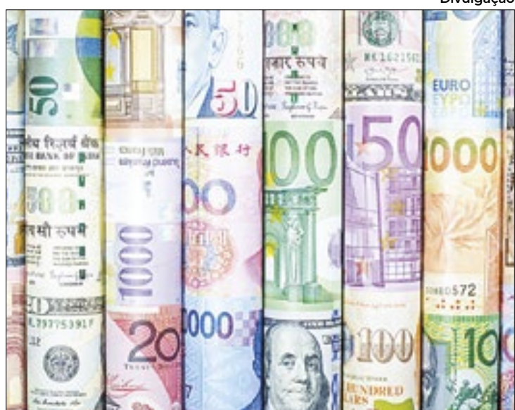
Balanço de pagamento inverte viés e fica deficitário

Já nos 12 meses, encerrados em maio deste ano, o déficit em transações correntes chegou a US$ 40,1 bilhões (1,79% do PIB), pouco acima dos US$ 35,7 bilhões (1,60% do PIB), de abril, mas bem abaixo dos