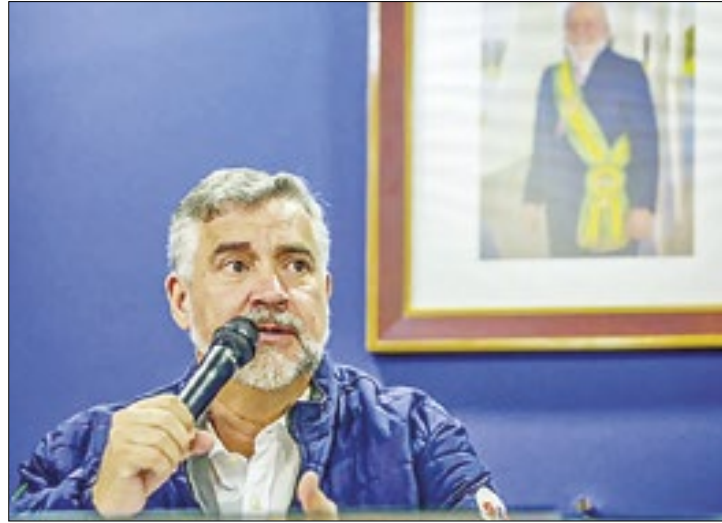
Sistema permite acompanhar recursos em tempo real

No portal, será possível acompanhar os investimentos, transferências de recursos e créditos disponibilizados pelo governo federal ao estado, municípios, empresários e população afetada pelas enchentes e chuvas. Segundo Paulo Pimenta, o objetivo principal é garantir a transparência das informações, permitindo que imprensa, lideranças e população possam monitorar todas as ações do governo. "Criamos este sistema para assegurar a mais absoluta