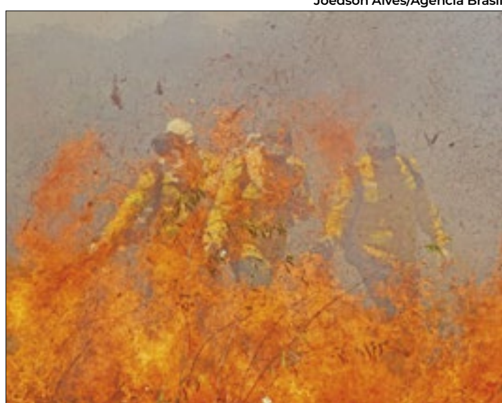
Greve não vale para casos de incêndios e desastres

A demanda pela valorização dos profissionais de Ministério do Meio Ambiente, Ibama, Serviço Florestal e ICMBio (Instituto Chico Mendes de