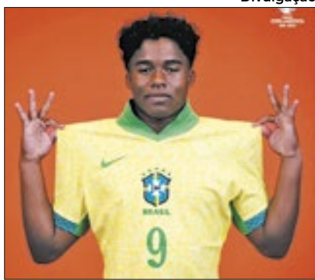
Geração brasileira é promissora

De olho na sequência da temporada, o Flamengo discute a vinda do meia Marcos Antônio, da Lazio. A diretoria enviou proposta de empréstimo com opção de compra, mas não agradou os italianos.