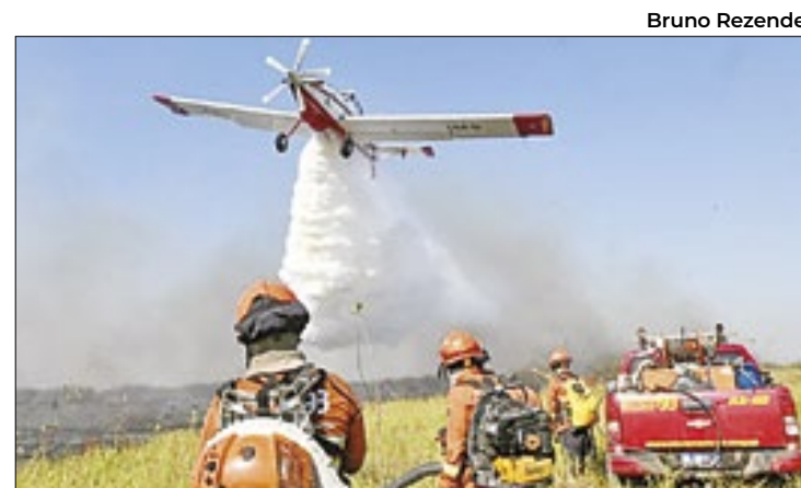
Combate aéreo ao fogo no Pantanal

Ibaneis Rocha criticou na semana passada as críticas da oposição ao projeto, cuja aprovação considerou "histórica". O Psol anunciou que ingressará com uma ação judicial contra o PPCUB.