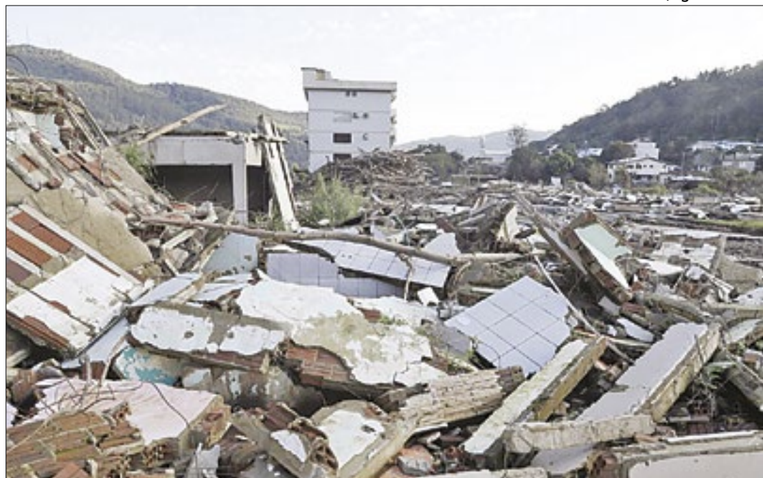
Muçum enfrenta incerteza econômica, desemprego e êxodo populacional após enchentes

dade, antes considerada segura, agora é vista como área de risco em praticamente toda a sua extensão urbana. A evasão populacional preocupa, e uma resposta rápida é necessária para evitar uma diminuição significativa da população e dos empreendimentos locais. A prefeitura havia reconstruído um muro de proteção na sede municipal dez dias antes da enchente de maio, mas a estrutura foi novamente destruída.