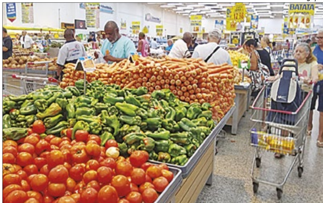
Enquanto índice oficial de inflação se mantém em trajetória ascendente, Selic deixou de cair

'Hesitante', a previsão para o PIB em 2024 retornou aos 2,09% anteriores, após cair,