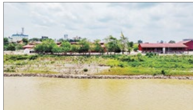
Rio Madeira entra em cota de alerta