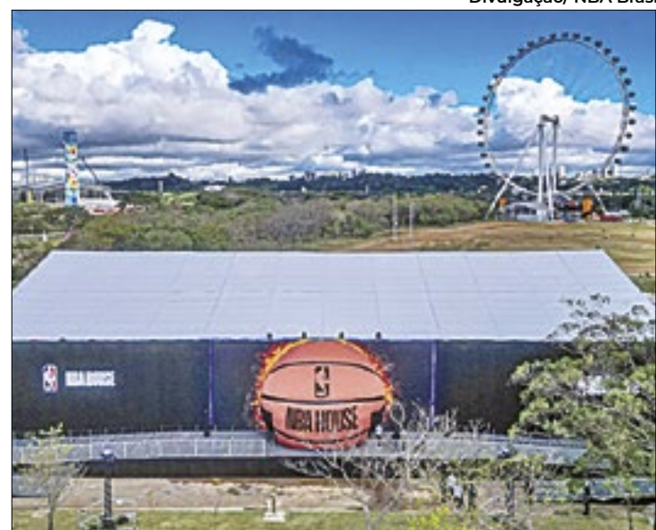
Evento reuniu fãs de basquete de todas as idades em SP

O troféu Larry O’Brien também marcou presença, assim como equipes oficiais de dança das equipes, e atrações musicais. Os fãs também puderam jogar basquete e participar de atividades valendo brindes oficiais. É um evento incrível que seria muito bem-vindo no Rio de Janeiro na próxima temporada.