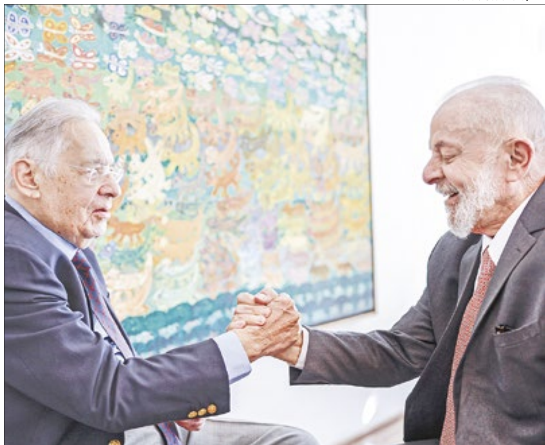
Lula e FHC: gesto democrático contra o radicalismo

“Desde que tomou posse pela terceira vez, o presidente tenta trazer a direita tradicional para apoiá-lo no Congresso, onde ele enfrenta diversas