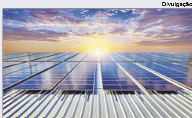
Usinas solares batem marca de 14 gigawatts de potência

Para que tais golpes sejam evitados, a Receita recomenda: rejeite ligações/mensagens de cobrança de valores para liberação de mercadorias, assim descarte qualquer e-mail sem o seu endereço '@rfb.gov.br', recebido por WhatsApp, SMS ou por sites estranhos.