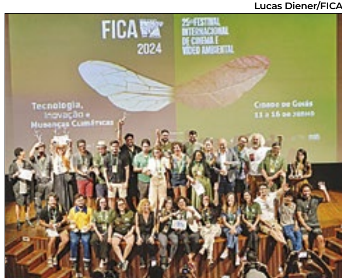
Longas e curtas foram premiadas ao longo do evento

Leila Barros convoca audiência para discutir projeto