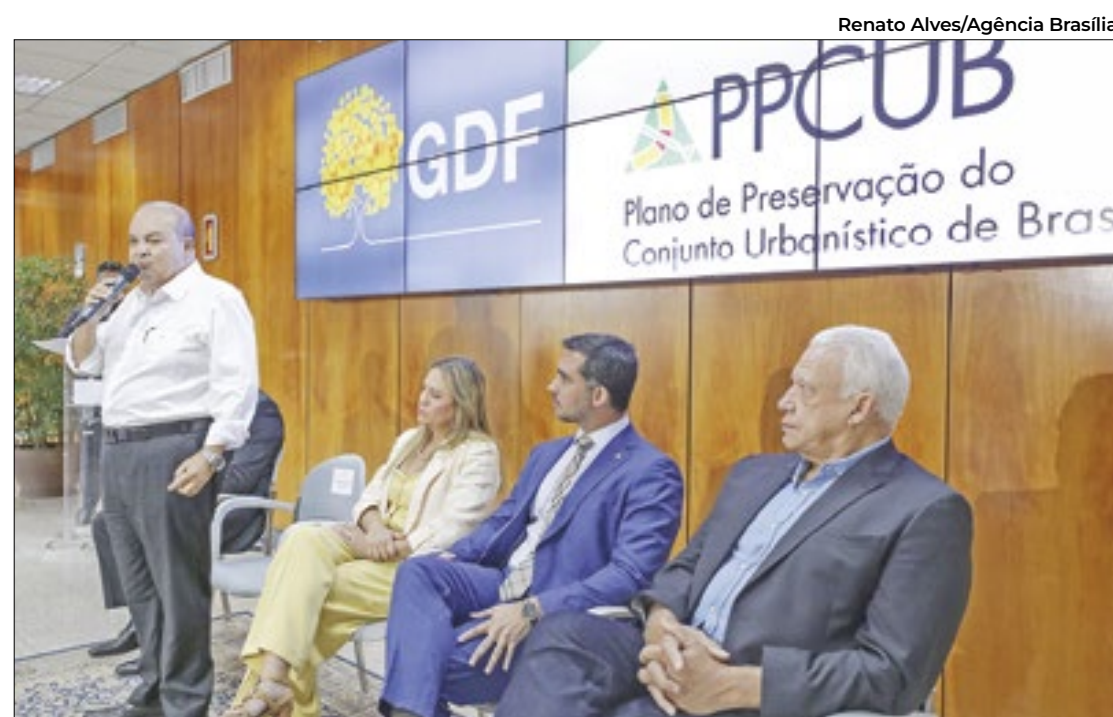
Para Ibaneis, aprovação do PPCUB é "histórica" e críticas infundadas

Nos primeiros cinco meses de 2024, a Prefeitura de Goiânia destinou mais de R$ 171 milhões para investimentos, o maior valor em uma década. Houve investimento de 160,8% a mais em infraestrutura em comparação ao ano anterior e 275% se comparado a 2022.