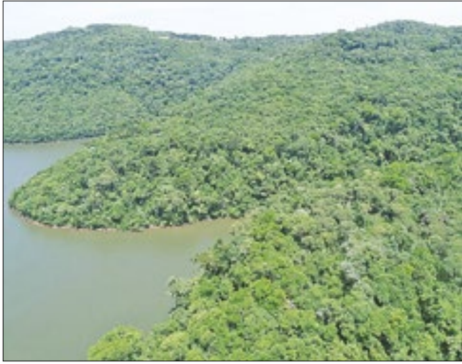
Transição energética e qualidade do ar estão nos planos