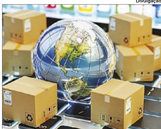
Divulgação Receita alerta para golpes utilizando o nome do Fisco