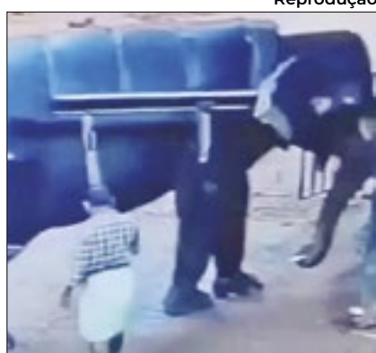
Treinador foi pisoteado por elefante

Está rodando pelas redes sociais o vídeo de um elefante pisoteando um homem até a morte. O caso aconteceu em um safári ilegal, na última quinta (20), na Índia.