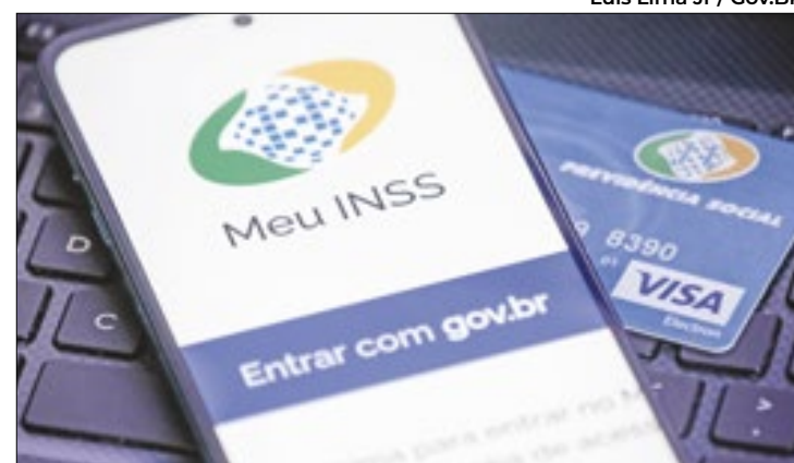
Cadastro de pensionistas teve segurança reforçada