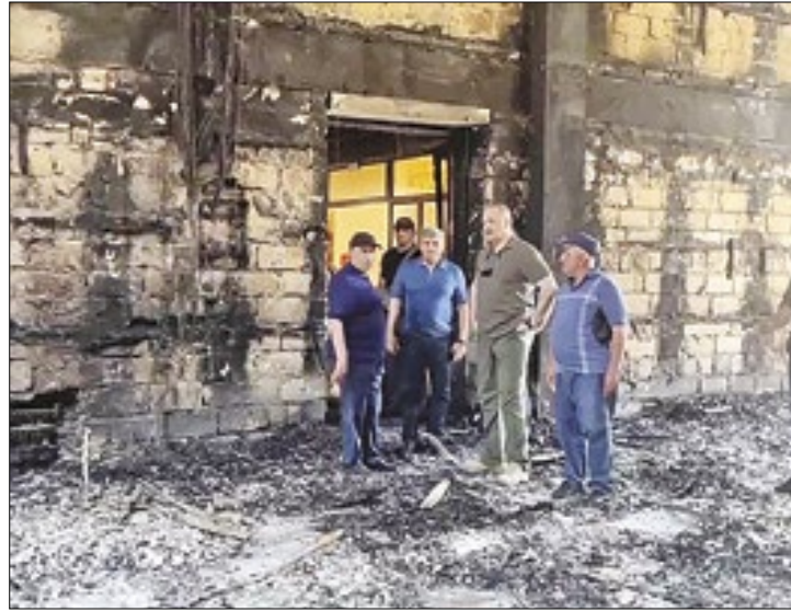
Cinco agressores também foram mortos na Rússia

Em Makhachkala, a pouco mais de 120 km de Derbent, outro ataque acontecia ao mesmo tempo. Nesse município, que é a capital local da República do Daguestão, os agressores