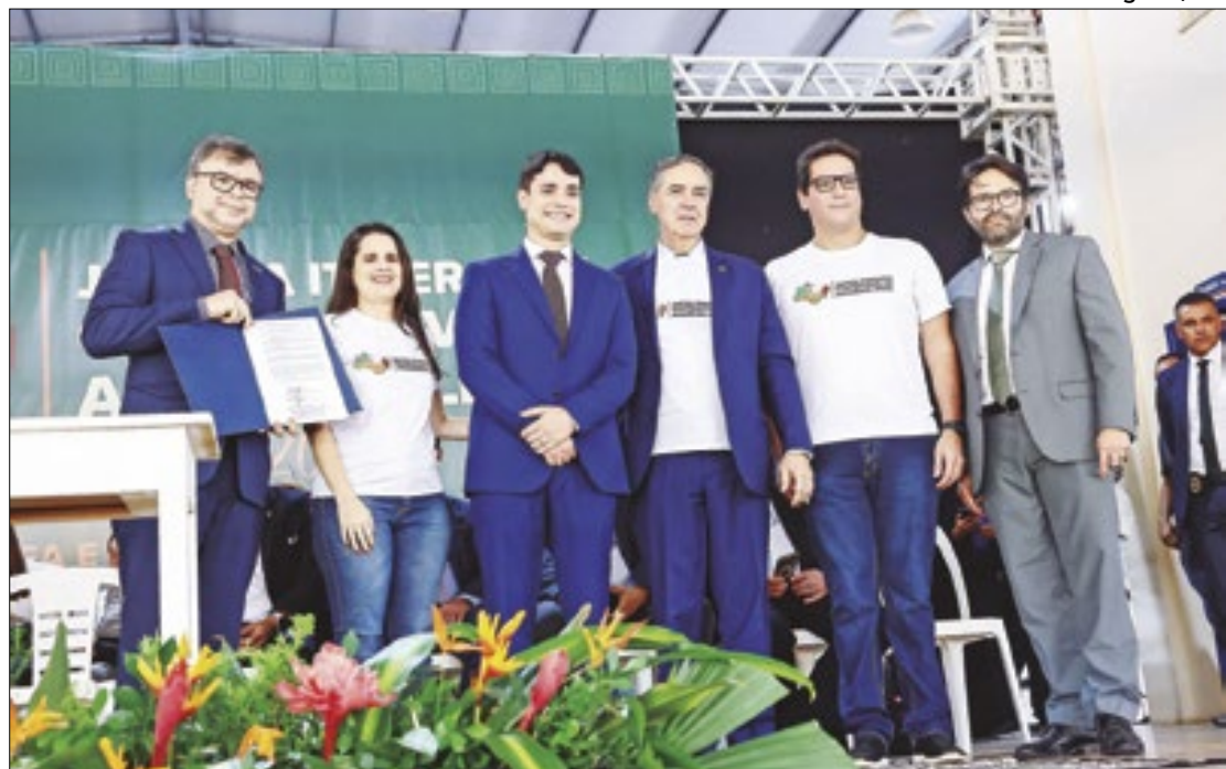
Acordo foi assinado durante a abertura do Programa Justiça Itinerante Cooperativa

O Programa Justiça Itinerante, uma iniciativa do Conselho Nacional de Justiça (CNJ) em colaboração com tribunais e órgãos públicos, ocorreu de 17 a 21 de junho em Humaitá e Lábrea. Mais de 50 instituições públicas ofereceram serviços à população local, incluindo emissão de documentos, con-