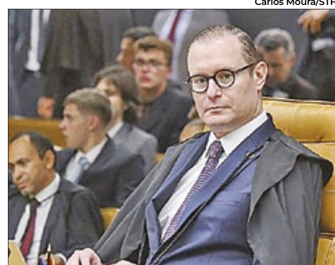
Ministro se manifestou depois de quase onze meses