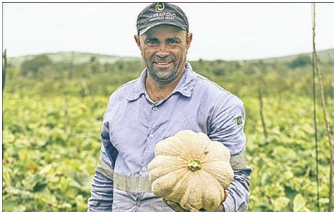
Seis perímetros em sete municípios sergipanos produzem desde quiabo a maracujá

Entre as culturas oriundas do perímetro irrigado nos municípios contemplados estão o feijão-de-corda, o milho verde, aipim, hortaliças, batata-doce,