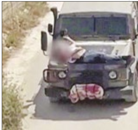
Imagem viralizou nas redes sociais

As Forças Armadas de Israel amarraram um homem palestino ferido ao capô de um jipe e o conduziram pelas ruas da cidade de Jenin, na Cisjordânia, revela