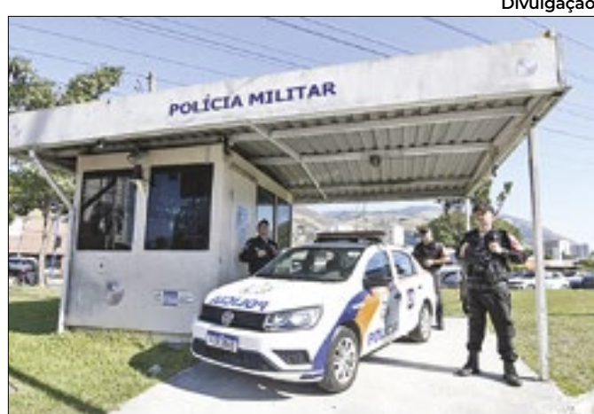
Ruas de Nova Iguaçu ganham reforço na segurança