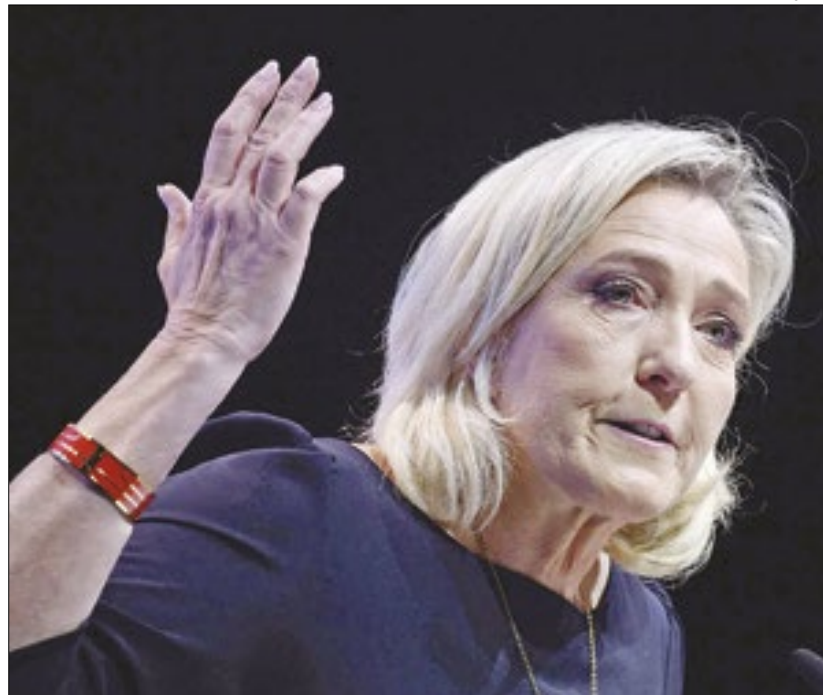
A presidente da RN, Marine Le Pen, discursa durante um evento no sul da França

O levantamento foi realizado pelo instituto Ipsos, pelo jornal Le Parisien e pela Radio France entre os dias 19 e 20, e mostrou a aliança de esquerda Nova Frente Popular