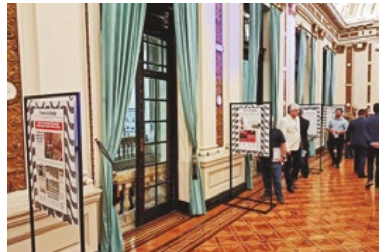
Durante a exposição, o visitante poderá conferir capas do jornal de desde a sua fundação até as dos dias atuais

A exposição é uma excelente oportunidade para os estudantes de Comunicação perceberem a importância do jornal impresso como documento instrumento histórico