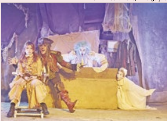
Texto mais emblemático da obra de Maria Clara Machado, o espetáculo infantil 'Pluft, o Fantasminha' volta a ser encenado no Teatro d'O Tablado numa montagem de viés contemporâneo