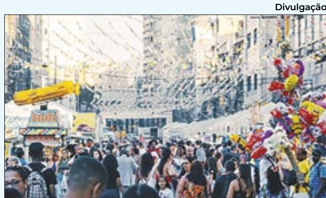
Milhares de pessoas marcaram presença na Festa

agentes do 20º BPM que ficavam nos postos, passaram a ter uma maior liberdade para atendimentos do 190. Nos próximos dias, a Companhia de Desenvolvimento de Nova Iguaçu (Codeni) vai iniciar o trabalho de reforma das cabines do município.