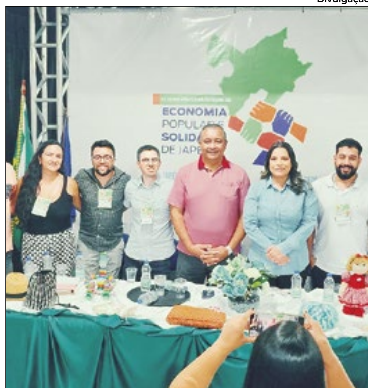
Iniciativa teve como objetivo fortalecer o empreendedorismo

Um dos palestrantes foi o pesquisador e integrante do Conselho Estadual de Economia So-