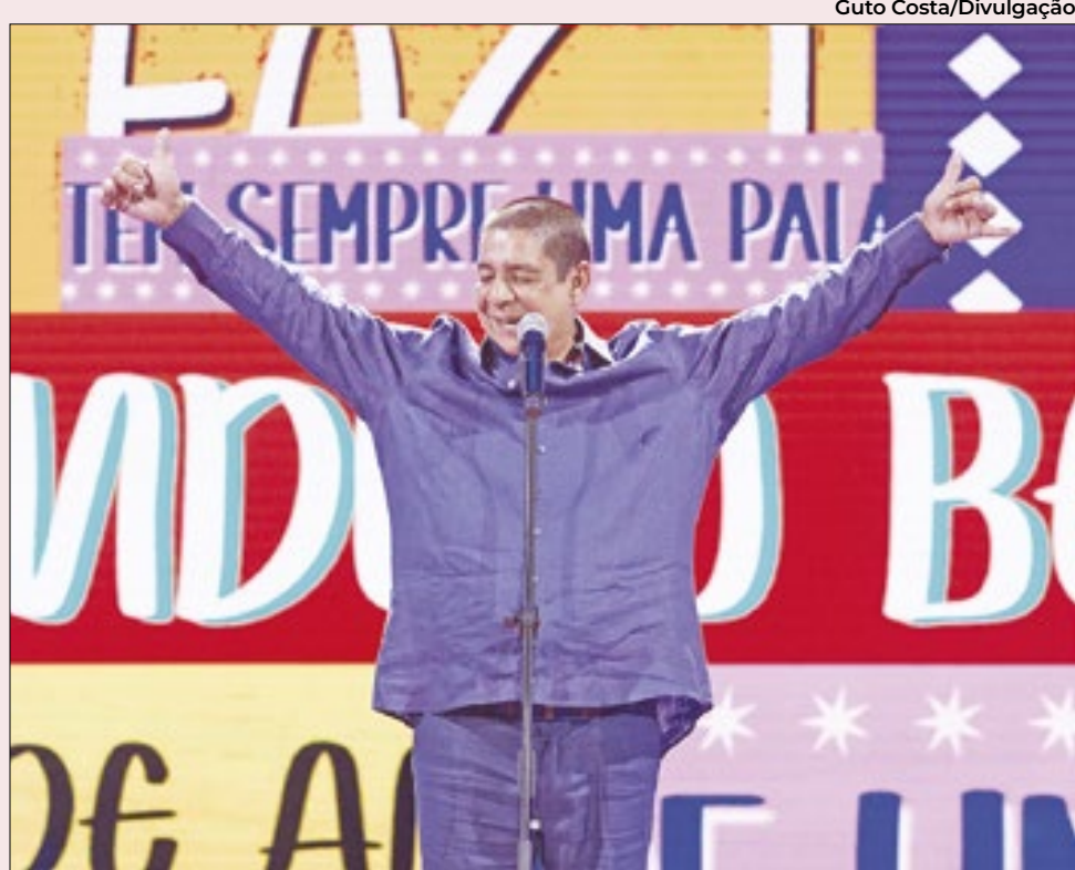
Zeca durante a gravação do CD-DVD do show de 40 anos de carreira