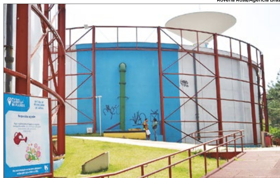
Parque da Companhia de Saneamento Básico do Estado de São Paulo

Governo paulista ficará com 18,3% dos papéis da empresa