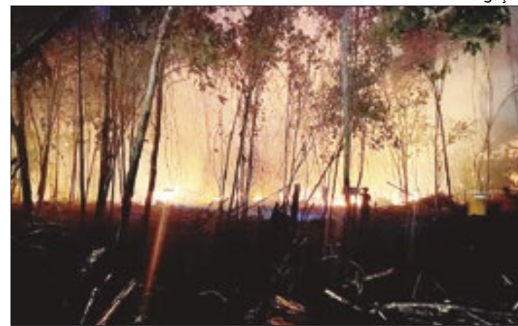
Incêndio destrói área de mata em Novo Airão