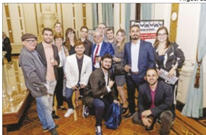
Interação entre as equipes do Correio da Manhã Rio, Correio Petropolitano, Correio Serrano, Correio Sul Fluminense e TVC, no coquetel