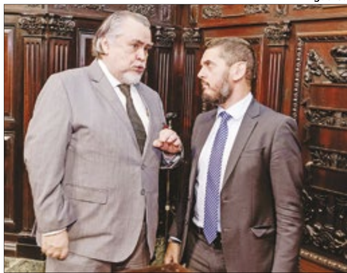
Magnavita durante conversa com o deputado e presidente da Alerj, Rodrigo Bacellar, antes de Sessão Solene no Palácio Tiradentes