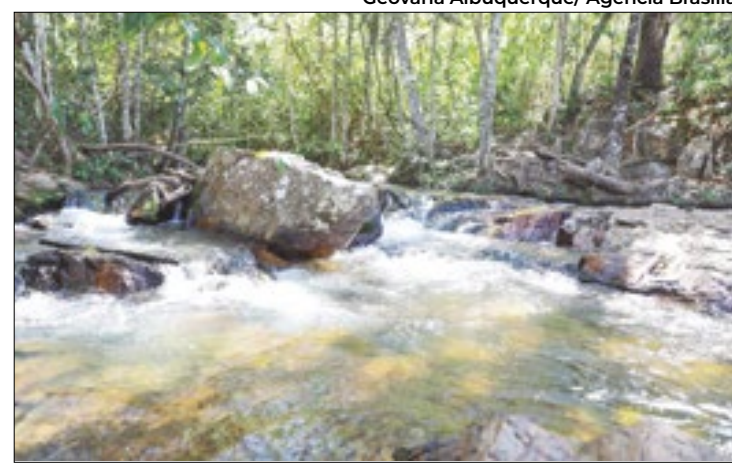
Aprovação visa dar continuidade à gestão sustentável