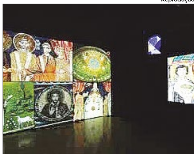
Reprodução Peças podem ser vistas até 18 de agosto