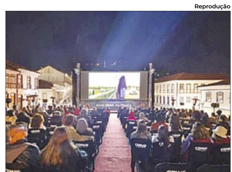
Programação da CineOP inclui 153 obras brasileiras