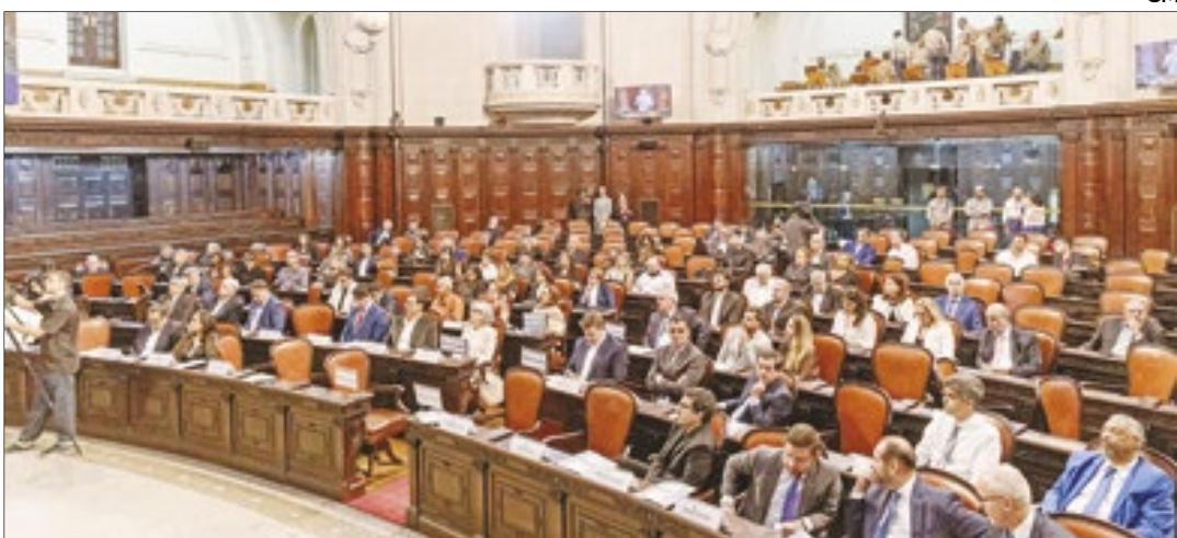
Público no Plenário Barbosa Lima Sobrinho na última quinta-feira, 20 de junho

Distrito Federal, posição que ocupa desde 1901. Como o governador Cláudio Castro afirmou: o Correio da Manhã é o veículo que defende as pautas do Rio junto ao Poder Central. Posição que o Rio perdeu com a mudança da capital. A interiorização do jornal também foi destacada na cerimônia, com suas edições regionais diárias, como ressaltou o deputado estadual Munir Neto, co-autor da homenagem.