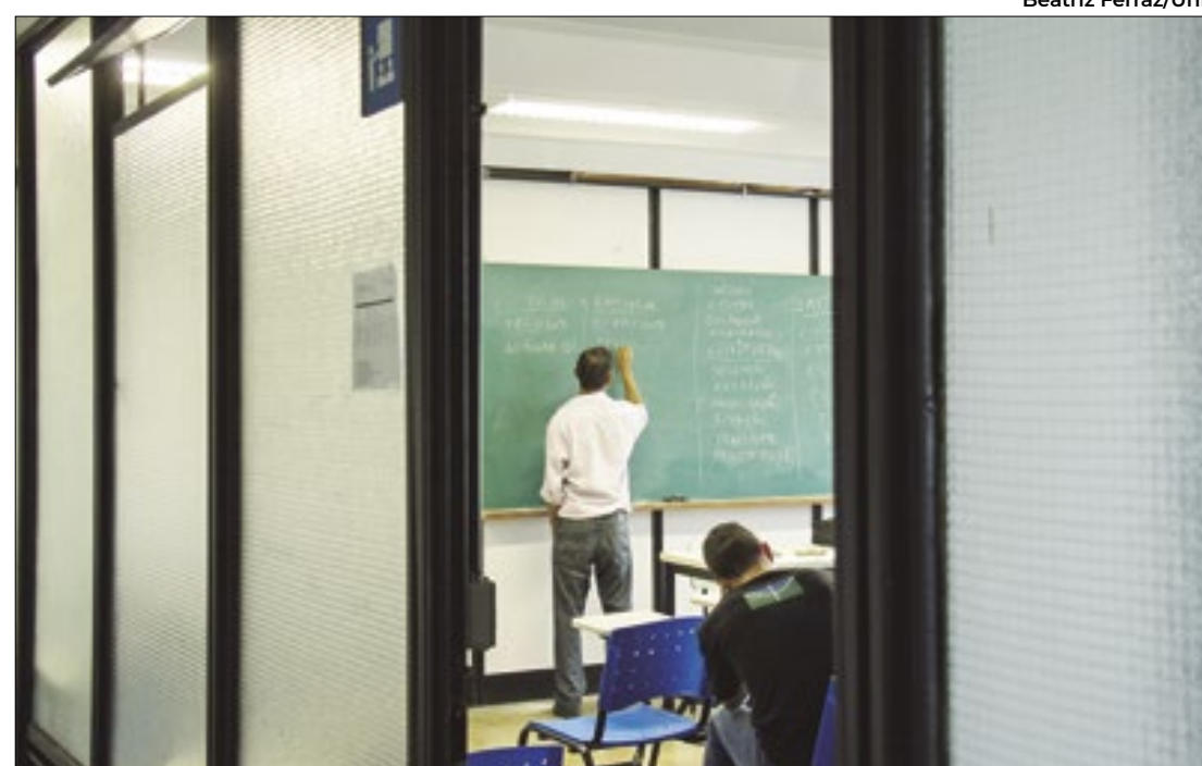
Estudantes confusos sobre como será volta às aulas e fim do semestre

O Procon Municipal de Anápolis (GO), em parceria com o Inmetro, está realizando uma operação "De Olho no Peso". O objetivo é fiscalizar as balanças de supermercados, açougues, padarias, restaurantes e outros comércios na cidade. A correta pesagem valoriza o dinheiro de ambos.