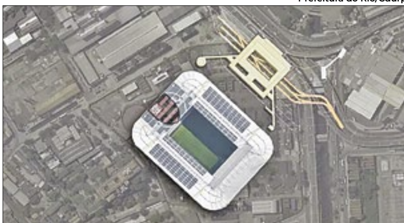
PÁGINA 7 Prospecto da arena do Flamengo no Centro do Rio de Janeiro

construção do estádio do Flamengo. A área pertence a fundo administrado pela Caixa. O valor inicial do leilão será entre R$ 140 milhões e R$ 176 milhões.