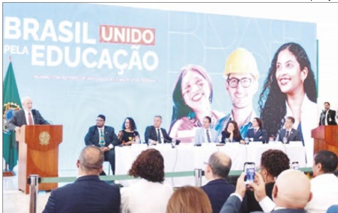
Governo Federal promete a inauguração de novas unidades educacionais

Conforme mostrou reportagem da Folha de S. Paulo, parte do recurso anunciado já estava previsto desde agosto do ano passado. Reitores afirmam que os valores liberados ainda são insuficientes para retomar