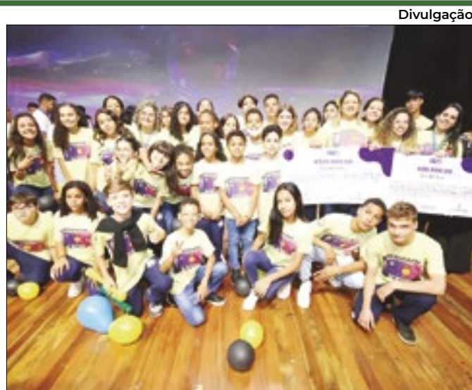
Finalistas serão para 23ª Conferência do ODP

Instituição aceitou acordo proposto pelo governo federal