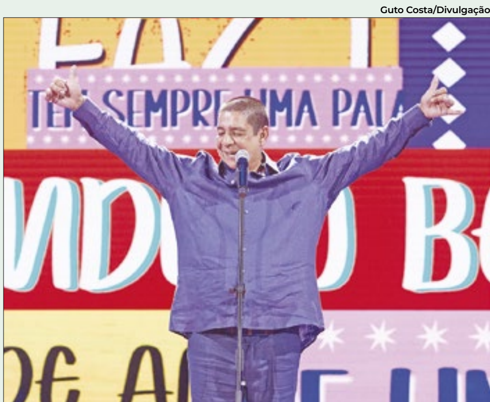
Zeca durante a gravação do CD-DVD do show de 40 anos de carreira