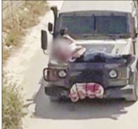
Imagem viralizou nas redes sociais

As Forças Armadas de Israel amarraram um homem palestino ferido ao capô de um jipe e o conduziram pelas ruas da cidade de Jenin, na Cisjordânia, revela