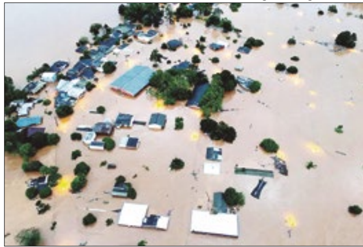
Moradores de 444 municípios podem receber o benefício

Prefeituras de 182 cidades do Rio Grande do Sul ainda não registraram famílias para receberem o Auxílio Reconstrução do governo federal. O cadastramento é o passo inicial para solicitação do benefício de R$ 5,1 mil, destinado às famílias residentes em áreas atingidas pelas enchentes, que abandonaram suas casas, de forma temporária ou definitiva, nos municípios com reconhecimento da situação de calamidade ou emergência. O prazo termina na próxima terça-feira (25) e o cadastro dos dados deve ser feito na página do Auxílio Reconstrução. Ao todo, 444 municípios gaúchos estão com reconhecimento federal vigente e tem direito a solicitar o valor. Desses, 182 não registraram nenhuma família.