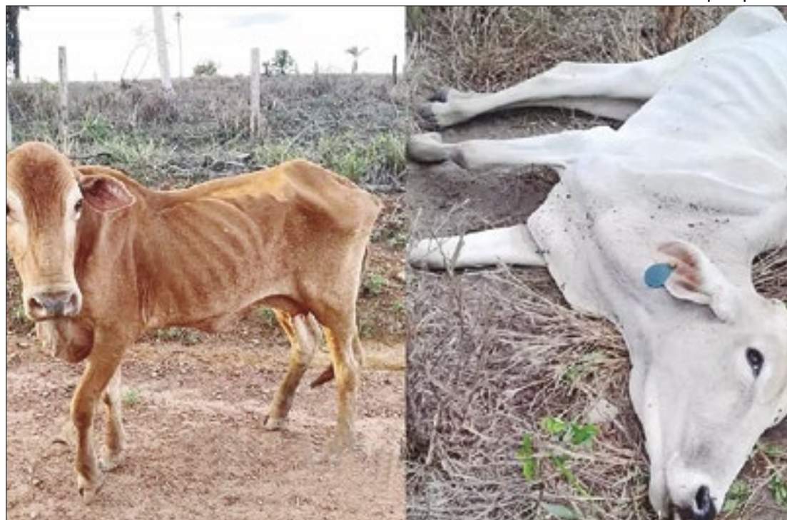
Bois tem morrido de fome em Roraima por falta de pasto

O decreto emergencial estabelece o Programa Emergencial de Apoio à Pecuária Familiar, permitindo a contratação temporária de pessoal, dispensa de licitação para aquisição de bens e serviços essenciais, além da convocação de voluntários para reforçar as ações de resposta ao