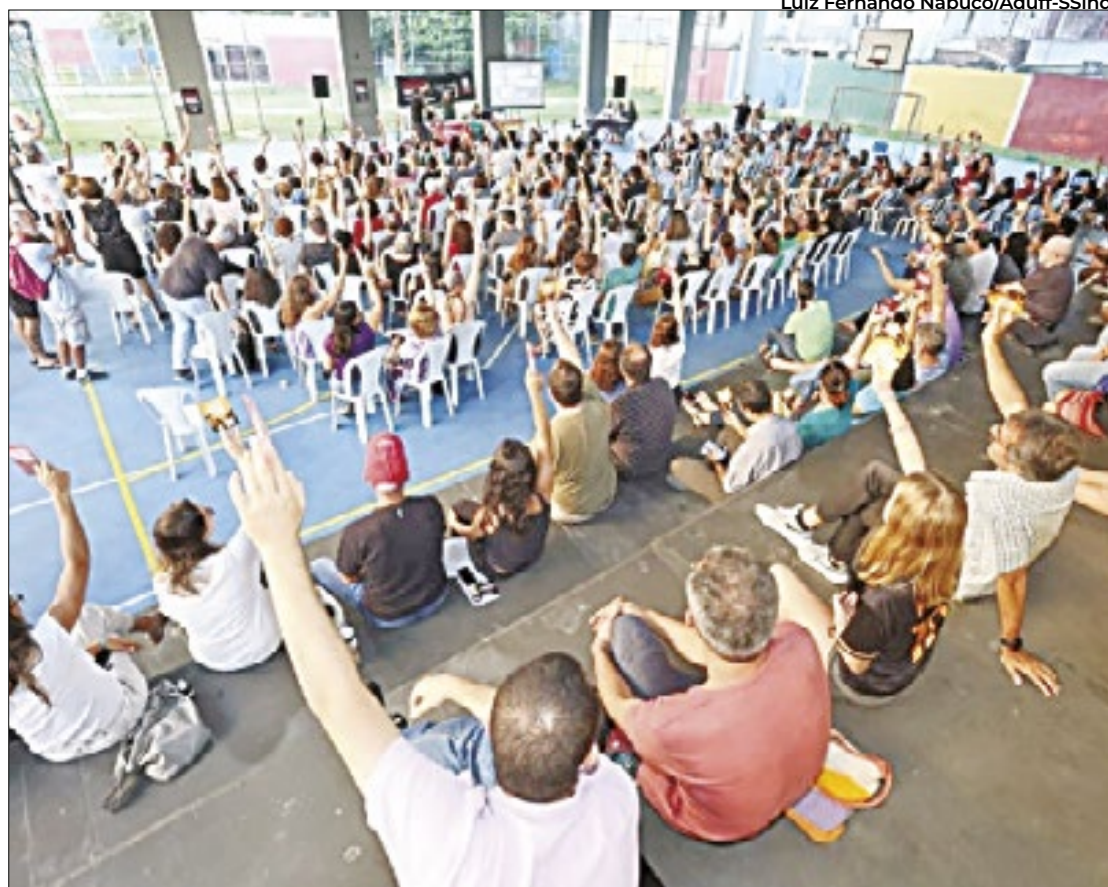
A votação, realizada nacionalmente, teve 217 docentes favoráveis ao fim da greve

A paralisação, que teve início no dia 29 de abril e foi aderida a nível nacional, foi motivada por uma série de insatisfações do corpo docente, que incluíam: a disponibilização de maior orçamento para as unidades da UFF; garantia de recomposição salarial; rees-