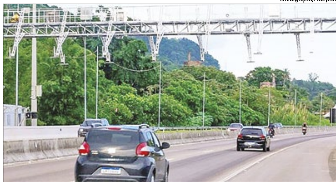
Sistema de cobrança de pedágio na Rio-Santos gera multa para a CCR RioSP