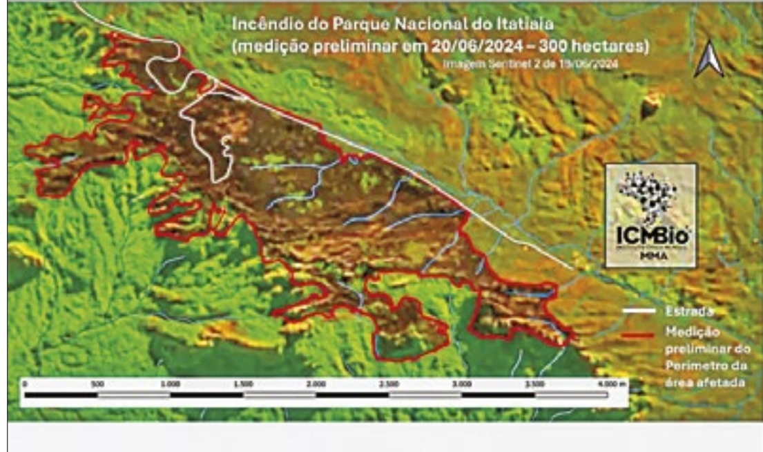
Cálculo preliminar de área atingida por incêndio no Parque Nacional do Itatiaia