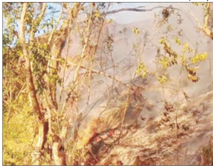
Na última quinta-feira, um incêndio atingiu a vegetação na região do Floresta em Petrópolis