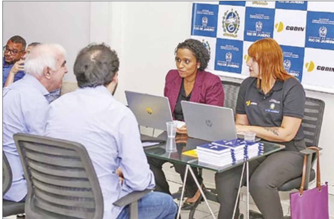
Projeto itinerante de atendimento aos empreendedores e gestores públicos

Durante os dois dias de trabalho, os participantes terão a oportunidade de conhecer a fundo os serviços oferecidos pela Codin, entre eles o processamento de pleitos por incentivos fiscais concedidos no estado, a orientação