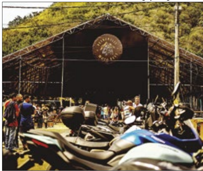
Petrópolis Moto Fest 2024 acontecerá em Itaipava