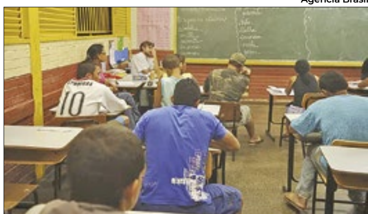
Escolas terão capacidade de cumprir projeto?

Ao invés de prever um teto de horas, a nova proposta traz um piso obrigatório. Pelo texto,