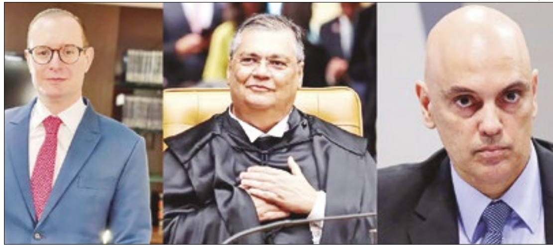
Ministros Zanin, Moraes e Flávio são a favor do TJRJ, ainda faltam Fux e Cármen Lúcia

que, por ocasião do deferimento da medida liminar nos autos desta reclamação, havia a percepção, diante dos elementos constantes nos autos, de que o município reclamante estava sendo o grande prejudicado. No entanto, com o contraditório e a instrução probatória, ficou evidente que havia muitos municípios prejudicados pelas medidas liminares proferidas em primeiro grau, o que motivou o Presidente do TJRJ a proferir, com acerto, a decisão reclamada", enfatizou Zanin.