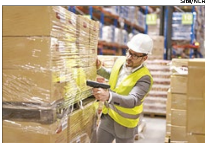
Estudantes de Administração serão mais cotados no processo