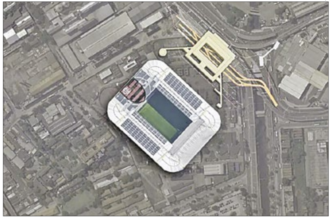
Eduardo Paes anuncia desapropriação de terreno da Caixa para construção de estádio do Flamengo

“O Flamengo está convencido de que não pode fazer simplesmente um estádio, mas sim uma espécie de distrito do futebol, com outros serviços. Eles estão completamente abertos às exigências dos encargos”,