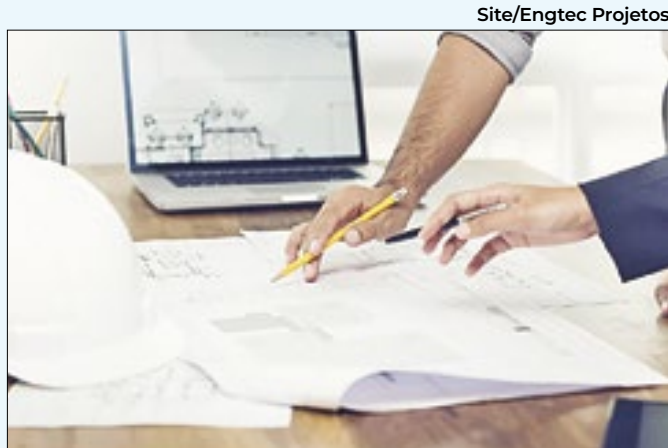
Conhecimento no Autocad é essencial para vagas

carpinteiro, caldeireiro, líder de limpeza social, entre outras. Interessados devem enviar o currículo para o e-mail trabalheconosco@cbsi.com.br com o nome da vaga até dia 27.