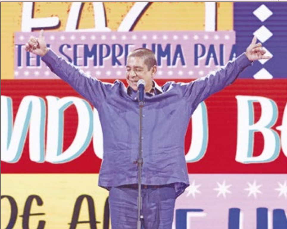
Zeca durante a gravação do CD-DVD do show de 40 anos de carreira