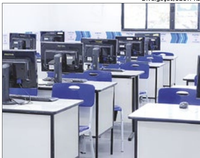
Nova unidade da Faetec na cidade de Rio Bonito