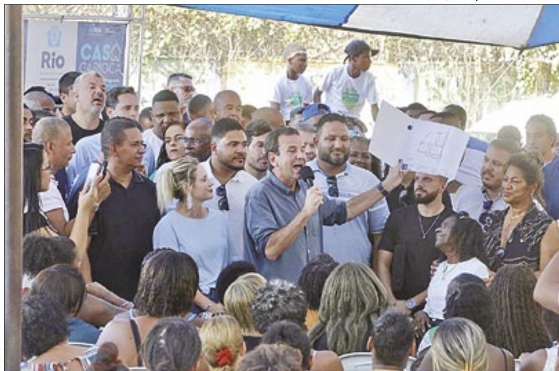
Complexo do Lins será beneficiado com o programa

A Prefeitura do Rio lançou, no sábado (22), o projeto Casa Carioca no Complexo do Lins, na Zona Norte. As obras de requalificação habitacional beneficiarão cerca de 200 casas na comunidade Nossa Senhora da Guia, também conhecida como Morro da Gambá. As intervenções começam já na próxima semana e levarão mais qualidade de vida para aproximadamente 800 pessoas em situação de vulnerabilidade social. Em seguida, o projeto será expandido para outras comunidades da região, beneficiando cerca de 1,5 mil residências ao todo.