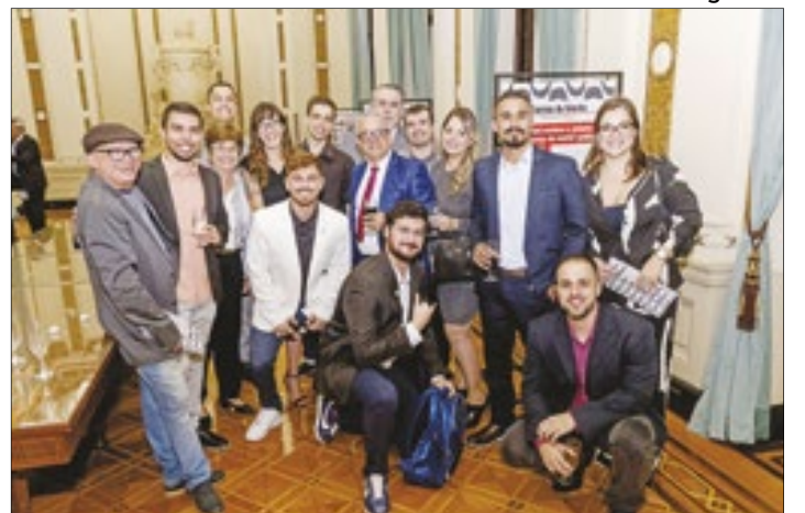
Interação entre as equipes do Correio da Manhã Rio, Correio Petropolitano, Correio Serrano, Correio Sul Fluminense e TVC, no coquetel