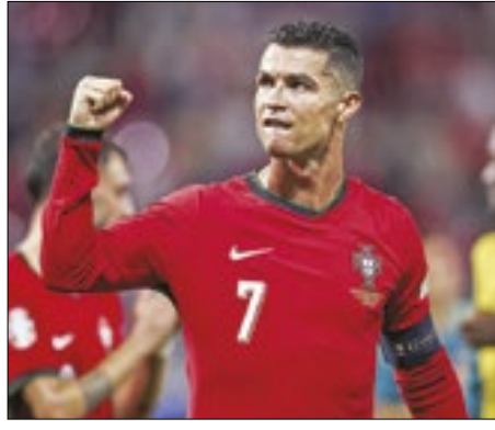
CR7 está batendo recordes na Euro

Cristiano Ronaldo é só sorrisos nesta edição da Eurocopa 2024. Ele se tornou recordista de assistências da competição em vitória contra a Turquia.