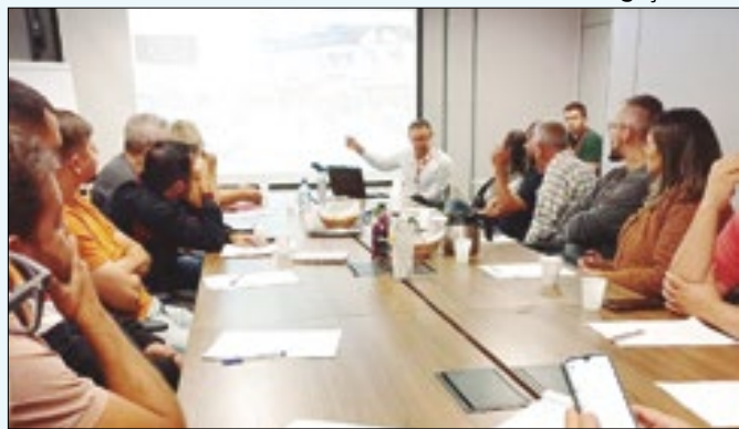
Reunião do GT aconteceu no Centro Administrativo