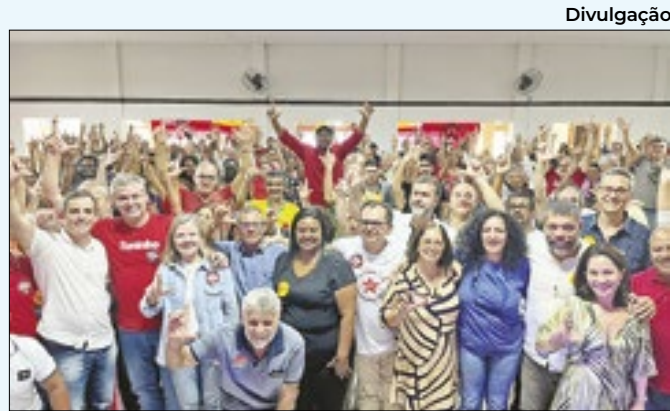
Pré-candidato à prefeitura de Pinheiral é lançado

para conhecerem outras instituições e saberem de qual forma cooperar internacionalmente. "Assim podemos melhorar o que nós temos na indústria nuclear global", finalizou Raquel Heredia.