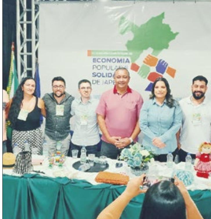
Iniciativa teve como objetivo fortalecer o empreendedorismo

Um dos palestrantes foi o pesquisador e integrante do Conselho Estadual de Economia So-