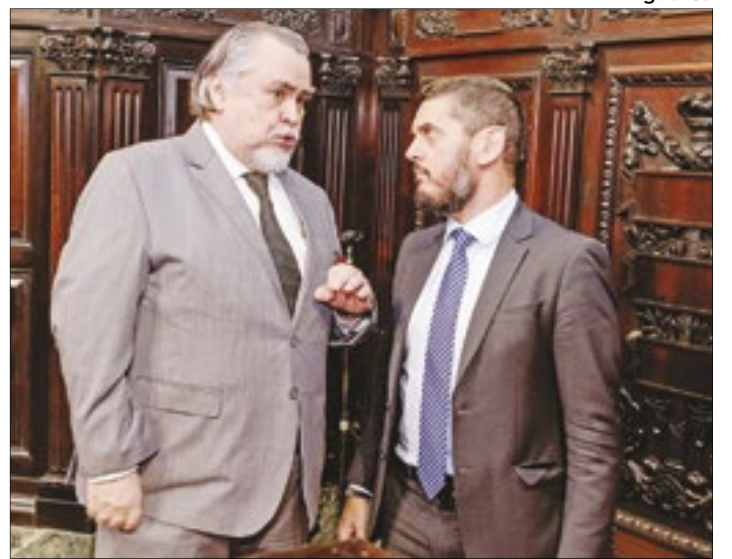
Magnavita durante conversa com o deputado e presidente da Alerj, Rodrigo Bacellar, antes de Sessão Solene no Palácio Tiradentes