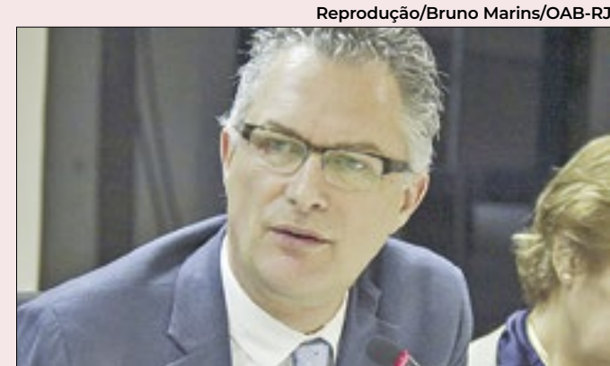
Casagrande: proteção integral aos menores de idade

A SuperBike disse não haver necessidade de autorização judicial para a participação de crianças na prova e que o menino estava acompanhando pelo pai. O Tribunal de Justiça paulista afirmou o disse que a autorização seria necessária caso não houvesse aprovação dos pais.