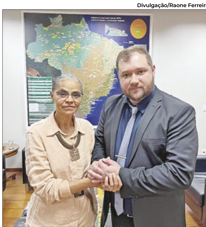
Foi o terceiro encontro do vereador com a ministra

Na última reunião, o vereador entregou um relatório de 87 páginas para a ministra, detalhando a situação ambiental e os impactos da poluição. Desta vez, ele apresentou um ofício com dados atualizados