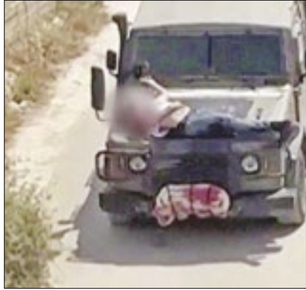
Imagem viralizou nas redes sociais

As Forças Armadas de Israel amarraram um homem palestino ferido ao capô de um jipe e o conduziram pelas ruas da cidade de Jenin, na Cisjordânia, revela