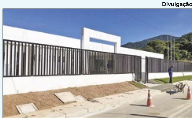
Creche do bairro Matogrosso, no município de Saquarema

inserirem no mercado de trabalho. As oportunidades de qualificação são para Assistente Administrativo, Assistente de Logística, Inglês Iniciante e Operador de Computador. Rio Bonito também ganhou laboratórios científicos direcionados a aulas de ciências, física, química e biologia.