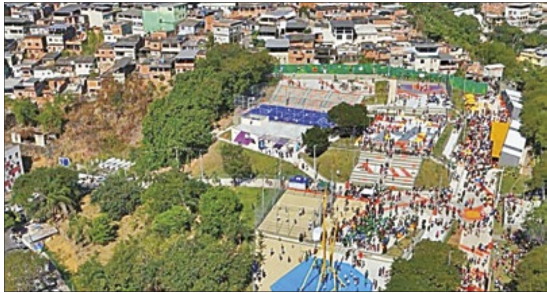
O Parque Carioca Pavuna fica numa área de 17 mil metros quadrados

A Prefeitura do Rio inaugurou, no sábado (22), o Parque Carioca Pavuna, numa área de 17 mil metros quadrados, nas proximidades da comunidade do Chapadão, região com um dos mais baixos Índices de Progresso Social (IPS) do município. Um antigo terreno baldio na Rua Marechal Guilherme, abandonado e usado de maneira improvisada pelos moradores para jogos de futebol, foi transformado num espaço arborizado, com 320 árvores de diferentes espécies nativas da Mata Atlântica, sendo 129 novas; quiosques; quadras esportivas; área infantil; e área de convivência. O grande destaque fica por conta de uma torre d'água com iluminação de quase 22 metros de altura, que ajudará a trazer frescor para os frequentadores. Pensando na capacitação da população para o mercado de trabalho, também foi construída uma Nave do Conhecimento. O investimento da Prefeitura foi de mais de R$ 12 milhões.