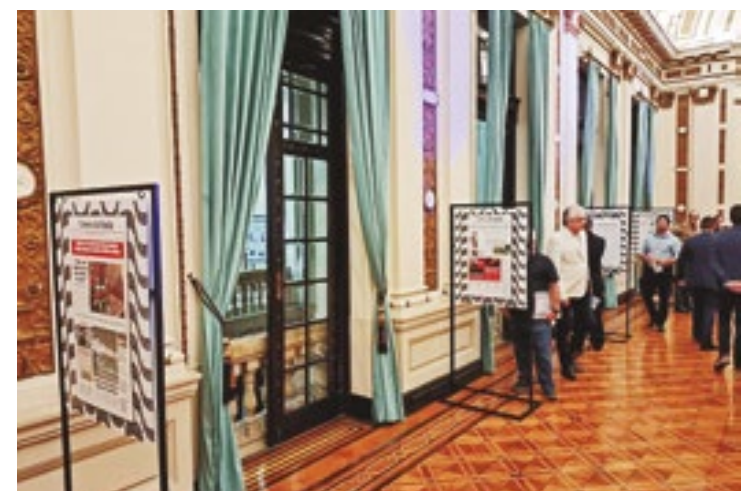
Durante a exposição, o visitante poderá conferir capas de jornal de desde a sua fundação até as dos dias atuais

A exposição é uma excelente oportunidade para os estudantes de Comunicação perceberem a importância do jornal impresso como documento instrumento histórico