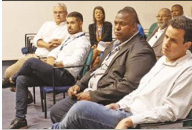
Há 80 vagas destinadas a pessoas em situação de rua