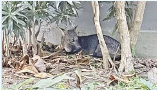
GM resgatou cachorro do mato na Barra da Tijuca