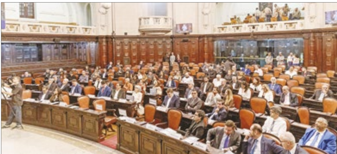
Público no Plenário Barbosa Lima Sobrinho na última quinta-feira, 20 de junho

Distrito Federal, posição que ocupa desde 1901. Como o governador Cláudio Castro afirmou: o Correio da Manhã é o veículo que defende as pautas do Rio junto ao Poder Central. Posição que o Rio perdeu com a mudança da capital. A interiorização do jornal também foi destacada na cerimônia, com suas edições regionais diárias, como ressaltou o deputado estadual Munir Neto, co-autor da homenagem.