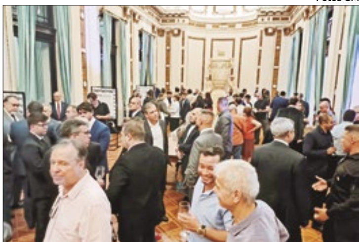
Autoridades, empresários e formadores de opinião prestigiaram o coquetel de abertura da exposição na noite da última quinta-feira, 20 de junho

A abertura da Exposição das Primeiras Páginas históricas do Correio da Manhã, com registros dos fatos relevantes ao longo dos 123 anos do jornal, ocorreu após a sessão solene, na Alerj, e segue até 30 de junho