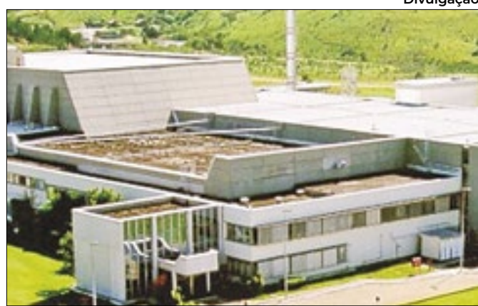
INB produz combustível para usinas nucleares