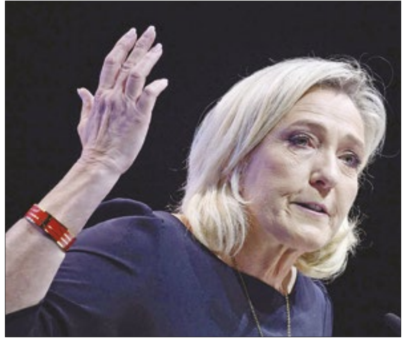
A presidente da RN, Marine Le Pen, discursa durante um evento no sul da França

O levantamento foi realizado pelo instituto Ipsos, pelo jornal Le Parisien e pela Radio France entre os dias 19 e 20, e mostrou a aliança de esquerda Nova Frente Popular