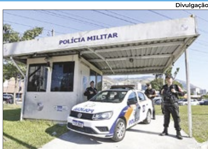
Ruas de Nova Iguaçu ganham reforço na segurança