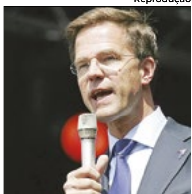
Holandês deve liderar Otan

O presidente da Romênia, Klaus Iohannis, retirou na quinta sua candidatura para o cargo de secretário-geral da Otan. Com isso, não há mais impedimentos para que o premiê holandês, Mark Rutte, se torne