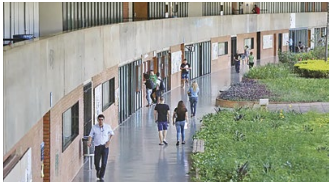
Na UnB, professores começam a voltar às aulas

Essa debandada ocorre após tentativas de Lula de se aproximar da categoria. Nas últimas semanas, o presidente realizou um encontro com reitores, escutou suas demandas e prometeu agir. Depois, o governo anunciou um pacote de investimentos nas universidades e fez, por meio dos Ministérios da Gestão e da Inovação em Serviços Públicos, nova proposta para o encerramento da greve. O governo ofereceu, por