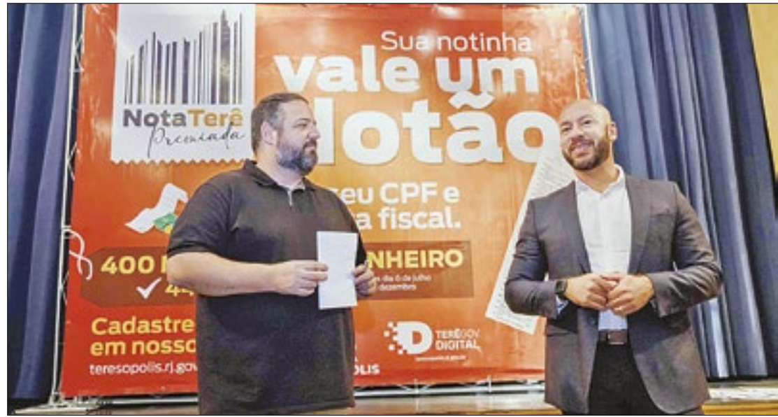
Prefeitura de Teresópolis

Totalizando R$ 195 mil, a premiação foi entregue em cerimônia realizada no Teatro Mu-