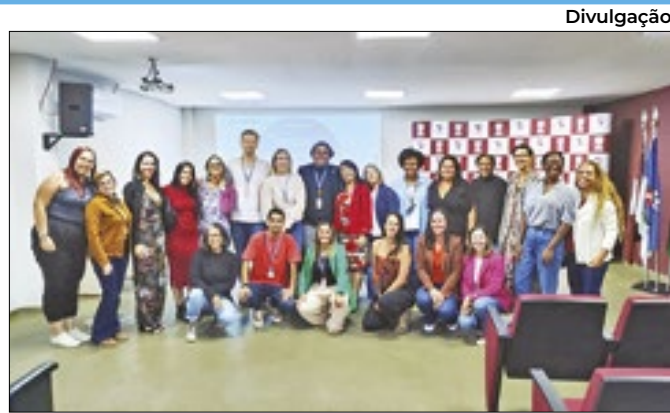
Encontro dos Municípios em Miguel Pereira