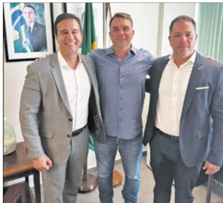
Renato Araújo, o senador Flávio Bolsonaro e Zé Augusto no encontro em Brasília, nesta quinta-feira

■ CODIN INCENTIVA - A Companhia de Desenvolvimento Industrial do Estado do Rio de Janeiro, em parceria com a Prefeitura de Queimados, promove nos dias 26 e 27 de junho, mais uma edição do projeto Codin Incentiva, ação itinerante que leva serviços, atendimento presencial e novas oportunidades de negócios para os empreendedores de todas as regiões do estado. O evento acontece no