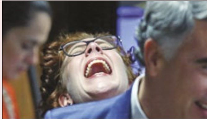
Zambelli: constrangedora sucessão de erros e gafes