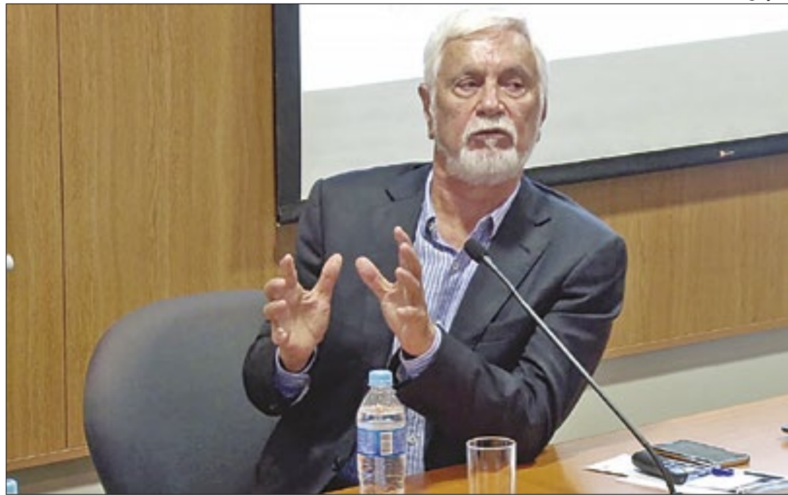
Um dos ‘pais’ do Plano Real, o economista Edmar Bacha vê ‘desreformas’ do PT

jetória petista, o economista é bem direto: “O Lula, nos dois primeiros anos, ainda fez alguma coisa. Depois, na hora que veio a bonança [alta no preço das commodities que gerou crescimento interno e global], falou que não precisava fazer mais porcaria nenhuma. Em