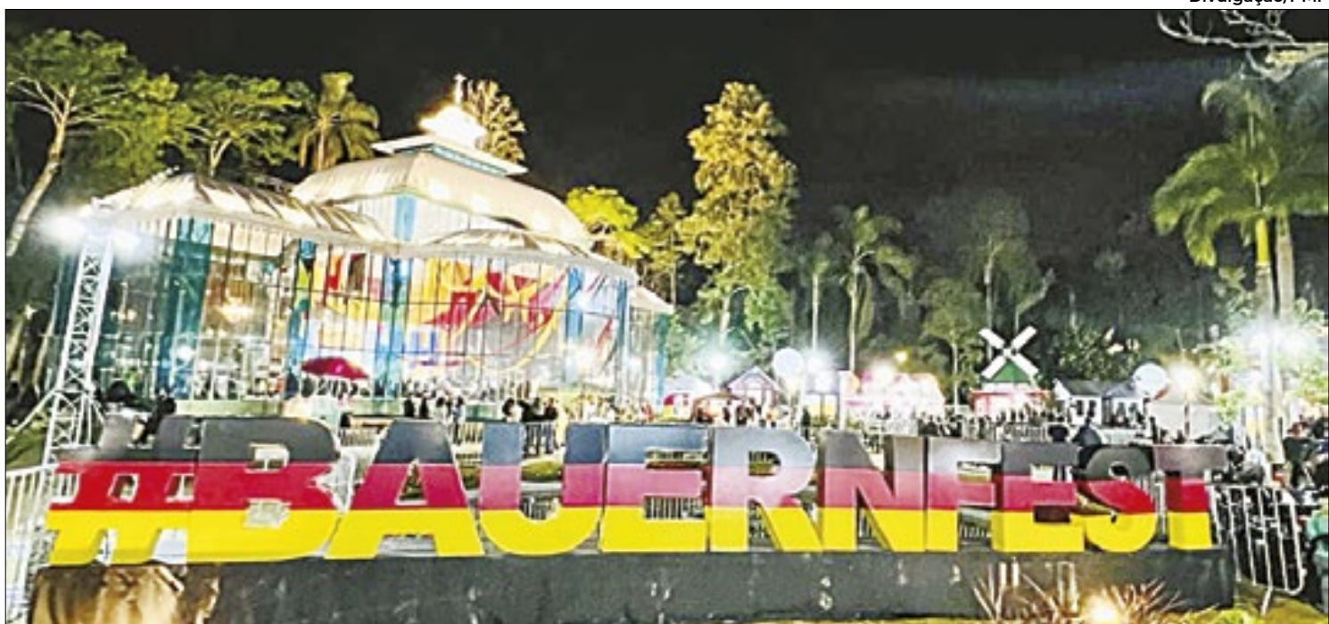
Evento acontece no Palácio de Cristal entre os dias 21 de junho e 7 de julho, a entrada é gratuita e há diversas atrações

dia 20 de julho e prevê, nesta primeira etapa, 15 encontros em grupo. As sessões de terapia acontecerão todos os sábados, das 14h30 às 16h, no auditório da CDL Petrópolis, localizado na Rua Irmãos D’Angelo, 48, sobreloja. O projeto contará com 20 vagas disponíveis para mulheres que necessitam desse suporte psicossocial. As inscrições estão abertas pelo telefone (24) 99313-5130.