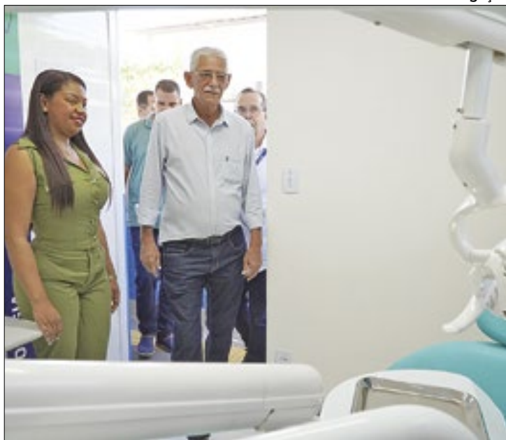
Cidade possui 43 USFs remodeladas e ampliadas