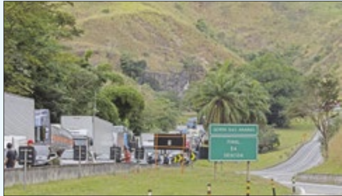
Bloqueio será realizado das 11h30 às 13h30