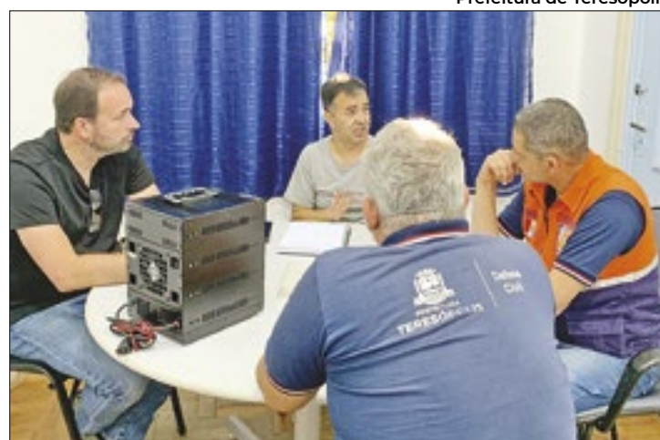
Prefeitura de Teresópolis

A instituição tem por objetivo a prestação de serviços relacionados com o radioamadorismo, faixa do cidadão e radiocomunicação à comunidade, forças arma-