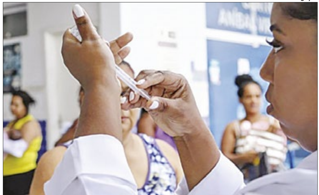
Atendimentos com livre demanda serão realizados em oito postos de saúde do município

Os serviços disponíveis são: médico clínico, atendimento de enfermagem e hiperdia, preventivo e imunização com todas as vacinas do calendário pediátrico, do adolescente e do adulto. Não é necessário marcar consulta para ser atendido.