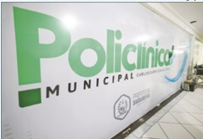
Unidade funciona de segunda a sexta, das 07h às 17h