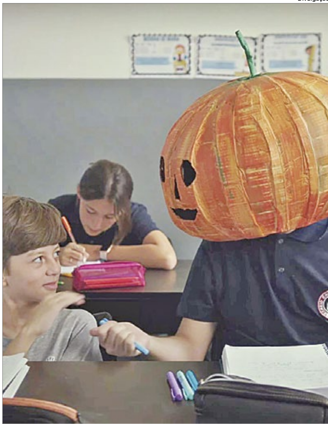
Campanha reafirma a importância da conscientização e do diagnóstico precoce

Localizada no bairro do Recreio dos Bandeirantes, no Rio de Janeiro, a Rio School Christian é uma escola bilíngue cristã que se destaca por