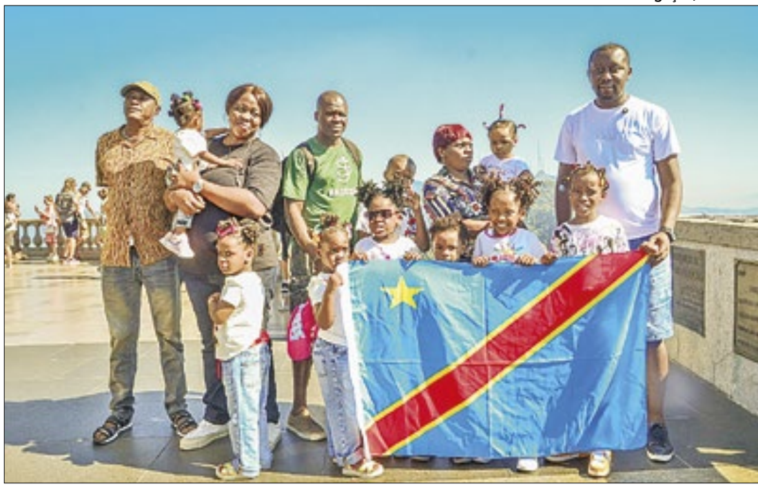
Semana Nacional do Migrante e do Refugiado tem programação para combater a xenofobia

aos pacientes durante as obras. No local, a Prefeitura vai construir um prédio de 4 andares, completamente acessível, pensado para dar ainda mais conforto, segurança e privacidade para os pacientes e profissionais médicos e de enfermagem", informou a prefeita.