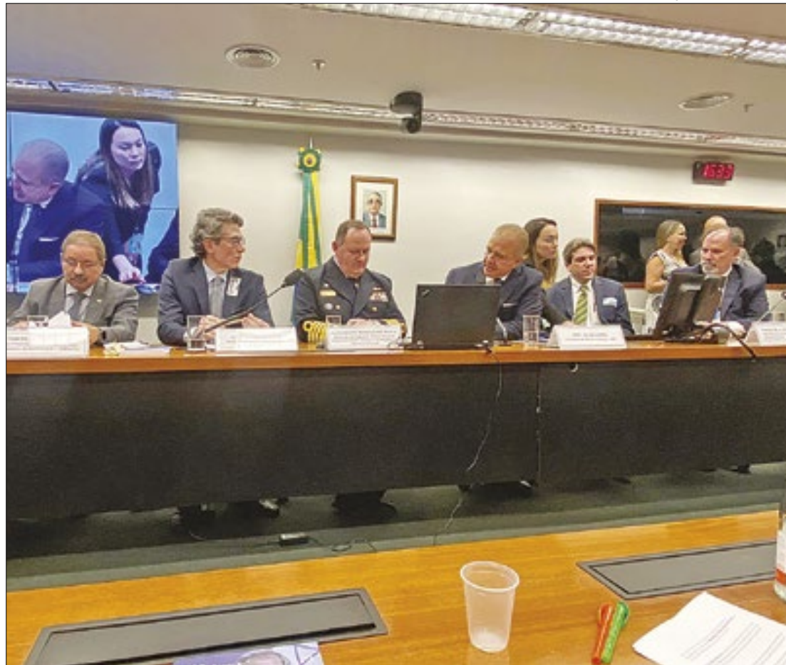
Presidente Raul Lycurgo apresentou Brasil como potencial exportador do combustível

“A transição energética é um dos maiores desafios que enfrentamos atualmente, e a energia nuclear tem um papel crucial nesse processo. Precisamos substituir fontes de energia poluentes, como o carvão e