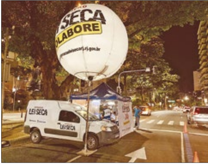
Operação Lei Seca completa 16 anos de criação