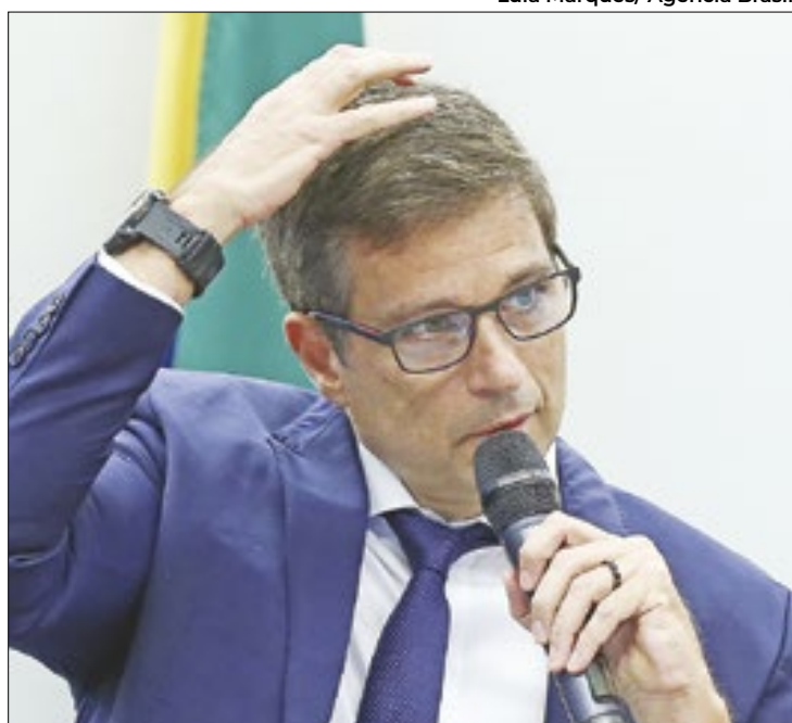
Lula e o PT voltam suas baterias contra Campos Neto

O presidente também voltou a questionar a autonomia do BC. “Autonomia de quem? Autono-