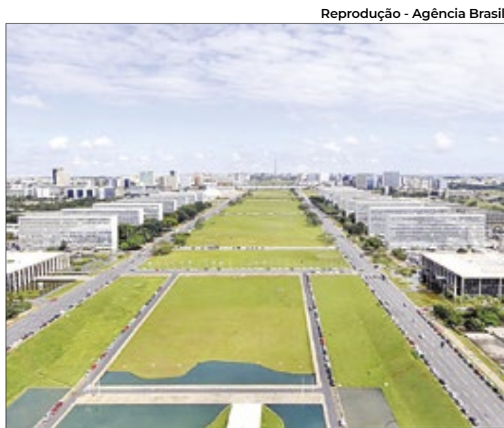
Posição da equipe econômica converge com o Copom

Além de validar a posição de membros aliados do governo no Copom, em favor da estabilidade da taxa básica, a equipe econômica manifestou preocupação com a possibilidade de uma nova