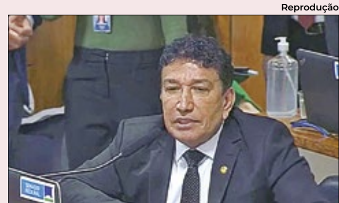
Magno Malta criticou conservadores ausentes

Portinho disse estranhar o voto de Moro, ex-juiz federal: “Ele sabe que isso é para lavar dinheiro”, criticou. Os quatro senadores titulares do PL na CCJ votaram contra o projeto, assim como fizeram na Câmara deputados mais ligados ao então presidente Jair Bolsonaro.