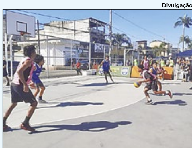
Novos espaços vão incentivar a prática do esporte

A Fundação de Apoio à Escola Técnica (Fundec) é uma instituição que possui 34 unidades espalhadas pelos quatro distritos de Duque de Caxias e oferece mais de 120 cursos gratuitos para moradores de todas as faixas etárias no município da Baixada.