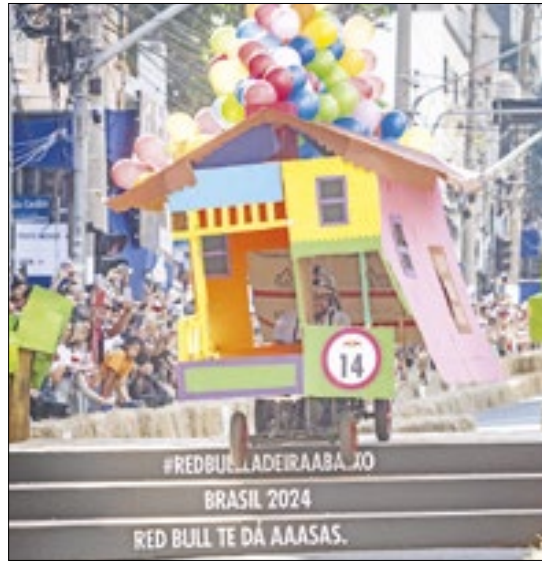
Equipe ‘Up - Loucas Aventuras’ ficou em segundo lugar, mas inspirou com sua história

Nos boxes, era impossível não se encantar com o gigantesco carrinho em forma da casa voadora e com a família perfeitamente trajada como os personagens do filme. Mais do que apenas o visual, a história por trás da escolha do filme é uma grande lição de vida.