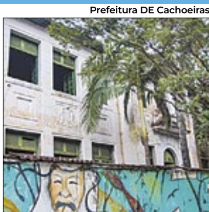
Prefeitura DE Cachoeiras

O evento teve o objetivo a troca de experiências e boas práticas, a fim de articular estratégias para a criação de novas frentes institucionais que possam ampliar a rede de proteção e promoção do grupo. Um dos temas apresentados foi o enfrentamento à discriminação.