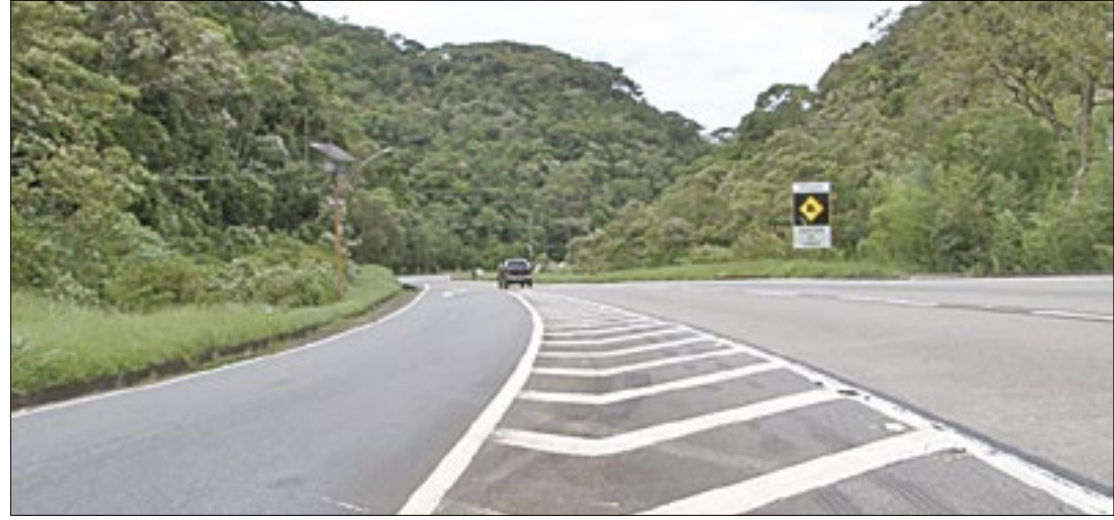
Todos os participantes devem atender aos requisitos de regularidade jurídica

O contrato de concessão terá duração de 30 anos, contados a partir da data da adesão pela concessionária vencedora. Esse prazo é considerado adequado para permitir a realização dos investimentos necessários e garantir a manutenção