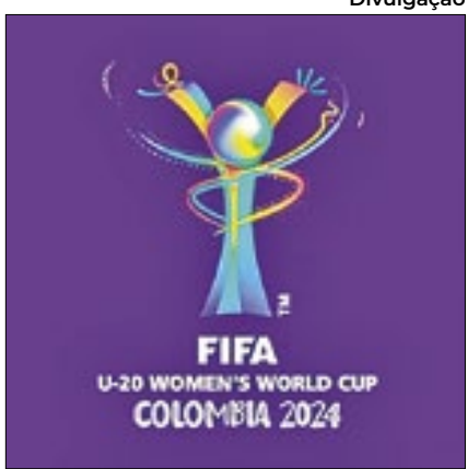
Mundial acontece entre 31/8 e 22/9

O Fluminense informou que o técnico Fernando Diniz não está suspenso para o Fla-Flu, neste domingo, no Maracanã. Contra o Cruzeiro, ele recebeu seu primeiro cartão amarelo do Brasileiro.