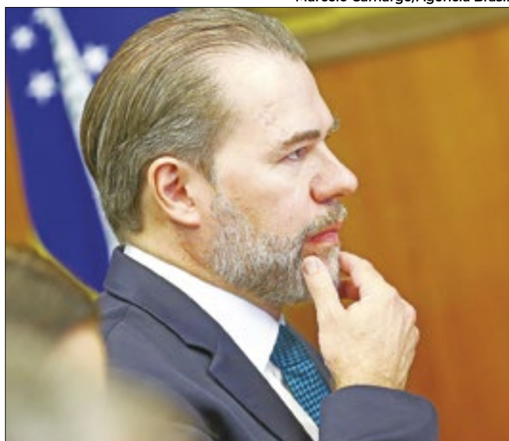
Toffoli fez proposta alternativa sobre drogas

O julgamento estava suspenso após pedido de vista do ministro Dias Toffoli, que abriu a discussão com seu voto, que abriu uma nova frente de discussão. Toffoli divergiu dos ministros favoráveis à descriminalização, mas também não se alinhou completamente à ideia