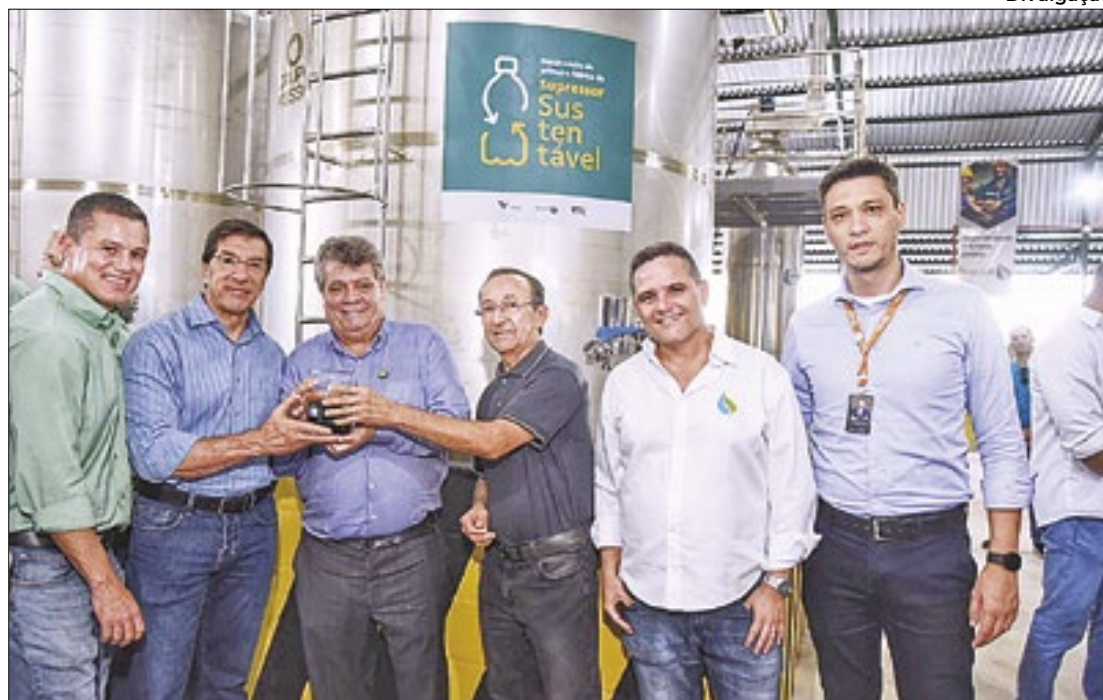
Empresa já recuperou 15 toneladas de garrafas PET e produziu 280 mil litros de resina

Além de garrafas PET transparentes e verdes, a pro-