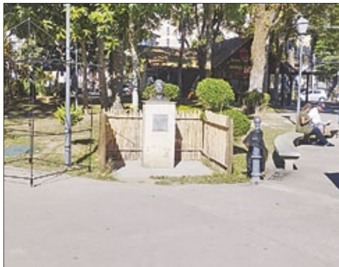
Monumento Zumbi dos Palmares Praça da Liberdade