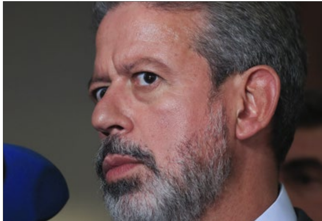
Lira admitiu o desgaste com PL do Aborto

A proposta inicialmente seria votada no plenário da Câmara nesta quarta-feira (19). Porém, Lira voltou atrás e retirou a pauta para votação já que o presidente do Senado, Rodrigo Pacheco (PSD-MG), sinalizou que não apoiaria a tramitação no momento. A PEC concede anistia aos partidos é defendida por diversas legendas, mas criticada por movimentos sociais. Enquanto na Câmara dos Deputados a proposta só não é defendida pelo partido Psol, no Senado ela enfrenta maior resistência. A medida inclui anistia e