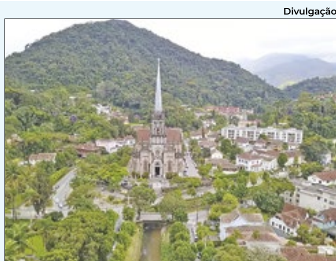
Catedral São Pedro de Alcântara em Petrópolis

truído o acesso ao monumento em homenagem a Zumbi dos Palmares. Após a denúncia, e o ofício enviado ao Prefeito em nome do Coletivo, a Prefeitura instalou uma cerca no entorno do monumento.