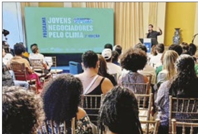
Beth Santos/Prefeitura do Rio