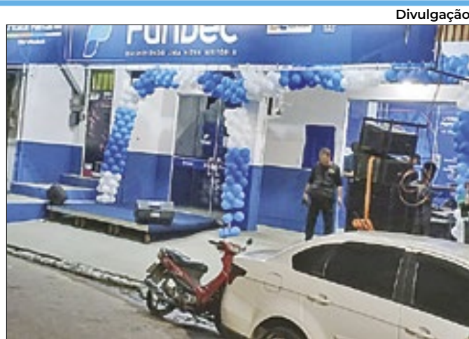
Fundec vai ampliar o número de vagas e cursos na região