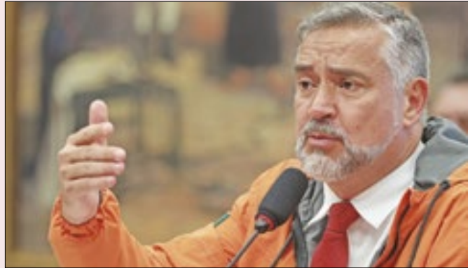
Pimenta apresentou números ao TCU