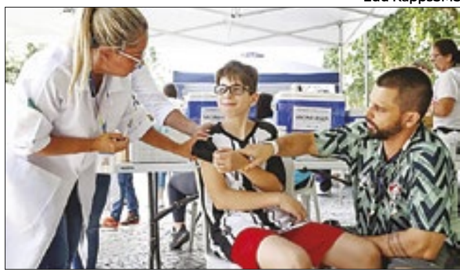
Medidas preventivas são essenciais para o combate