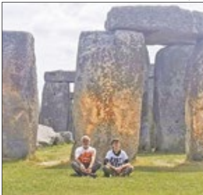
Monumento histórico pintado

Ativistas vandalizaram o monumento de pedras do sítio arqueológico Stonehenge, no sudoeste da Inglaterra, na quarta. Dois homens pulverizaram tinta laranja em várias pedras. Imagens mostram que turistas