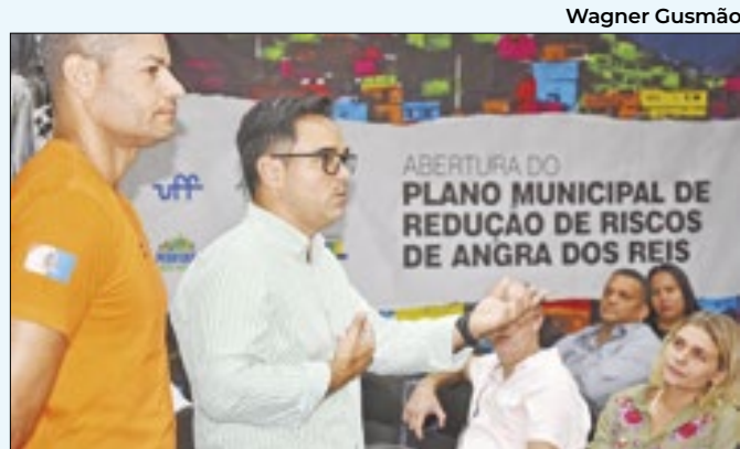
Vinte e seis comunidades da cidade serão priorizadas

8h30. O campeonato terá as disputas: Gole Gole FC X Papa FC; São Joaquim X Copo Duplo; Joga Nada X Meia Boca Jrs; Terreirão FC X Quatis FC; Os Danados X Fúria FC.