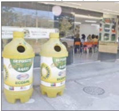
Ação promove bem estar ambiental

Nesta semana foi lançada no CIEP municipalizado de Levy Gasparian, a 'Gincana Coleta Consciente 2024'. Uma iniciativa, em prol do meio ambiente, que é promovida pela Prefeitura