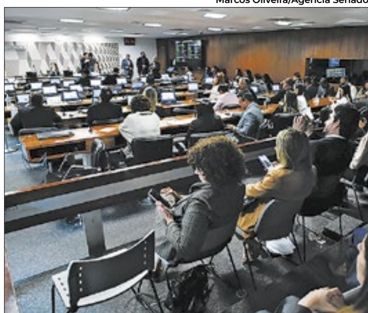
Votação na CCJ sobre jogo foi apertada

“Há delitos graves, hediondos, que estorrecem a socieda-