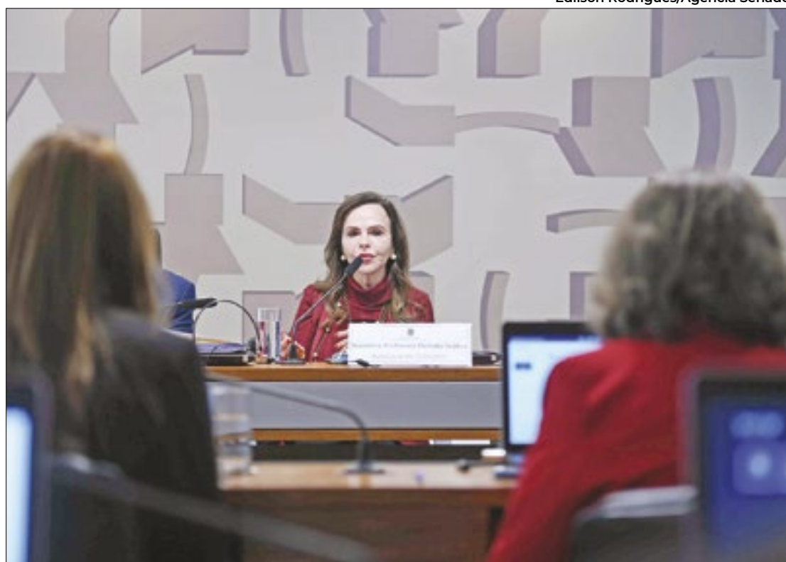
Professora Dorinha fez modificações no texto enviado pela Câmara

O Conselho Nacional de Secretários de Educação (Consed) defende a reforma. Porém, se diz preocupado com as modificações feitas no Senado. “O