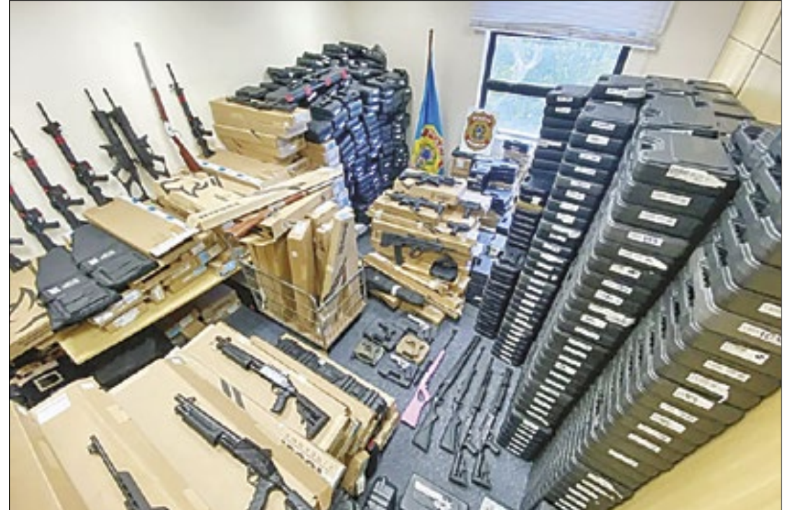
Somente em 2023, foram 2,2 mil apreensões. Um aumento de 301% em relação a 2022

“O foco tem sido a prevenção das ocorrências de crimes mais graves, como mortes violentas intencionais, crimes passionais e o crime organizado, que se aproveita desse comércio ilegal de armas e, consequentemente, fortalece o tráfico de drogas, o tráfico de armas pro-