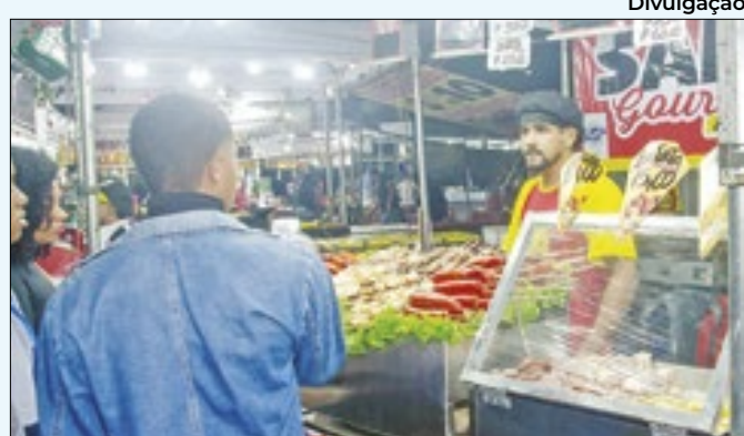
Regras detalhadas foram divulgadas no Diário Oficial

cidade. As entregas aconteceram no Teatro Metodista e, ao todo, 600 cartões foram entregues. Os beneficiários que não retiraram o benefício podem comparecer à Secretaria de Assistência Social, que fica na Rua Otília, 1496 - Vila do Tinguá, de segunda a sexta-feira, das 10h às 15h.