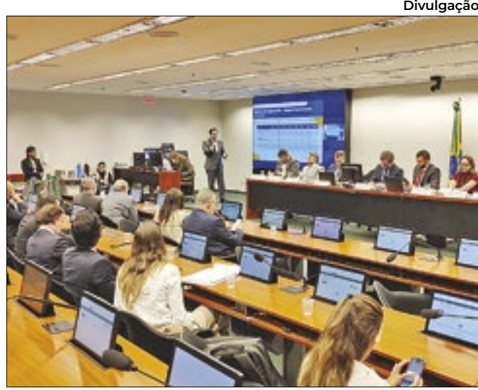
Parlamentares receberam informações técnicas