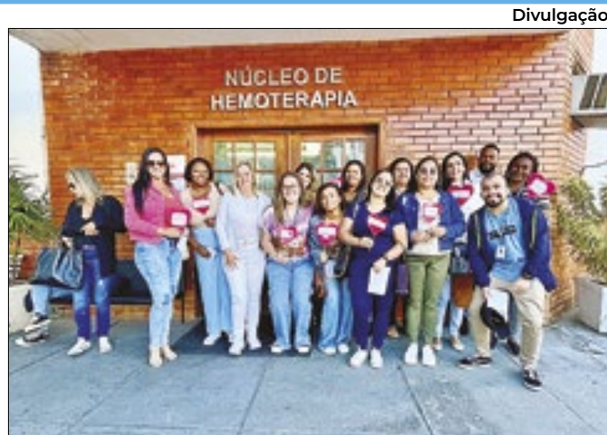
Ação juntou 40 doadores de sangue