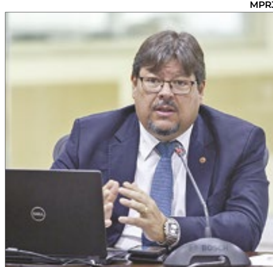
MPRJ Documento encaminhado ao STF foi assinado pelo Procurador-Geral de Justiça do Rio, Luciano Mattos

do ISP, que, entre 2019 e 2024, o número de operações aumentou e a letalidade diminuiu, evidenciando que não há relação de causa-efeito entre os fenômenos. “Defendemos várias medidas já adotadas pelo estado. Na petição que encaminhamos na sexta-feira, sustentamos que a operação policial não deve ser excepcional já que hoje há mais operações e menos letalidade”, esclareceu