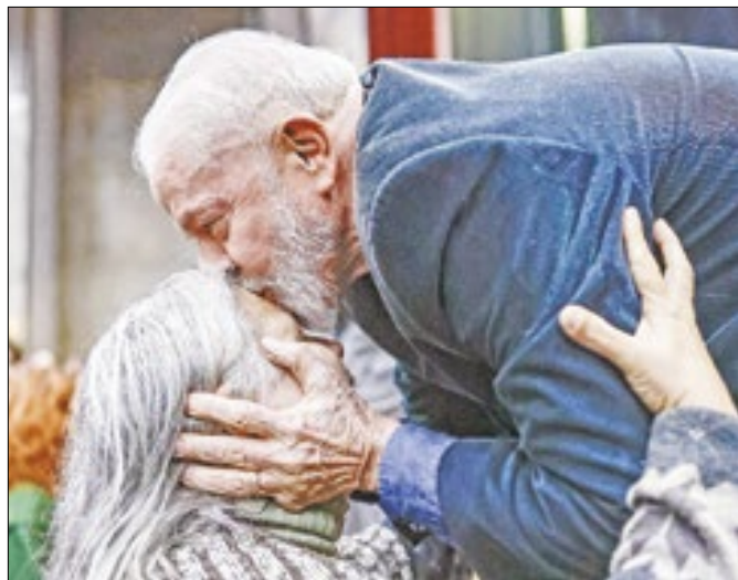
Lula aposta no Rio Grande como ativo eleitoral