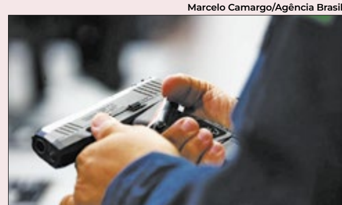
Advogado quer nomes de quem perdeu registro

As suspensões de registros de CACs também aumentaram a partir do governo Lula: 3.113 em 2023 contra 669 no ano anterior (4,8 vezes mais). A média cresceu até maio de 2024, passou de 303,4 por mês, contra 259,41 no ano anterior. Em 2020 houve 48 dessas medidas.