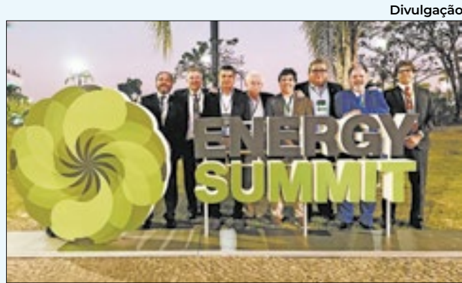
Rio sediou evento internacional Energy Summit

ponibiliza conteúdo sobre questões que impactam a vida do empreendedor e colaboram nas decisões dos gestores públicos. Representa mais de 286 mil estabelecimentos, que respondem por 2/3 da atividade econômica, e 70% dos estabelecimentos, gerando 1,8 milhão de empregos.