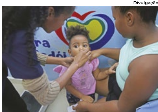
Município de Magé se mobiliza contra a Poliomielite