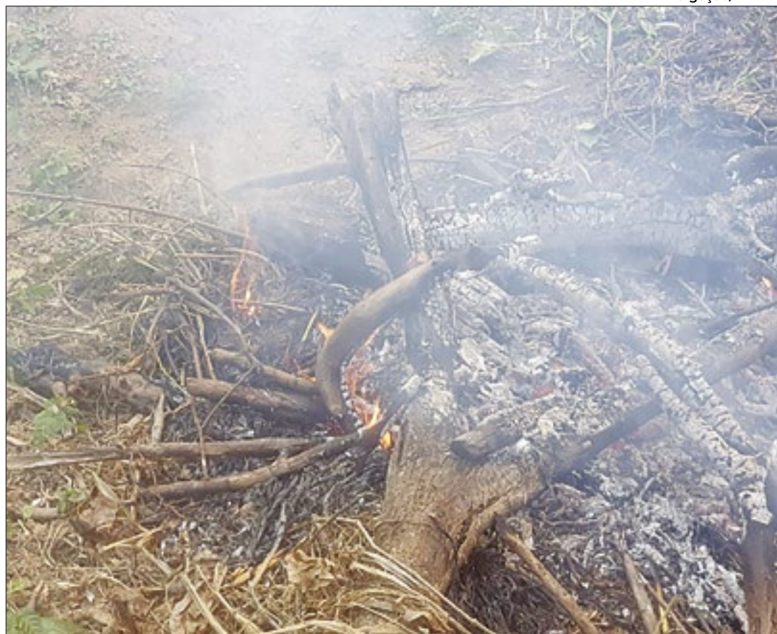
Barra Mansa adota medidas para prevenir queimadas em áreas vulneráveis

"As autuações são realizadas com base no artigo 62 do decreto 6.514 de 2008 e