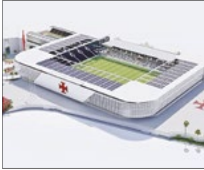
'Novo São Januário' foi aprovado

Na noite da última terça (18), a Câmara Municipal do Rio de Janeiro aprovou a venda do potencial construtivo e, por consequência, a reforma do histórico Estádio Vasco da