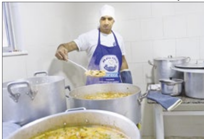
Prato Feito serviu 3,5 milhões de refeições em dois anos