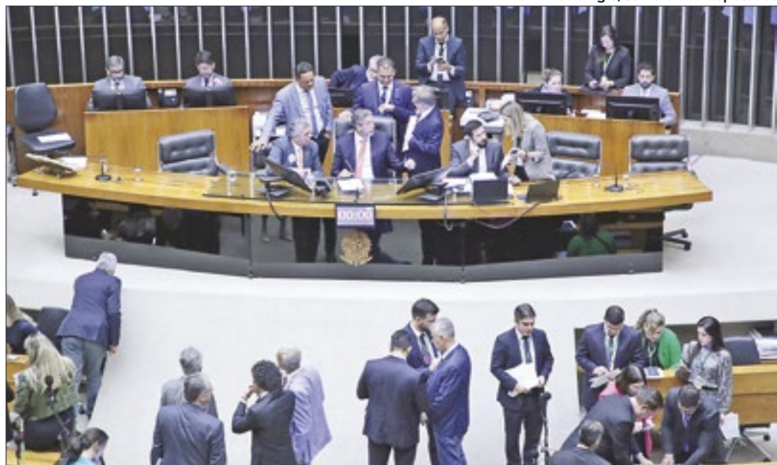
Diante da polêmica, Câmara recuou da anistia a partidos

A PEC 9/2023 é criticada por movimentos sociais ligados a mulheres e negros e defendida como forma de garantir a saúde econômica dos partidos políticos. Ela foi aprovada na Comissão de Constituição e Justiça (CCJ) da Câmara em maio de 2023. Na época, o projeto teve