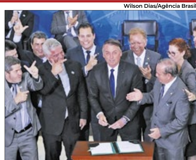
Bolsonaro assinou medidas que favoreciam atiradores