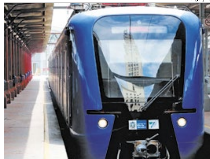
Decisão traz segurança para os usuários do sistema

Na ação, movida pela Procuradoria Geral do Estado (PGE-RJ) contra a Supervia, alega-se risco à continuidade da operação do sistema de transporte ferroviário na Região Metropolitana “por comportamentos abusivos e de má-fé da parte ré, em fraude à concessão e ao compromisso de continuidade do serviço público”. O Estado aponta ainda que a redução do número de passageiros “deve-se à péssima gestão dos atuais controladores”.