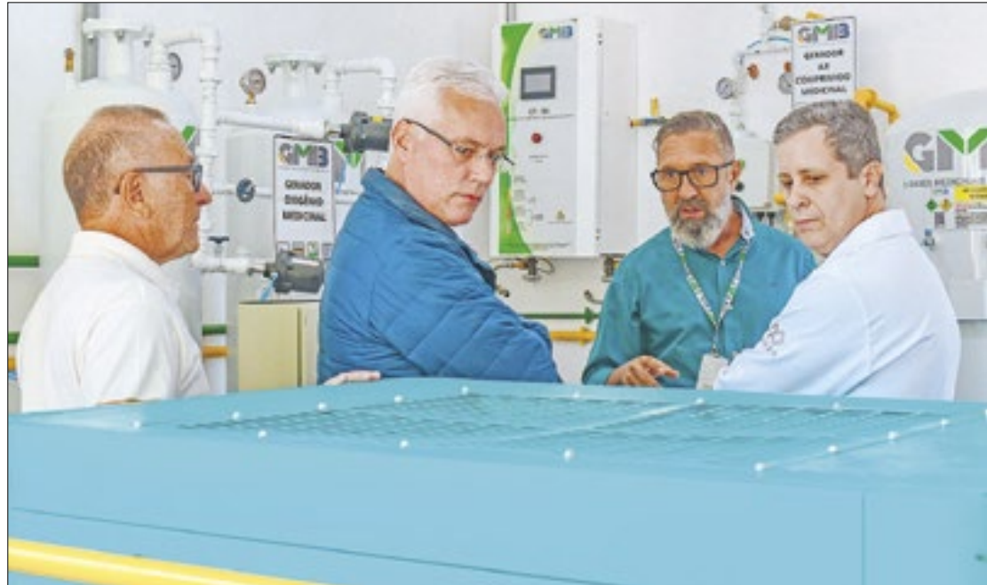
Usina gerará economia de R$ 40 mil mensais para o hospital

"Em 30 dias, assinamos a ordem de serviço e entregamos a Usina. O custo do metro cúbico de oxigênio cairá