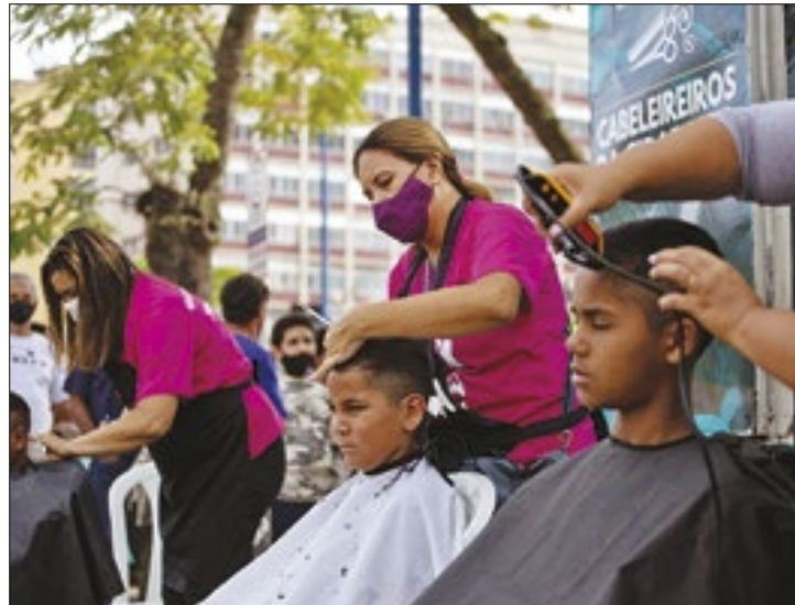
Evento contará com atendimentos de diversas secretarias

Serão disponibilizados serviços das secretarias de: Assistência Social; Saúde; da Pessoa Com Deficiência; de Políticas para Mulheres e Direitos Humanos; Cultura, Esporte e Lazer; Educação; Meio Ambiente; Juventude; e Empreendedoris-