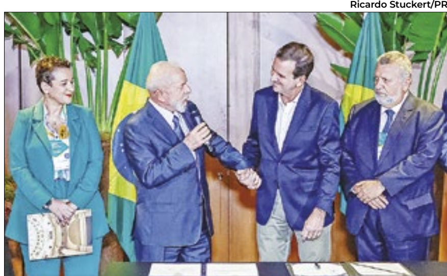
Ao centro, Lula com Paes, com os presidentes da Caixa, Carlos Vieira; e do BB, Tarciana Medeiros

O prefeito Eduardo Paes (PSD) destacou a importância das operações. A Caixa destinou R$ 141 milhões, para a compra de BRTs – ônibus de deslocamento rápido em corredores exclusivos (com capacidade para até 80 pessoas). Os recursos da Caixa complementam investimentos que a prefeitura tem feito com o sistema de BRT. A primeira operação de crédito negociada com o banco público foi no valor de R$ 645 milhões, destinada à compra de ônibus articulados mode-