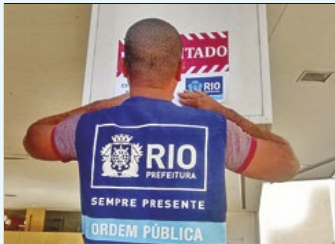
Construção estava sobre calha do Canal da Portuguesa