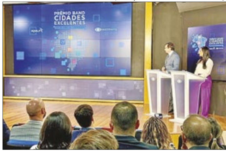
Agora, os vencedores aguardam até julho para concorrer à etapa Nacional

As cidades competem na divisão de três categorias: 30 mil habitantes, até 100 mil habitantes, e 100 mil ou mais habitantes. Avaliadas por 72 indicadores, divididos em seis pilares: Governança; Eficiência Fiscal e Transparência; Educação; Saúde e Bem-Estar; Infraestrutura e Mobilidade Urbana; Sustentabilidade e Desenvolvimento Socioeconômico e Ordem Pública. Esses indicadores utilizam o Índice