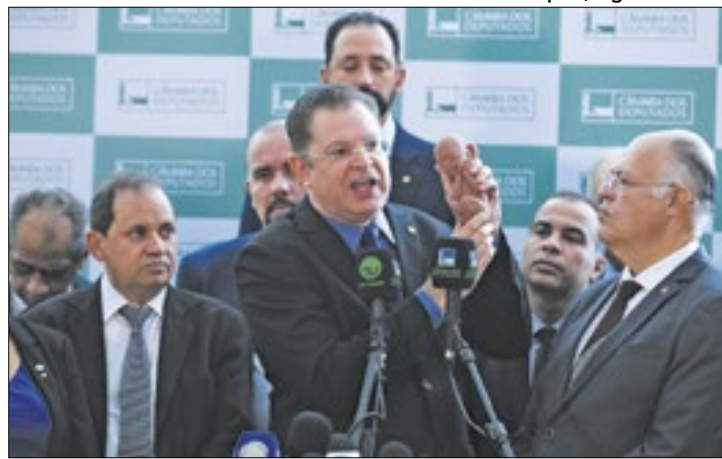
Sóstenes mostrou o boneco de um feto para sensibilizar

Correio da Manhã, após diversas críticas ao projeto, Sóstenes Cavalcante se propôs a acrescentar uma emenda ao PL que aumente a pena do crime de estupro para 25 a 30 anos. A medida foi anunciada porque o atual projeto determina uma penalidade de até 20 anos de cadeia para mulheres que realizarem estupro, enquanto o Código Penal determina uma pena de até 15 anos de prisão para o estuprador. Portanto, caso o atual texto fosse aprovado e a mulher fosse presa por praticar um aborto decorrente de um estupro, ela enfrentaria uma pena maior do que seu abusador.