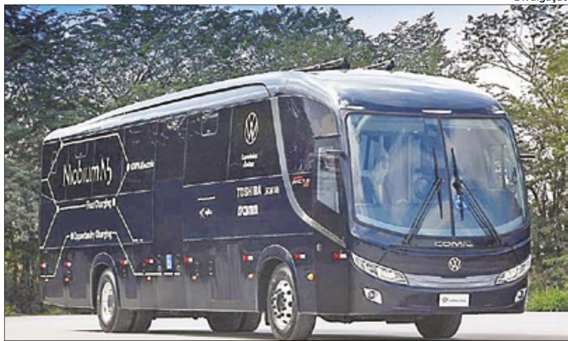
A expectativa é que o lançamento comercial ocorra ao longo de 2025

Segundo a VWCO, é possível recuperar a energia em 10 minutos quando o veículo está plugado em um pantógrafo (acoplagem no teto) de 300 kW. Essa solução possibi-