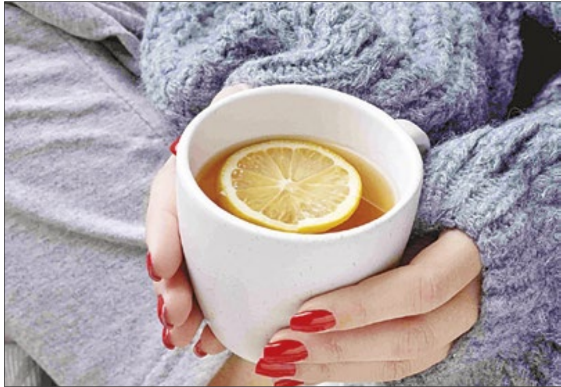
Bebidas quentes, como chás, são opções saudáveis para o frio

A compreensão do impacto do clima no apetite é importante para promover hábitos alimentares saudáveis durante esses períodos.