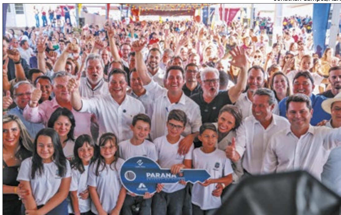
Casa própria e melhorias urbanas marcam evento com governador Ratinho Junior

Ratinho Junior destacou a importância do Casa Fácil Paraná para destravar projetos habitacionais no estado: "A maioria