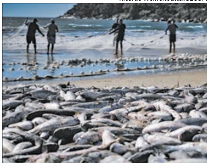
Pescadores artesanais superam capturas de 2023