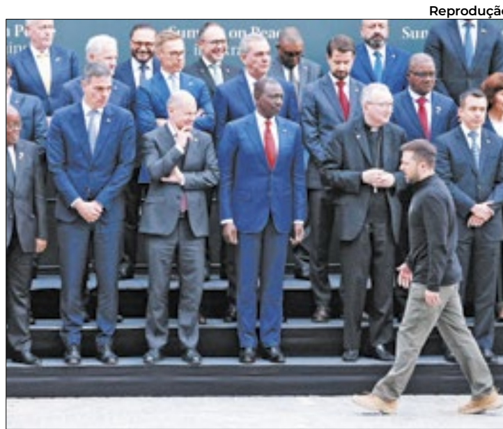
Conferência foi promovida e realizada na Suíça

O maior peso relativo na discussão foi o da Índia, vencida pelo presidente ucr-