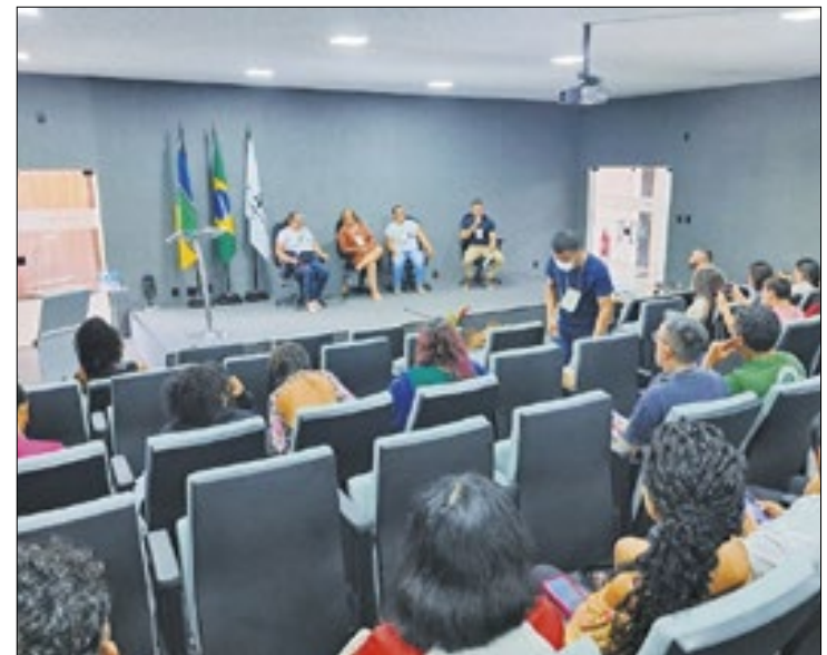
Evento também teve a participação da sociedade civil