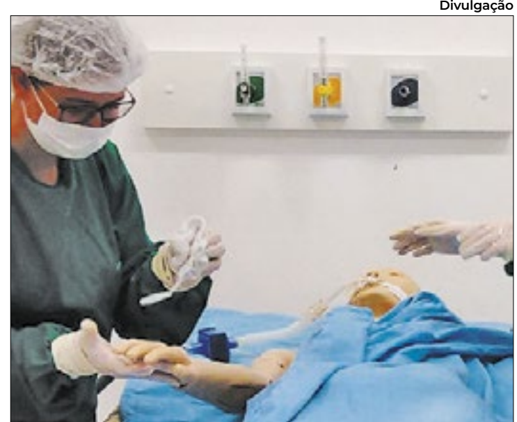
Ferramenta calcula o tempo de banho nos pacientes

Na rotina de muitas UTIs, a intervenção é distribuída entre os profissionais da equipe de enfermagem de forma