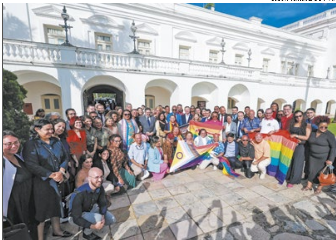
Empodera+ será voltado para a geração de emprego e renda para pessoas LGBTQIA+

“Esse evento coloca o Maranhão em parceria com as políticas de cidadania e de promoção de direitos humanos para as pessoas LGBTQIA+, em uma mesma sintonia. O estado do Maranhão não só adere hoje ao conjunto de políticas que estão sendo construídas pelo Governo Federal, mas o Maranhão faz mais do que isso, ele avança em uma política que tem contornos próprios, que vai olhar especificamente para a população LGBTQIA+ maranhense”, disse Silvio Almeida.