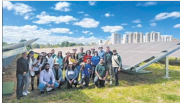
Usina pública, inaugurada este mês, é a primeira do DF