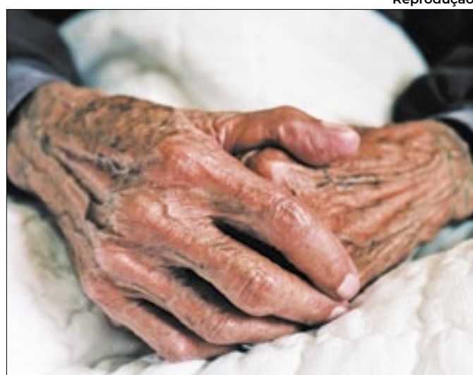
Procuradora analisa a condição de brasileiras