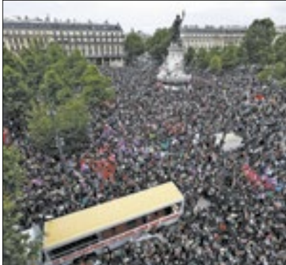
Multidão contra o extremismo

Milhares de pessoas protestaram contra o avanço da ultradireita na França no sábado, em Paris e em outras cidades. Os manifestantes proferiram críticas ao partido Reunião Nacional (RN) que, liderado