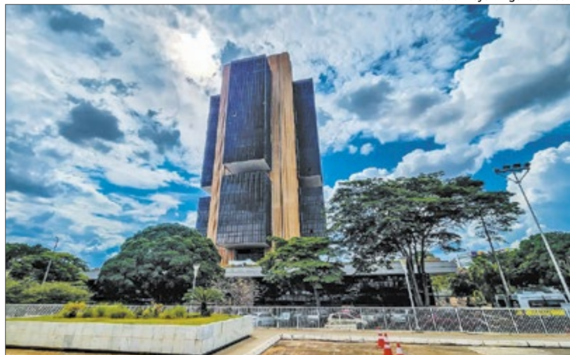
Rafa Neddermeyer - Agência Brasil

Do ponto de vista internacional, o banco de investimento Goldman Sachs comenta que, a despeito da 'leve melhoria' do cenário externo, no mês passa-