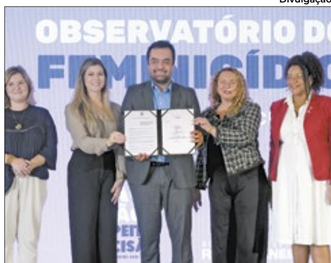
Observatório será um instrumento de monitoramento