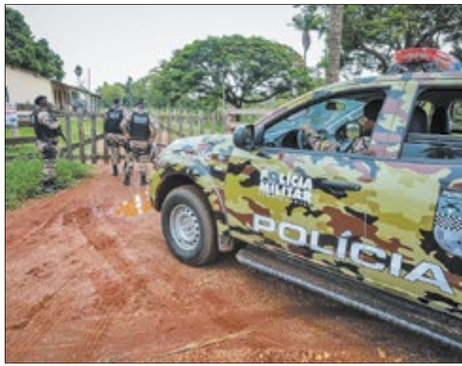
Presença contínua dos militares reduziram crimes