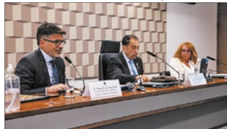
Tocantins tem políticas próprias e interesse na pauta

Vinicius Santa Rosa/Governo do Tocantins