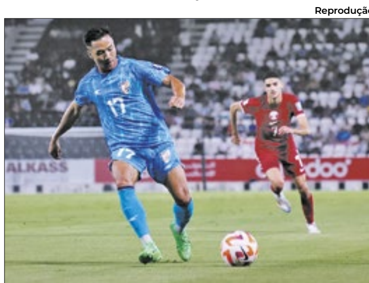
Após perder para o Catar pelas Eliminatórias Asiáticas, a Índia não tem mais como se classificar para a Copa do Mundo 2026

Outras 17 seleções já haviam sido eliminadas anteriormente - 5 da Ásia e duas da