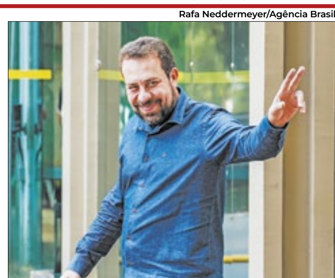
Candidato do Psol quer politizar a disputa