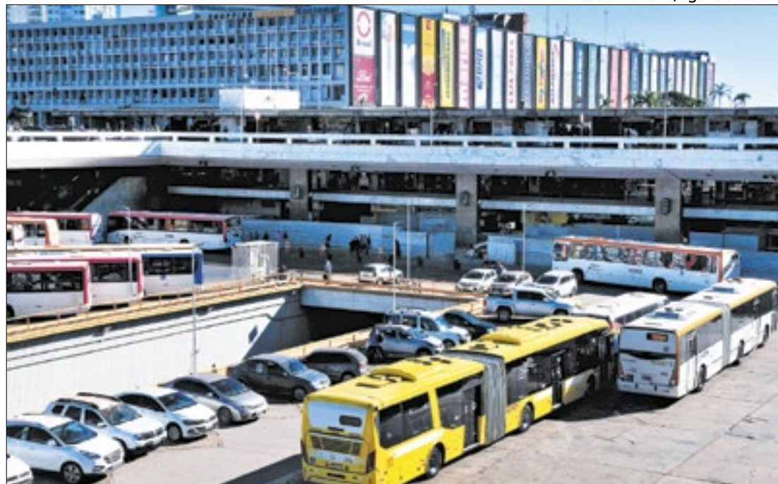
Ônibus deixarão de aceitar dinheiro em espécie no Distrito Federal