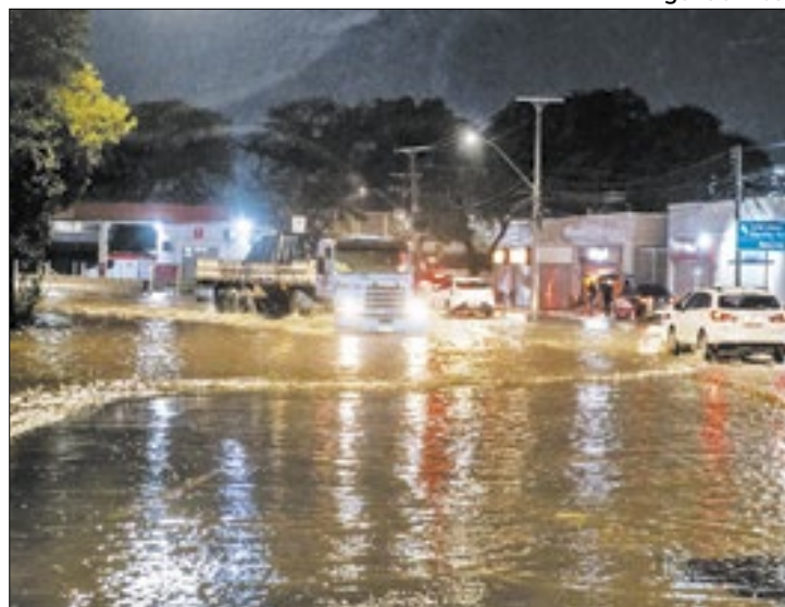
Prejuízos do Rio Grande do Sul chega aos R$ 3,32 bilhões

A Confederação Nacional do Comércio de Bens, Serviços e Turismo (CNC) estima perda diária de receitas na ordem de R$ 123 milhões, acumulando um prejuízo de R$ 3,32 bilhões no mês de maio com as enchentes no Rio Grande do Sul. As consequências afetam também a infraestrutura e o abastecimento dos estabelecimentos comerciais, com queda abrupta de 28% no fluxo de veículos de carga nas estradas do estado, segundo dados preliminares da Agência Nacional de Transportes Terrestres (ANTT).