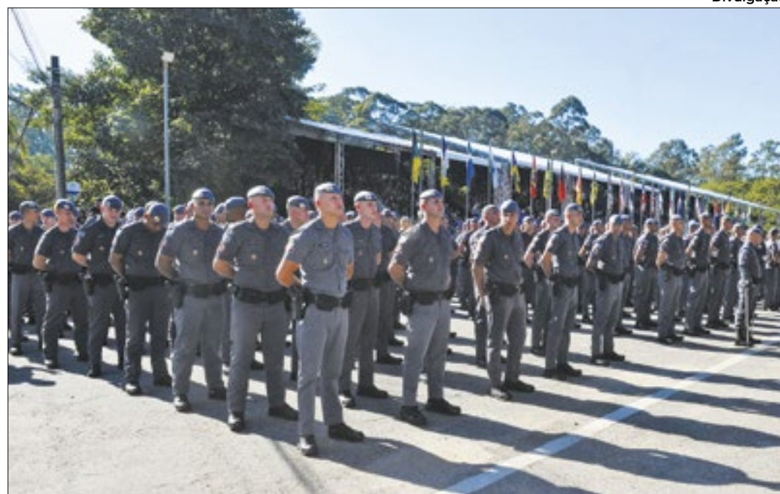
Governador participa de formatura de mais de 1,1 mil novos soldados da PM

Governador acompanha cerimônia na capital desde janeiro