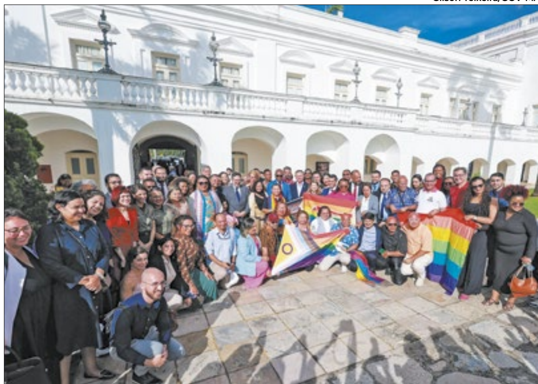
Empodera+ será voltado para a geração de emprego e renda para pessoas LGBTQIA+

“Esse evento coloca o Maranhão em parceria com as políticas de cidadania e de promoção de direitos humanos para as pessoas LGBTQIA+, em uma mesma sintonia. O estado do Maranhão não só adere hoje ao conjunto de políticas que estão sendo construídas pelo Governo Federal, mas o Maranhão faz mais do que isso, ele avança em uma política que tem contornos próprios, que vai olhar especificamente para a população LGBTQIA+ maranhense”, disse Silvio Almeida.