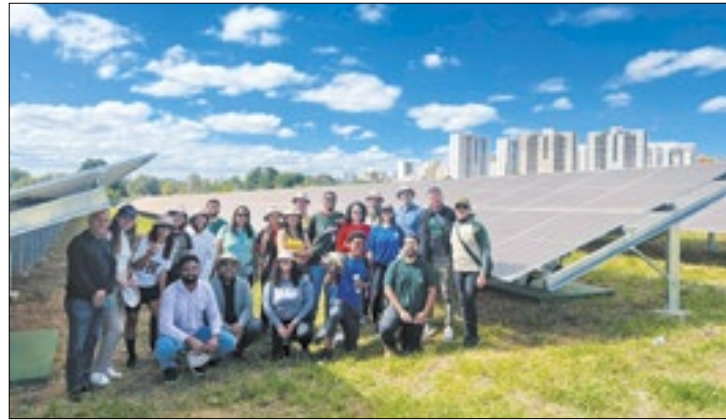
Usina pública, inaugurada este mês, é a primeira do DF