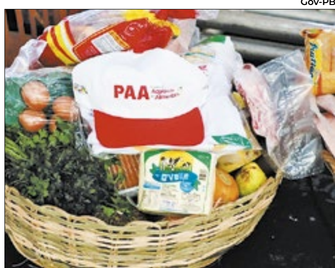
Medida vai destinar mais de R$ 11 milhões ao PAA