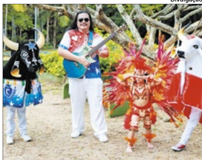
Crianças ao lado do músico Hamilton Azevedo