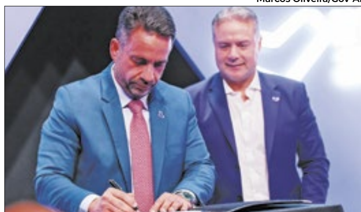
Estado atrai empresários com crescimento do PIB