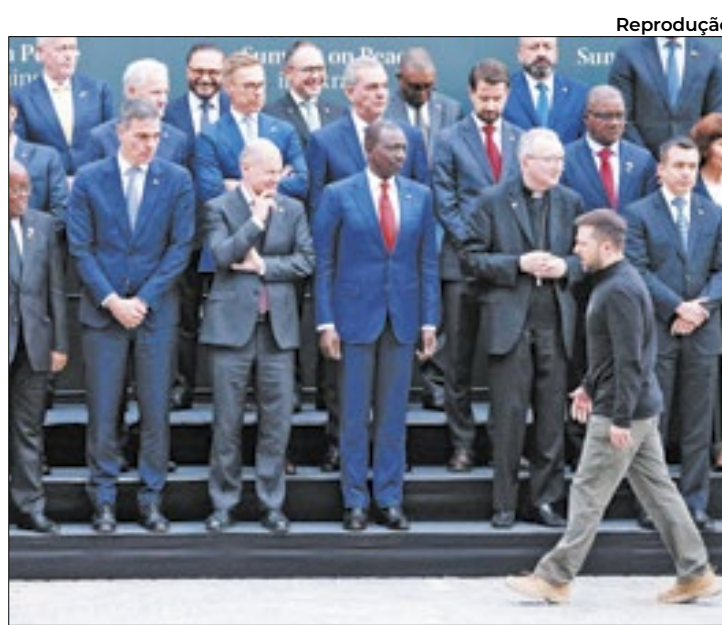
Conferência foi promovida e realizada na Suíça

O maior peso relativo na discussão foi o da Índia, vencida pelo presidente ucr-