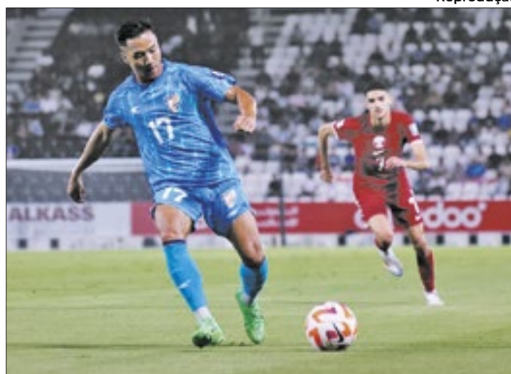
Após perder para o Catar pelas Eliminatórias Asiáticas, a Índia não tem mais como se classificar para a Copa do Mundo 2026

Outras 17 seleções já haviam sido eliminadas anteriormente - 5 da Ásia e duas da