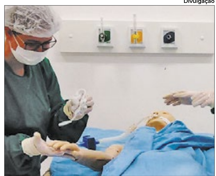
Ferramenta calcula o tempo de banho nos pacientes

Na rotina de muitas UTIs, a intervenção é distribuída entre os profissionais da equipe de enfermagem de forma