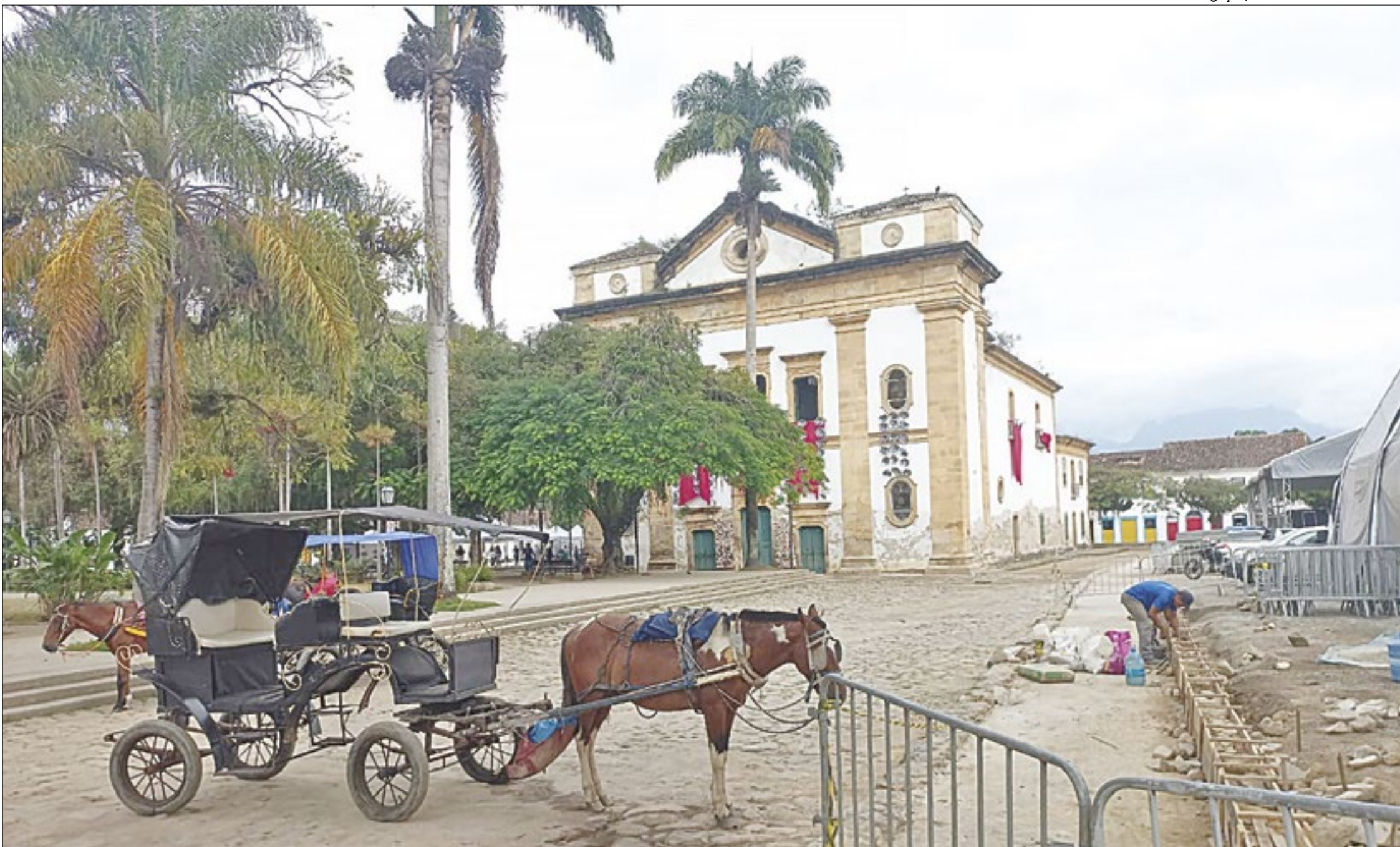
Rota-piloto de acessibilidade às ruas do município está sendo executado pela Prefeitura de Paraty com a supervisão do Instituto do Patrimônio Histórico e Artístico Nacional