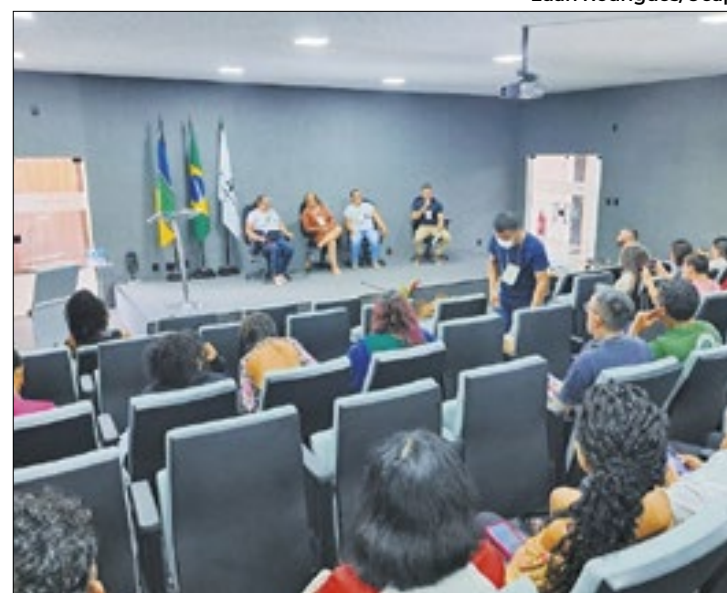
Evento também teve a participação da sociedade civil