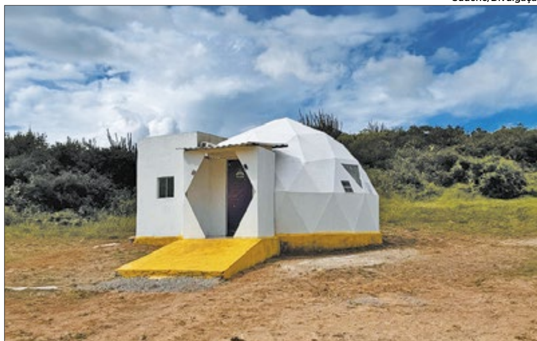
A iniciativa possibilita pesquisas sobre gestão de água e energia renovável

Projeto promove pesquisa espacial no sertão potiguar