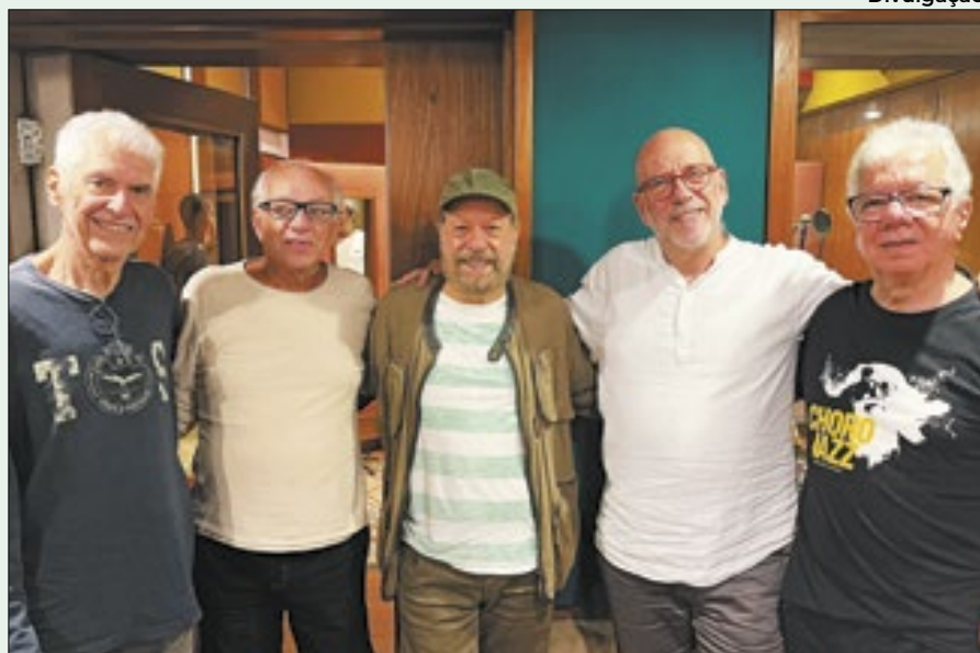
Miltinho, Dalmo, Malagutti e Aquiles com João Bosco na Biscoito Fino

MPB4 lança 'Prêt-à-porter de Tafetá', segundo single do álbum de seis décadas de estrada, com a participação de João Bosco