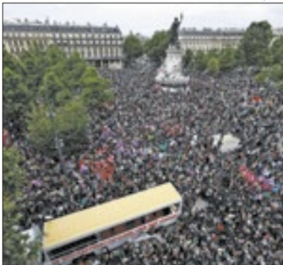
Multidão contra o extremismo

Milhares de pessoas protestaram contra o avanço da ultradireita na França no sábado, em Paris e em outras cidades. Os manifestantes proferiram críticas ao partido Reunião Nacional (RN) que, liderado