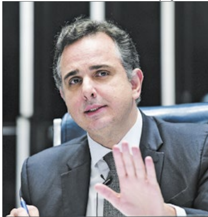
Pacheco considerou MP inconstitucional e a devolveu