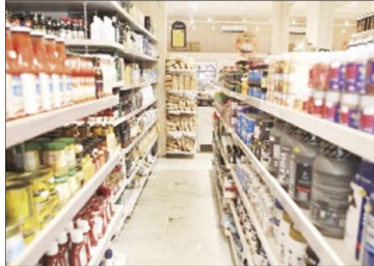
Porto Alegre apresenta maior índice de inflação do país

A inflação na região metropolitana de Porto Alegre atingiu 0,87% em maio, quase o dobro do índice nacional de 0,46%, segundo dados do Índice Nacional de Preços ao Consumidor Amplo (IPCA) divulgados pelo Instituto Brasileiro de Geografia e Estatística (IBGE). A alta reflete os impactos da calamidade climática que afeta o Rio Grande do Sul, deixando grande parte do estado alagada durante semanas.