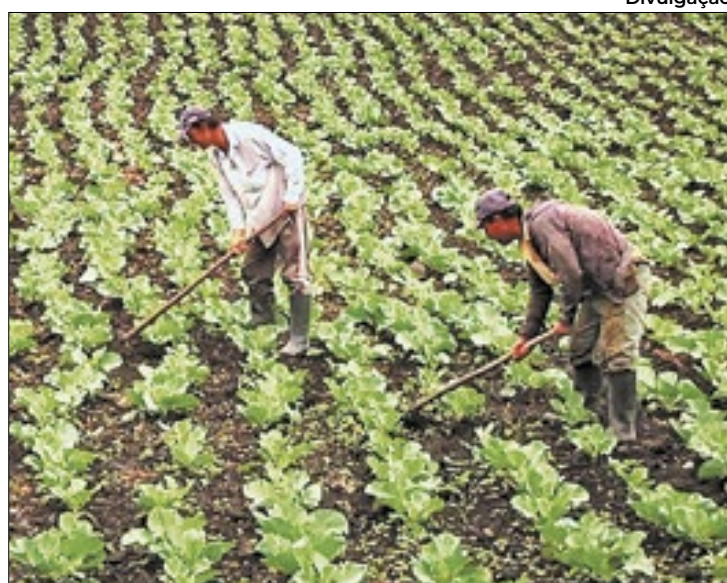
Perdas bilionárias para o Agro pesaram muito na decisão