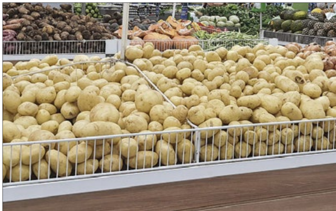
Batata inglesa foi a 'grande vilã' da alta do indicador nacional de inflação em maio

Entre os setores, o grupo alimentos e bebidas foi o que mais contribuiu com o indicador inflacionário (0,13 ponto percentual), com elevação de 0,62% em maio, em decorrência da pressão exercida pelo avanço de 6,33% dos tubérculos, raízes e