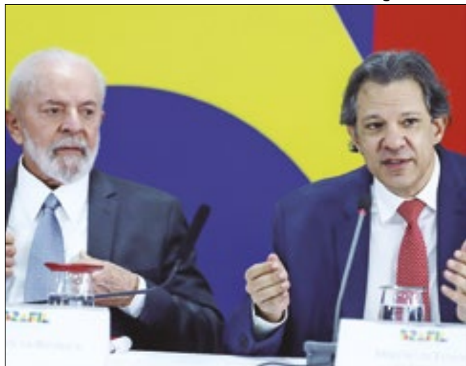
Lula não leu a MP que Haddad lhe deu para assinar?