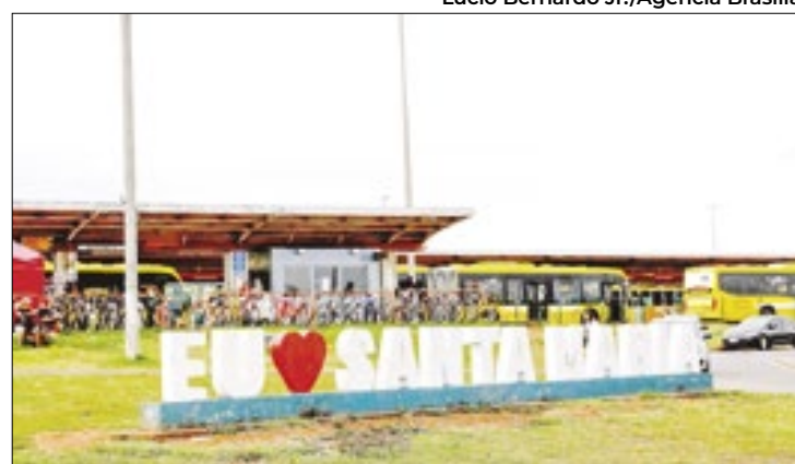
Imóveis estão sendo ofertados pelo valor de R$ 160.712,38