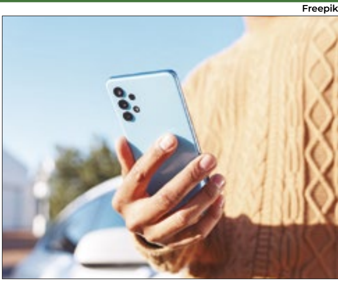
Google usará tecnologia primeiro no Brasil