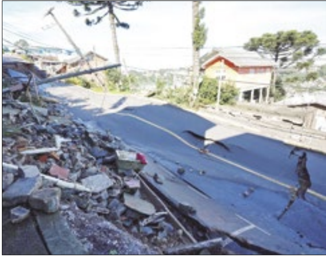
Dois corpos foram encontrados em Teutônia e Agudo