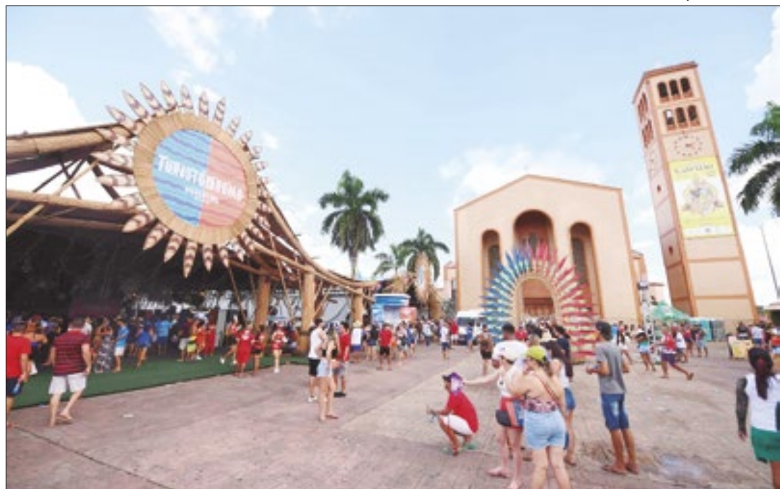
Governo do Amazonas investiu na ampliação do Turistódromo e da praça gastronômica

O Turistódromo, espaço voltado para os turistas, terá a área ampliada em 600 metros quadrados. Localizado na Avenida Amazonas, ao lado da Catedral