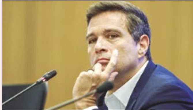
Jantar empoderou Roberto Campos Neto