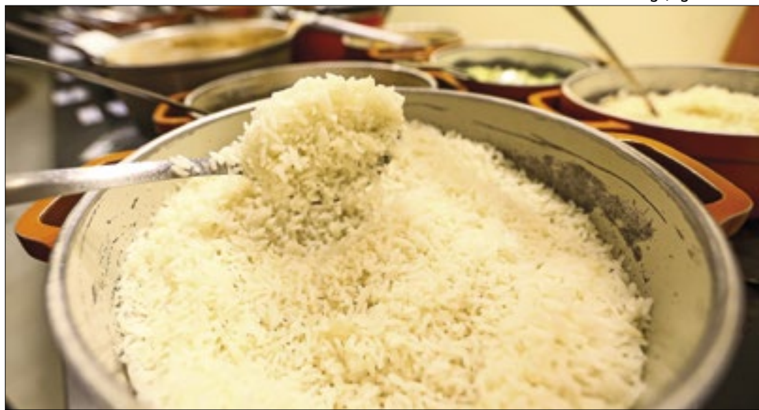
Importação visava evitar aumento do preço do arroz

O leilão arrematou 263,7 mil toneladas de arroz importado, com o objetivo de evitar alta dos preços após a tragédia que assola o Rio Grande Sul, que é o principal produtor do grão no Brasil