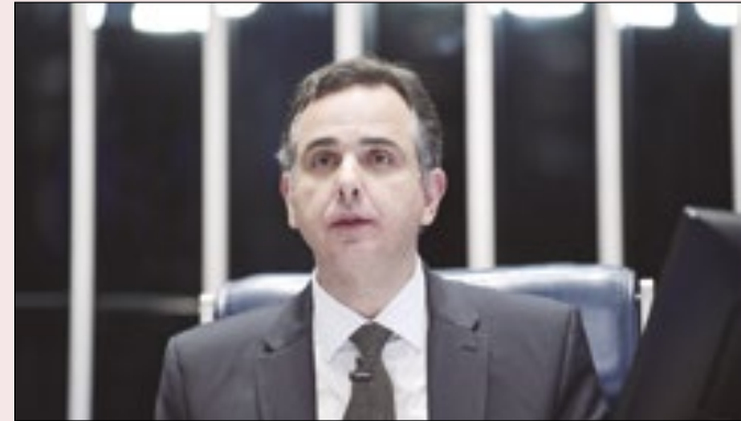
Pacheco anunciou que não aceitará limitação