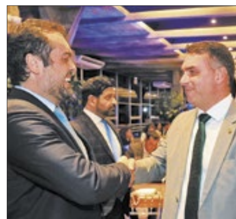
Momento de descontração, durante cumprimento entre o governador Cláudio Castro (e) e o senador Flávio Bolsonaro (d)