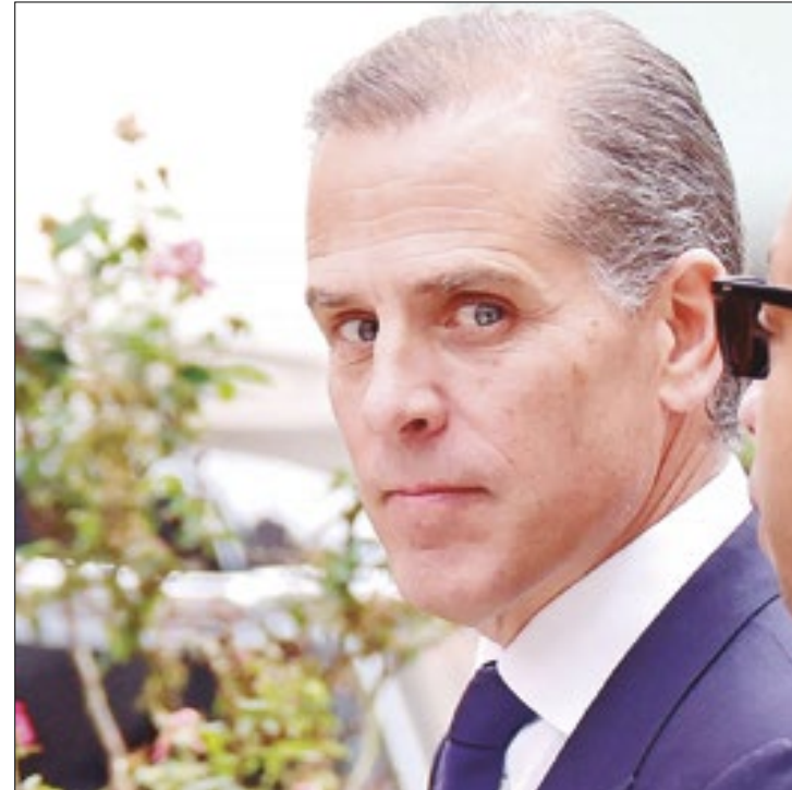
Caso dificulta plano democrata de manter foco em Trump

Júri decidiu pela condenação, mas sentença ainda não foi definida. O veredito do colegiado composto por 12 membros foi