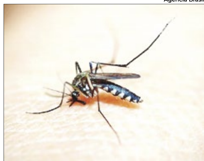
Doença matou 178 pessoas no estado