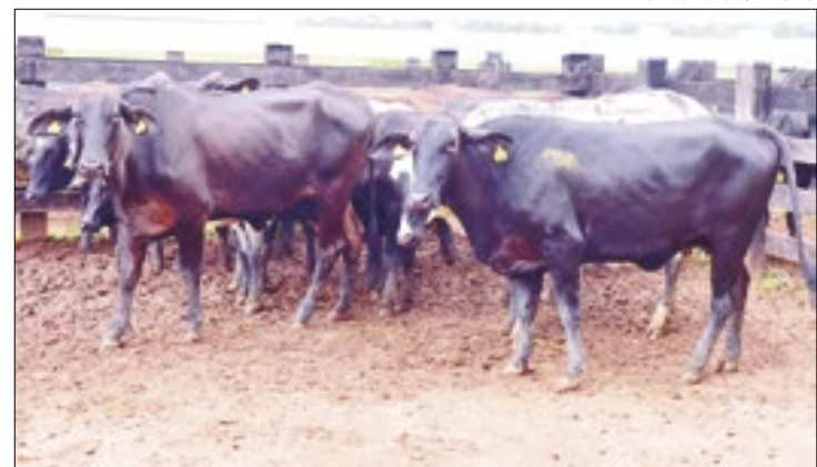
Ao todo, 90 novilhas foram entregues para 18 produtores